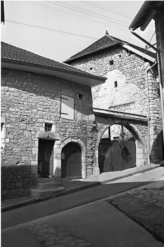
Vue d'ensemble depuis la rue de Jaubourg. 25, Lods