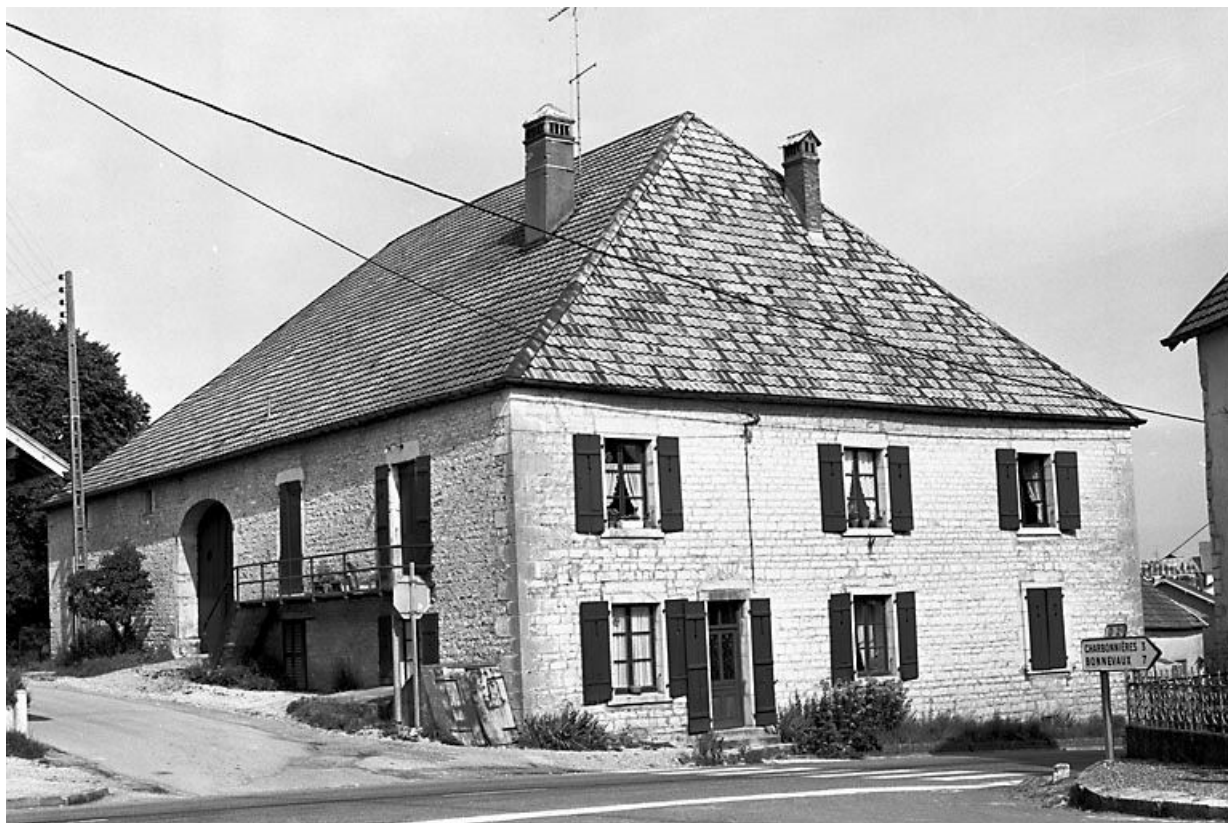
Façade antérieure et face latérale gauche.