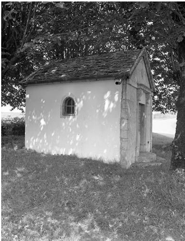
Façade antérieure et face latérale gauche.

25, Guyans-Durnes rue des Vignes, lieudit : sur le Moutier