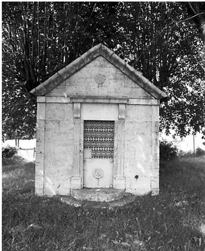
Façade antérieure. 25, Guyans-Durnes