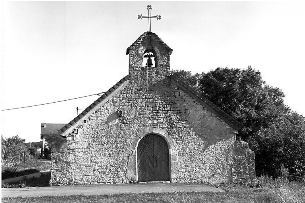
Façade antérieure. 25, Échevannes