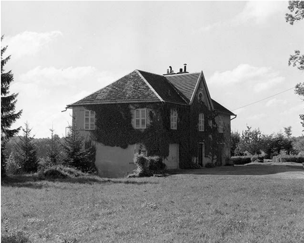
Vue générale de la maison construite sur l'emplacement du château. 25, Durnes rue du Château