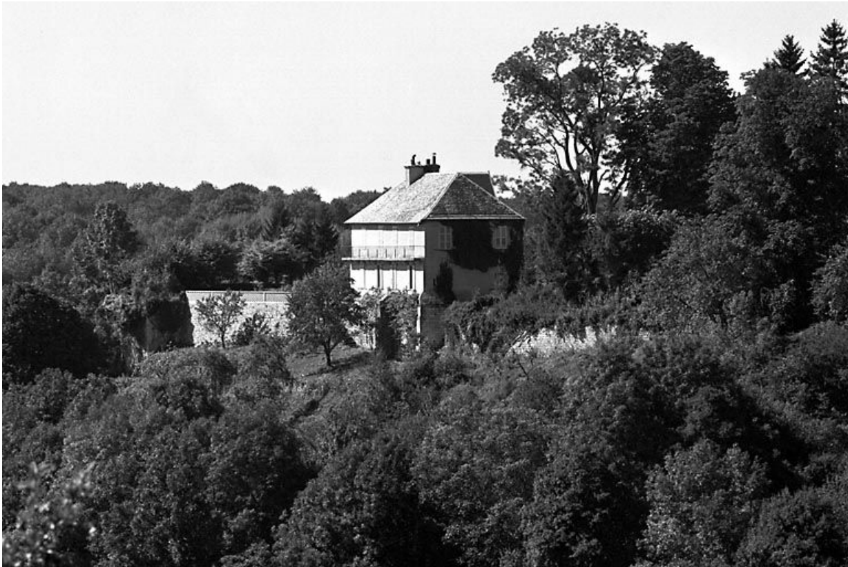
Vue générale du site.