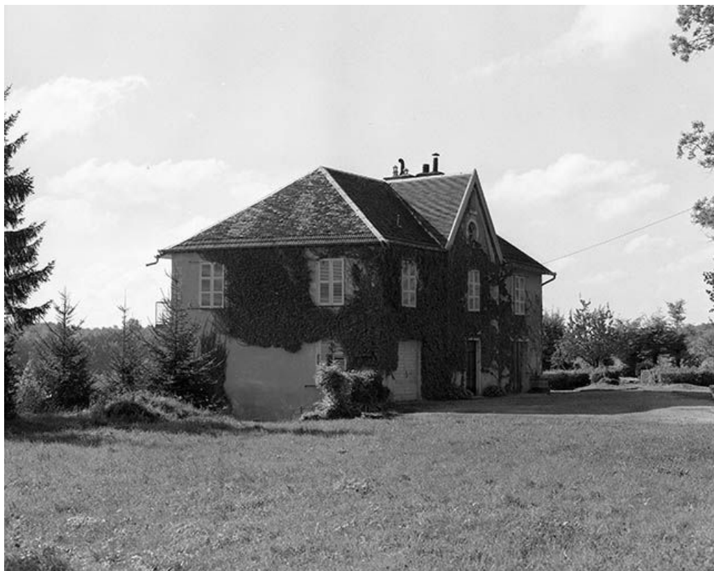
Vue générale de la maison construite sur l'emplacement du château. 25, Durnes rue du Château