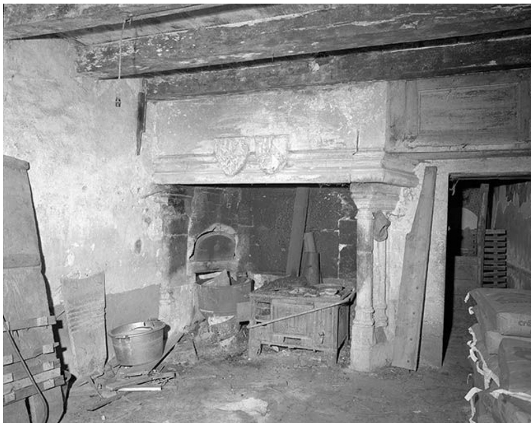
Les communs : cheminée de l'ancien logis du gardien figurant les armes de la famille de Vienne-Grandson. 25, Durnes rue du Château