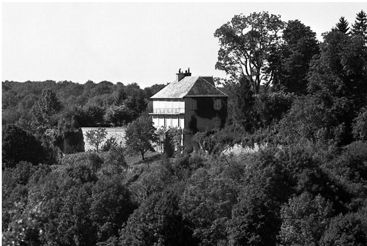
Vue générale du site.