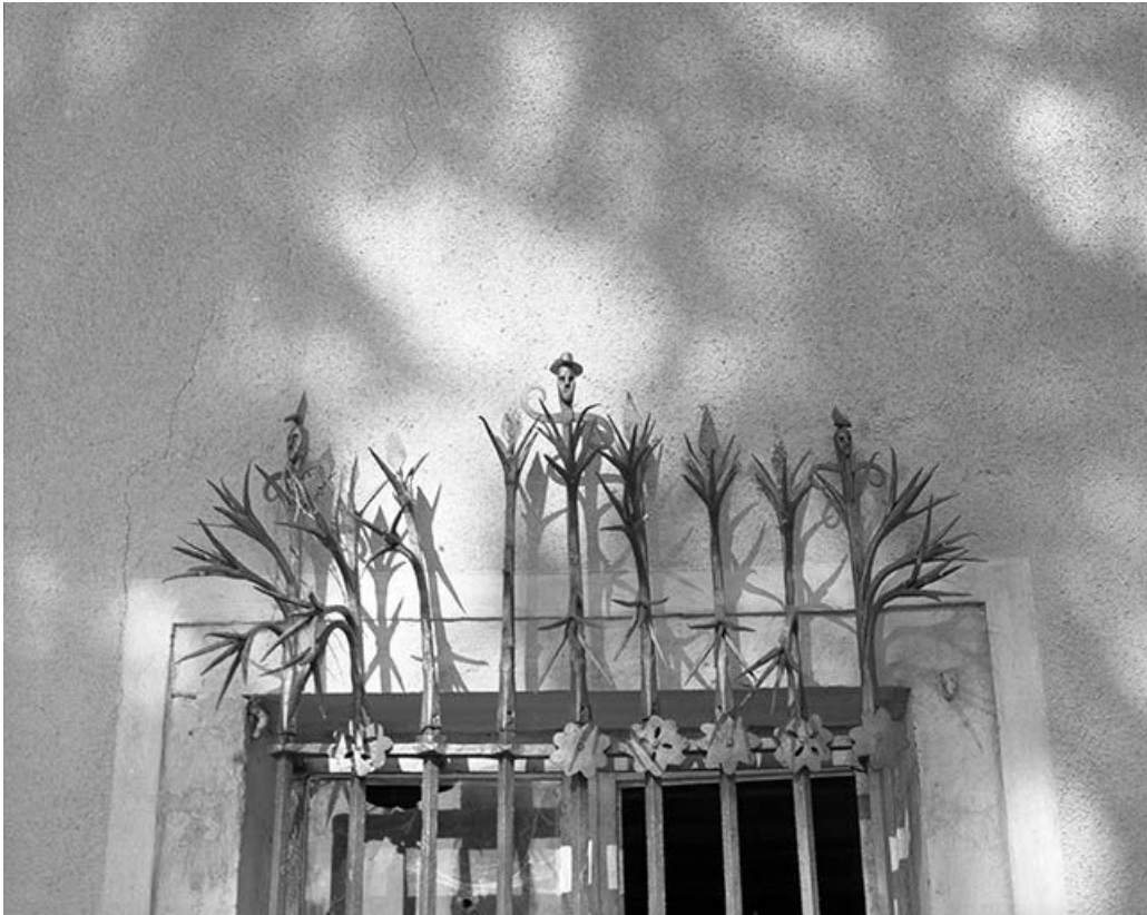
Détail de la grille d'une baie du rez-de-chaussée des communs.