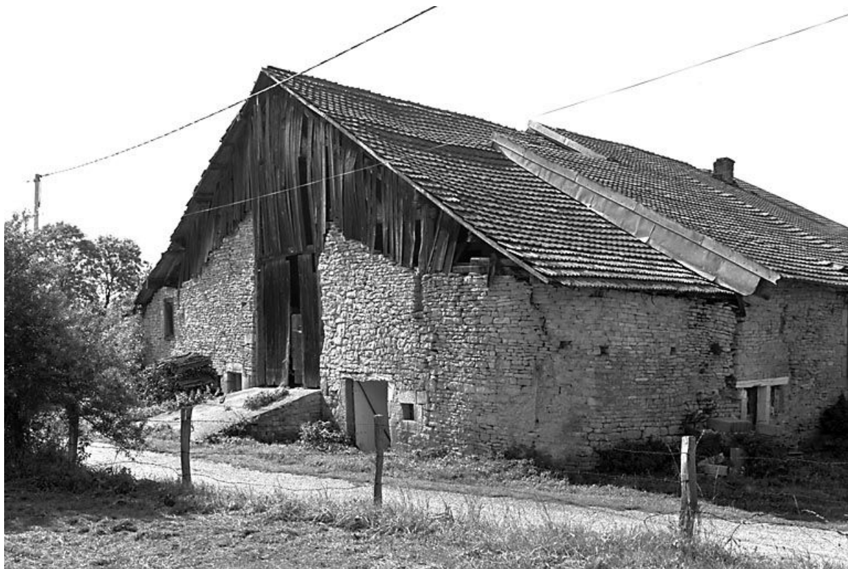
Vue générale depuis la rue. 25, Chassagne-Saint-Denis