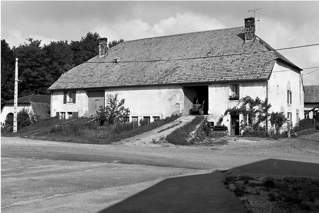
Façade antérieure et face latérale droite.