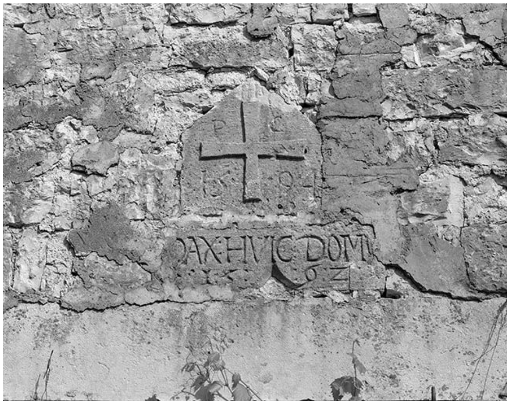
L'inscription, la croix en demi-relief et les dates 1562, 1594 sur la façade côté jardin. 25, Chantrains rue de l' Eglise