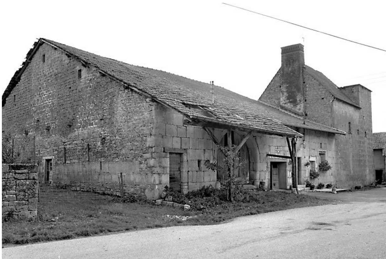
Vue générale depuis la rue. 25, Chantrains