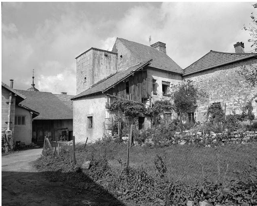
Vue générale depuis le jardin.