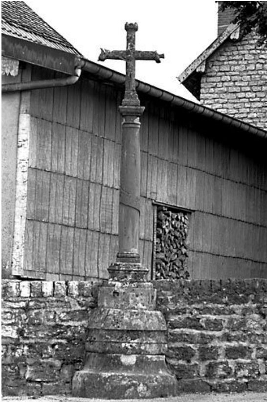
Vue générale. 25, Chantrains