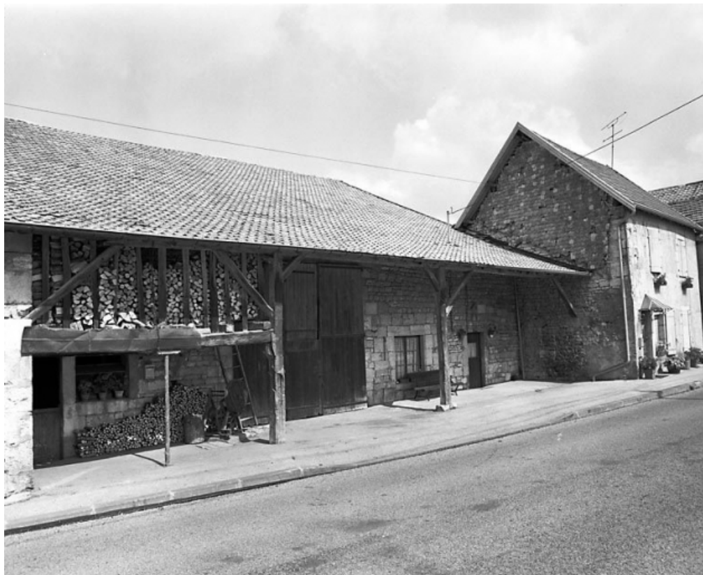
Façade antérieure de trois quarts gauche. 25, Chantrans route de Salins