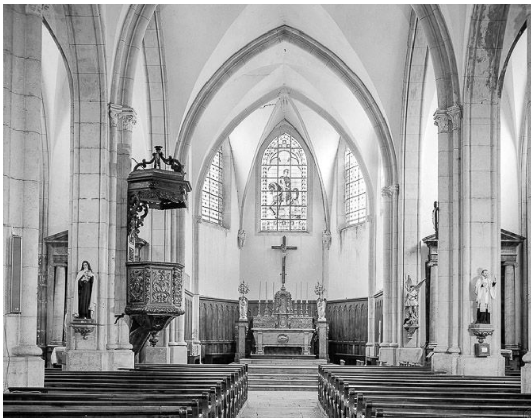
Intérieur : chœur vu depuis la nef.

25, Amathay-Vésigneux rue de l' Eglise, lieudit : Vésigneux