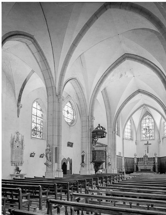
Intérieur : nef et choeur de trois quarts gauche.

25, Amathay-Vésigneux rue de l' Eglise, lieudit : Vésigneux