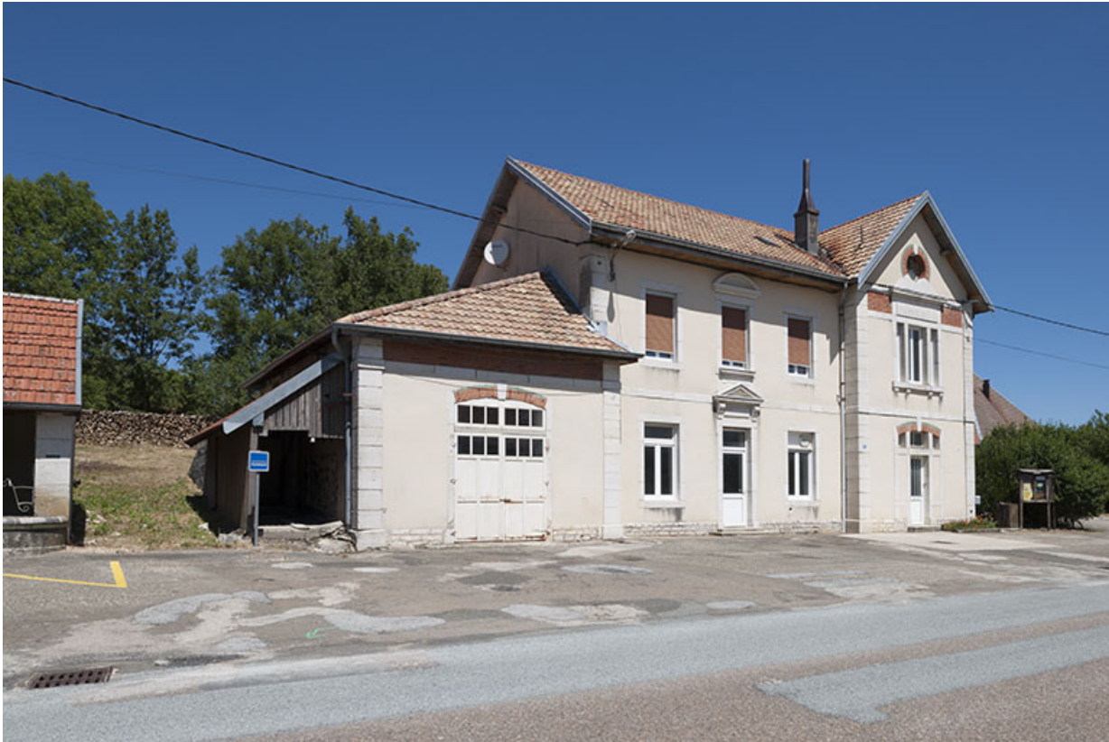
Vue de trois quarts droite.