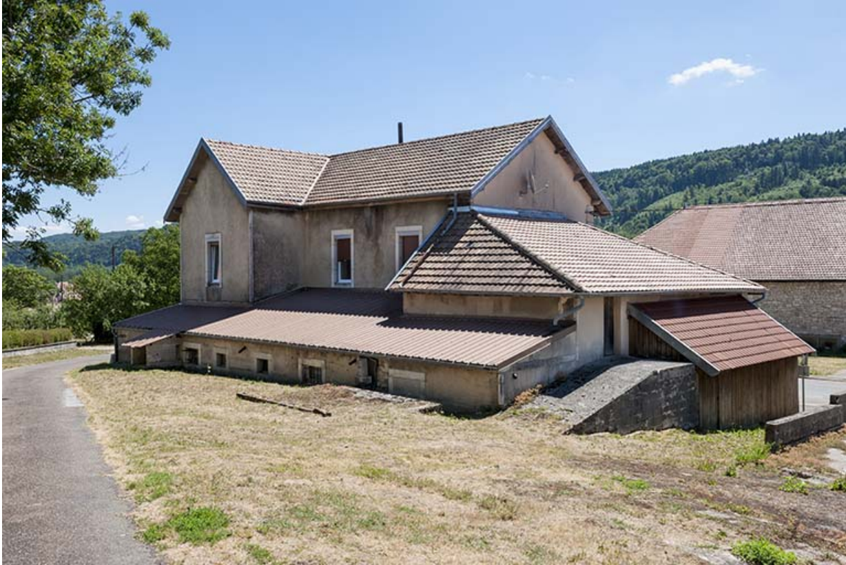
Vue de trois quarts arrière.