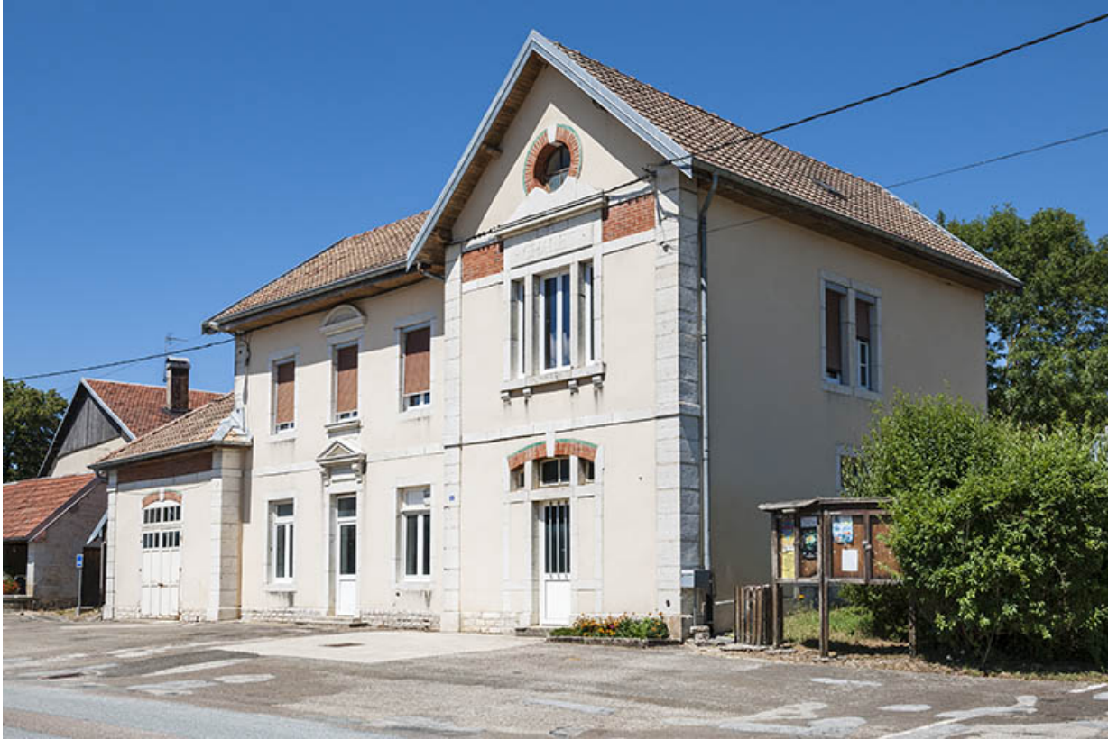
Vue de trois quarts droite.