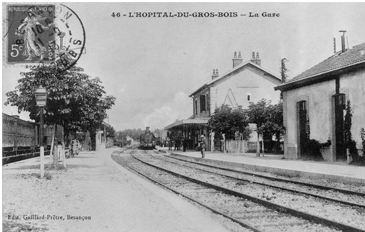
L'Hôpital-du-Grosbois - La Gare, 1913.