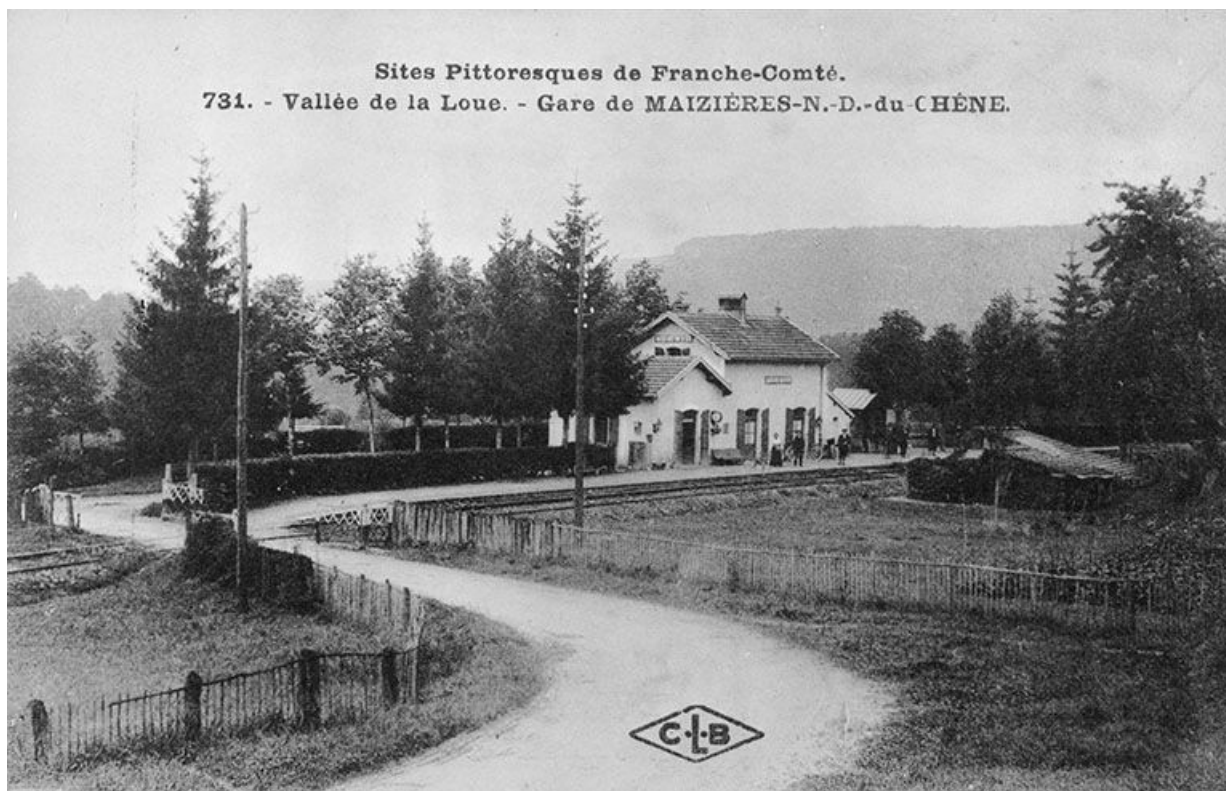
Vallée de la Loue.- Gare de Maizières-N.-D.-du-Chêne, limite 19e siècle 20e siècle. 25, Ornans