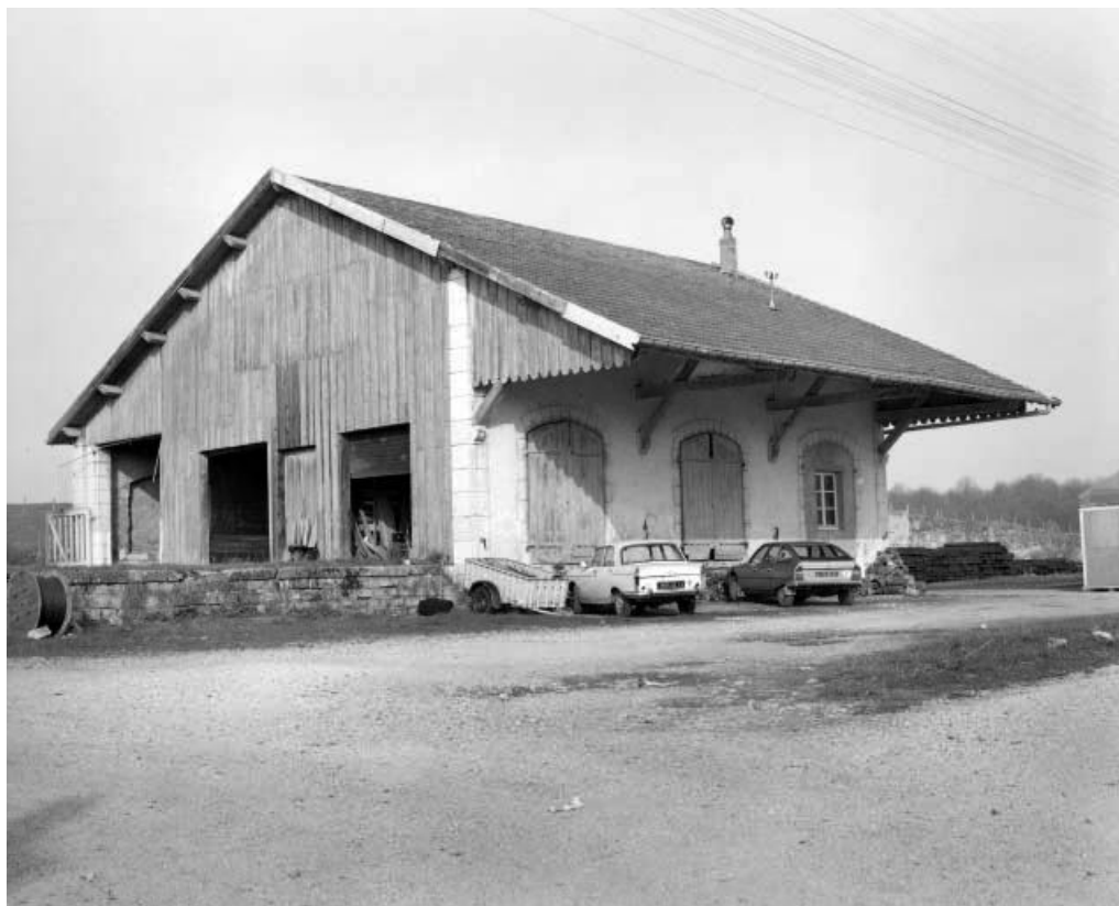
L'Hôpital-du-Grosbois : la gare de marchandises.