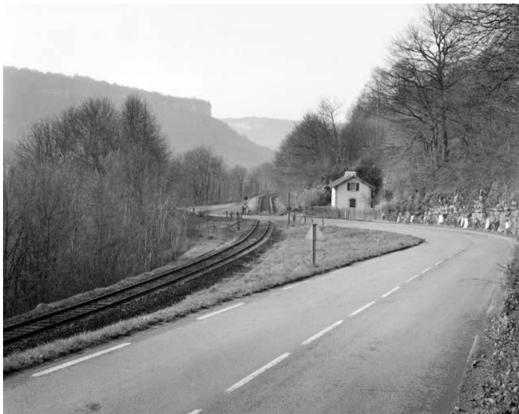
Maison de garde-barrière en bordure de la RD 67, au niveau du Puit Noir, sur la commune de Scey-Maisières. 25, Ornans