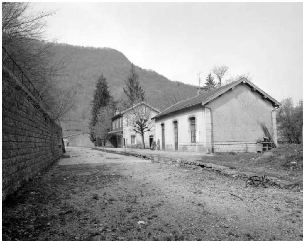
Lods, vue générale des bâtiments de la gare depuis la voie ferrée. 25, Ornans