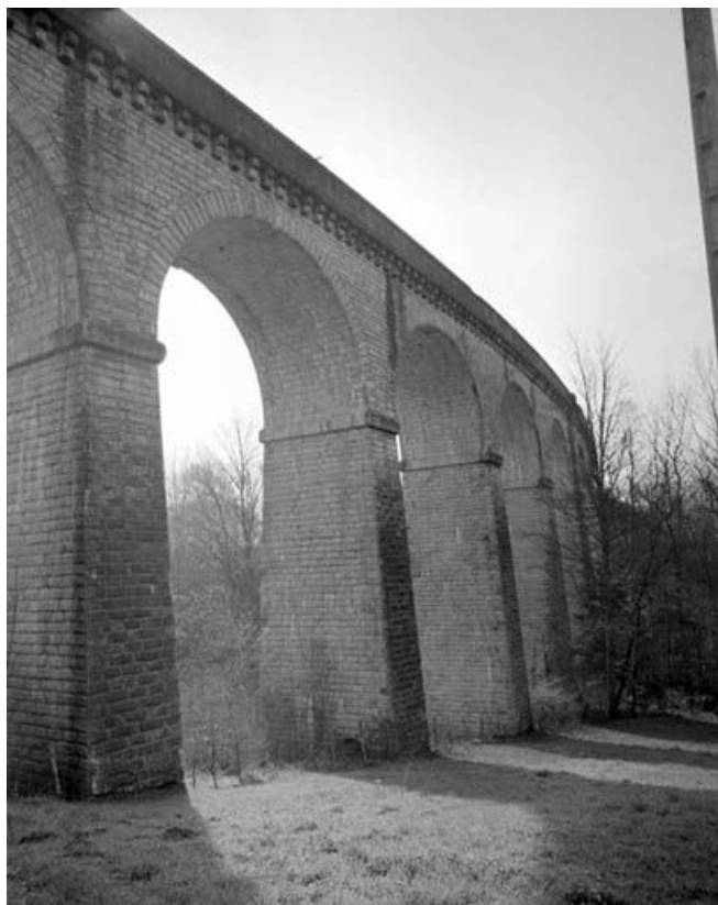
Les piliers du viaduc sur la commune de Scey-Maisières. 25, Ornans