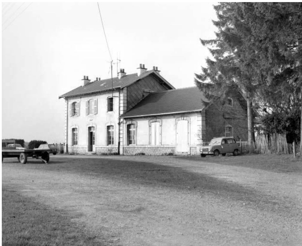
L'Hôpital-du-Grosbois : façade antérieure de la gare de voyageurs. 25, Ornans