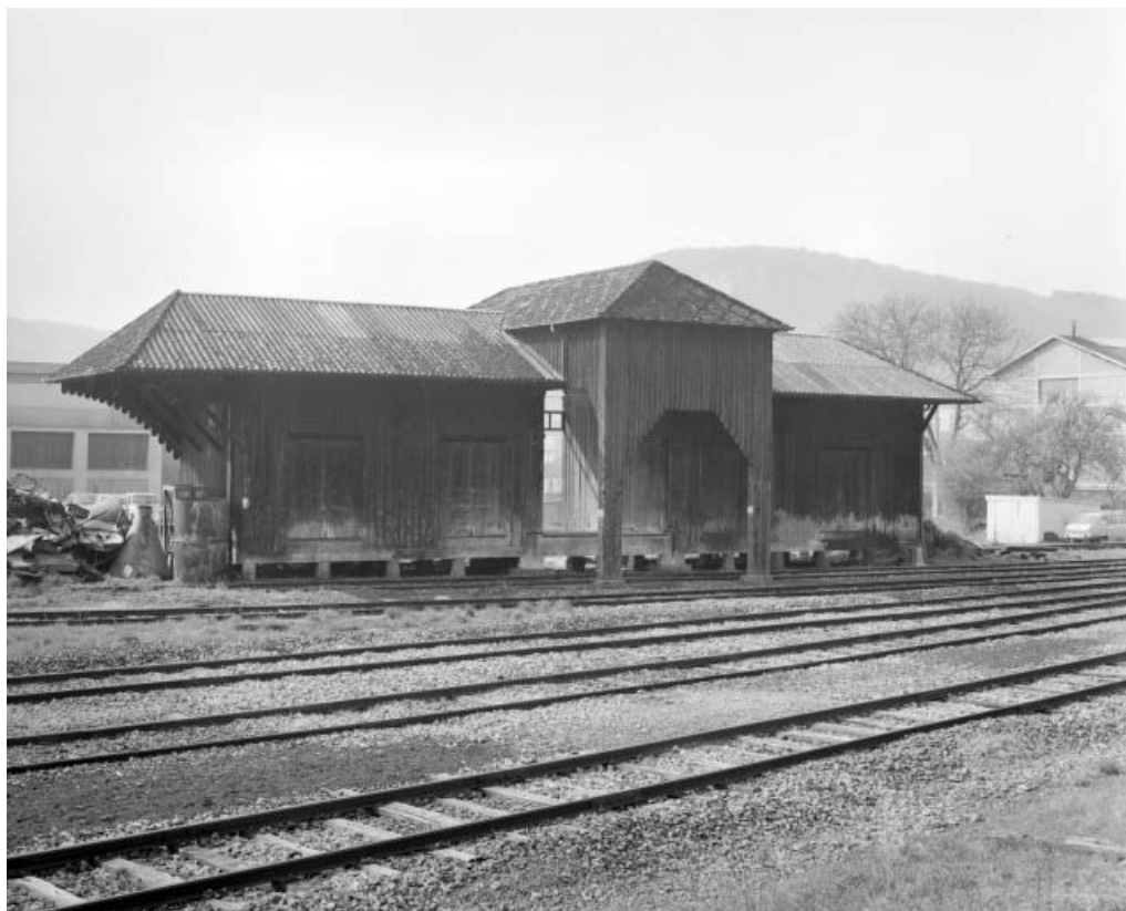
Ornans, façade postérieure de de la gare de marchandises. 25, Ornans