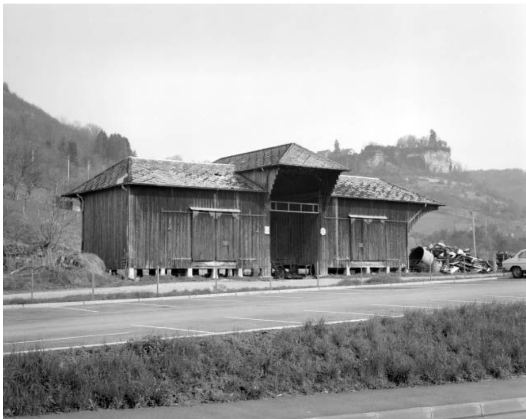
Ornans, façade côté quai de la gare de marchandises. 25, Ornans