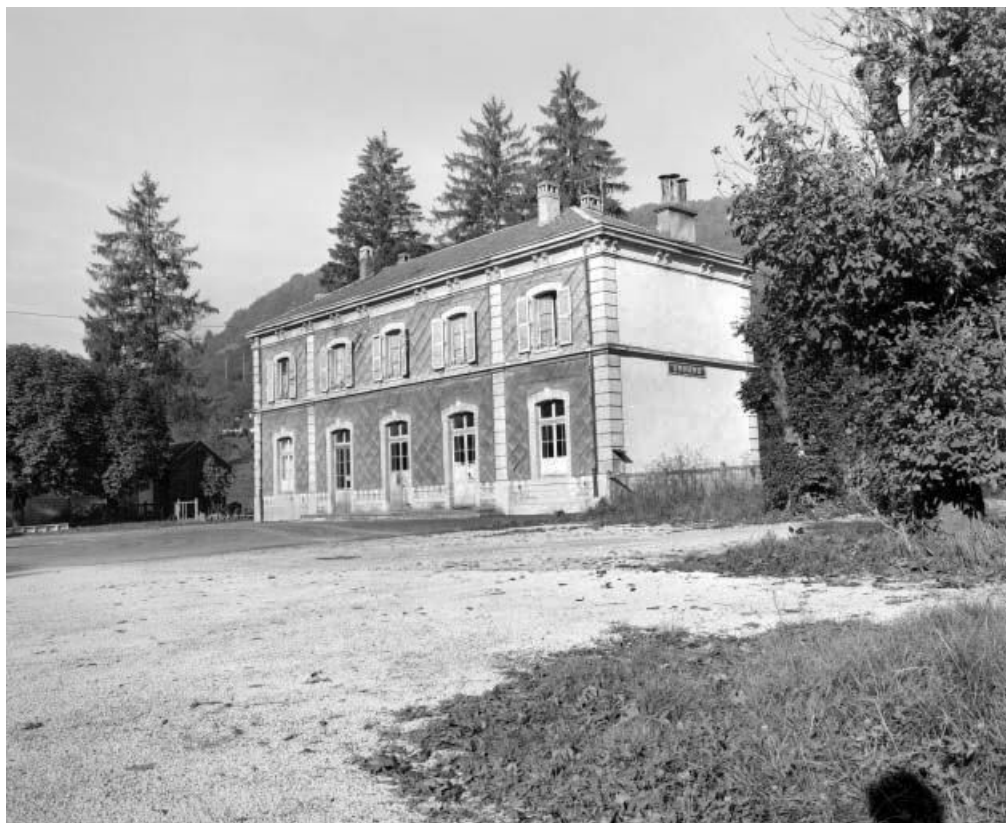
Ornans, façade antérieure de la gare de voyageurs. 25, Ornans