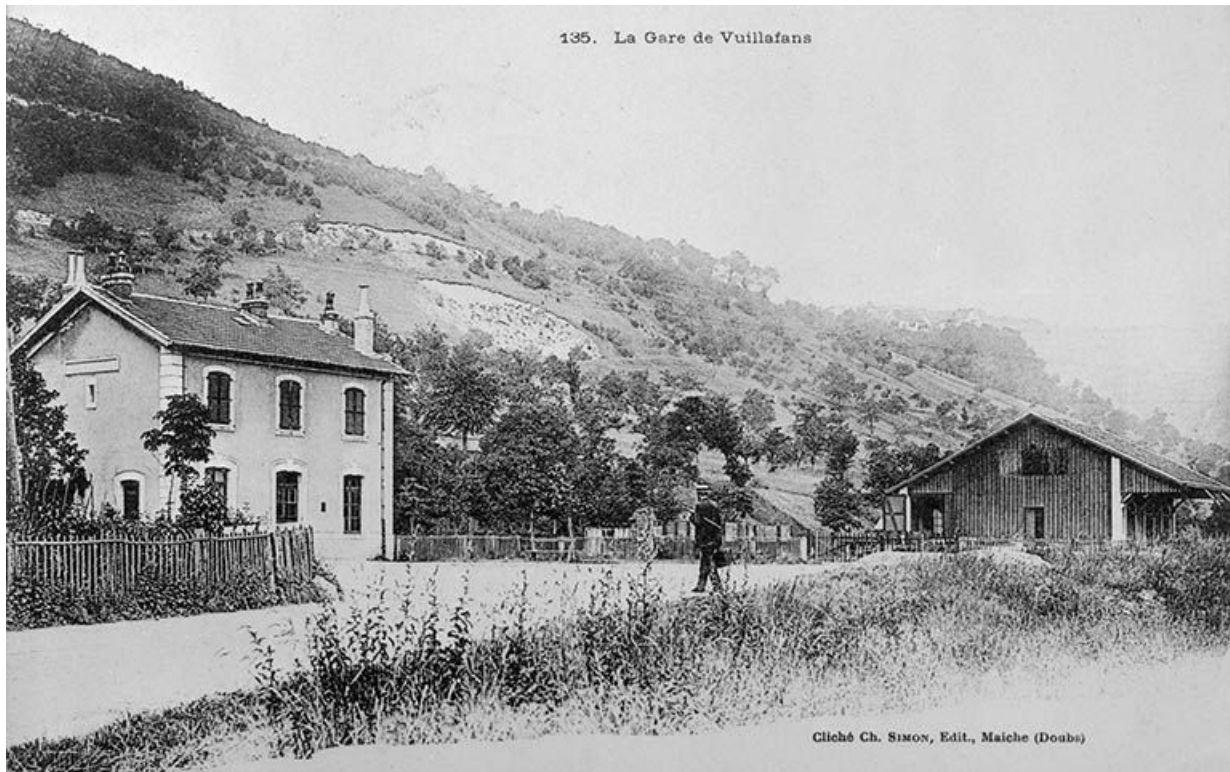
La Gare de Vuillafans, 1905.