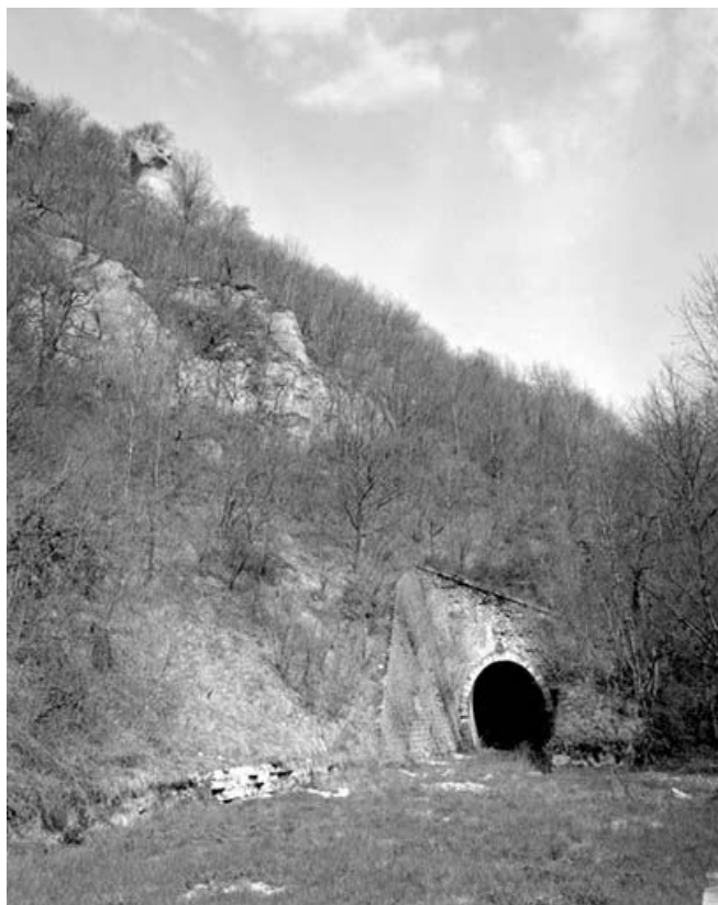
Bonnevaux-le-Prieuré : le tunnel.