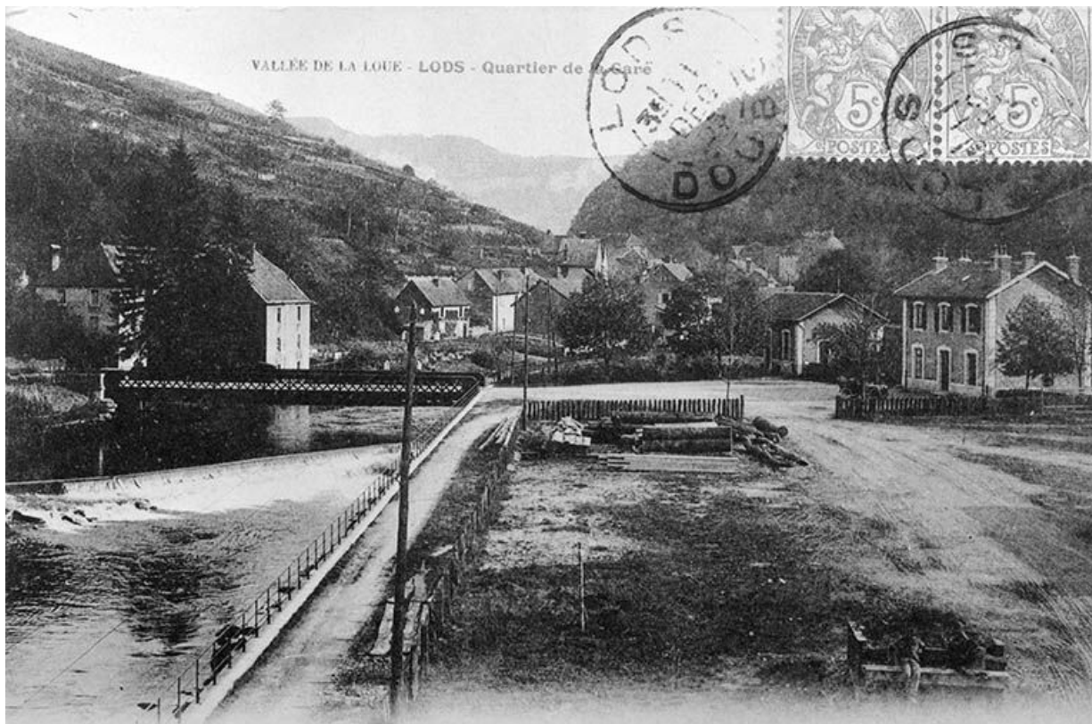
Vallée de la Loue - Lods - Quartier de la Gare, 1905.