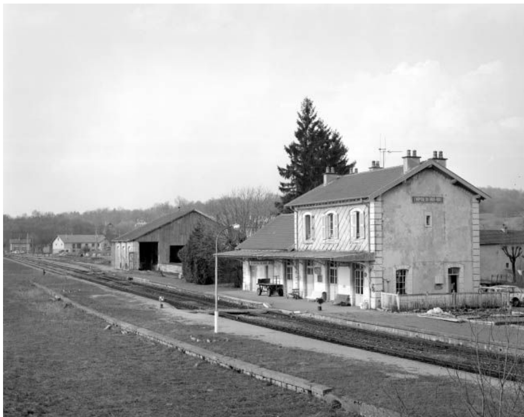
L'Hôpital-du-Grosbois : la gare de voyageurs depuis la voie ferrée. 25, Ornans