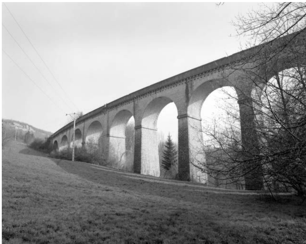
Vue générale du viaduc sur la commune de Scey-Maisières. 25, Ornans