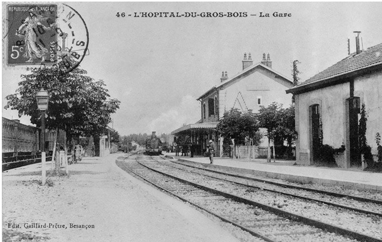
L'Hôpital-du-Grosbois - La Gare, 1913.