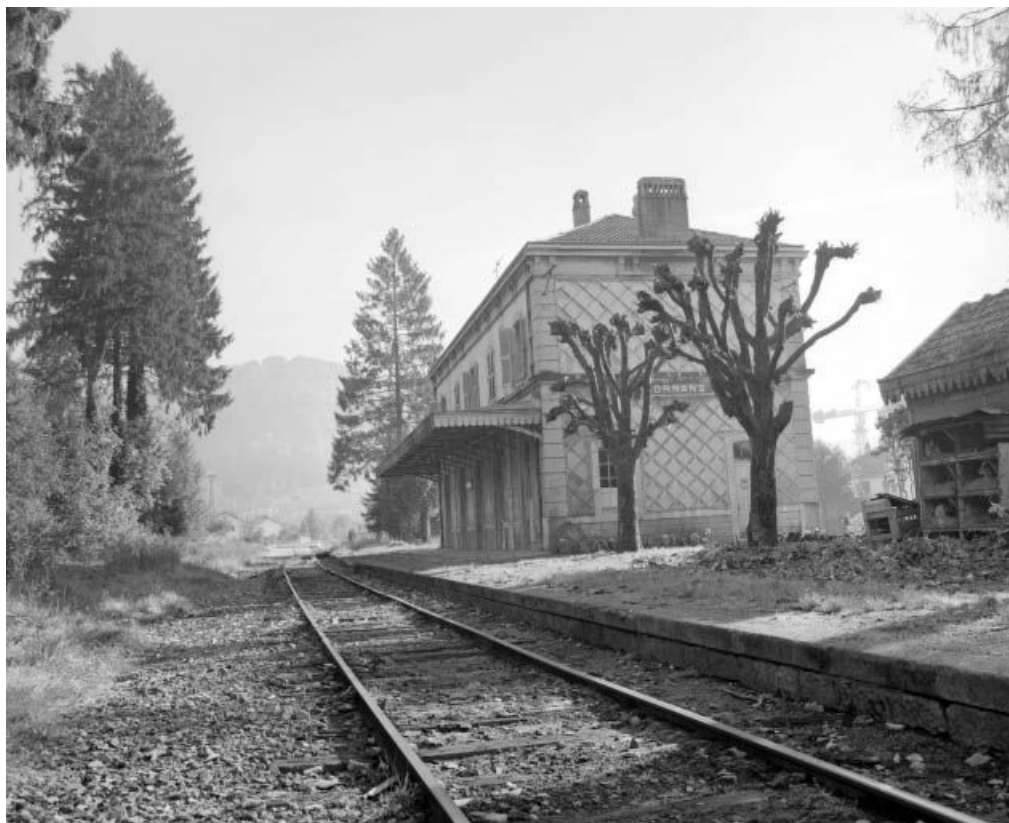
Ornans, vue générale de la gare de voyageurs depuis la voie ferrée. 25, Ornans