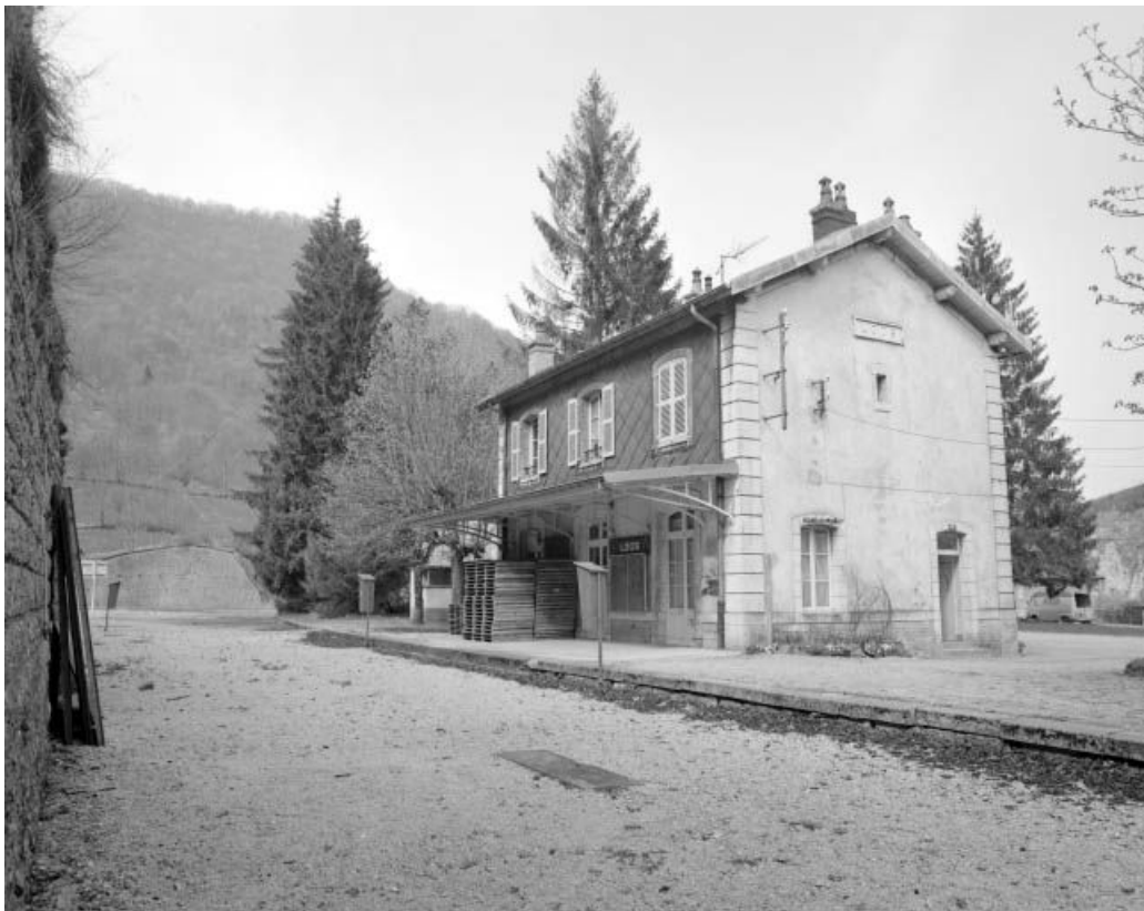
Lods, la gare de voyageurs depuis la voie ferrée. 25, Ornans