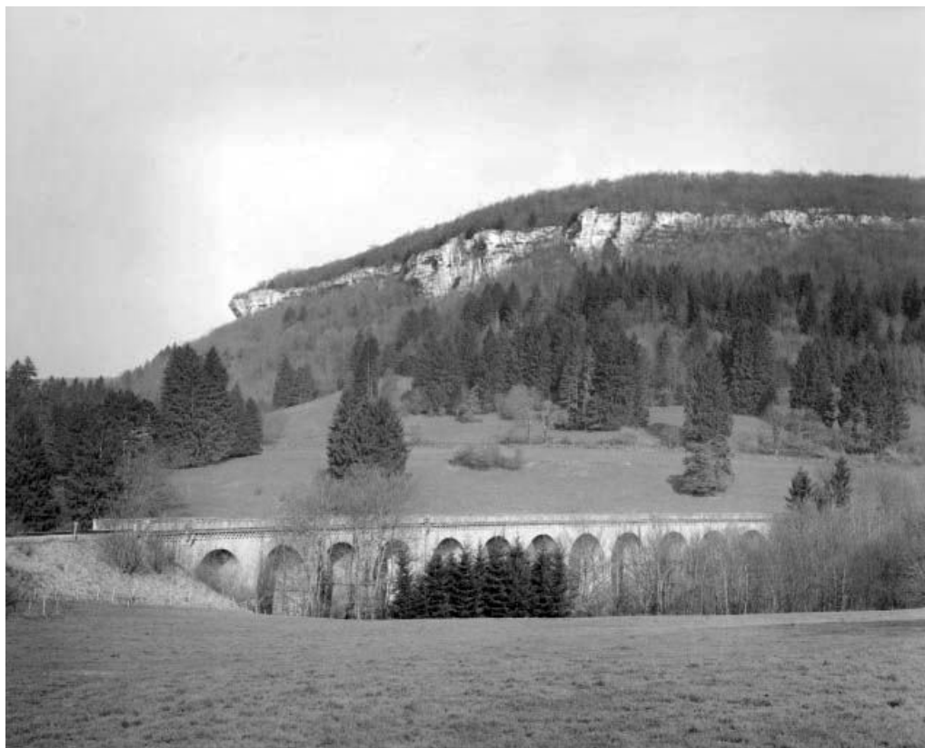
Vue générale du viaduc sur la commune de Scey-Maisières. 25, Ornans