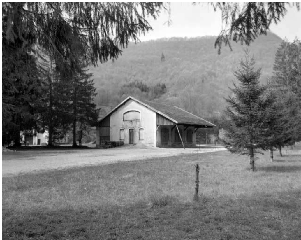
Lods, façade postérieure et façade latérale droite de la gare de marchandises. 25, Ornans