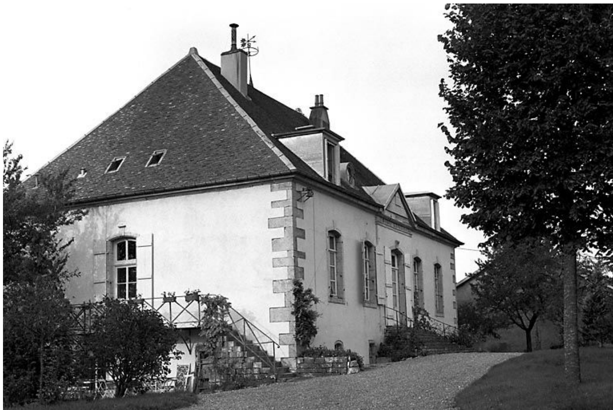
Façade antérieure et face latérale gauche.