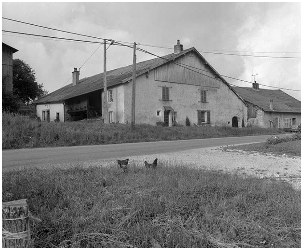
Façade antérieure et face latérale gauche.