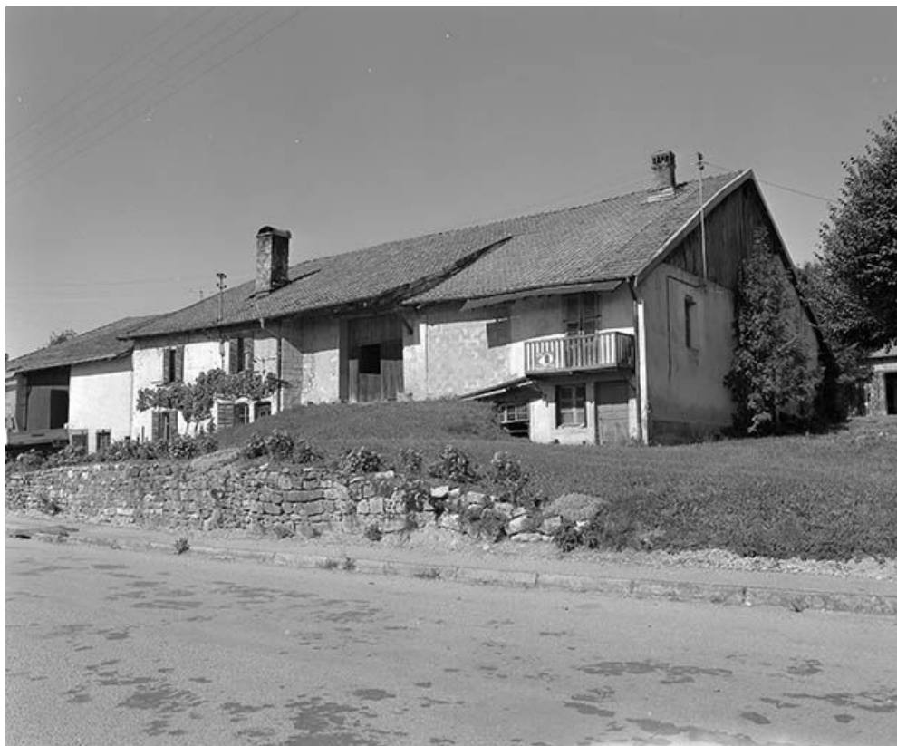
Façade antérieure et face latérale droite.