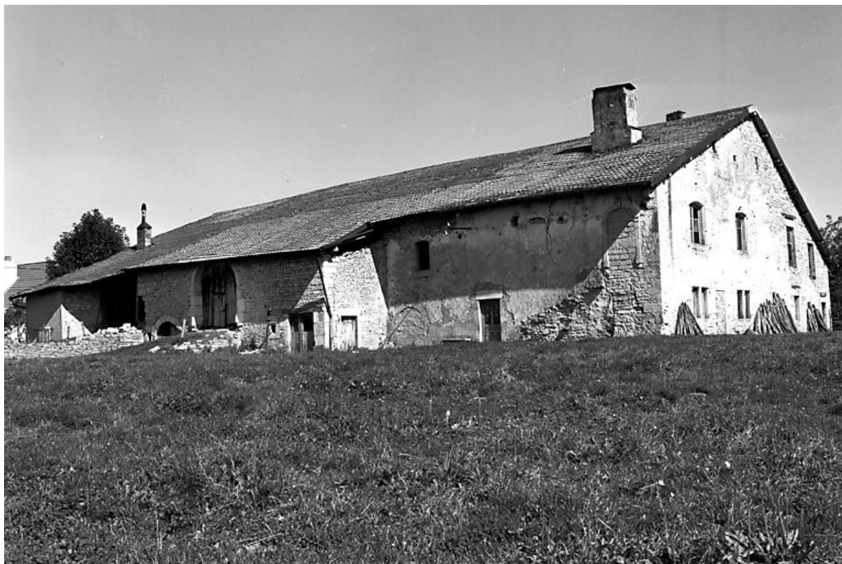
Façade antérieure et face latérale gauche.