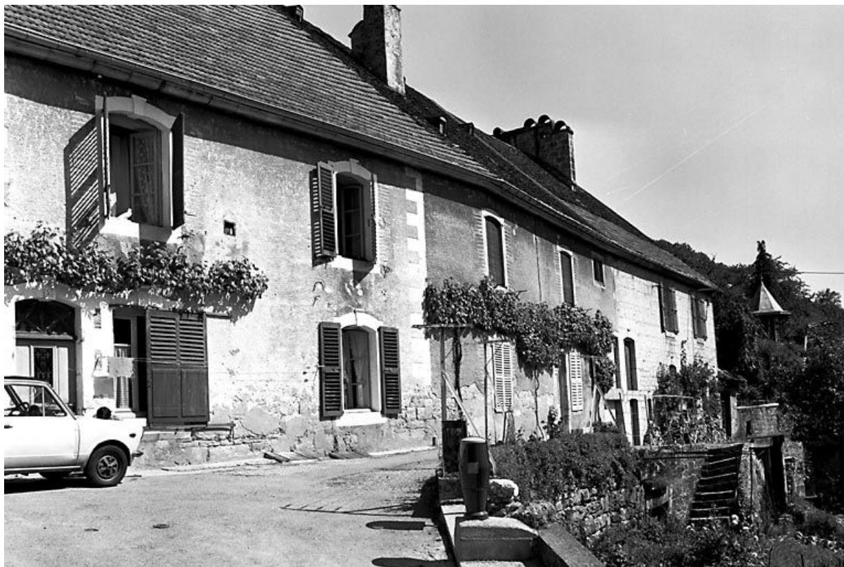
Façade antérieure. 25, Lods