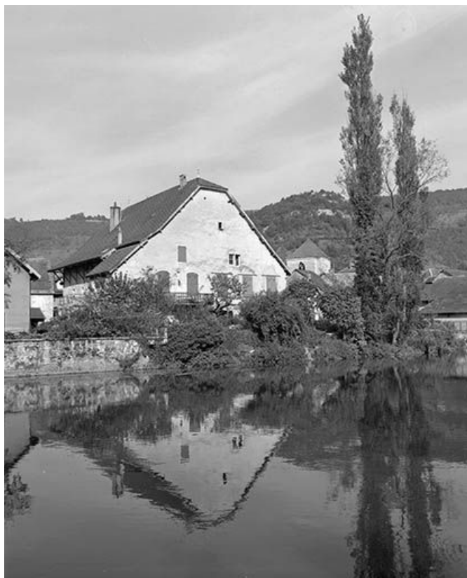
Vue générale depuis la rive gauche de la Loue.