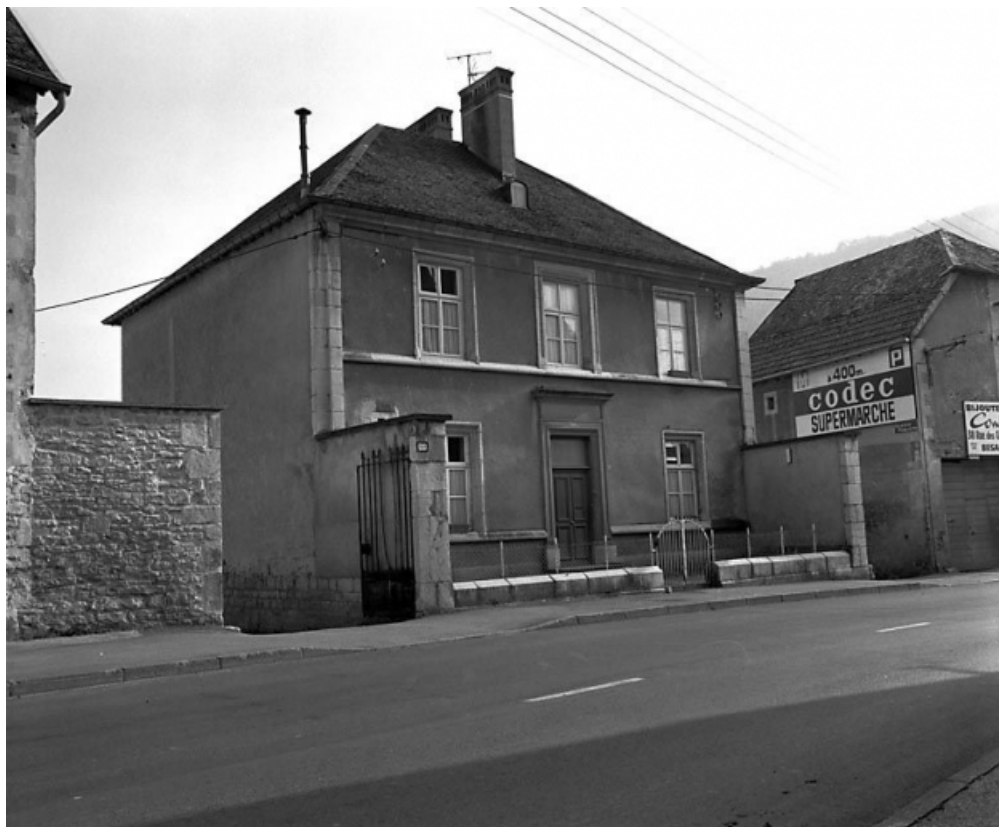
Façade antérieure et face latérale gauche.