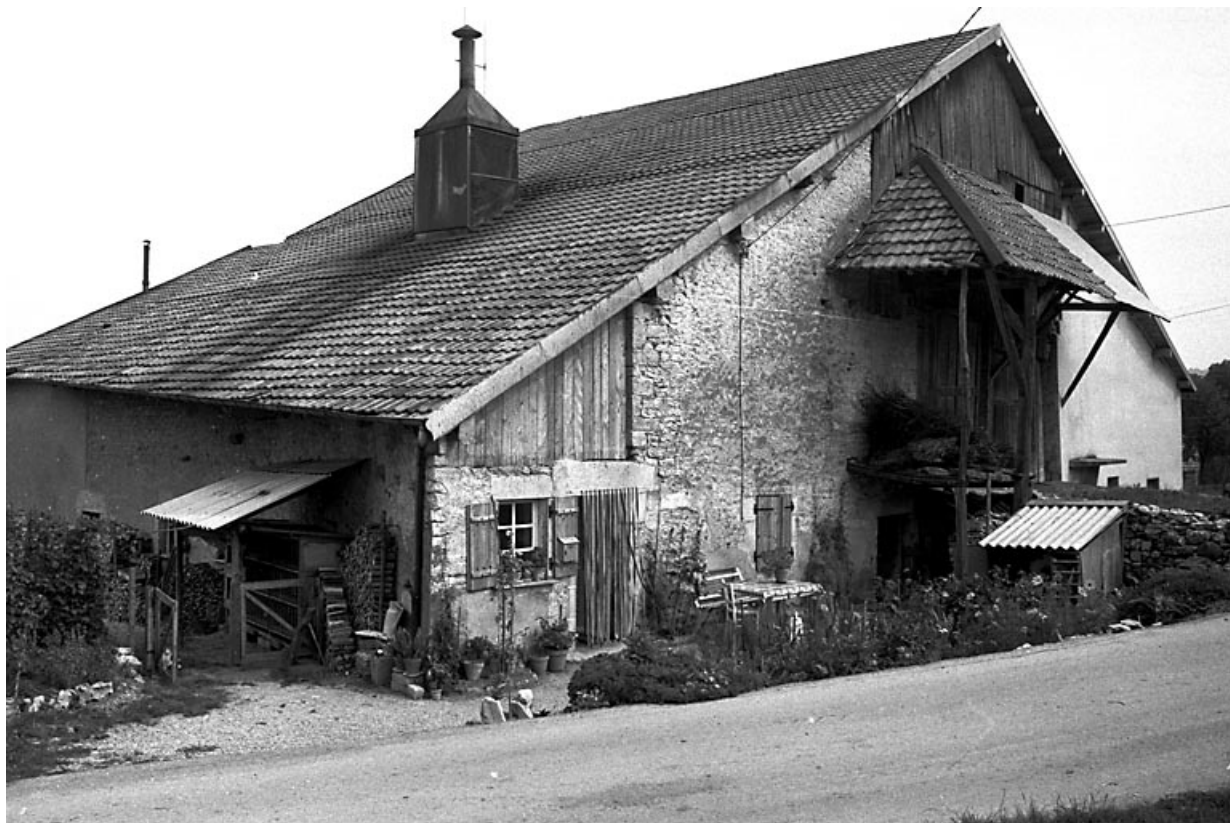
Façade antérieure vue de trois quarts gauche.