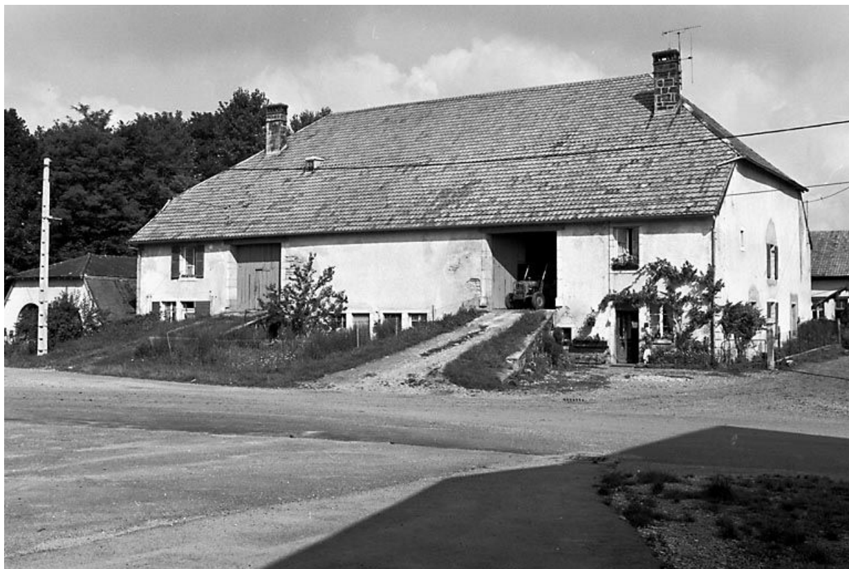
Façade antérieure et face latérale droite.