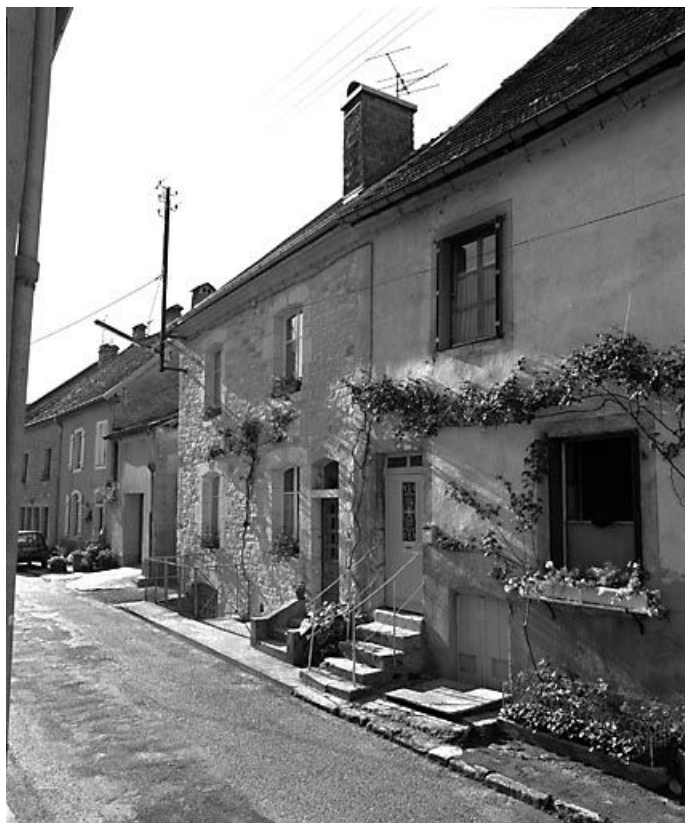
Façade antérieure vue de trois quarts droit.