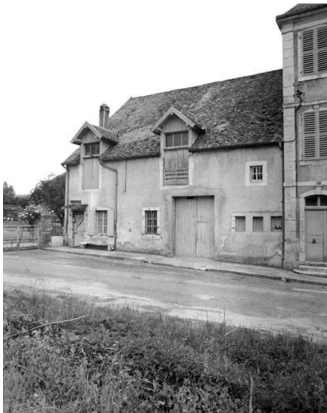
Ferme située 26 rue du Seult.