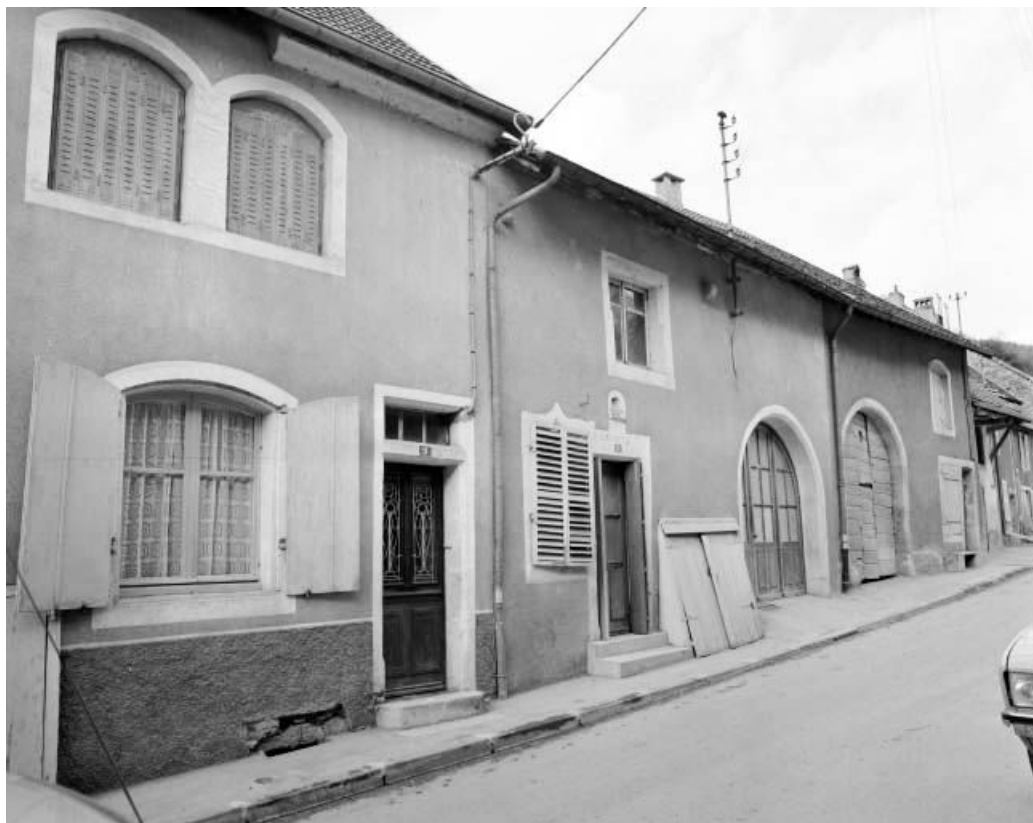
Maisons situées 9 à 13 rue des Martinets.