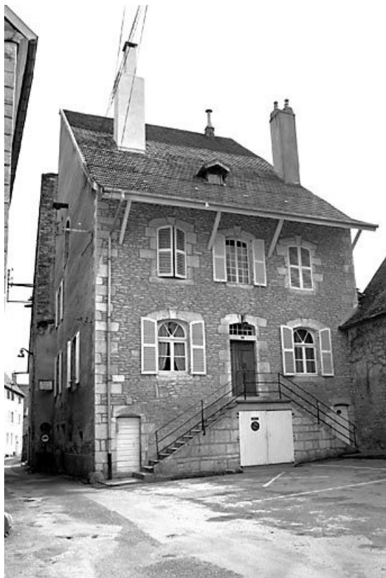
Façade antérieure et face latérale gauche.