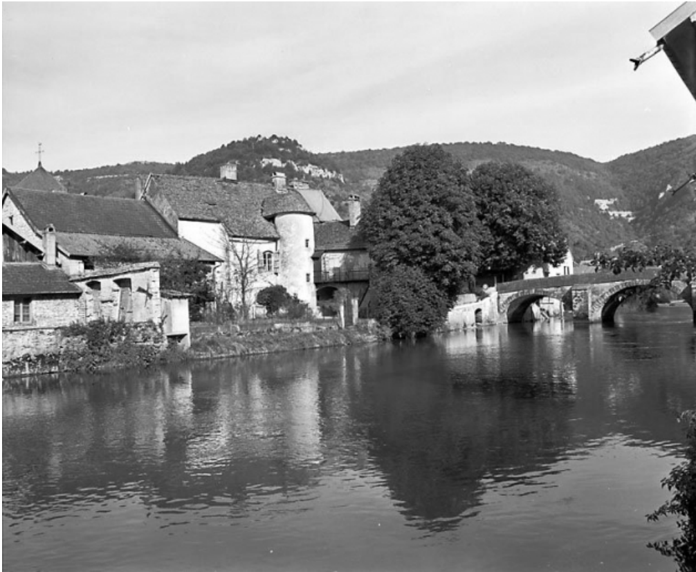
Façade postérieure sur la Loue.