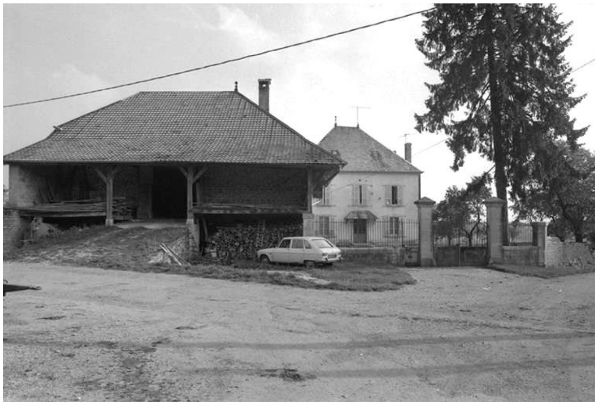
Vue d'ensemble depuis la rue.