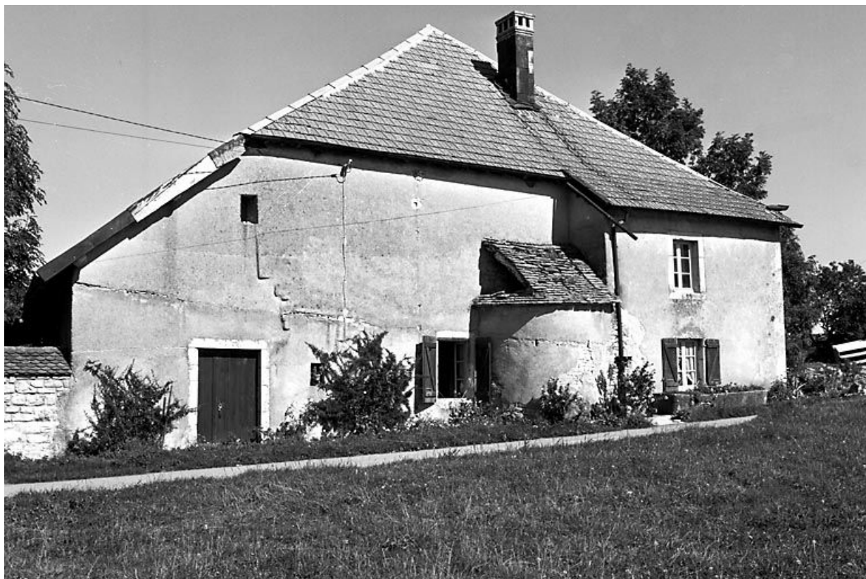
Face latérale gauche.