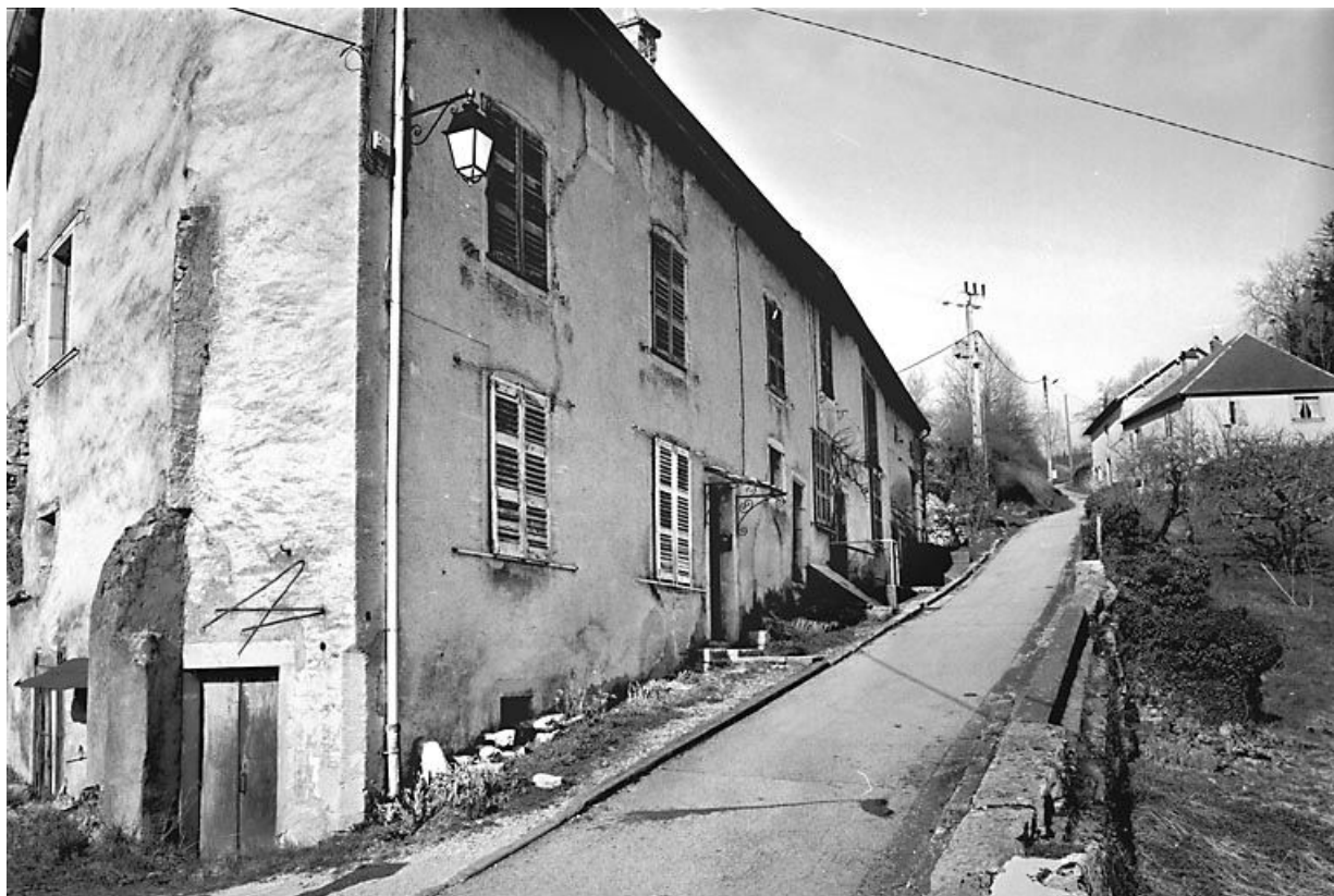
Façade antérieure de trois quarts gauche. 25, Lods