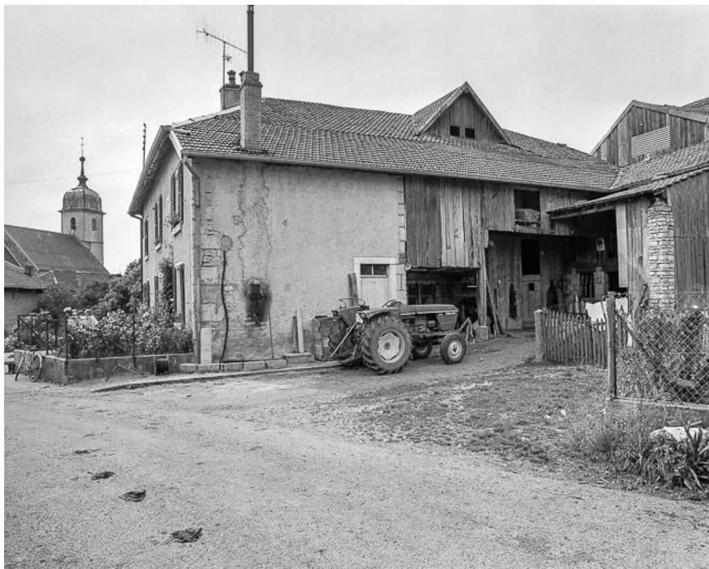
Ferme cadastrée 1968 AC 224 : façade antérieure et face latérale droite.