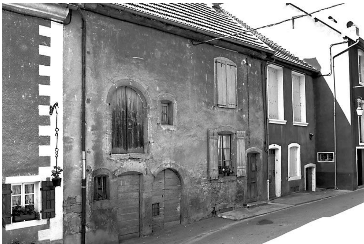
Façade antérieure vue de trois quarts gauche. 25, Mouthier-Haute-Pierre