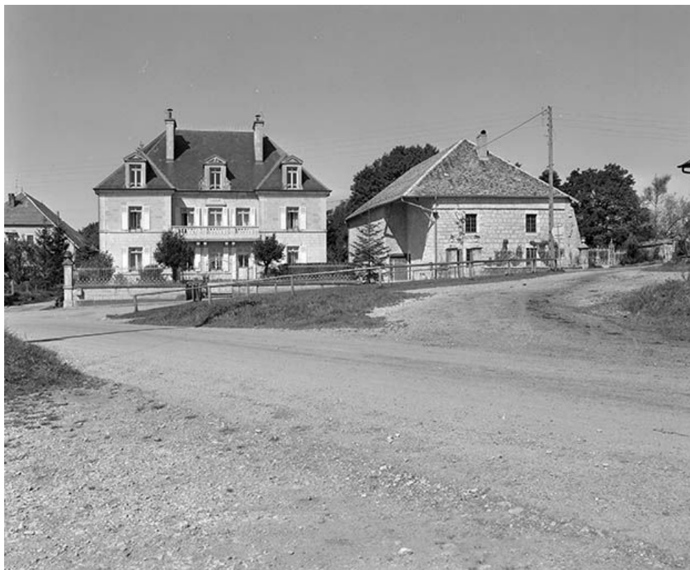
Vue d'ensemble depuis la rue.