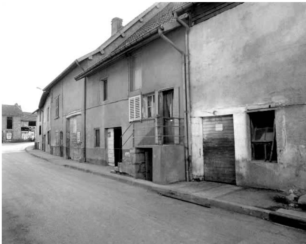
Maison de vigneron située 4 rue des Contrevaux.