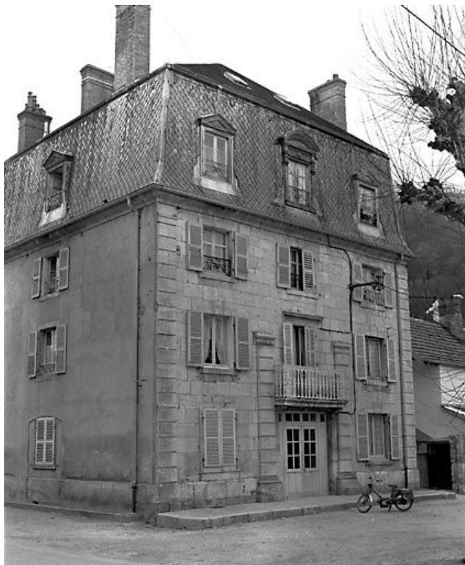
Façade antérieure et face latérale gauche.