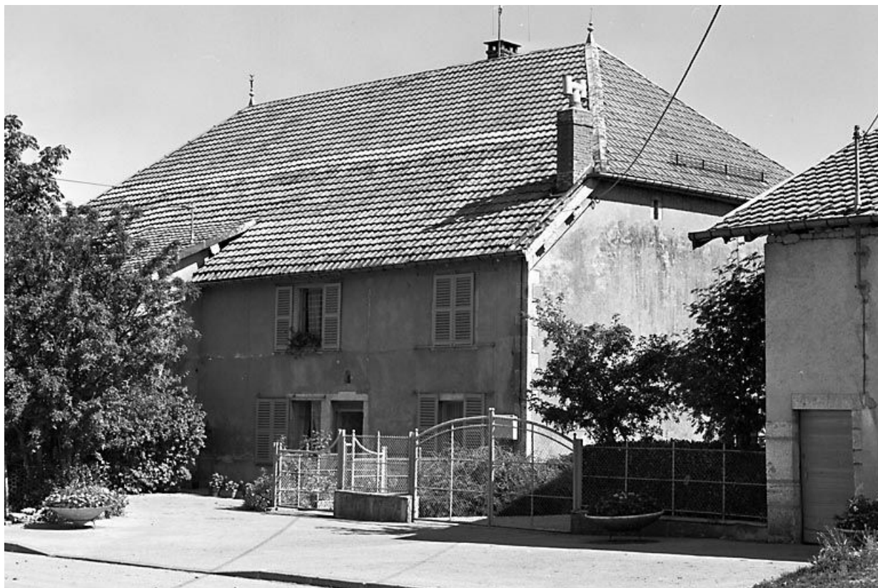
Façade antérieure vue de trois quarts droit.