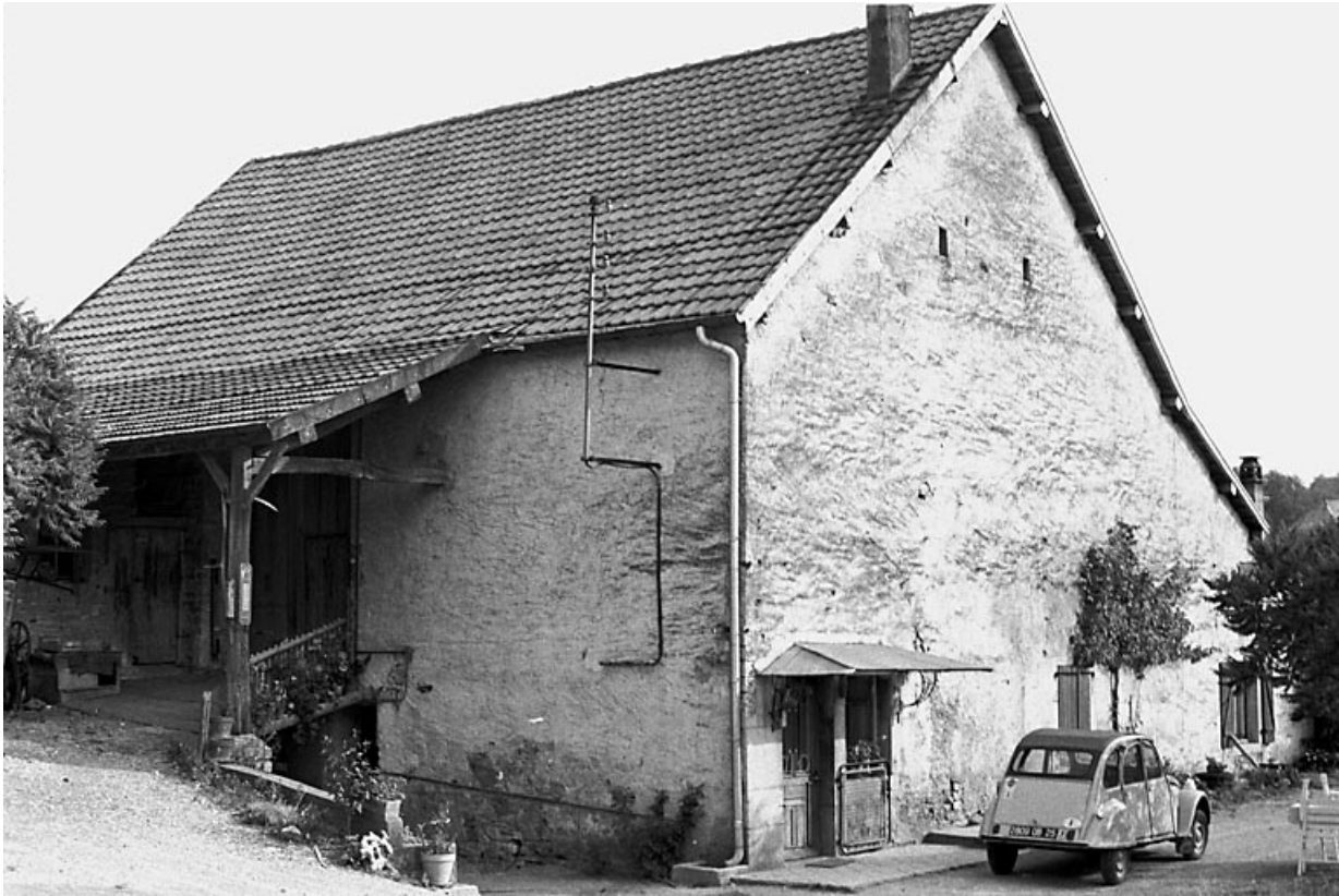
Façade antérieure et face latérale gauche. 25, Tarcenay