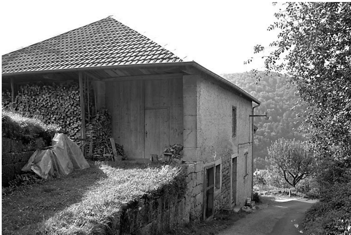
Façade antérieure et face latérale gauche.