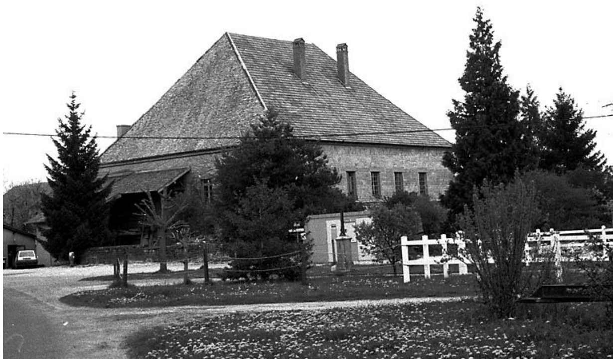
Vue générale de trois quarts gauche.