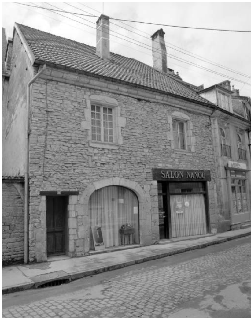
Maison située 9 rue Saint-Laurent.