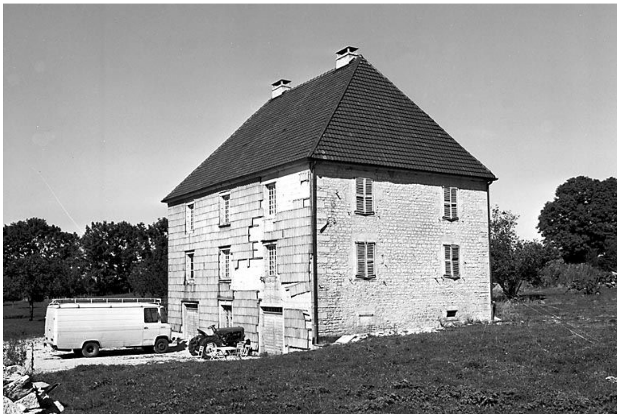
Façade antérieure et face latérale droite.