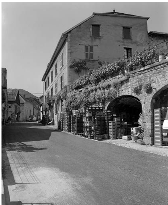
Façade antérieure de trois quarts gauche. 25, Lods