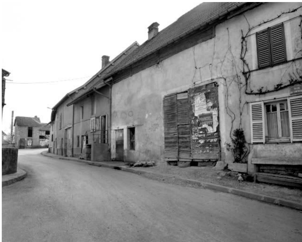
Ferme située 2 rue des Contrevaux.