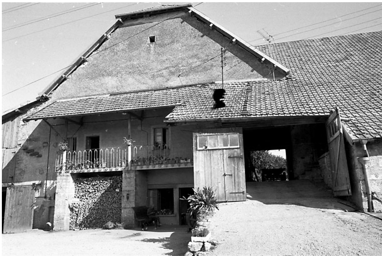
Façade antérieure. 25, Tarcenay