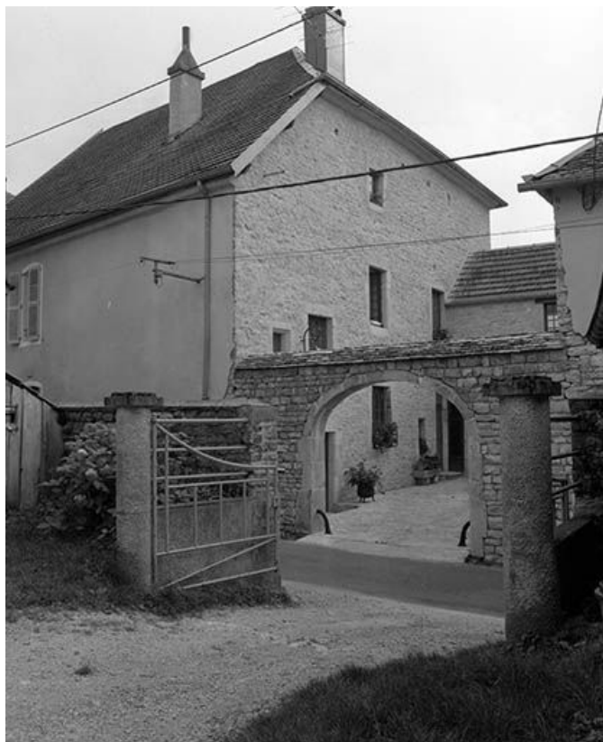
Vue générale de trois quarts gauche.