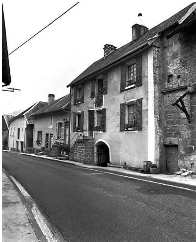
Façade antérieure vue de trois quarts droit. 25, Lods