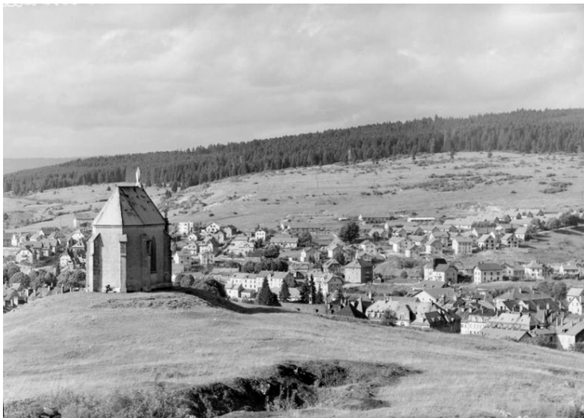
Façade postérieure [1e moitié du 20e siècle]. 25, Pontarlier, lieudit : Chapelle de l'Espérance