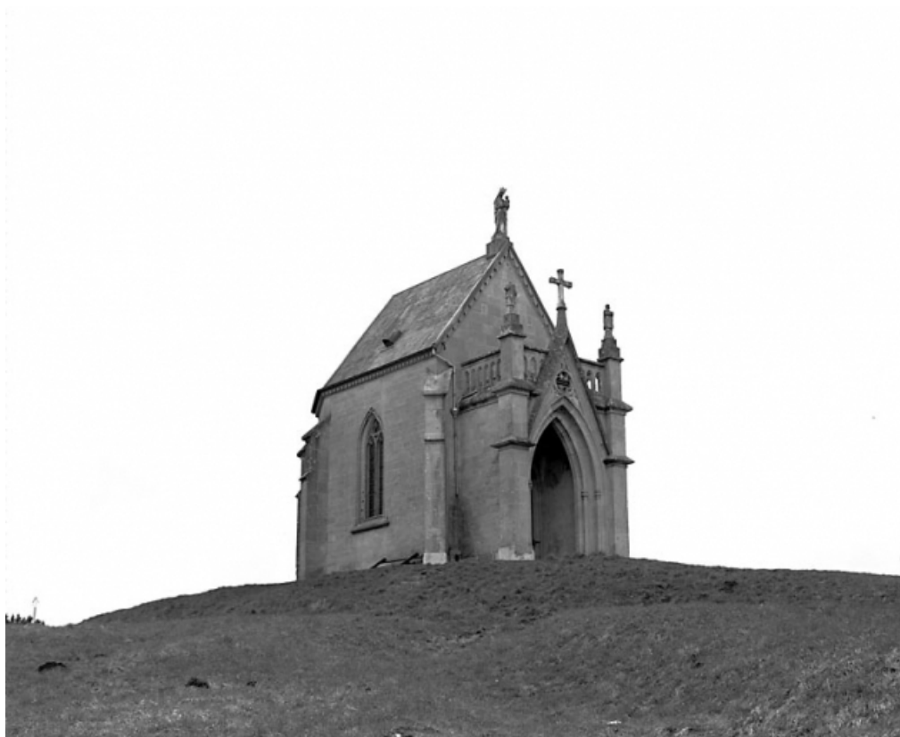
Vue d'ensemble de trois quarts gauche.

25, Pontarlier, lieudit : Chapelle de l'Espérance