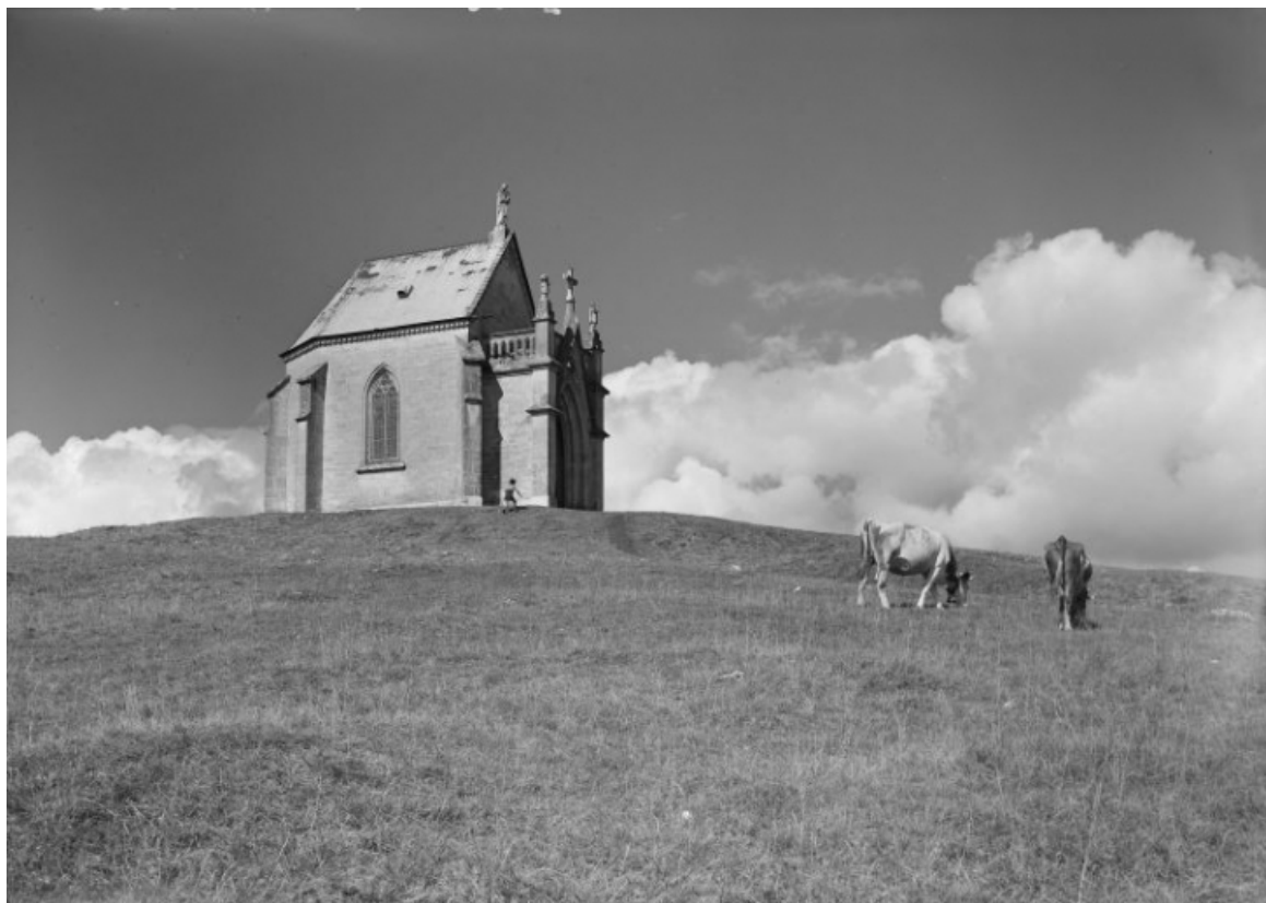
Façade latérale gauche [1e moitié du 20e siècle]. 25, Pontarlier, lieudit : Chapelle de l'Espérance