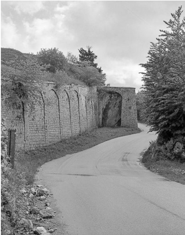
Vue verticale et rapprochée du front de gorge.

25, Pontarlier, lieudit : le Larmont supérieur