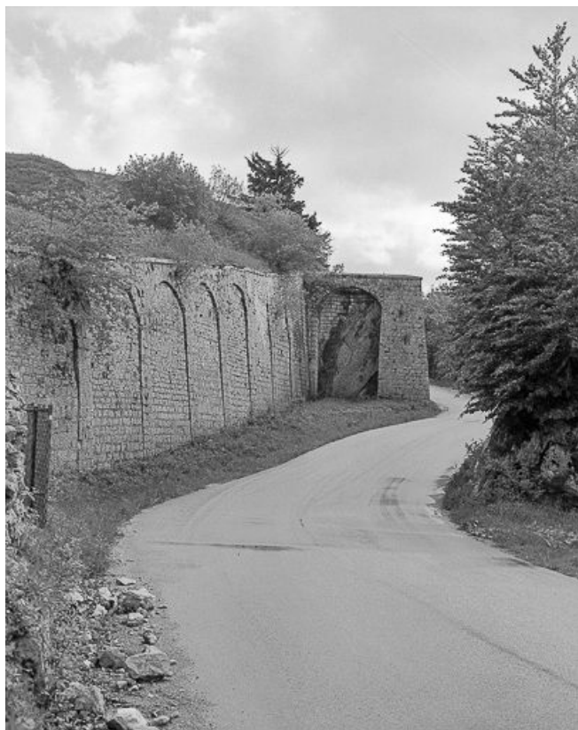
Vue verticale et rapprochée du front de gorge.

25, Pontarlier, lieudit : le Larmont supérieur