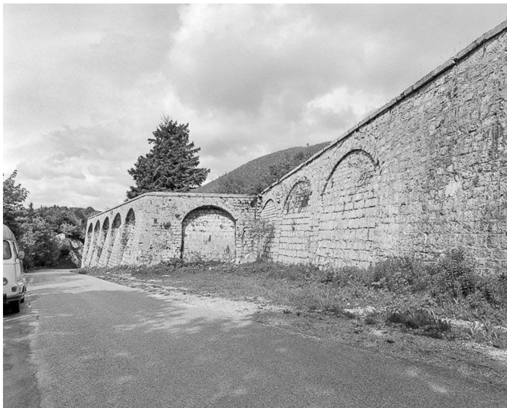
Créneaux de pied défendant l'enceinte : vue éloignée.

25, Pontarlier, lieudit : le Larmont supérieur