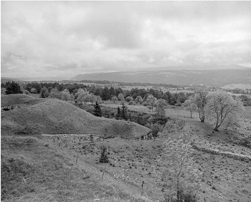
Vue éloignée sur les superstructures du fort et le fossé.

25, Pontarlier, lieudit : le Larmont supérieur