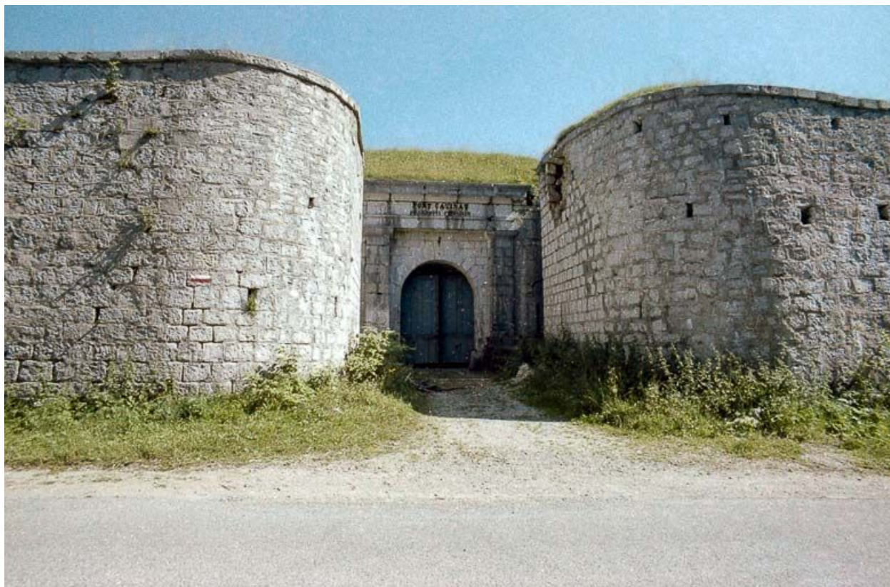
Entrée du fort.