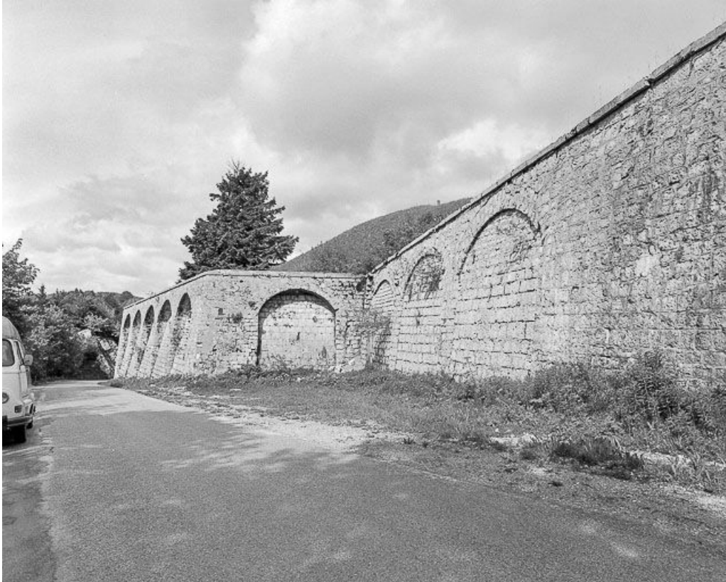
Crènaux de pied défendant l'enceinte : vue éloignée.

25, Pontarlier, lieudit : le Larmont supérieur