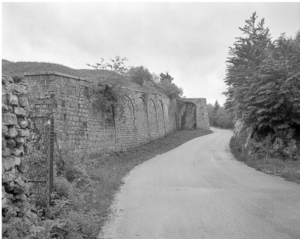
Vue du front de gorge.

25, Pontarlier, lieudit : le Larmont supérieur