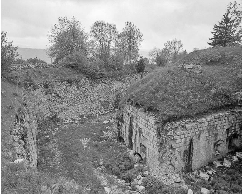
Caponnière défendant le fossé circulaire.

25, Pontarlier, lieudit : le Larmont supérieur