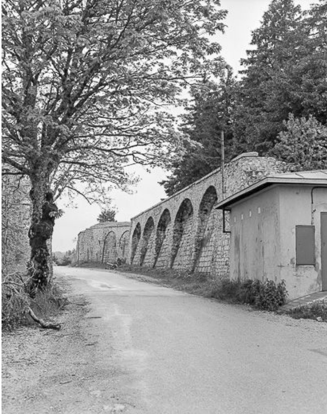
Créneaux de pied défendant l'enceinte : vue rapprochée.

25, Pontarlier, lieudit : le Larmont supérieur