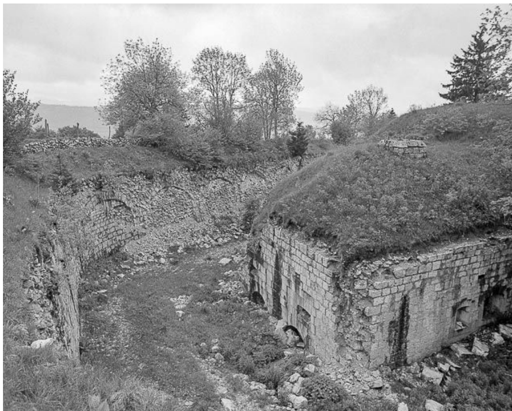
Caponnière défendant le fossé circulaire.

25, Pontarlier, lieudit : le Larmont supérieur