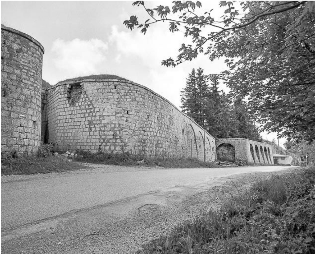
Entrée du fort et créneaux de pied.

25, Pontarlier, lieudit : le Larmont supérieur