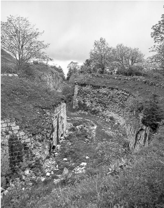
Caponnière et fossé circulaire.

25, Pontarlier, lieudit : le Larmont supérieur