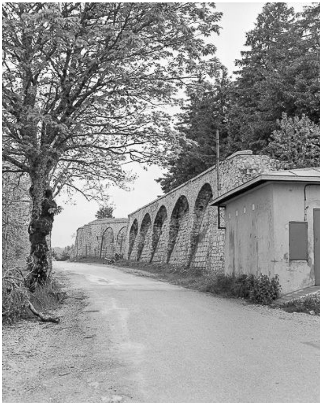
Créneaux de pied défendant l'enceinte : vue rapprochée.

25, Pontarlier, lieudit : le Larmont supérieur