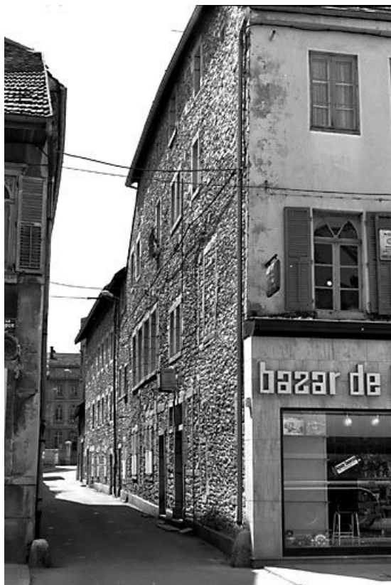
Façade sur la rue Thiers. 25, Pontarlier, 2 rue Thiers