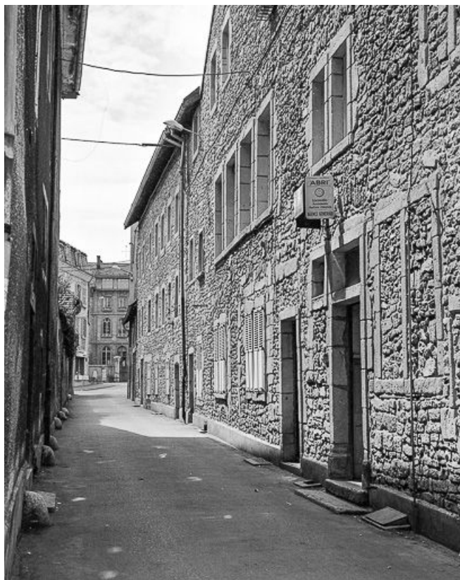
Vue depuis la rue de la République.