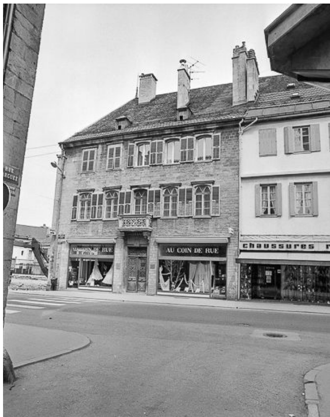
Façade sur rue, vue de trois quarts droit.