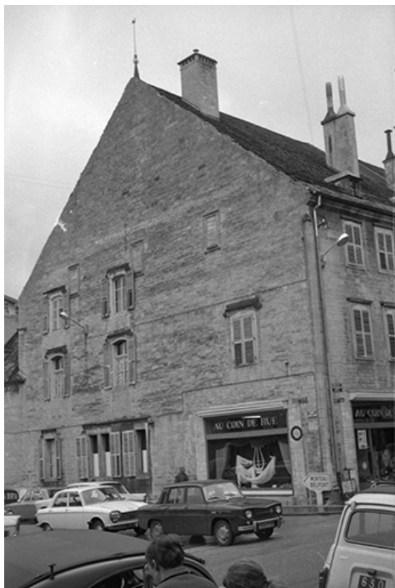
Façade latérale gauche en 1968.