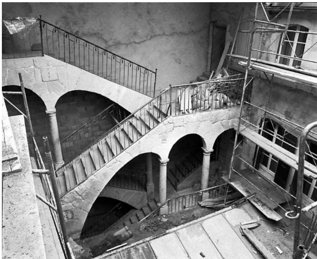
Escalier sur cour intérieure.