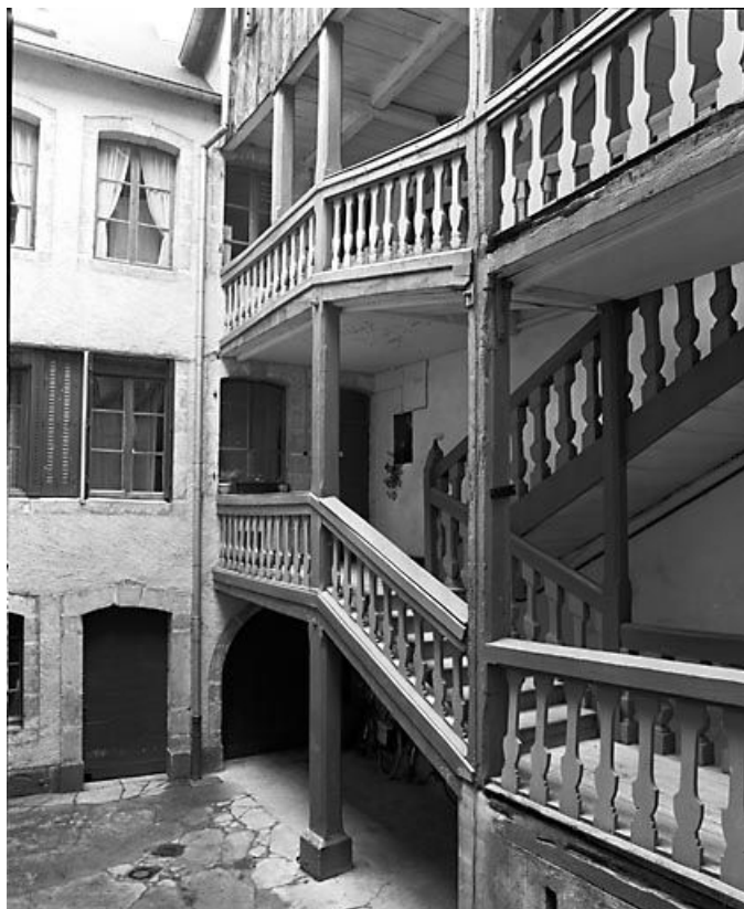
Escalier sur cour intérieure.