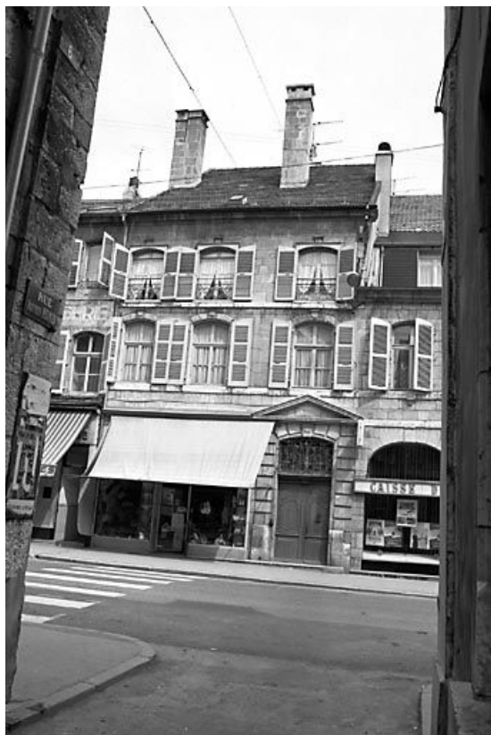
Façade sur rue. 25, Pontarlier