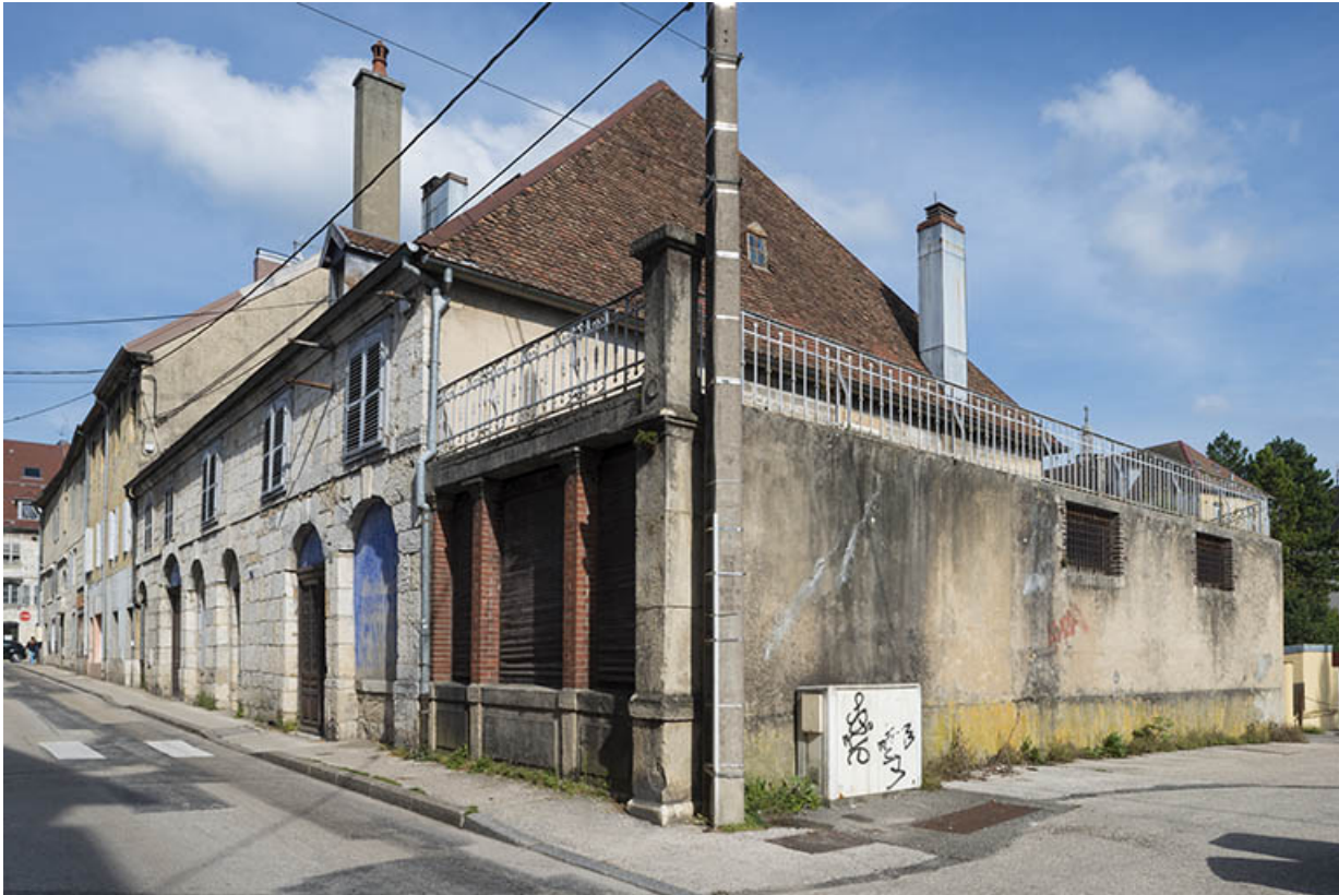
Vue d'ensemble depuis le sud-ouest.