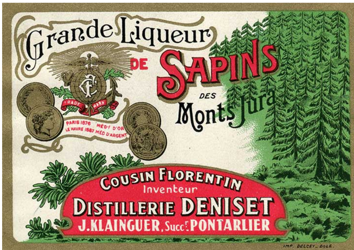
Étiquette d'une bouteille de liqueur, s.d. [2e moitié 20e siècle]. 25, Pontarlier, 7 rue Montrieux