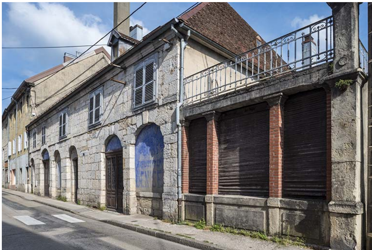
Vue rapprochée depuis le sud-ouest.