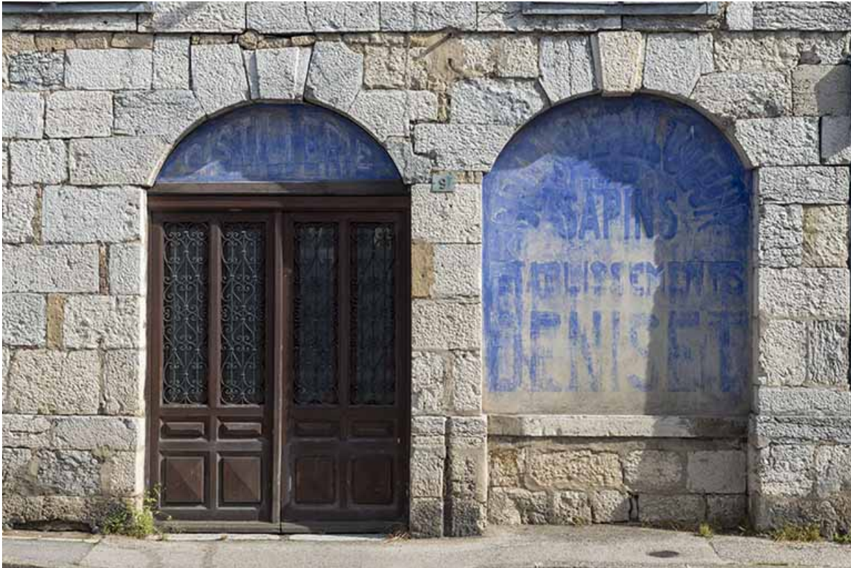
Détail de la façade ouest.