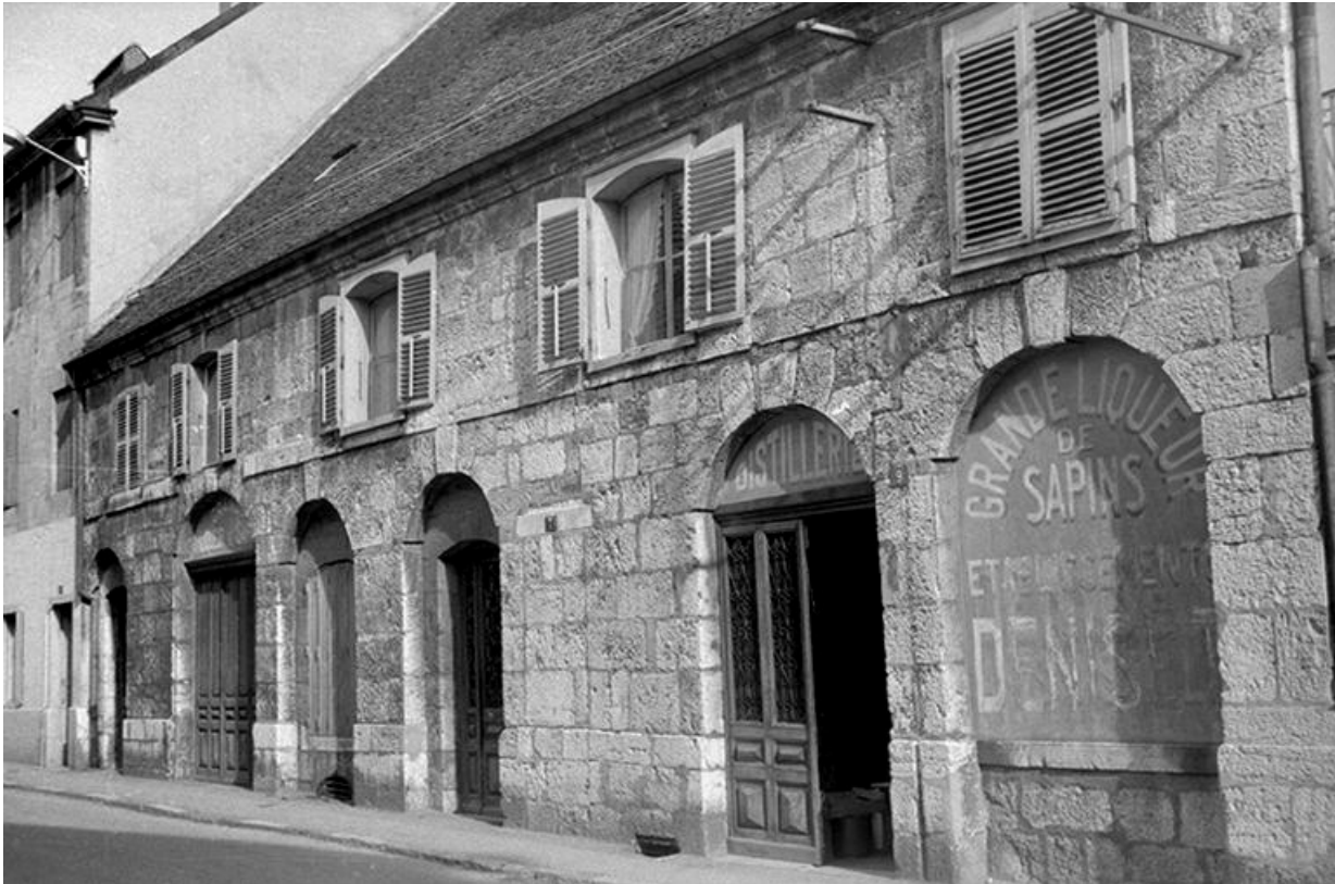
Façade ouest en 1968.