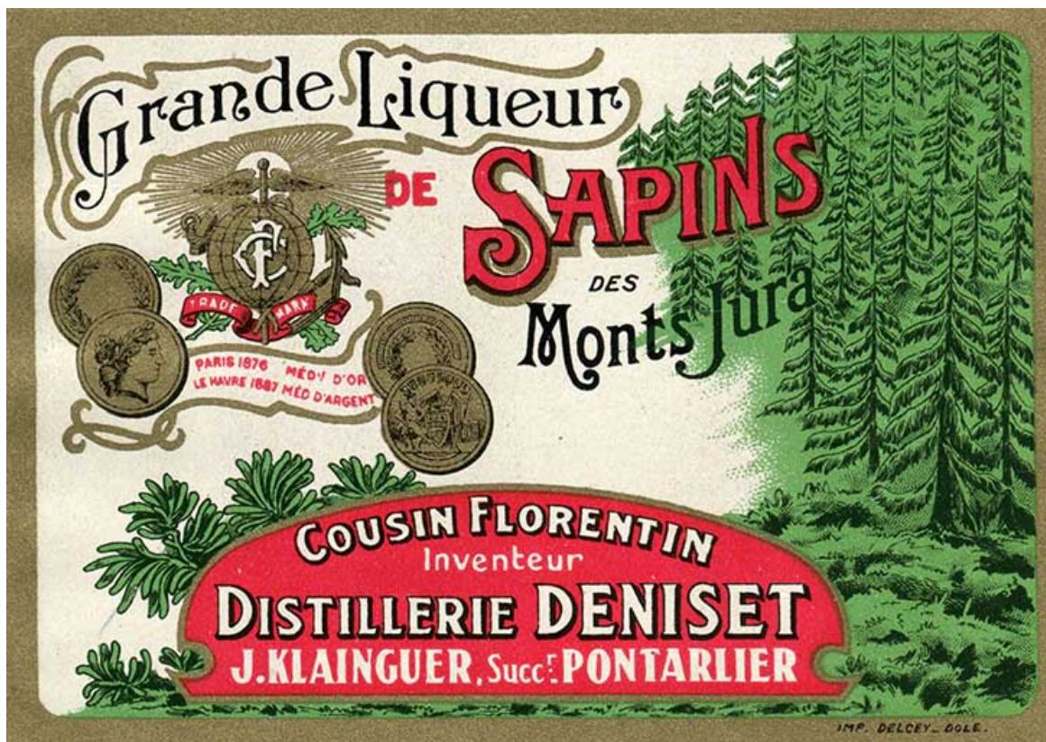
Étiquette d'une bouteille de liqueur, s.d. [2e moitié 20e siècle]. 25, Pontarlier, 7 rue Montrieux