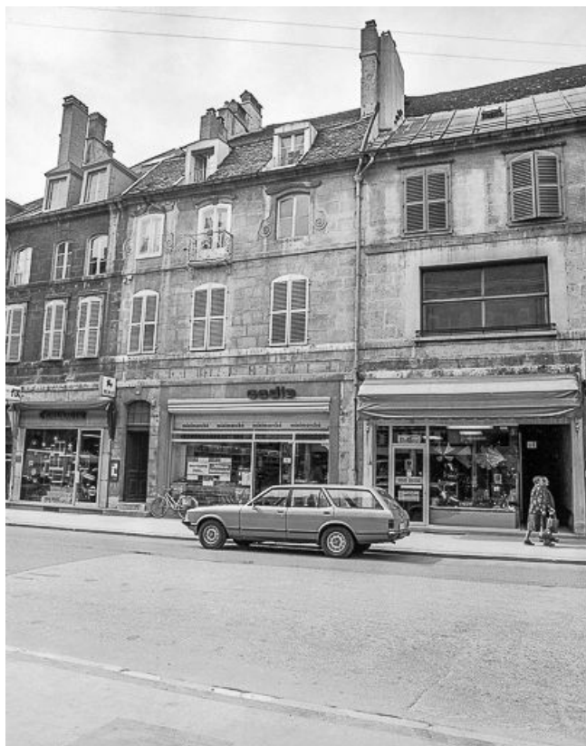
Façade sur rue, vue de trois quarts droit.