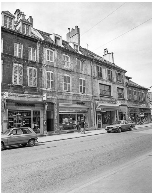
Façade sur rue, vue de trois quarts gauche. 25, Pontarlier, 19 rue de la République