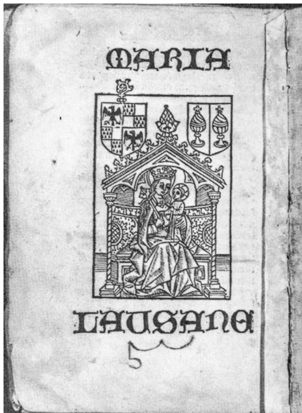
Gravure de Notre-Dame de Lausanne tirée du Bréviaire de Lausanne. 25, Pontarlier place Créatin