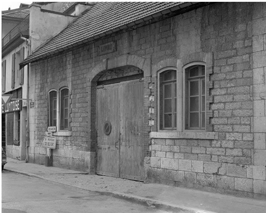
Façade sur rue, vue de trois quarts.