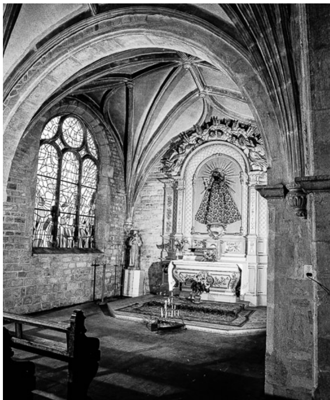
Chapelle Notre-Dame des Ermites.