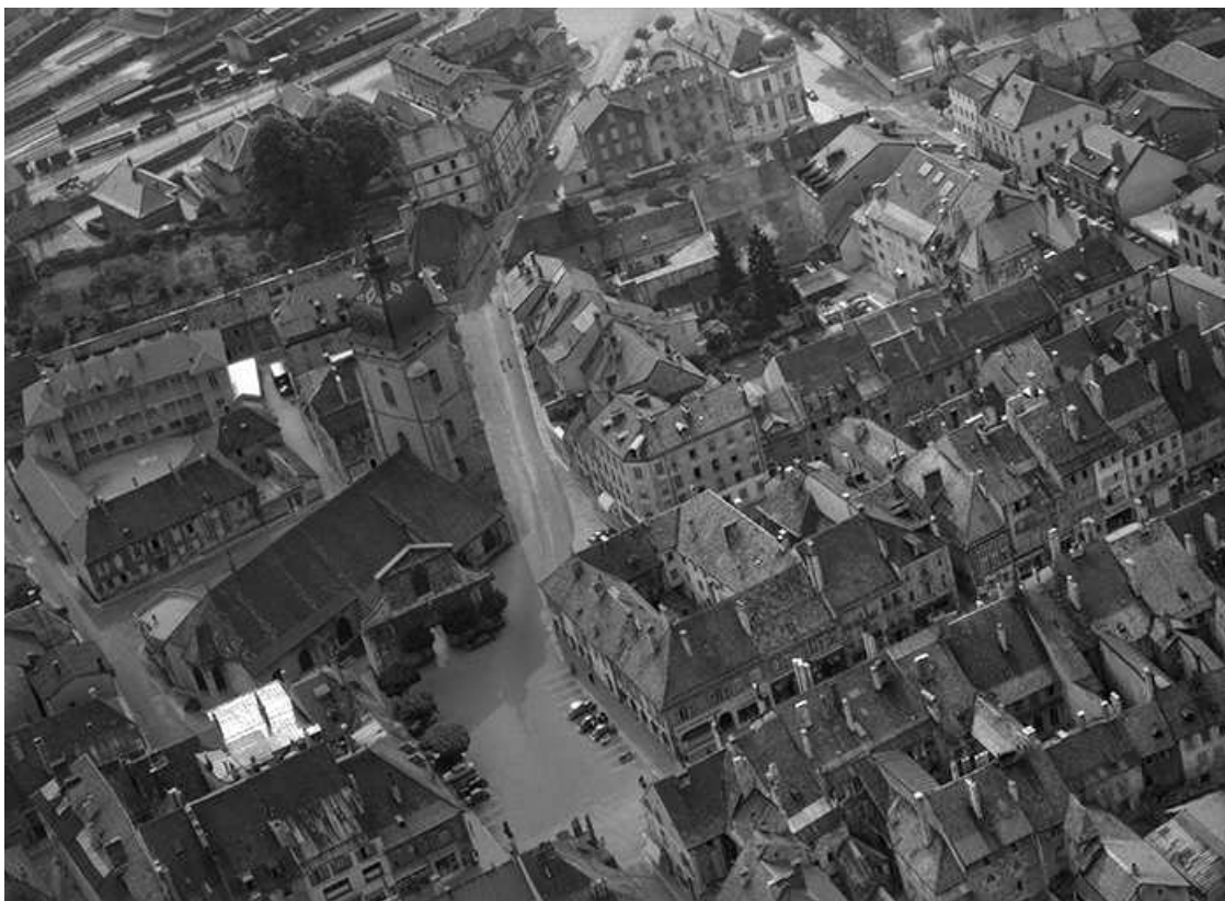
Vue aérienne en 1956.