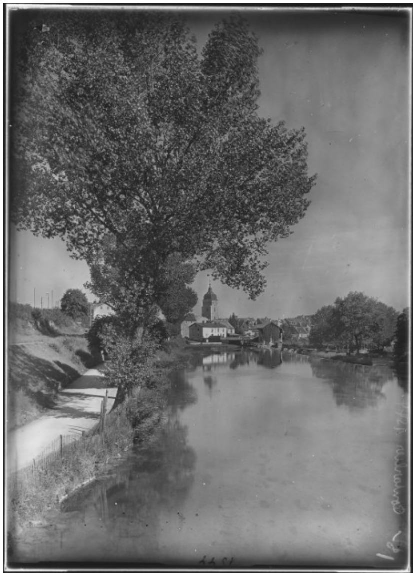
Vue éloignée depuis le Doubs [1re moitié 20e siècle]. 25, Pontarlier rue Tissot