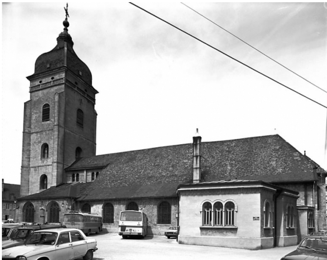
Façade latérale droite. 25, Pontarlier rue Tissot