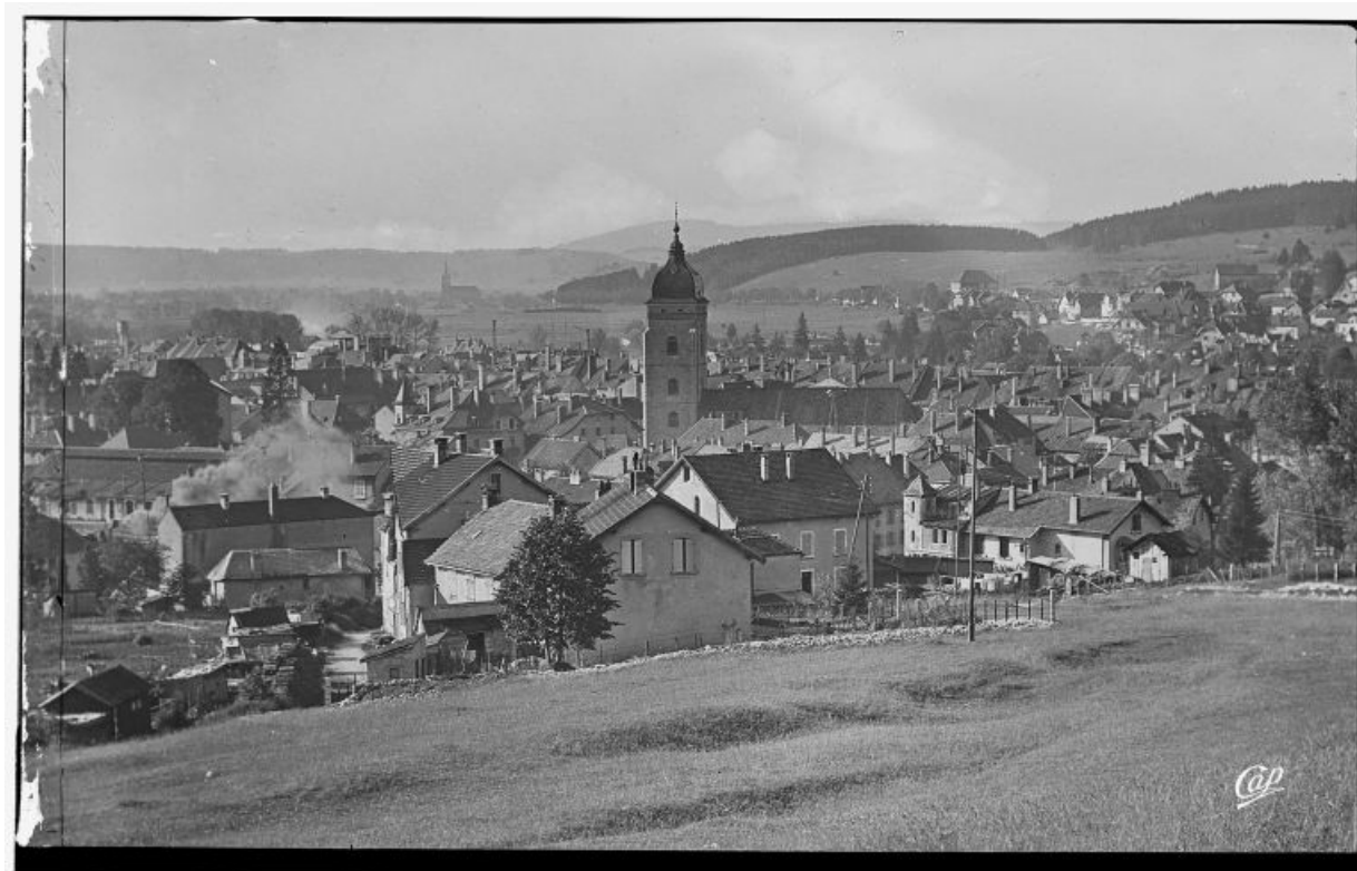
Vue de situation [1re moitié 20e siècle].