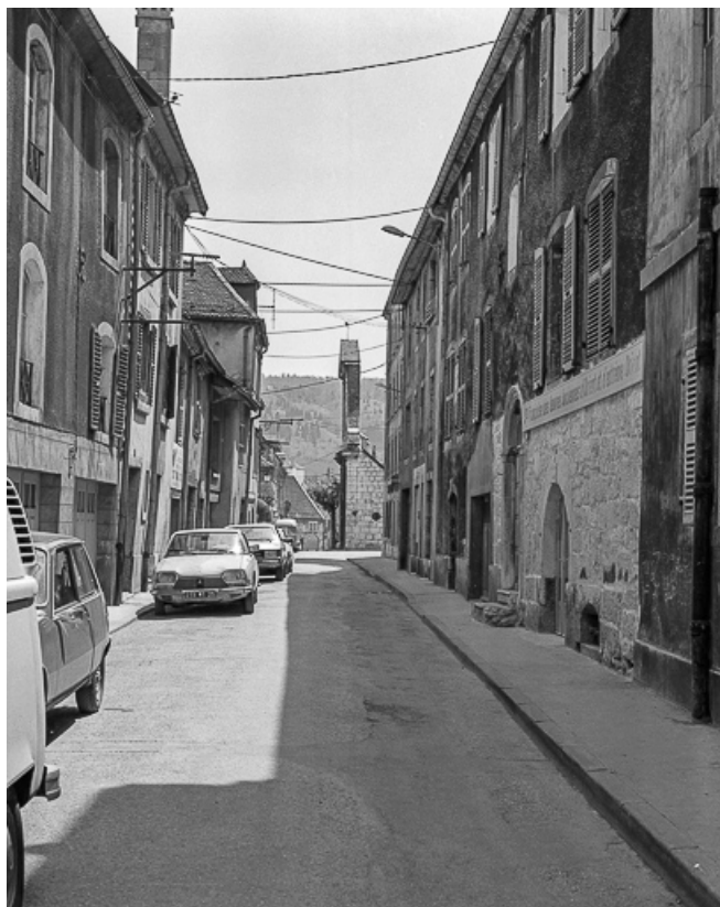
Place Saint-Bénigne. Portail, à l'extrémité de la rue Gambetta. 25, Pontarlier