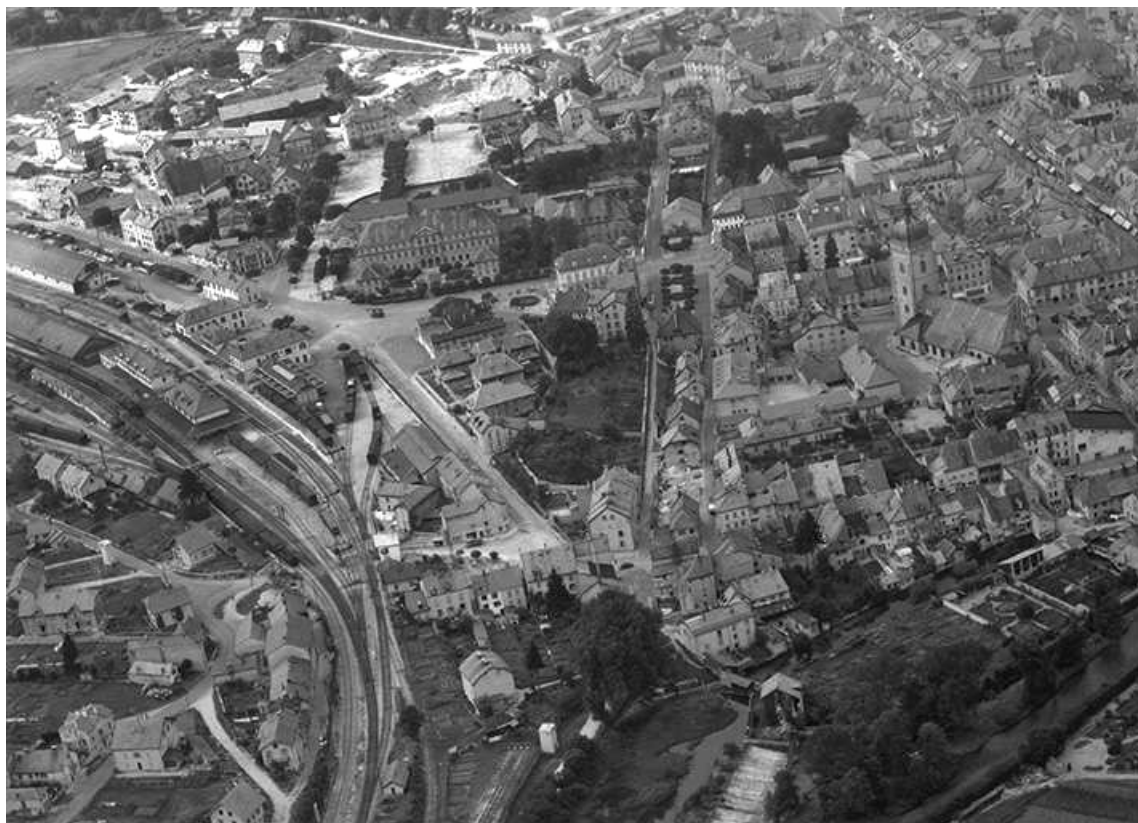
Le quartier de la gare en 1956. On voit le lycée Philippe Grenier derrière la gare et l'église Saint-Bénigne au centre à droite 25, Pontarlier