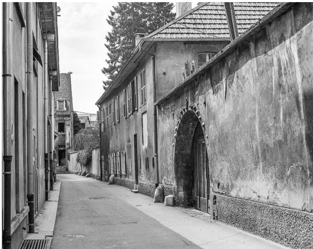
Vue d'ensemble. 25, Pontarlier