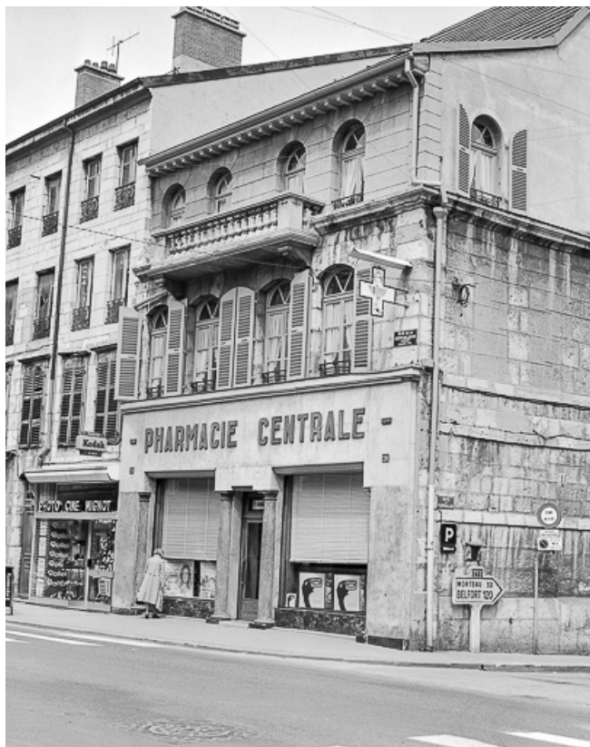
Vue d'ensemble. 25, Pontarlier