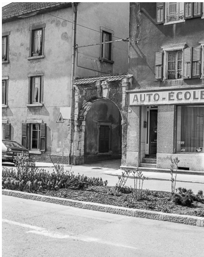
Portail, vue de trois quarts droit. 25, Pontarlier