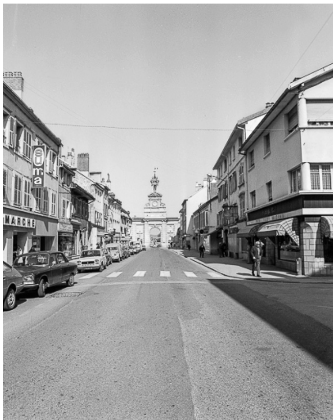
Vue d'ensemble vers la Porte Saint-Pierre. 25, Pontarlier