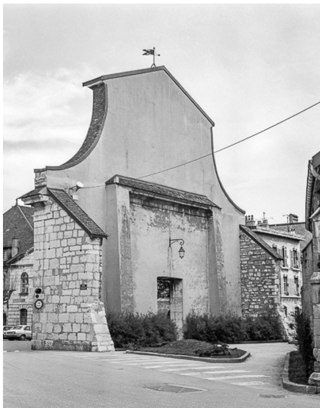
Place Saint-Bénigne. Revers du portail, vue de trois quarts. 25, Pontarlier