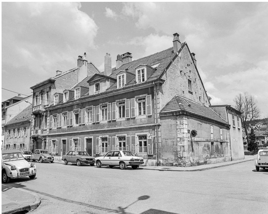
Angle de la rue Jeanne d'Arc et de la rue Jules Mathez. 25, Pontarlier