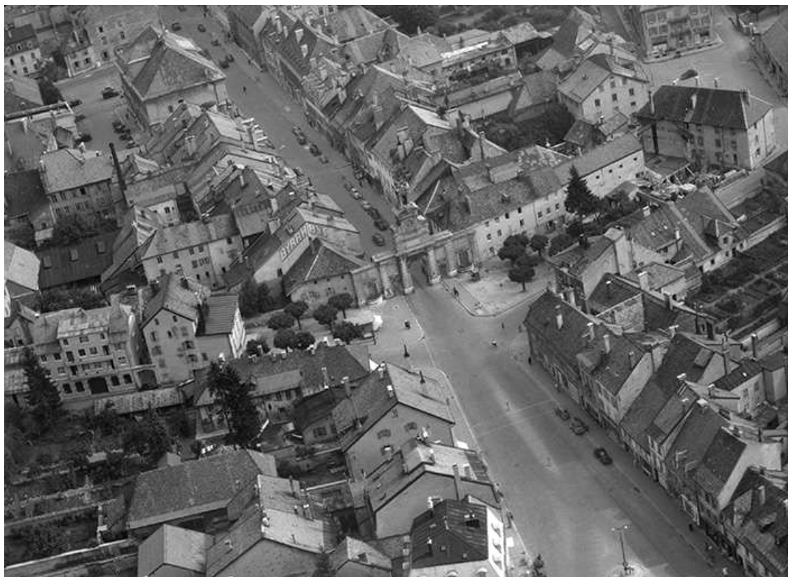
Rue de la République, rue du Faubourg Saint-Pierre, porte Saint-Pierre en 1956 25, Pontarlier