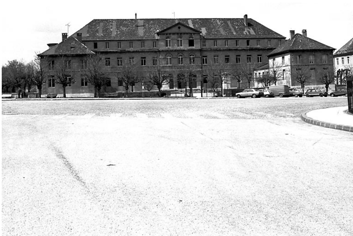
Vue de face. 25, Pontarlier