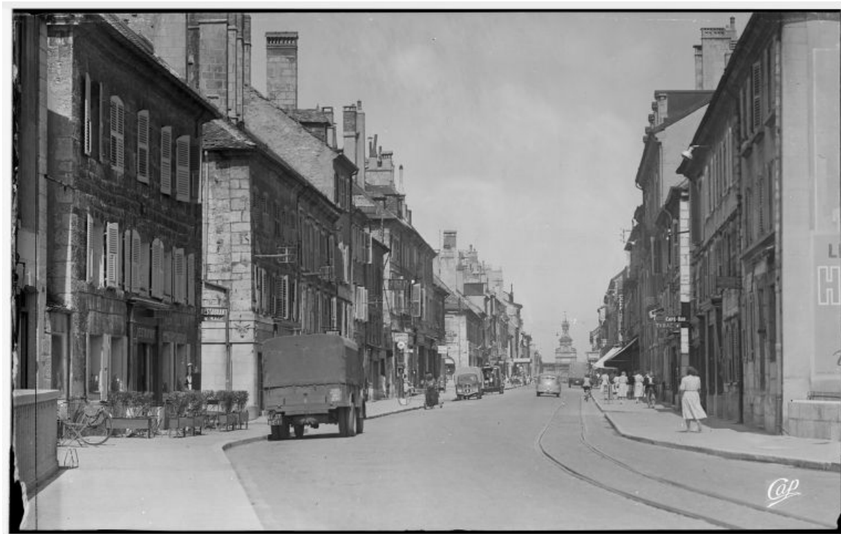
Rue de la République vue en direction de la porte Saint-Pierre [1re moitié 20e siècle]. 25, Pontarlier