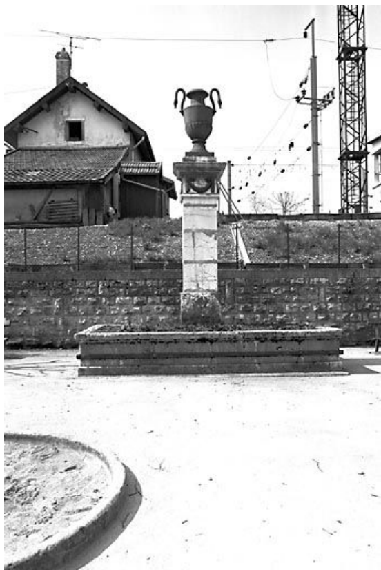
Vue d'ensemble. 25, Pontarlier