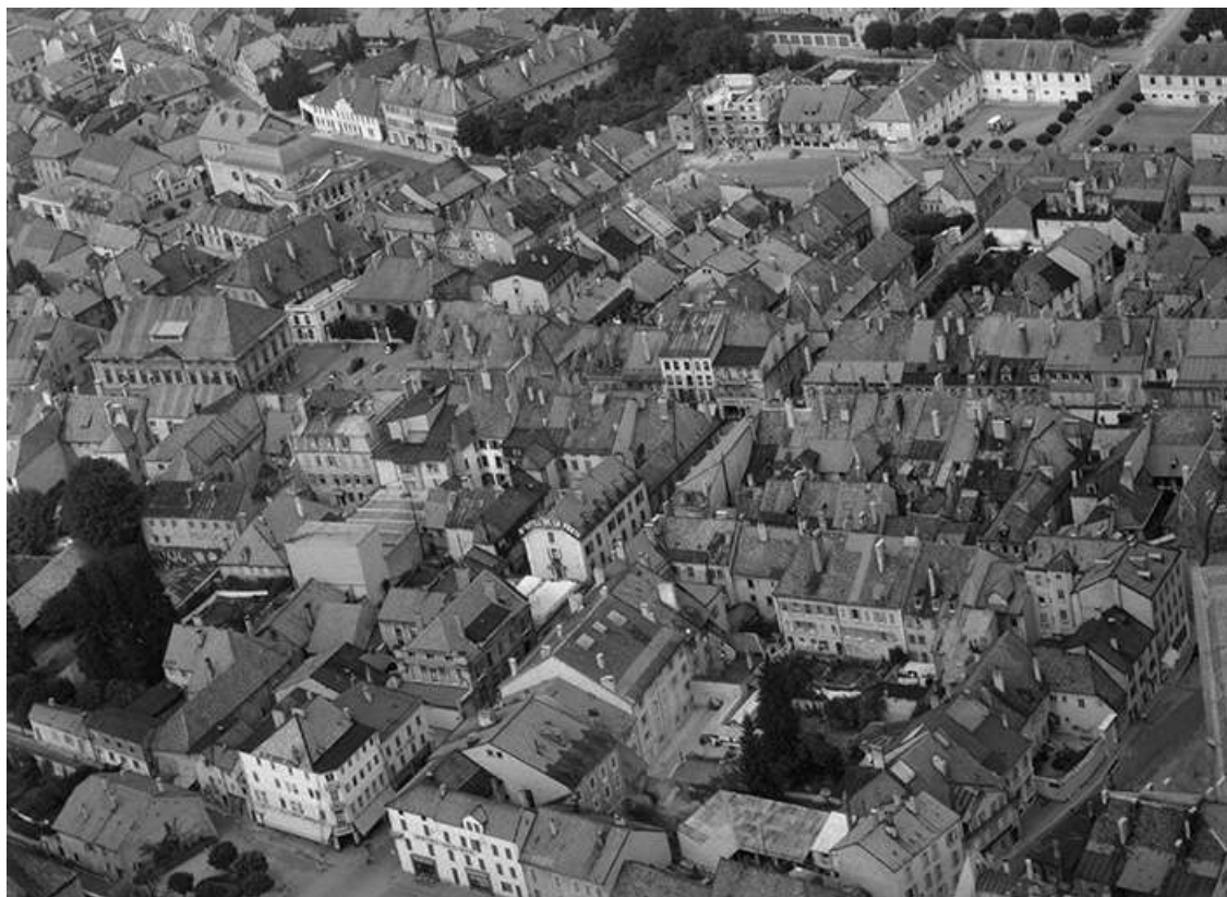
La rue de Vannolles, la rue de la Gare et en arrière-plan la place Jules Pagnier en 1956. 25, Pontarlier