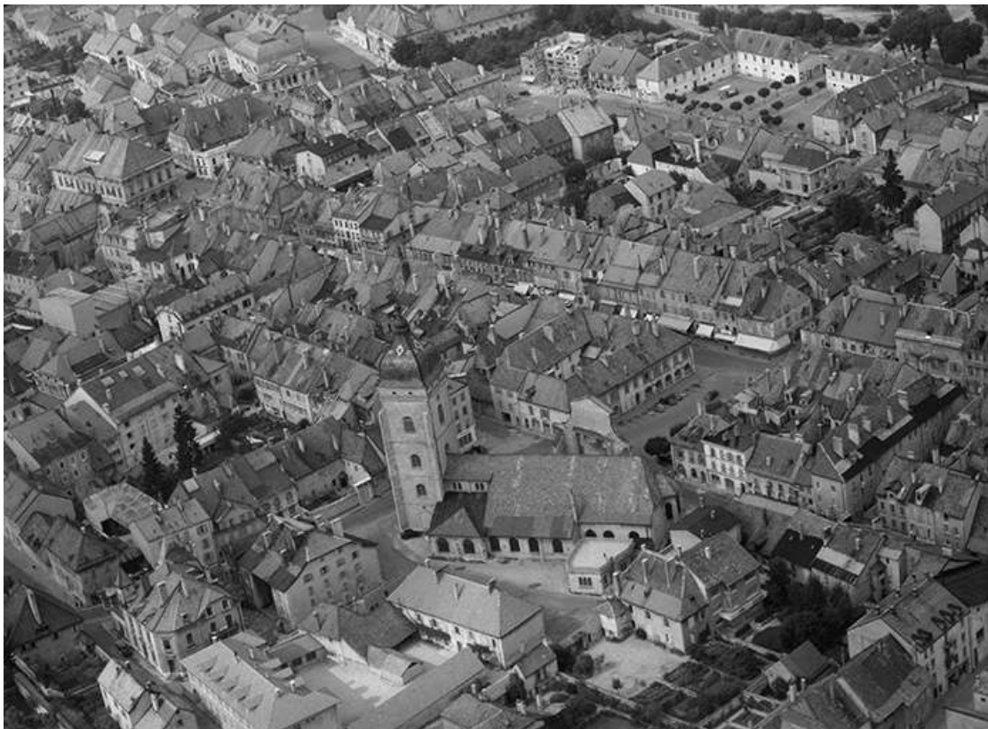
Eglise Saint-Bénigne en 1956. 25, Pontarlier