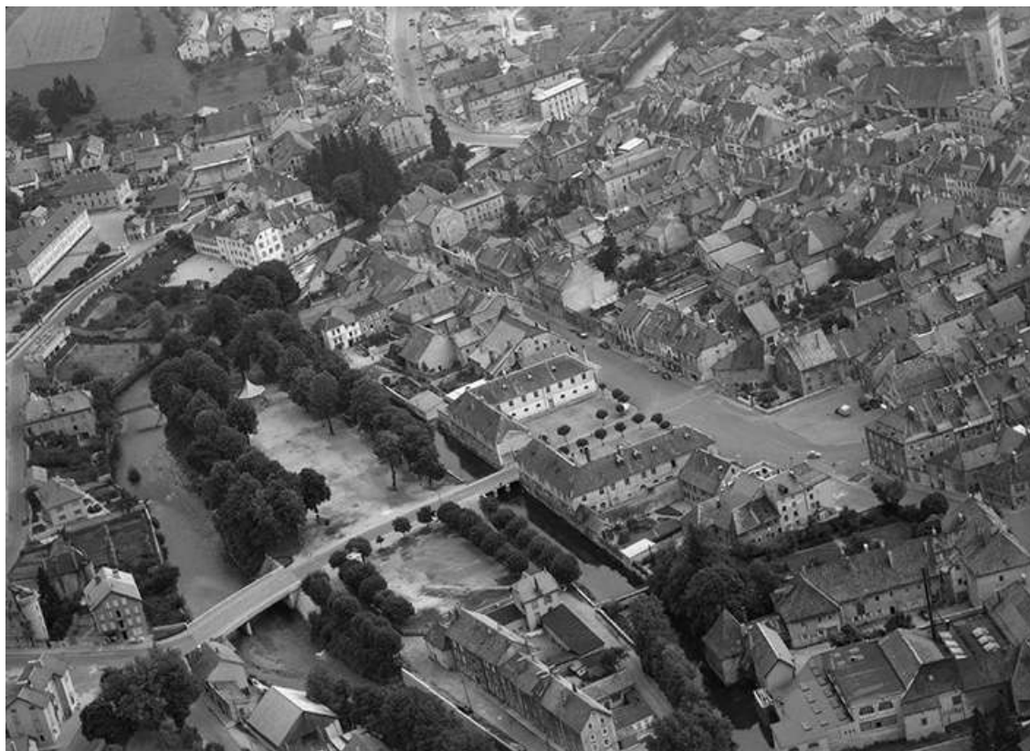
Le quai du Doubs et la place Jules Pagnier au centre en 1956. 25, Pontarlier