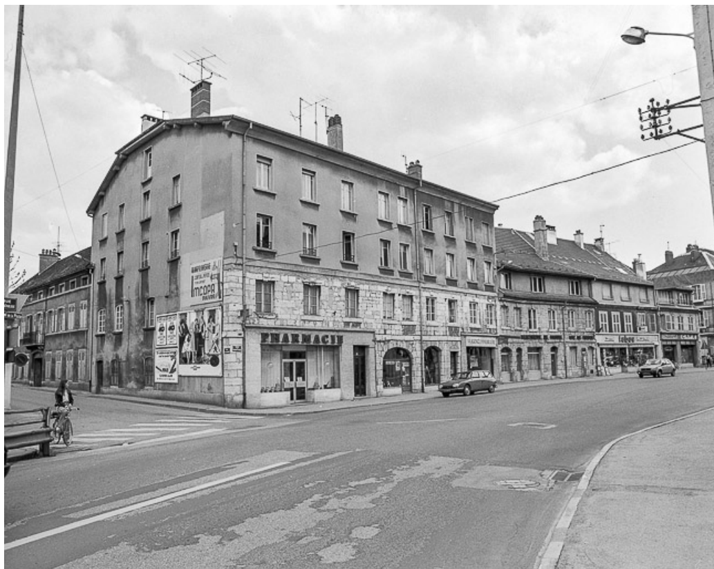
Faubourg Saint-Etienne. 25, Pontarlier