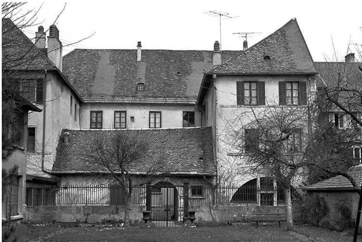
Élévation postérieure. 25, Pontarlier