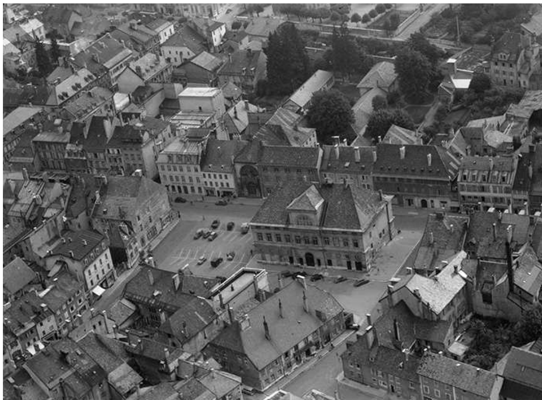
L'hôtel de ville situé rue de la République en 1956. 25, Pontarlier