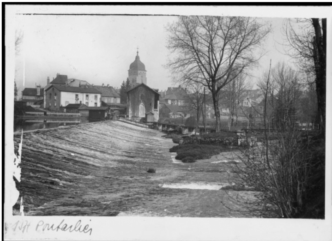
Maisons et clocher de l'église Saint-Bénigne vus depuis la rive droite du Doubs. 25, Pontarlier