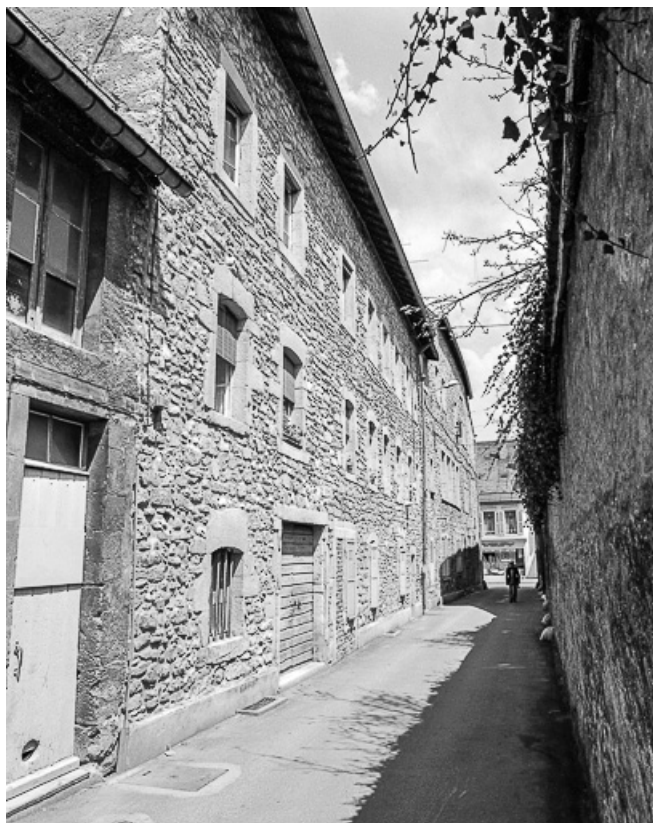
Vue de la rue Thiers et sur la rue de la République. 25, Pontarlier