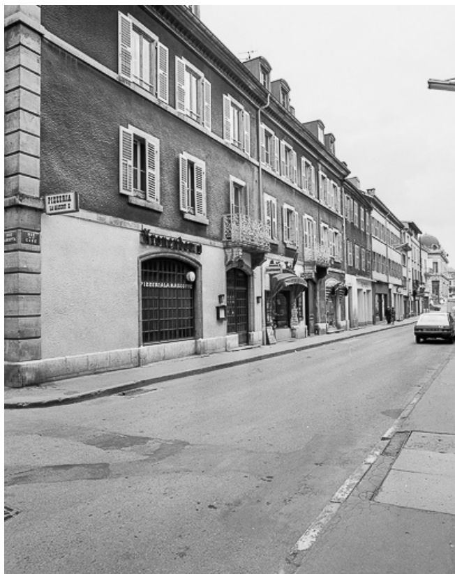
Façades sur rue.