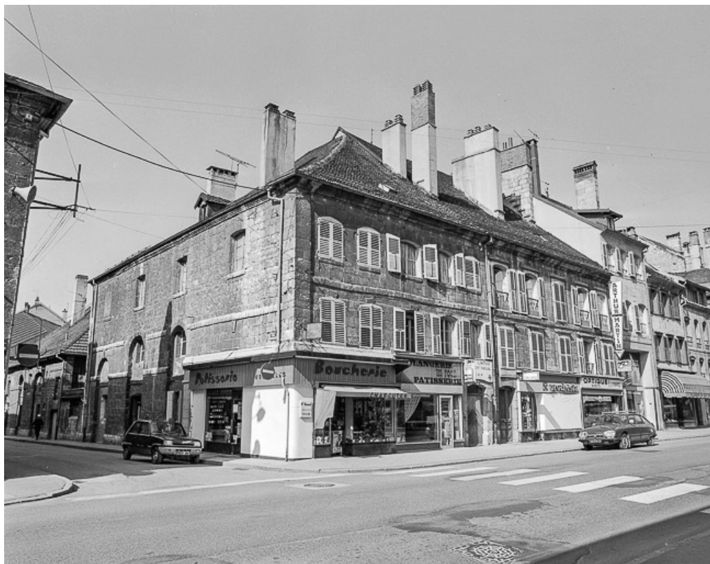
Façades sur rue. 25, Pontarlier