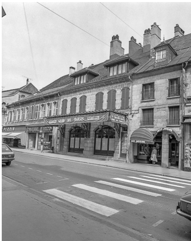
Façades sur rue.