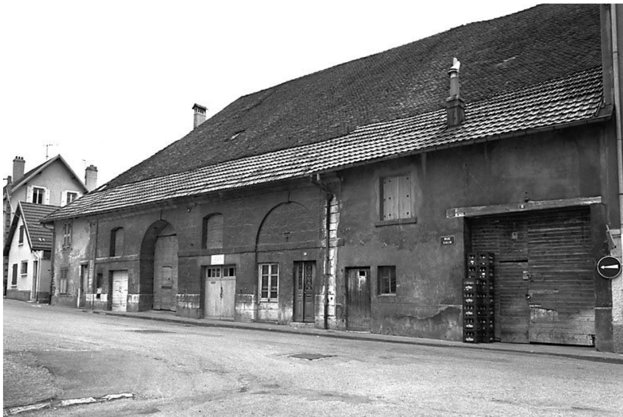
Façade sur rue. 25, Pontarlier