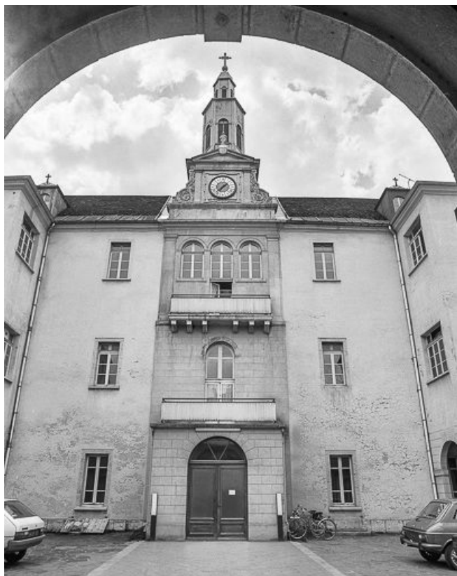
L'entrée, vue de face. 25, Pontarlier