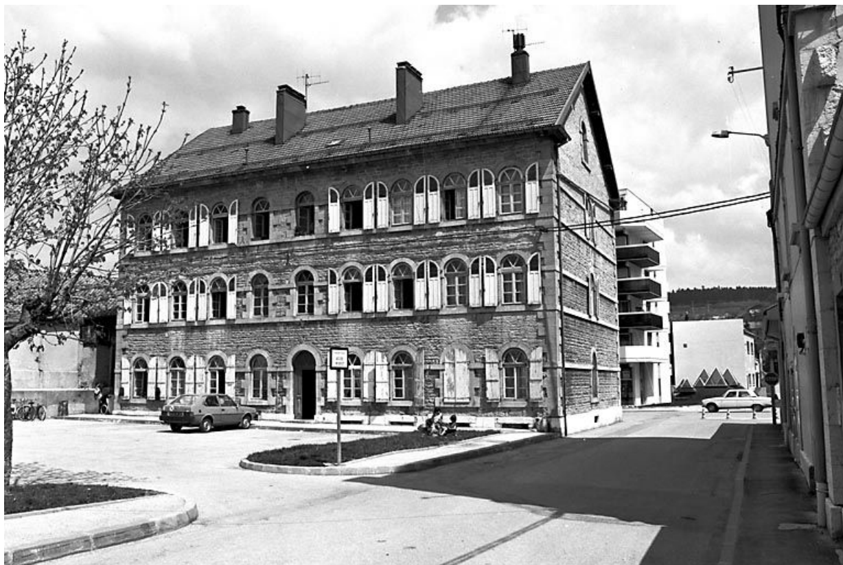
Vue de trois quarts. 25, Pontarlier