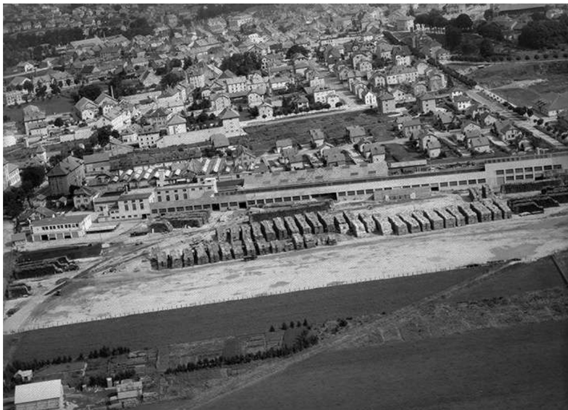
Le quartier touchant le terrain d'aviation en 1956. 25, Pontarlier