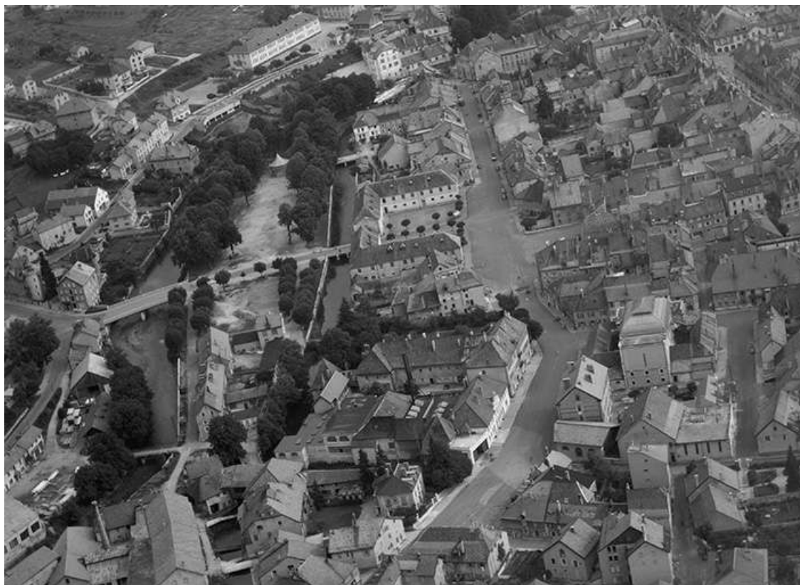
Le quai du Doubs, la rue Jeanne d'Arc et la place Jules Pagnier au centre en 1956 25, Pontarlier