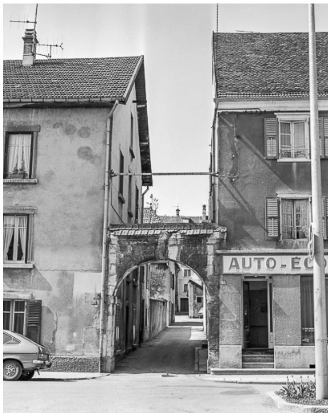
Portail, vue de face, avec les bâtiments contigus. 25, Pontarlier