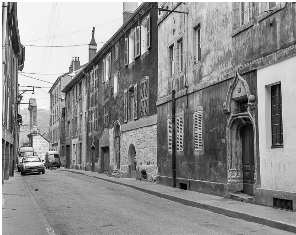
Façades sur rue. 25, Pontarlier