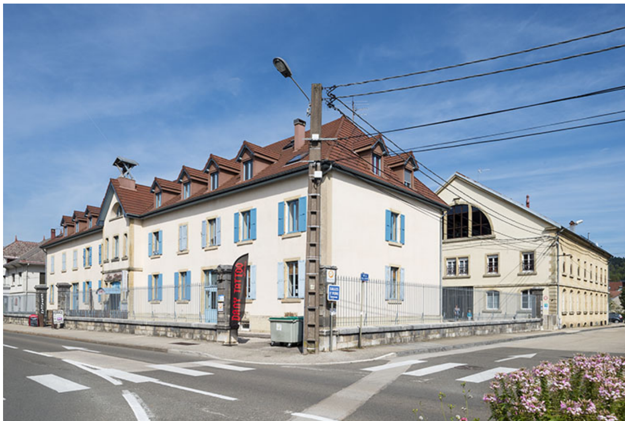
Vue d'ensemble depuis le sud. 25, Pontarlier