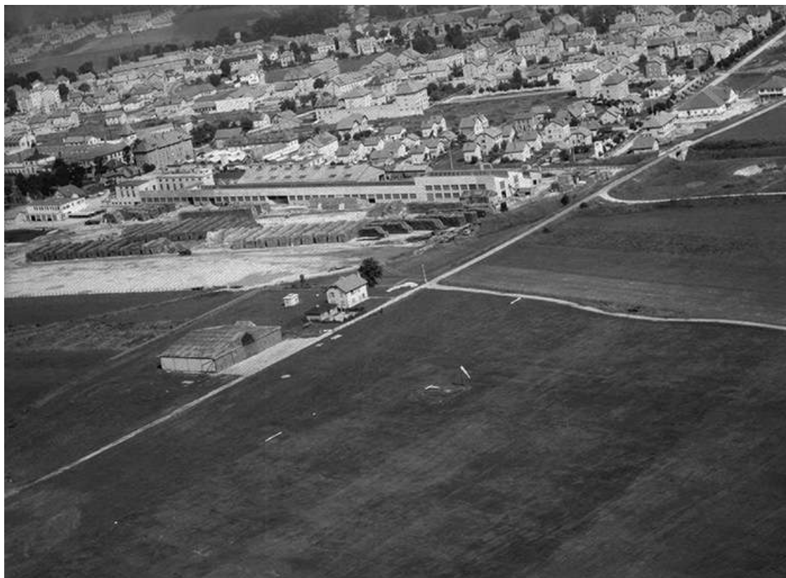
Le terrain d'aviation et les quartiers environnant en 1956. 25, Pontarlier