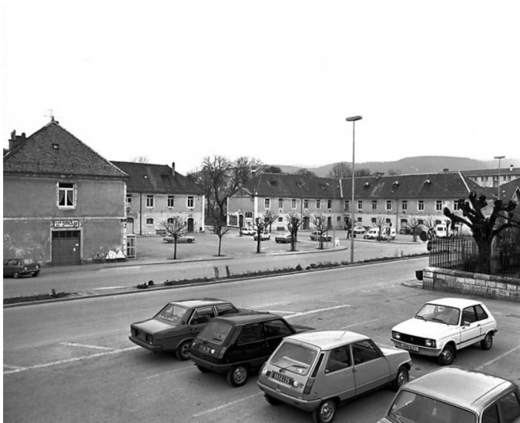
Vue d'ensemble sur la place.