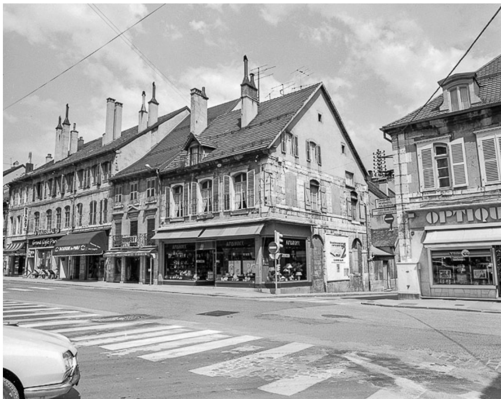
Façades sur rue. 25, Pontarlier