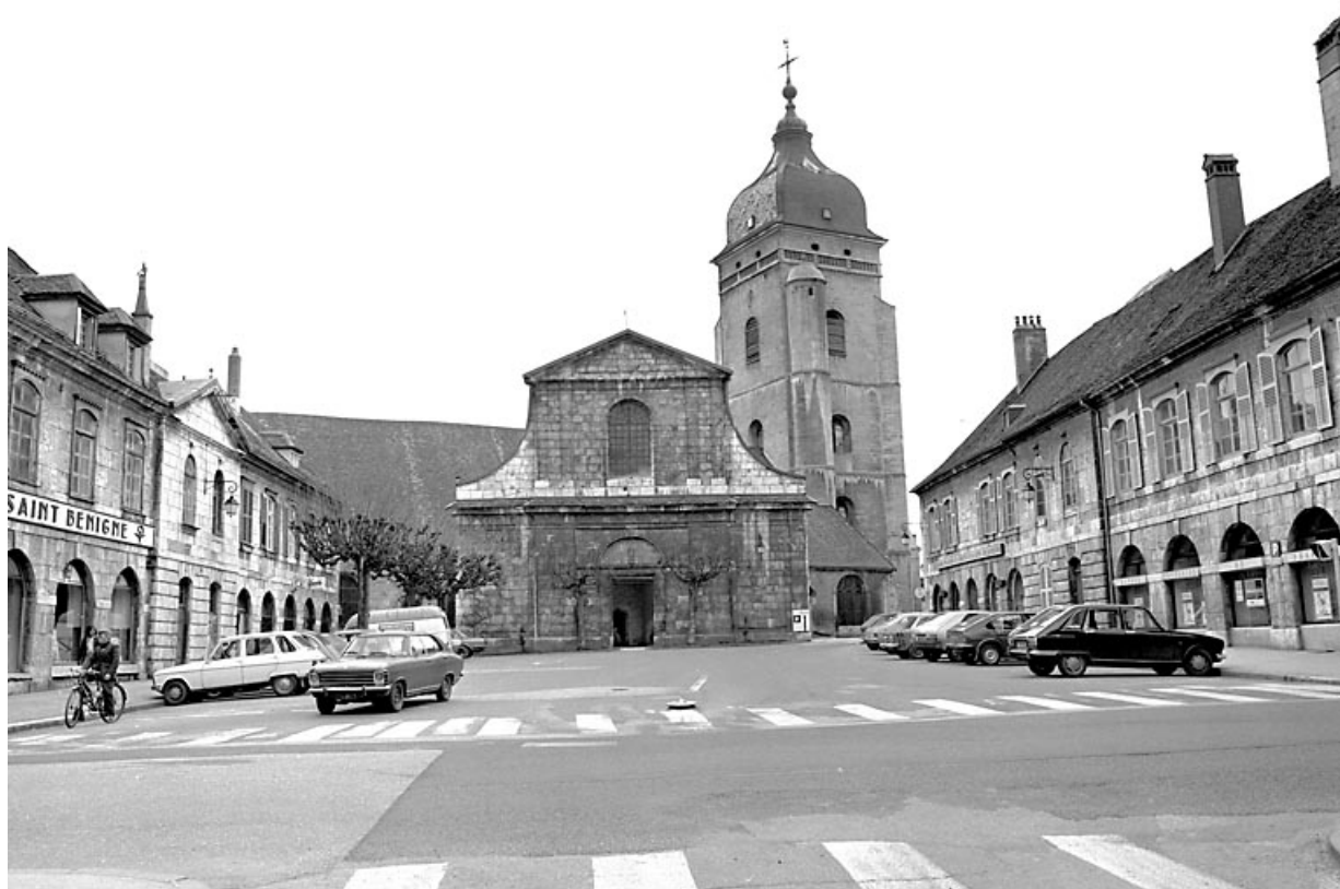
La place Saint-Bénigne en 1980, vue depuis la rue J. Mathez. 25, Pontarlier