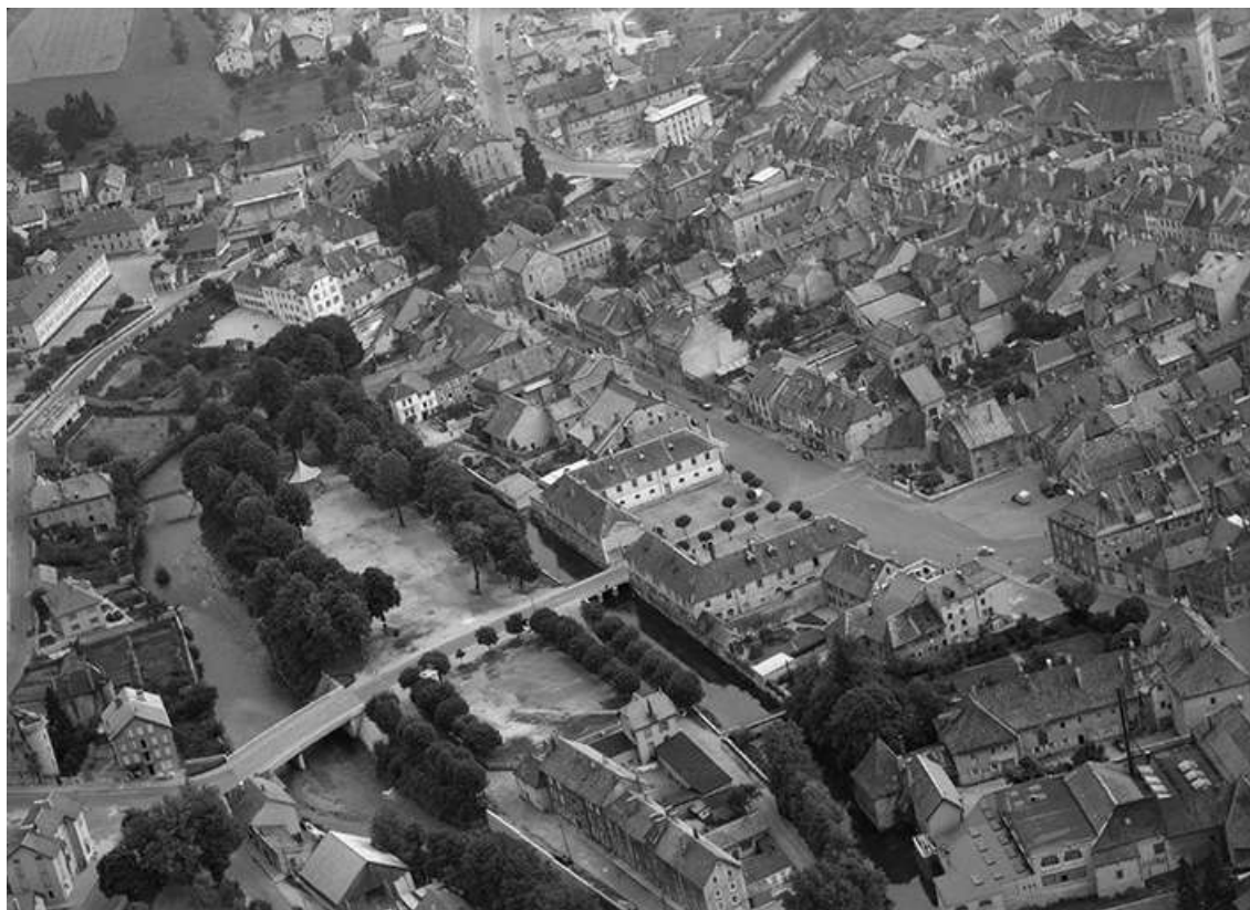
Le quai du Doubs et la place Jules Pagnier au centre en 1956. 25, Pontarlier