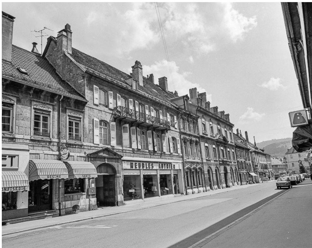
Façades sur rue.