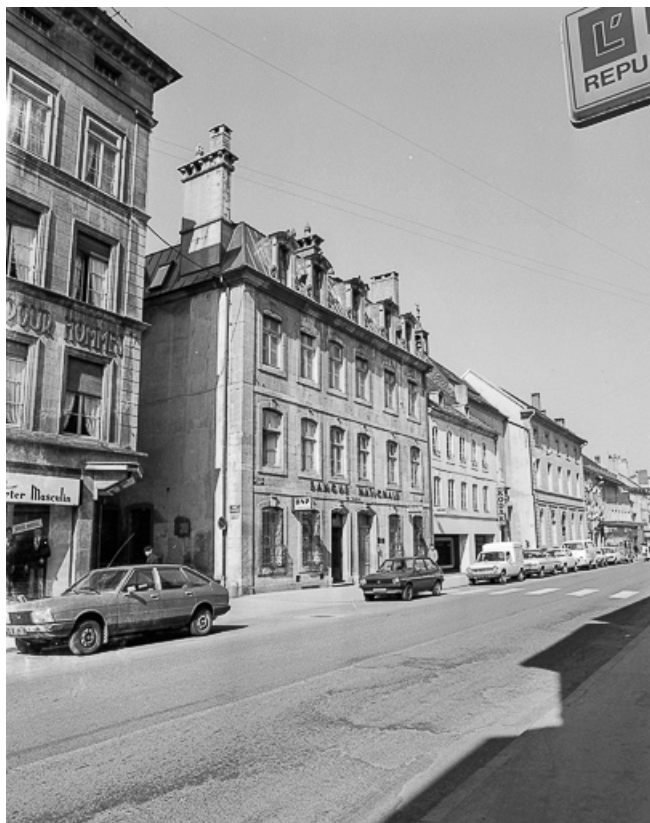
Façade sur rue. 25, Pontarlier