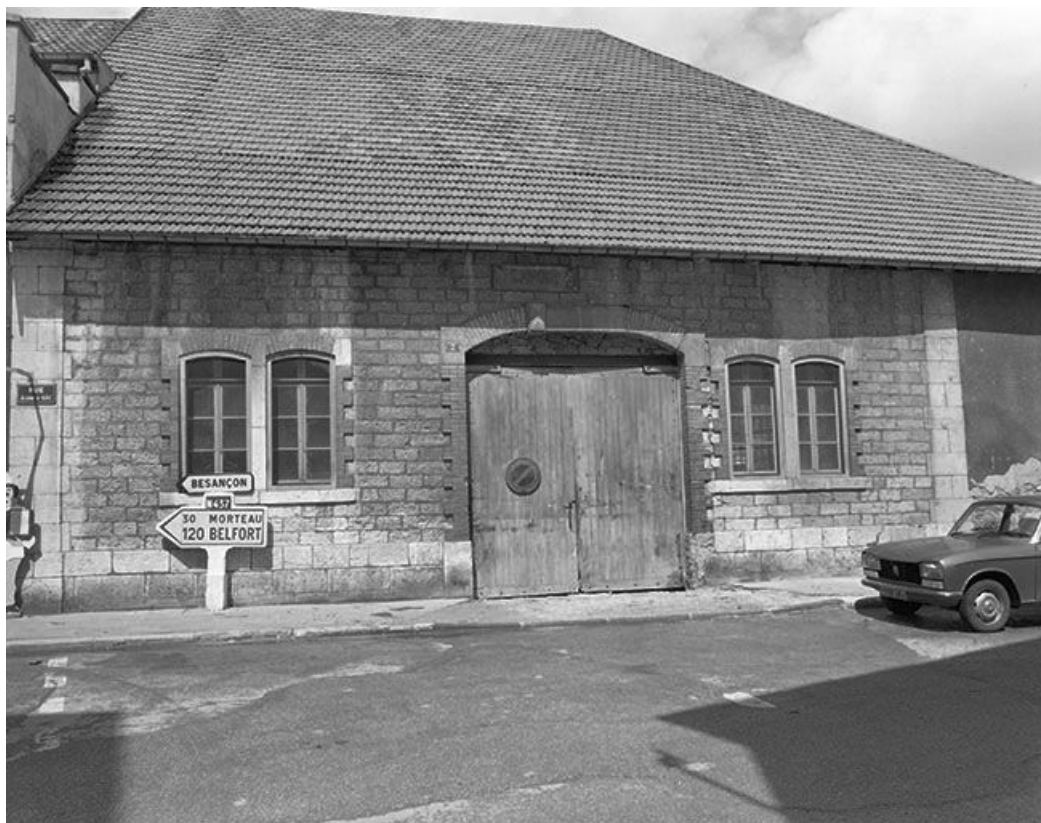
Façade sur rue, vue de face.