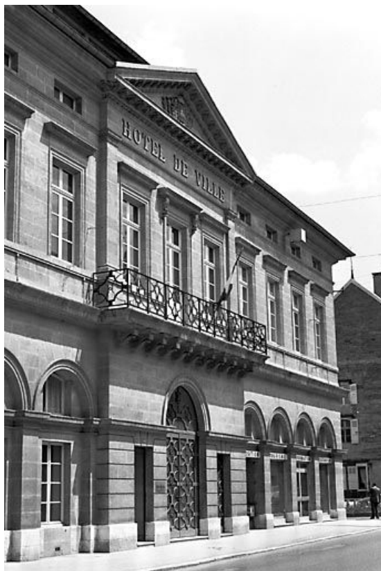
Façade sur la rue de la République. 25, Pontarlier