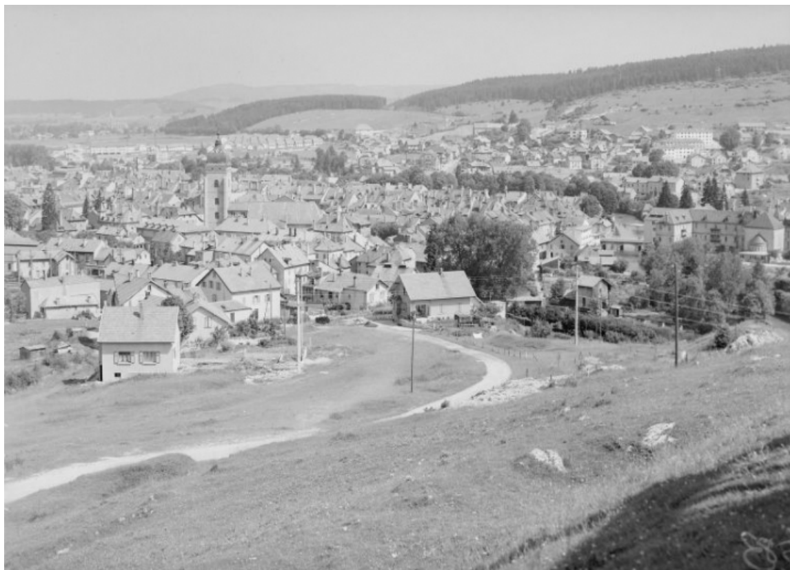
Vue de la ville avec l'église Saint-Bénigne [1e moitié du 20e siècle]. 25, Pontarlier