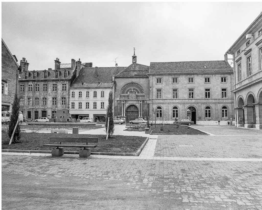
Vue d'ensemble de la chapelle.