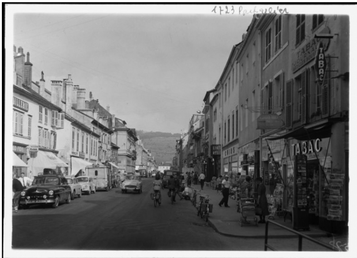
Rue de la République : vue à partir du n° 97, à l'opposé de la porte Saint-Pierre [1re moitié 20e siècle] 25, Pontarlier