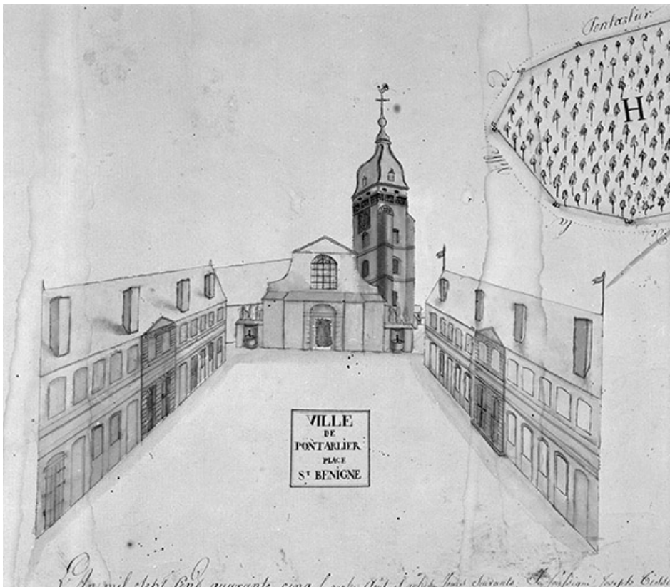
La place Saint-Bénigne en 1754.