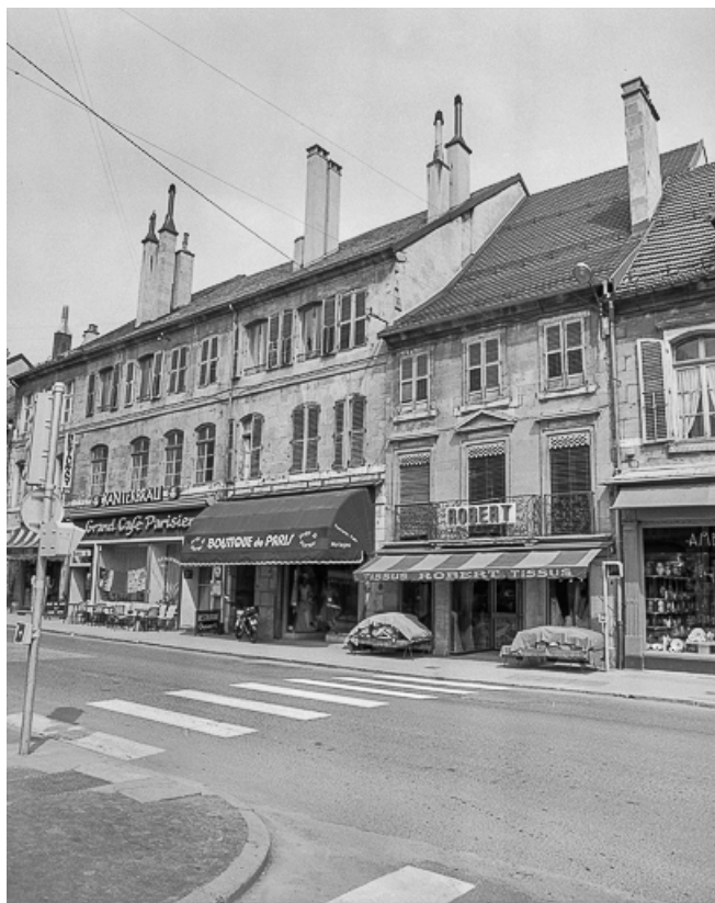
Façades sur rue.