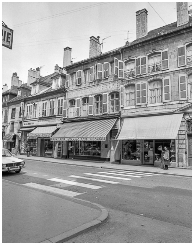
Façades sur rue.