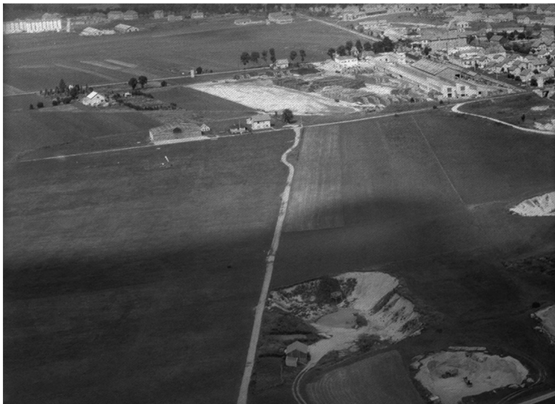
Le terrain d'aviation en 1956.