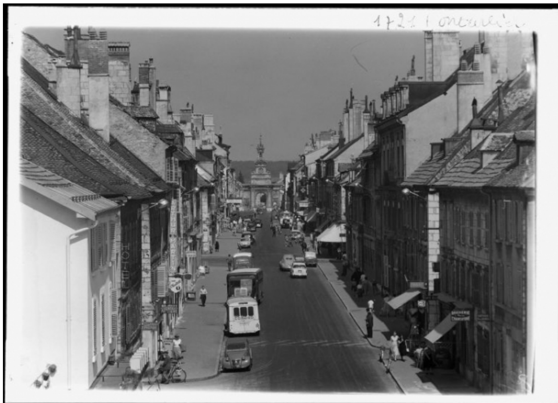
Rue de la République : vue plongeante en direction de la porte Saint-Pierre [1re moitié 20e siècle]. 25, Pontarlier