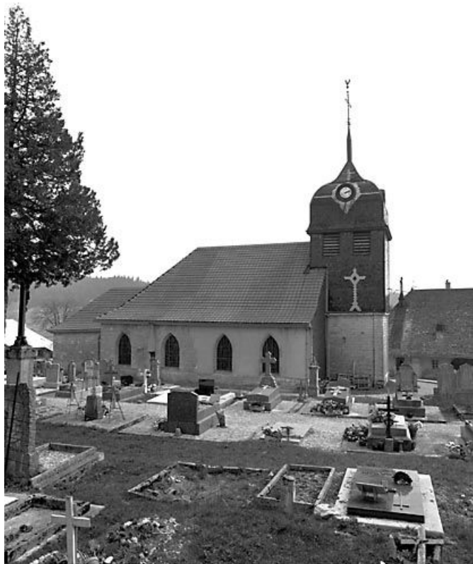
Vue de la façade latérale nord.