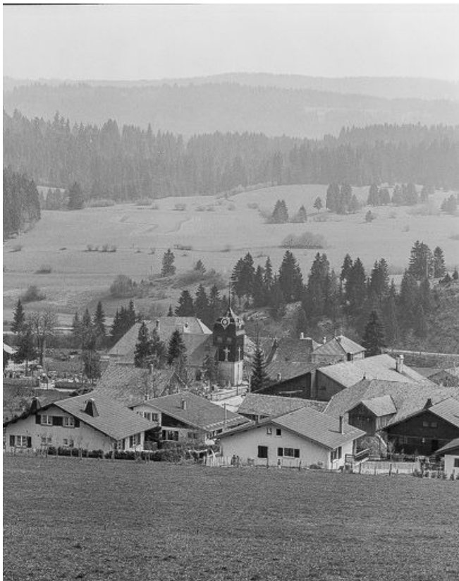
Vue sur le clocher.