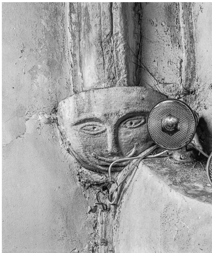
Détail culot : masque.