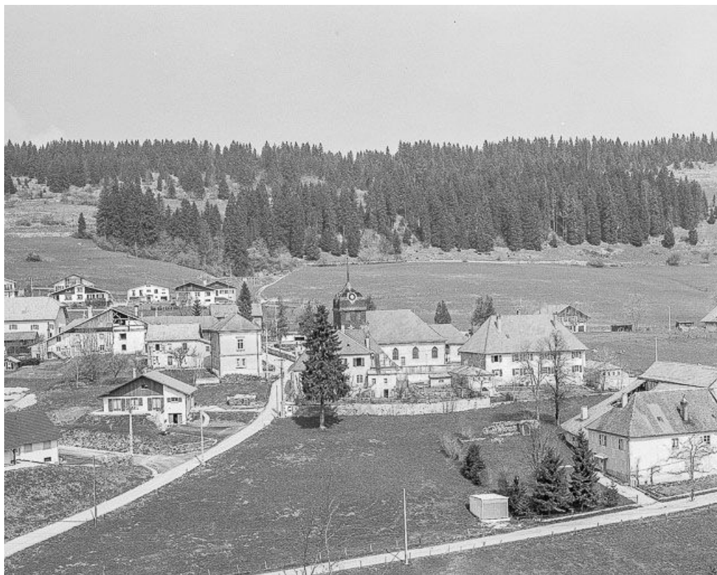
Vue de l'église dans le village.