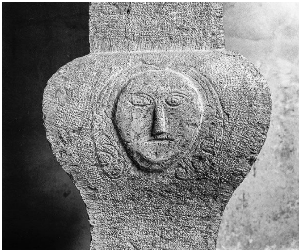
Détail culot : soleil.