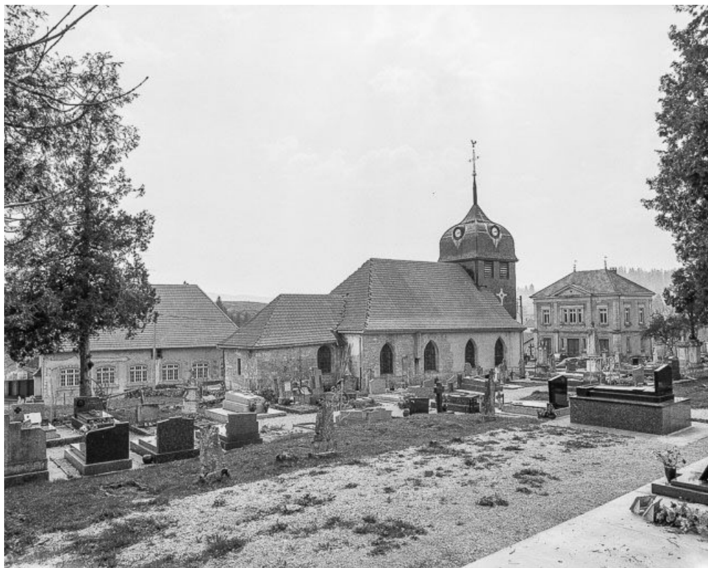
Vue d'ensemble depuis le cimetière.