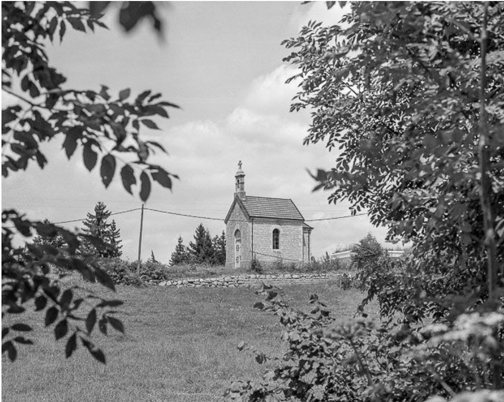
Vue de trois quarts.