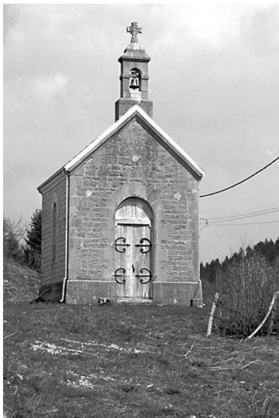
Vue de la façade antérieure.