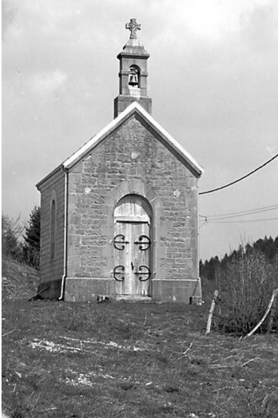
Vue de la façade antérieure.