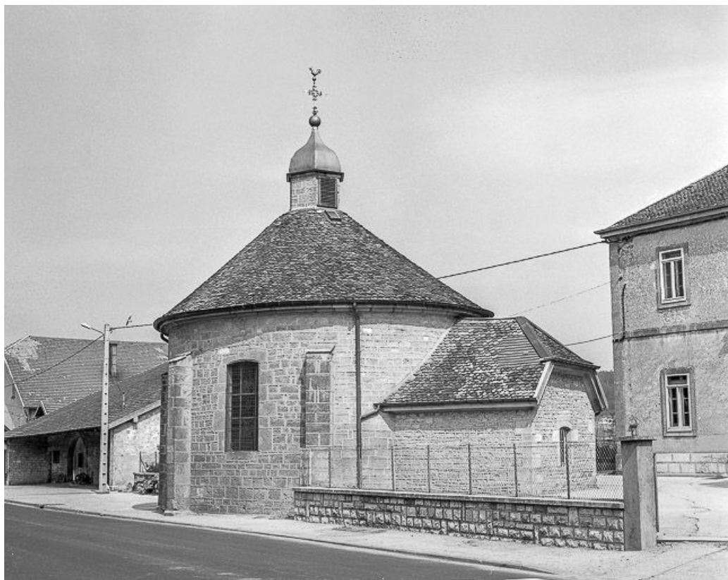
Vue sur le chevet.