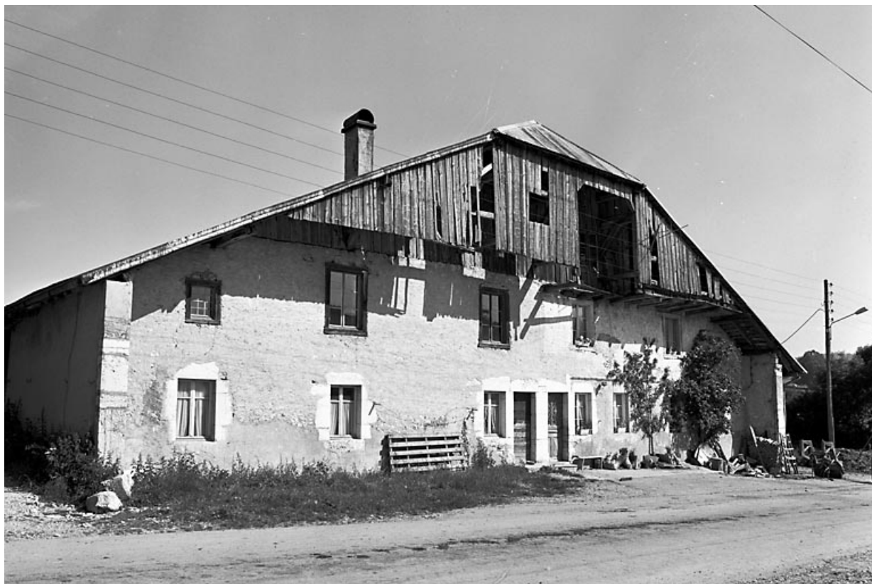
Pignon antérieur de la ferme.