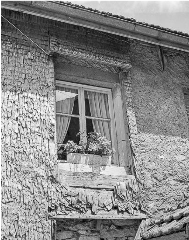
Pan de mur et fenêtre protégés par un essentage en bois.