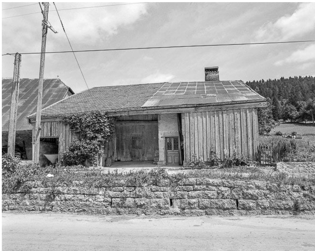
Façade sur rue.