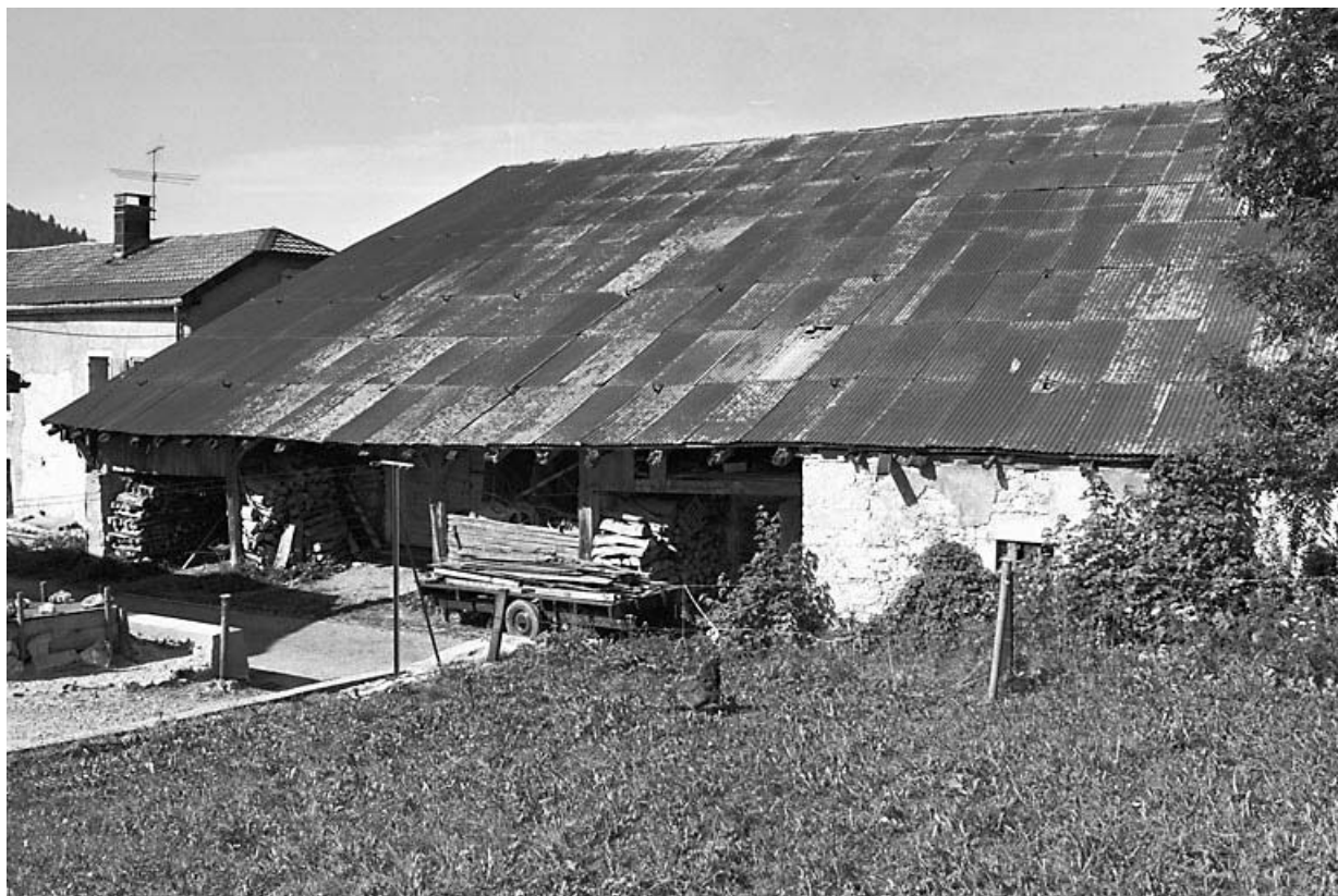
Mur goutterot et toiture.