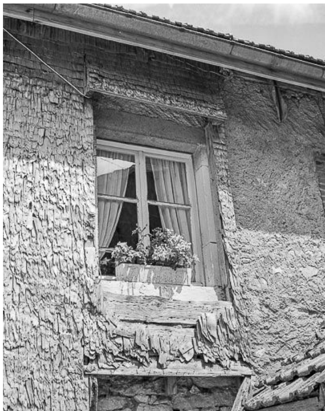
Pan de mur et fenêtre protégés par un essentage en bois.