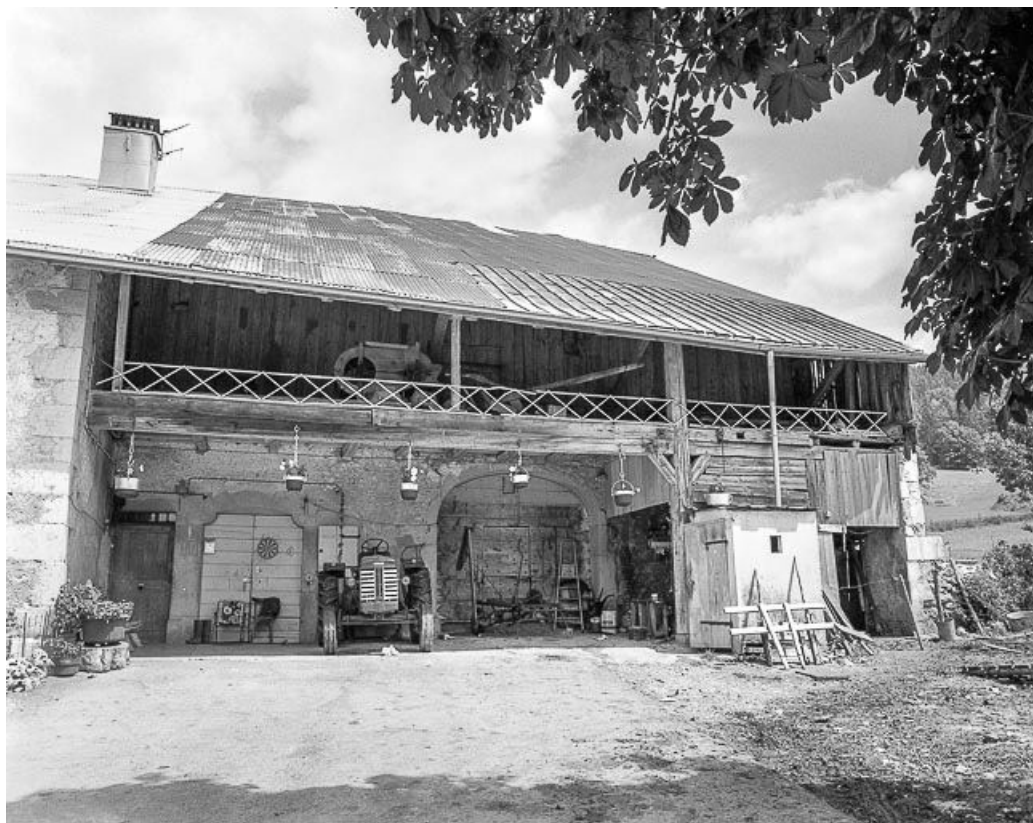
Portes d'entrées sur goutterot.