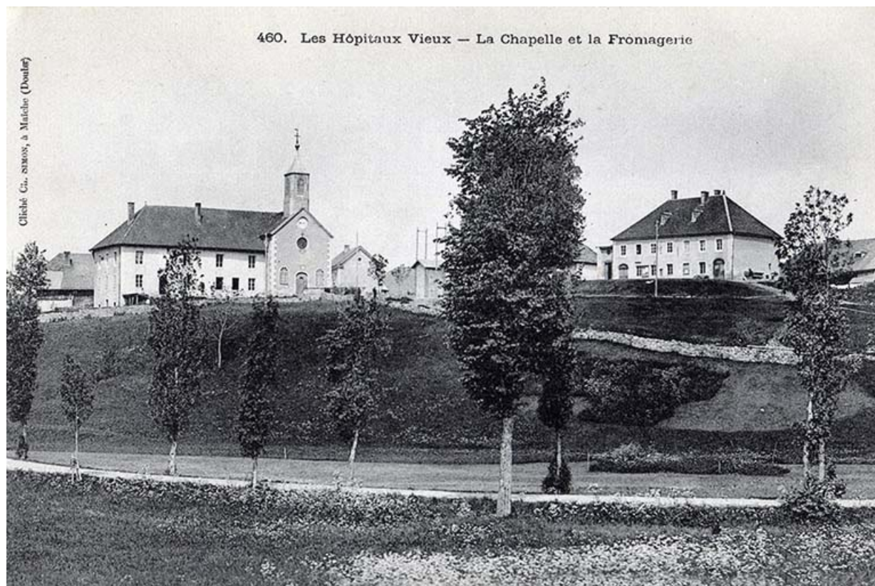
460. Les Hôpitaux-Vieux - La chapelle et la fromagerie, 1ère moitié 20e siècle. 25, Les Hôpitaux-Vieux