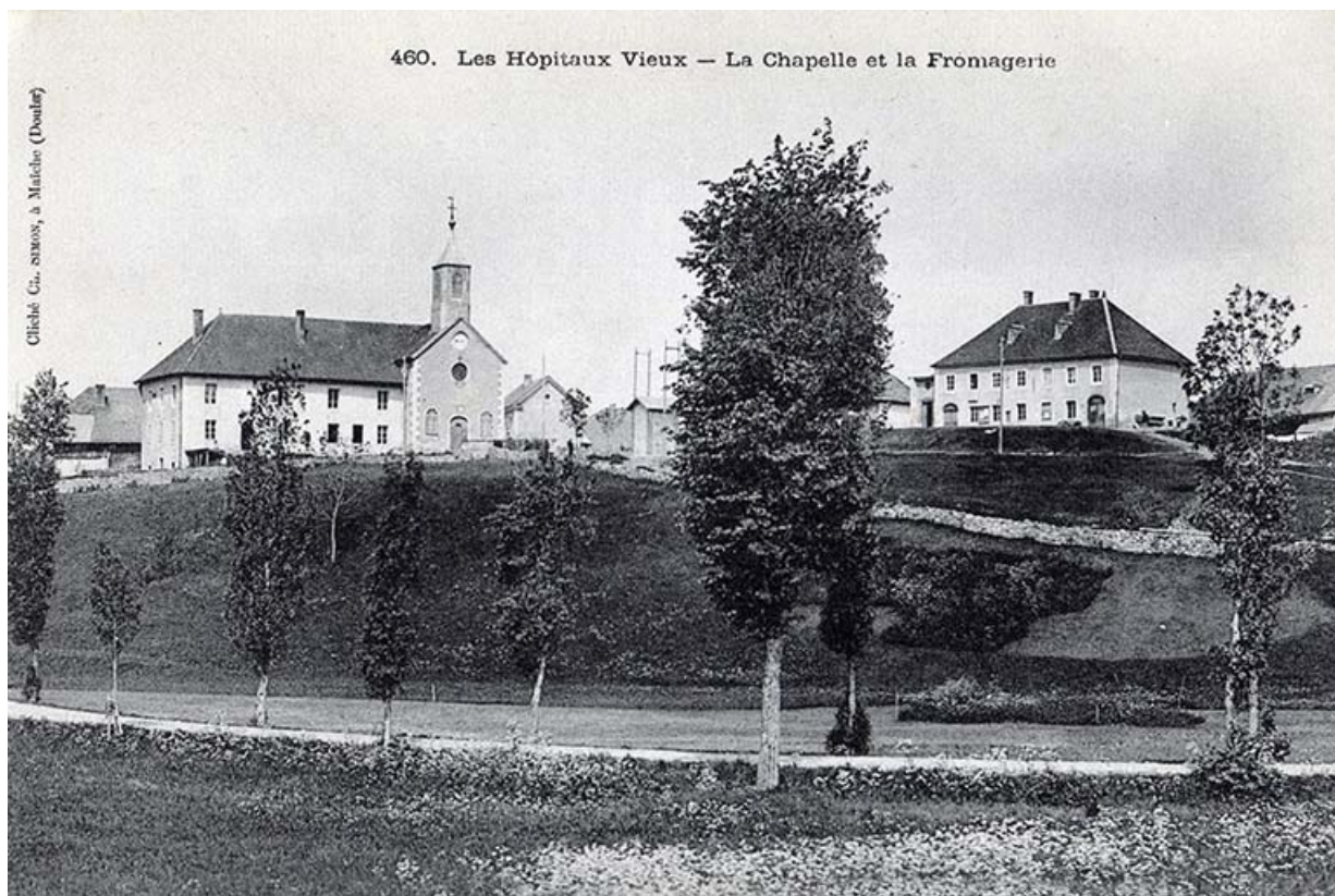
460. Les Hôpitaux-Vieux - La chapelle et la fromagerie, 1ère moitié 20e siècle. 25, Les Hôpitaux-Vieux

Carte postale, s.d. [1ère moitié 20e siècle, après 1903], par Simon, Ch. (photographe). Lieu de conservation : collection particulière : Jacques Donzé, Charquemont