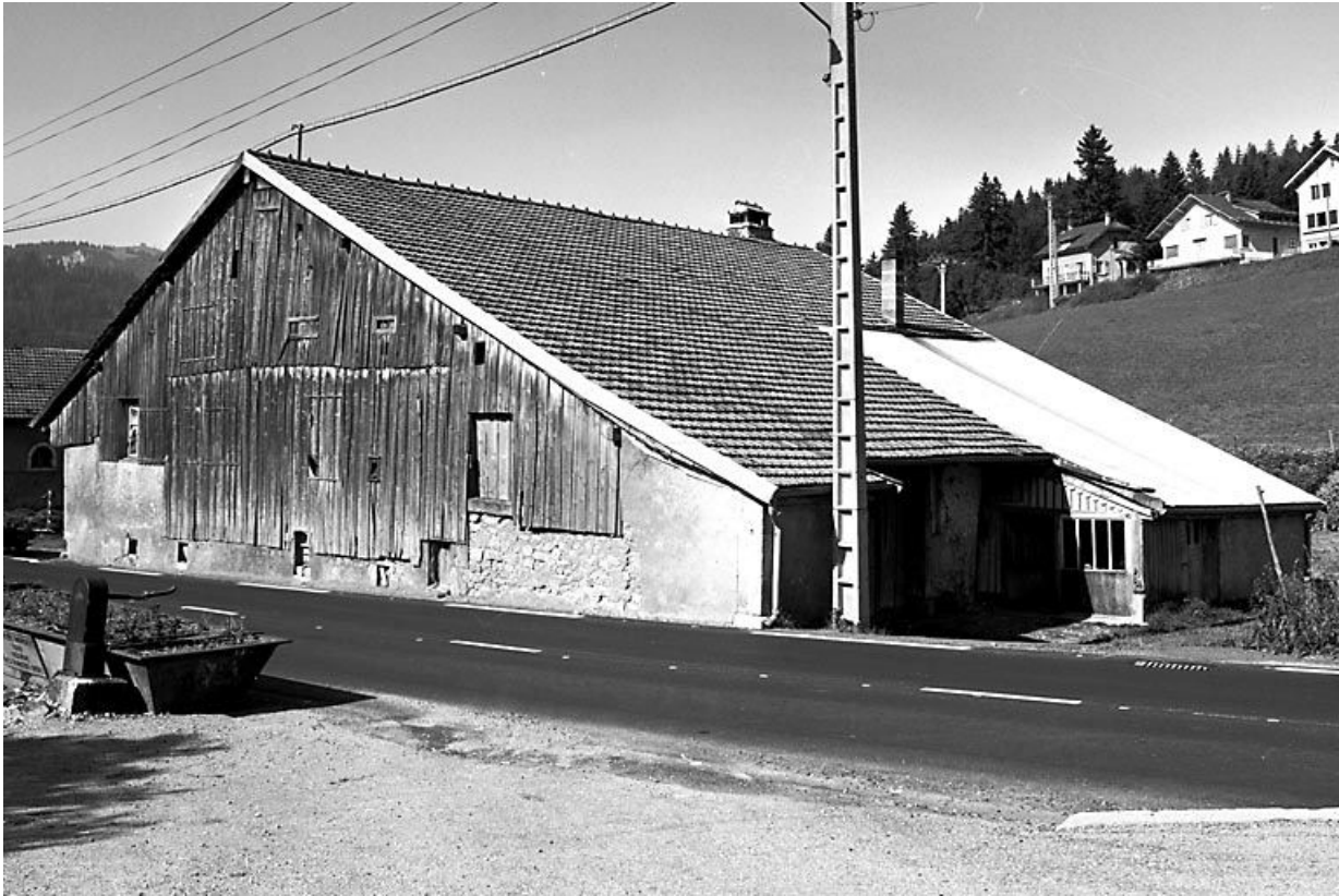
Vue de trois quarts.