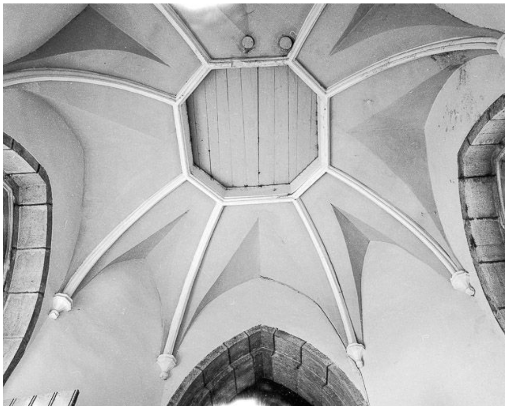
La voûte sous le clocher.