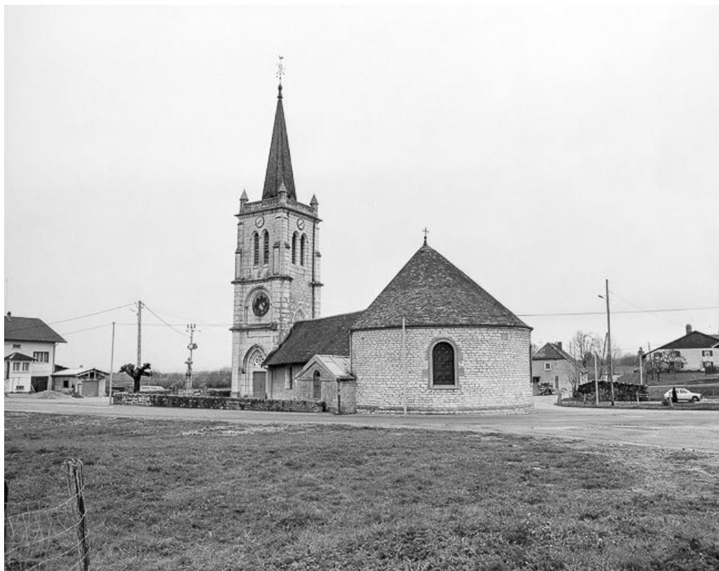
Vue générale sur le chevet.