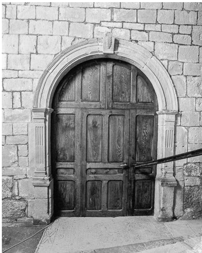
Le portail donnant sur la nef.