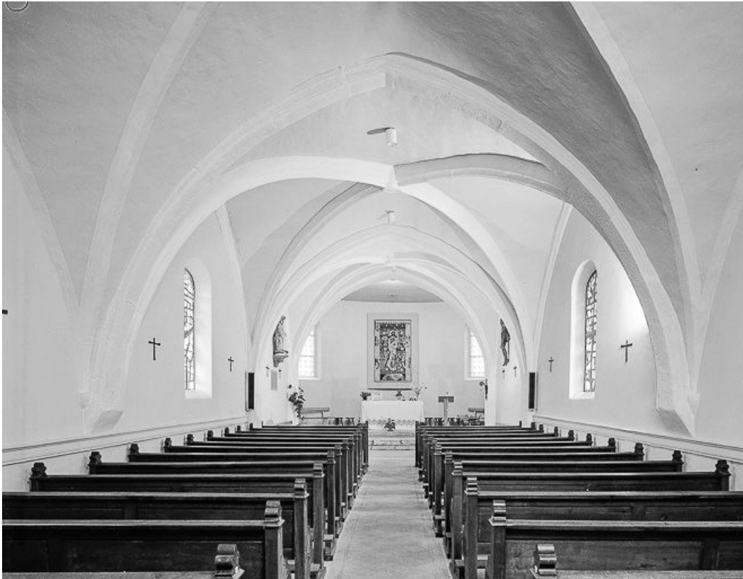
Vue de la nef et du chœur depuis l'entrée.