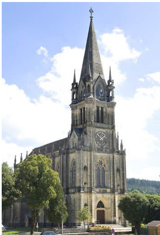
façade principale et clocher