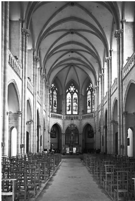
Vue de la nef et du choeur depuis l'entrée.