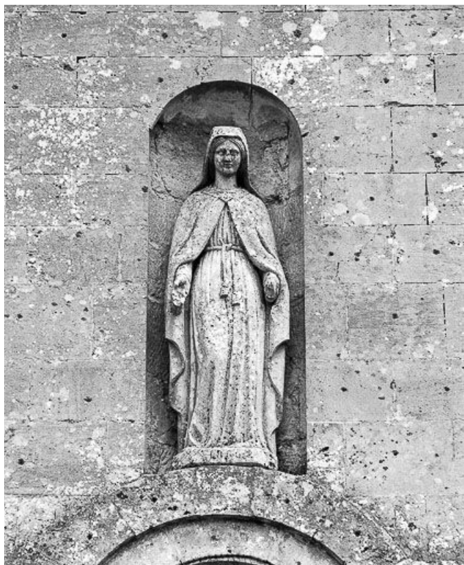
Ensemble de trois statues au-dessus du portail : la Vierge.