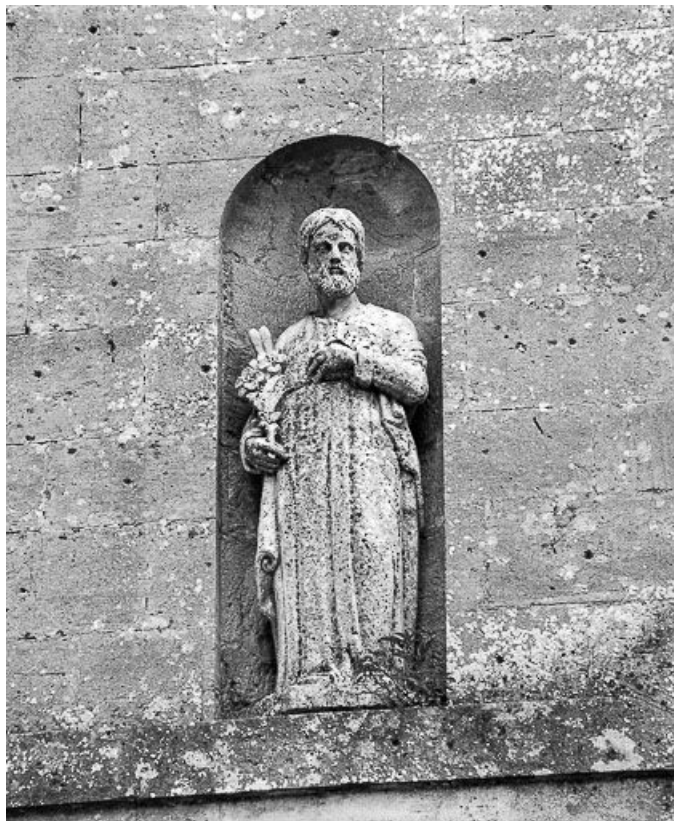
Ensemble de trois statues au-dessus du portail : saint Josph.