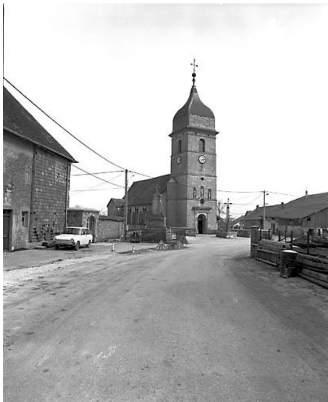
Vue sur le clocher.