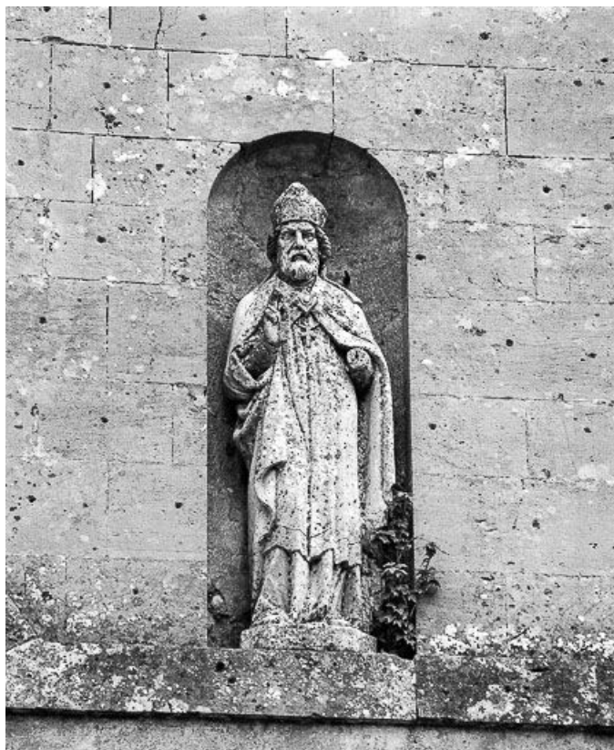
Ensemble de trois statues au-dessus du portail : saint Evêque.