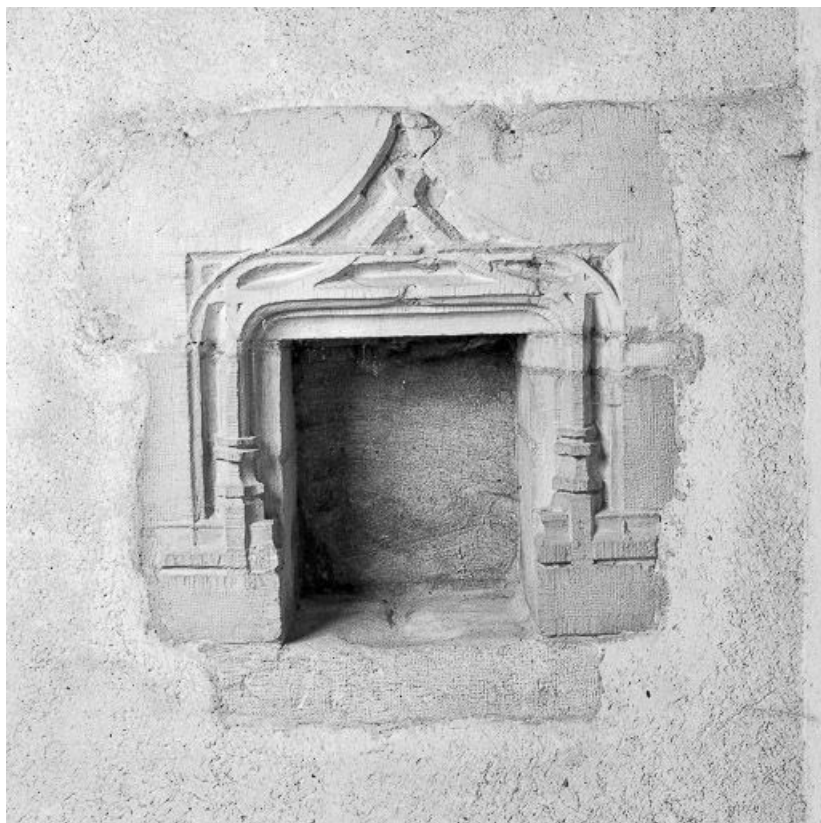
Niche dans un mur intérieur.