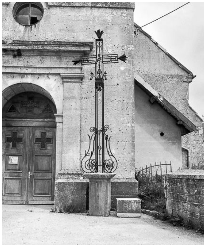
Croix de cimetière.