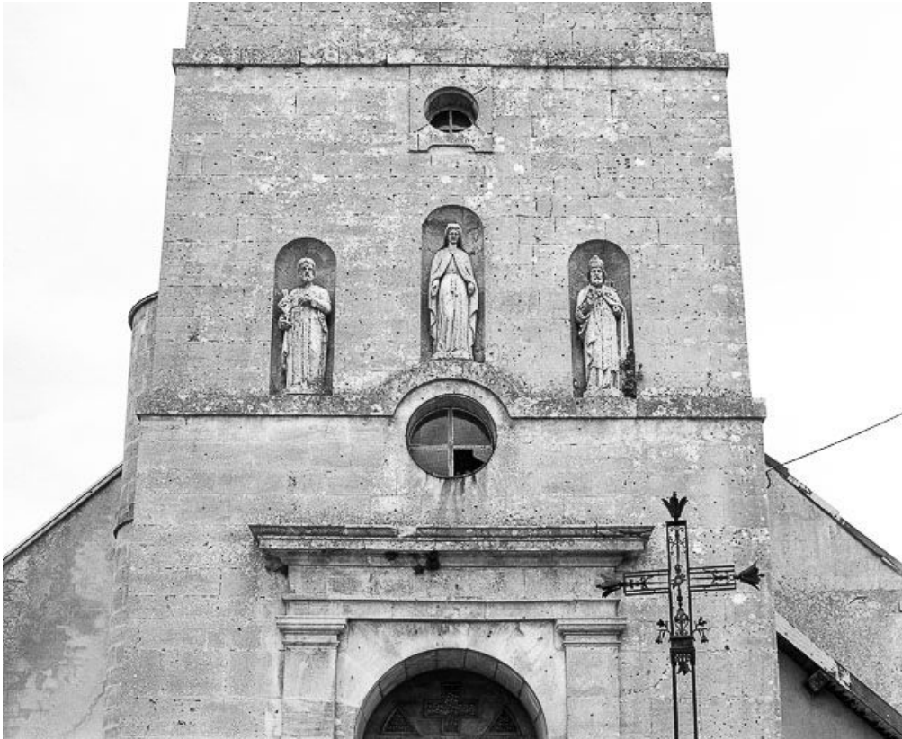
Ensemble de trois statues au-dessus du portail.