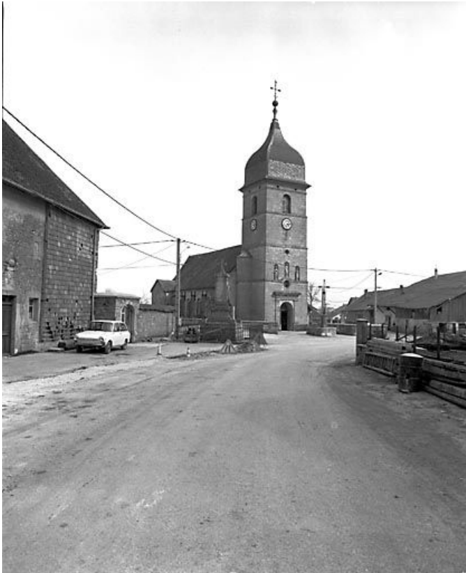
Vue sur le clocher.