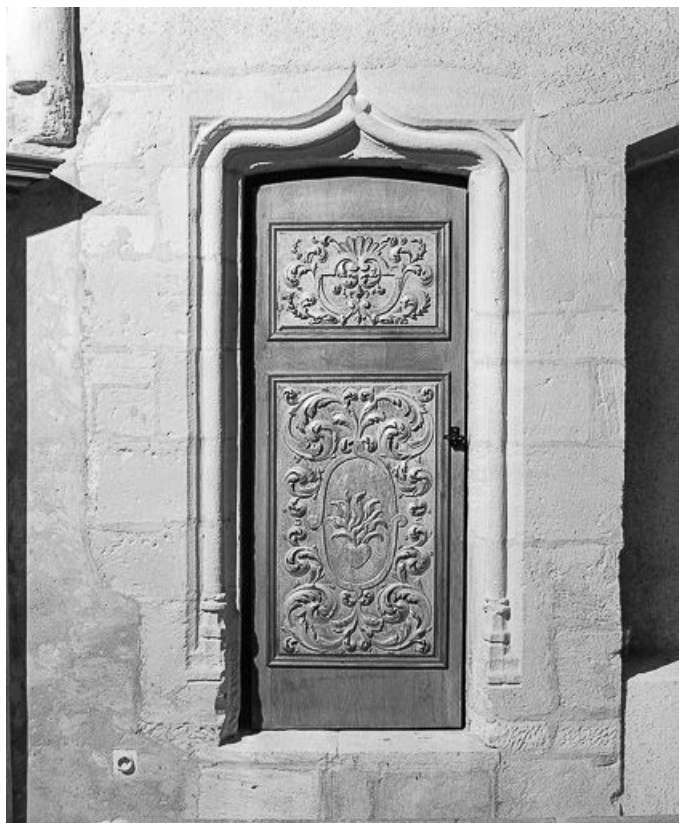
Porte de la sacristie.