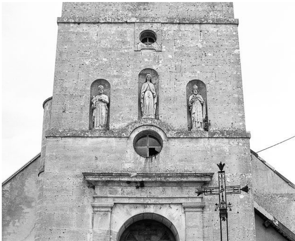
Ensemble de trois statues au-dessus du portail.