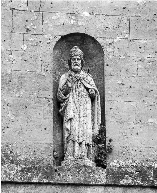
Ensemble de trois statues au-dessus du portail : saint Evêque.