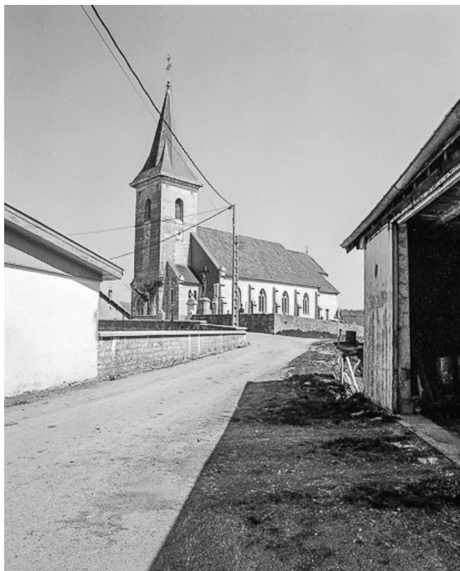
Vue en perspective sur le clocher et la façade sud.