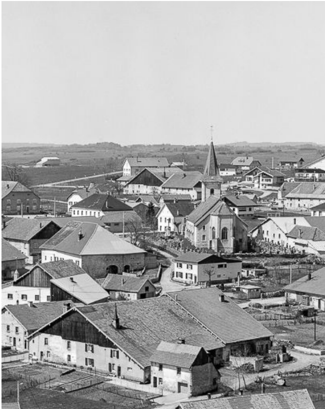
Implantation de l'église dans le village.