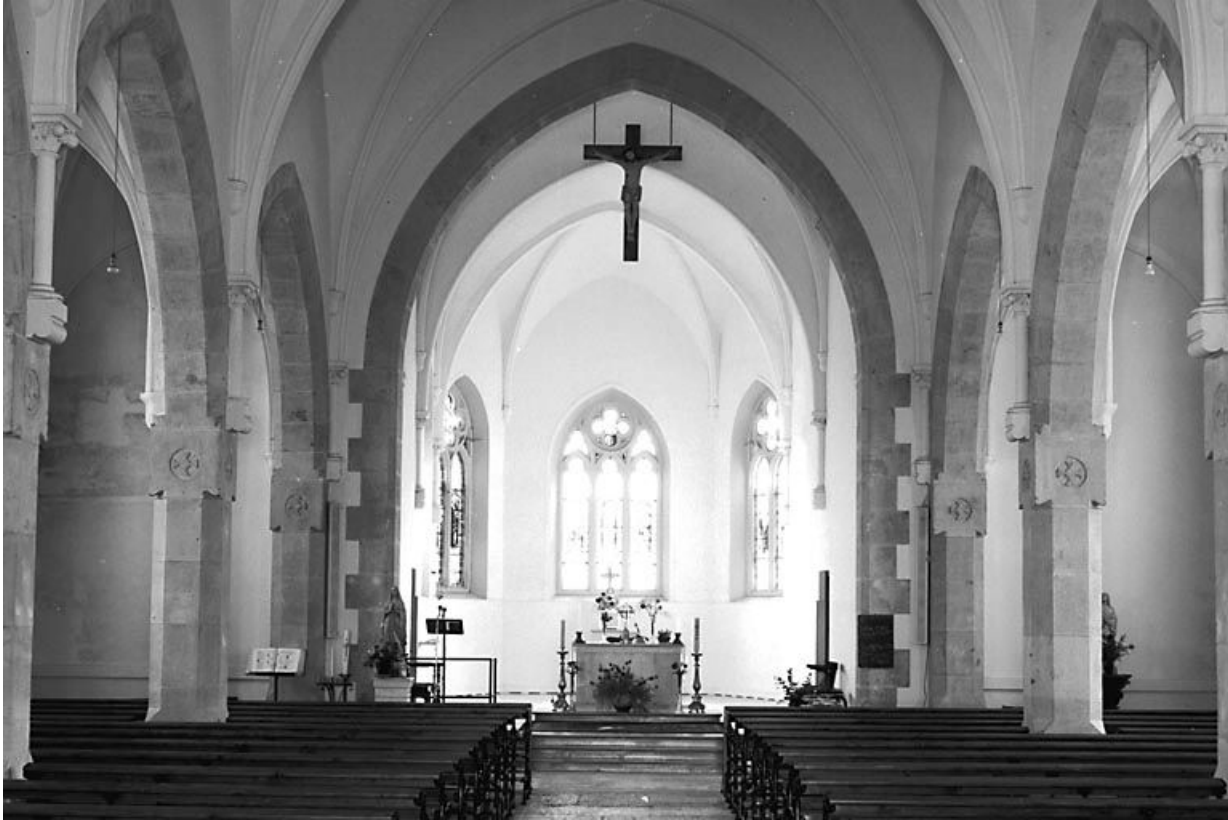
Vue de la nef et du choeur depuis l'entrée.