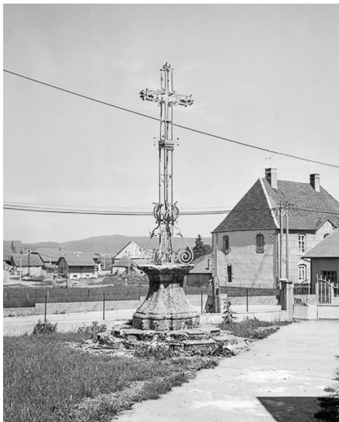
Croix de cimetière.