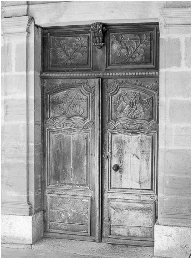
Détail de la deuxième porte d'entrée.