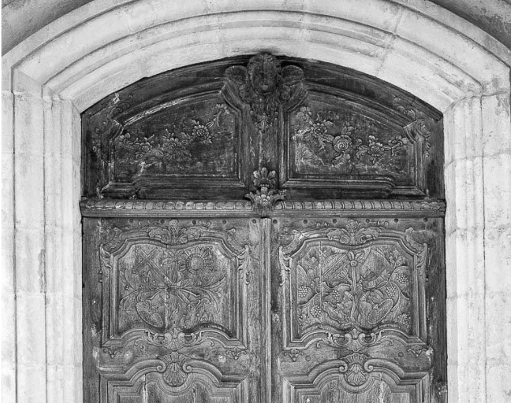
Détail de la première porte d'entrée.