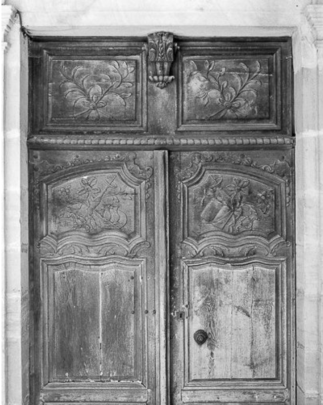
Vue d'ensemble de la deuxième porte d'entrée.