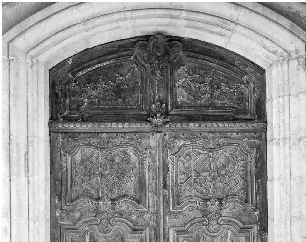
Détail de la première porte d'entrée.