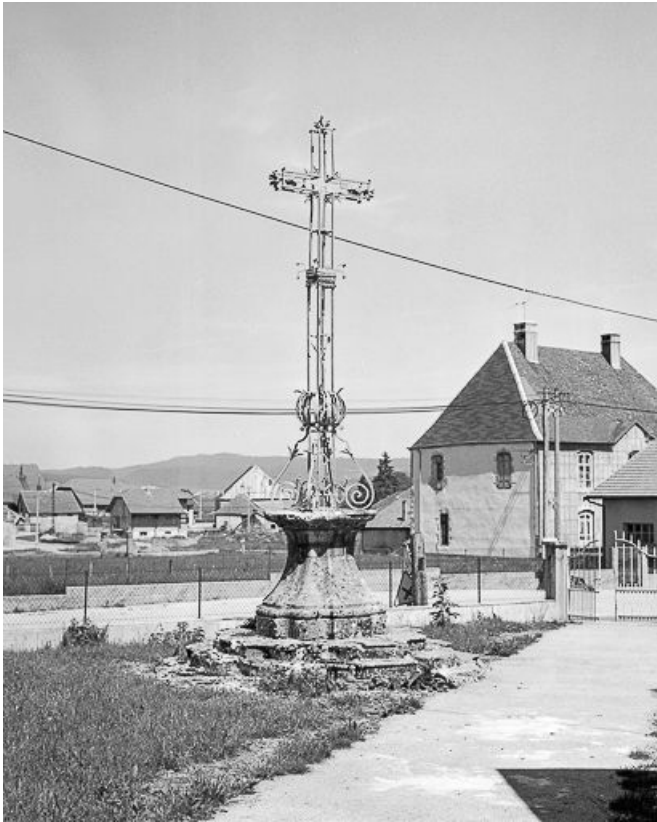
Croix de cimetière.