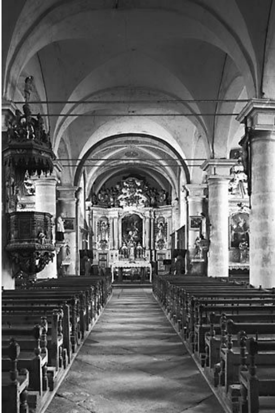
La nef et le chœur vus depuis l'entrée.