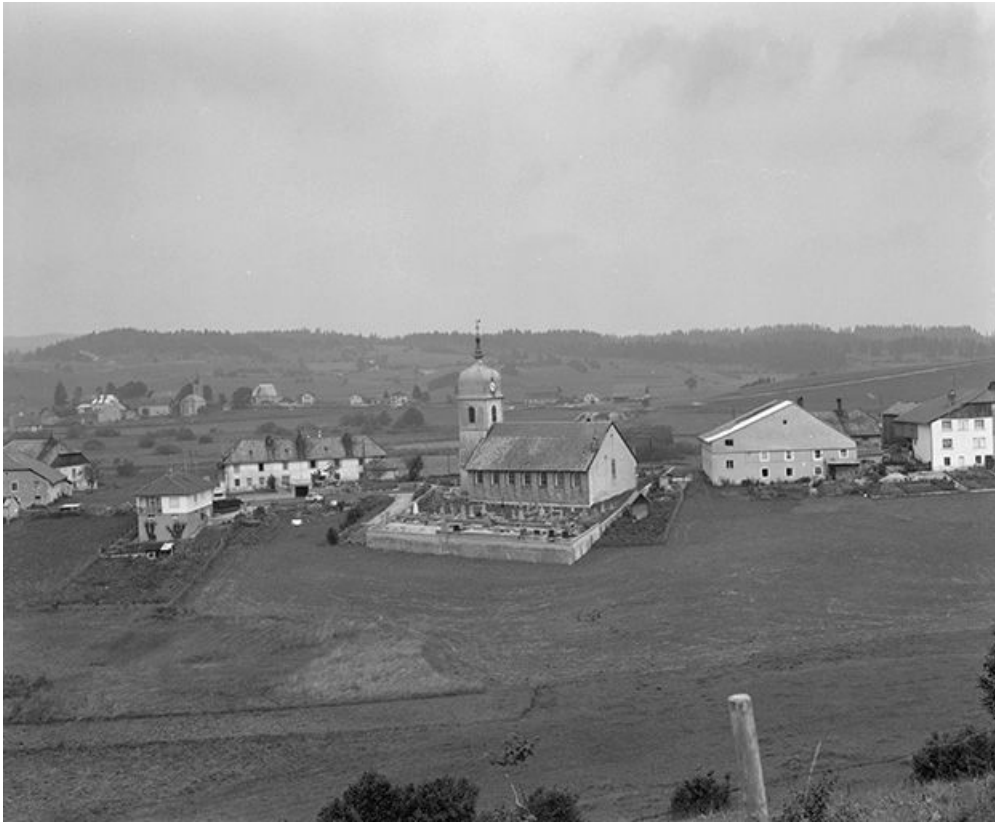
Vue d'ensemble du village.