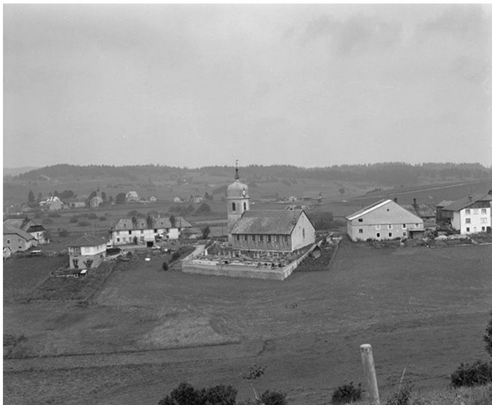
Vue d'ensemble du village.