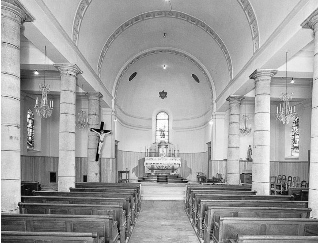
Intérieur : nef et chœur vus depuis l'entrée.

25, Les Villedieu, lieudit : Villedieu-les-Mouthe