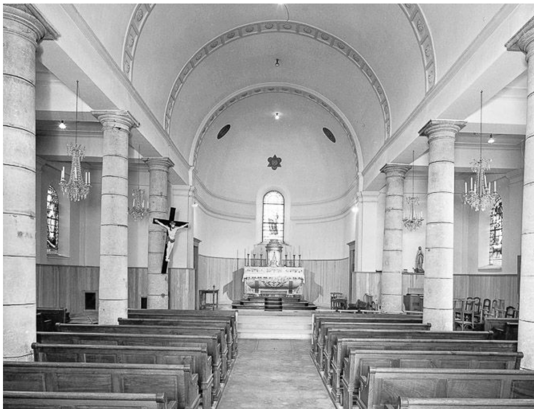
Intérieur : nef et chœur vus depuis l'entrée.

25, Les Villedieu, lieudit : Villedieu-les-Mouthe