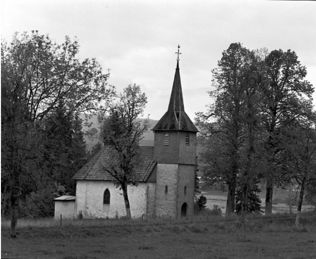
Vue générale de trois quarts gauche.

25, Labergement-Sainte-Marie, lieudit : Grange Neuve