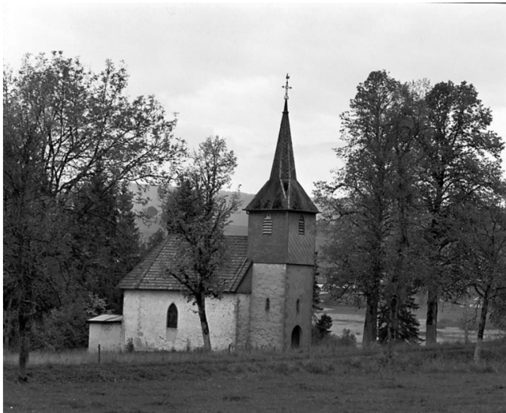
Vue générale de trois quarts gauche.

25, Labergement-Sainte-Marie, lieudit : Grange Neuve