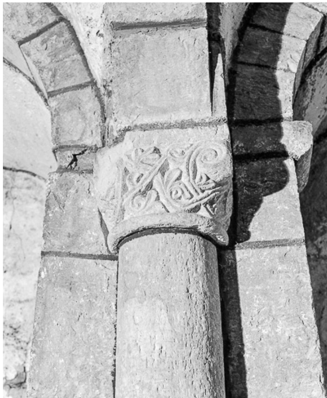
Crypte : chapiteau du mur ouest, côté nord. 25, Jougne, lieudit : Saint-Maurice