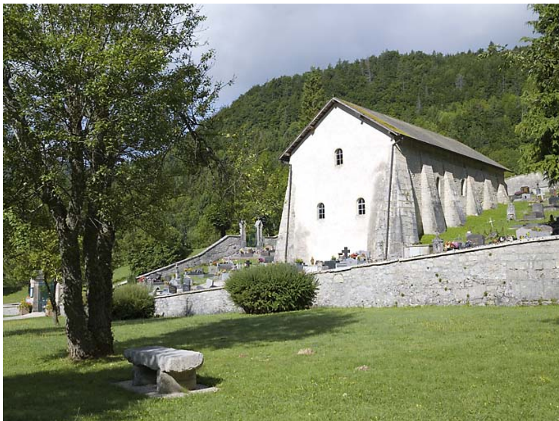
Vue générale, depuis le sud-est.