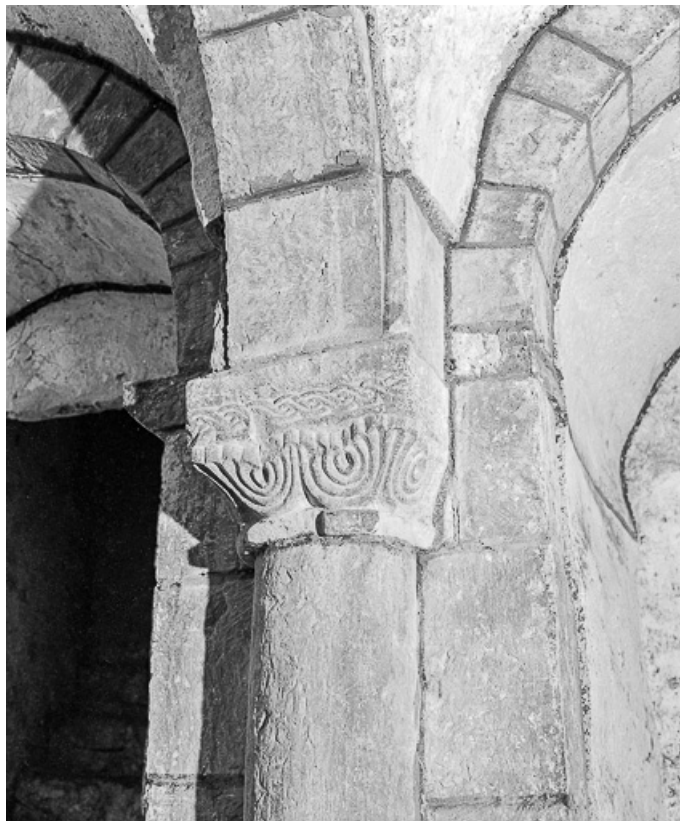
Crypte : chapiteau du mur ouest, côté sud. 25, Jougne, lieudit : Saint-Maurice