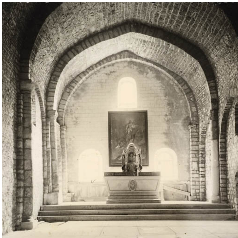
Chapelle Saint-Maurice [le chœur], [20e siècle]. 25, Jougne, lieudit : Saint-Maurice