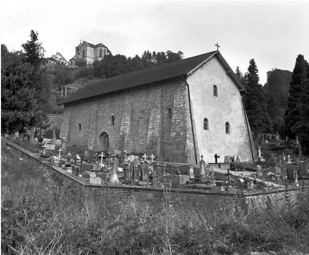
Façades sud et est.