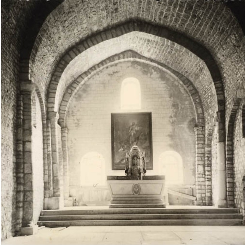
Chapelle Saint-Maurice [le chœur], [20e siècle]. 25, Jougne, lieudit : Saint-Maurice