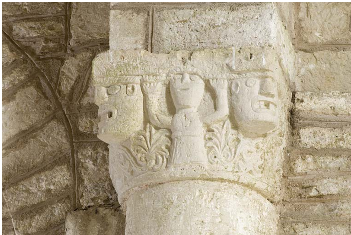
Intérieur : détail du chapiteau avec un personnage.