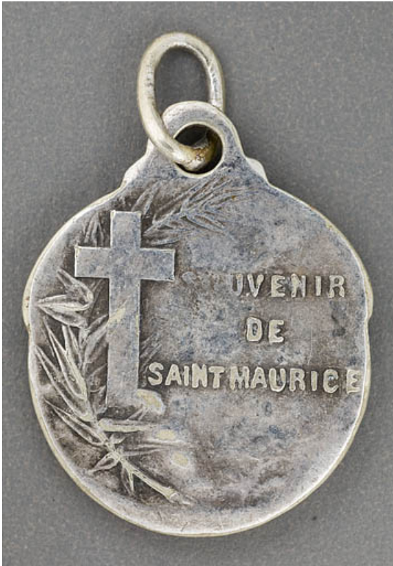
Médaille de saint Maurice : revers.