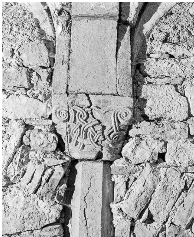
Crypte : chapiteau du mur est, côté nord.