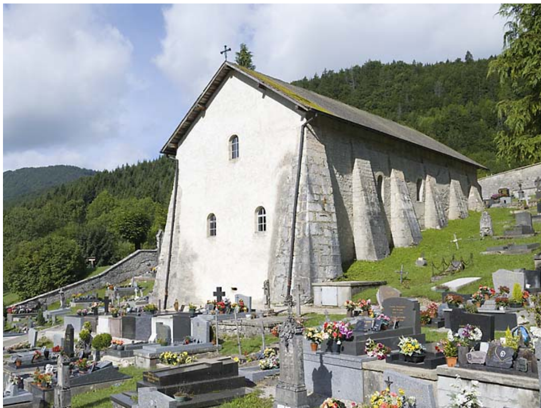
Vue générale rapprochée, depuis le sud-est.