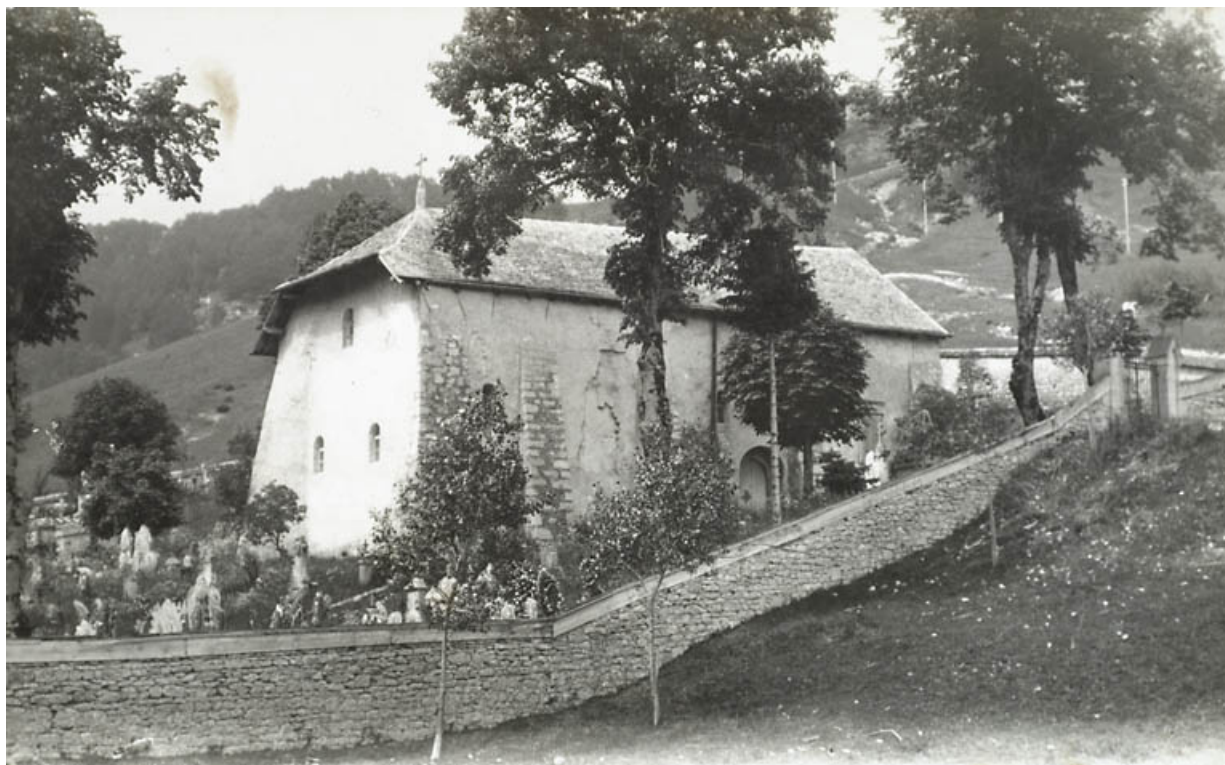
Façades latérale gauche et postérieure.