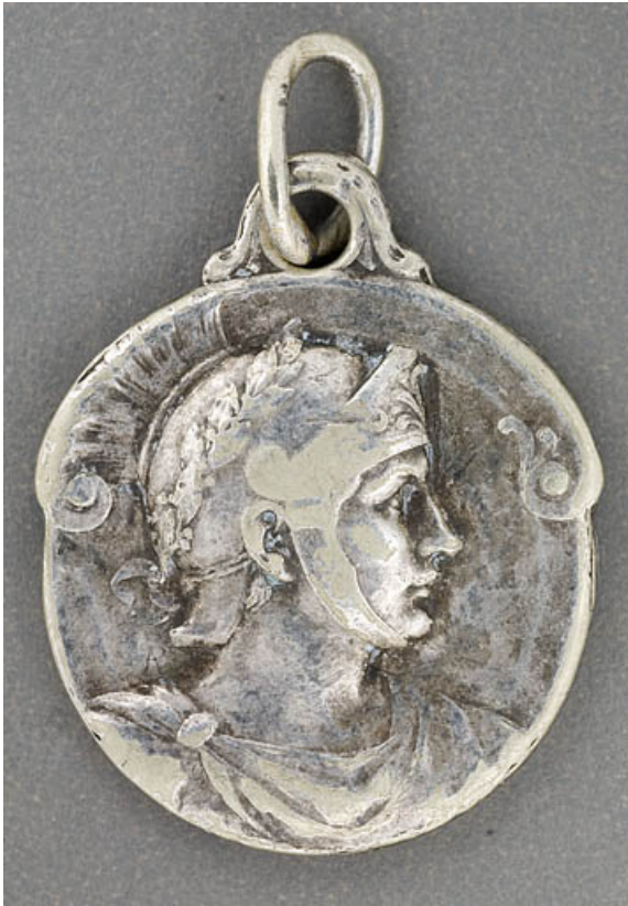
Médailon de saint Maurice : avers.