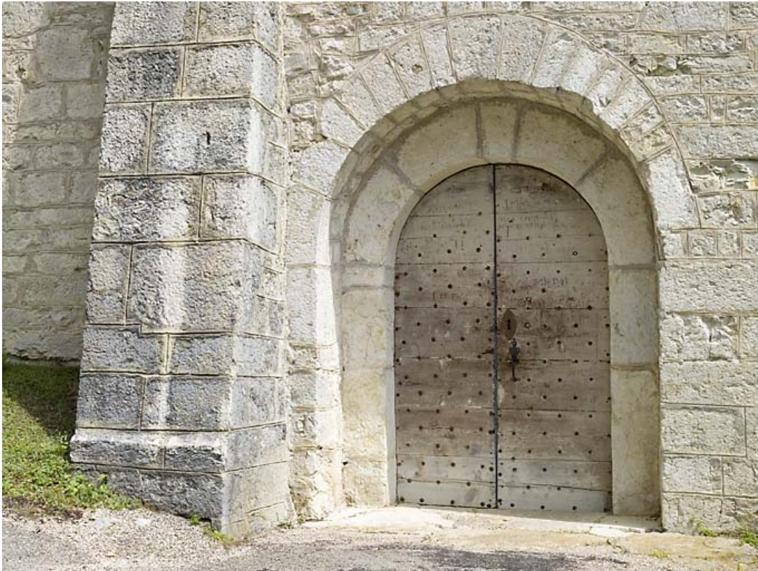
Façade sud : entrée.