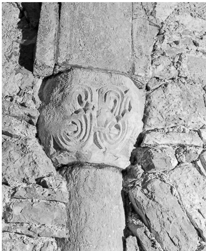
Crypte : chapiteau du mur est, côté sud.