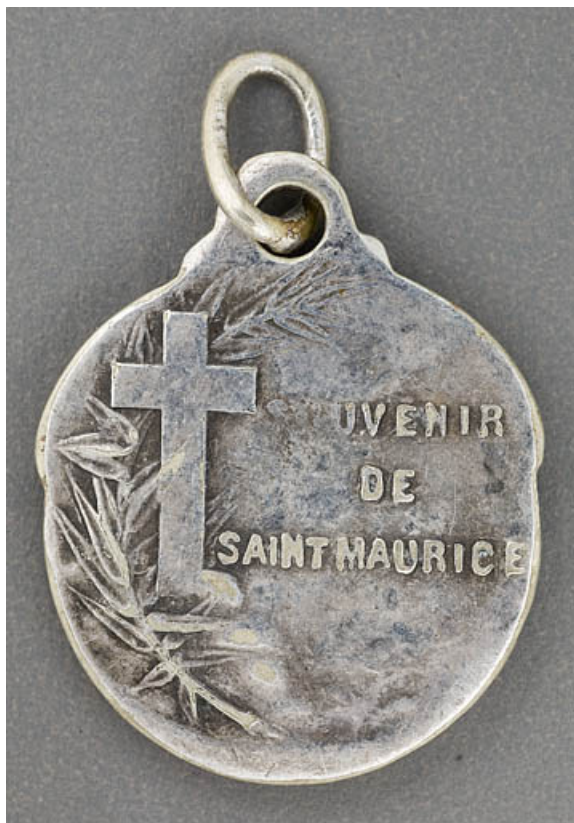
Médaille de saint Maurice : revers.