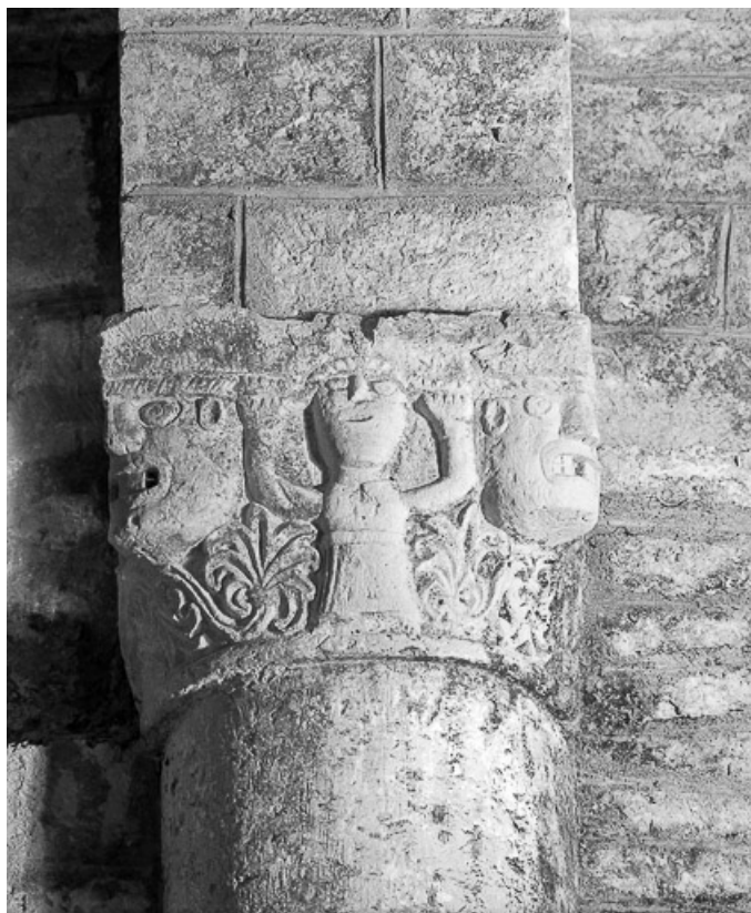
Intérieur : détail du chapiteau avec un personnage.