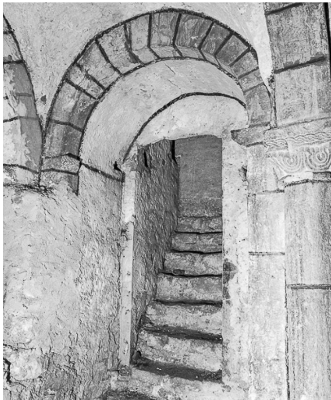
Crypte : escalier menant à la nef.