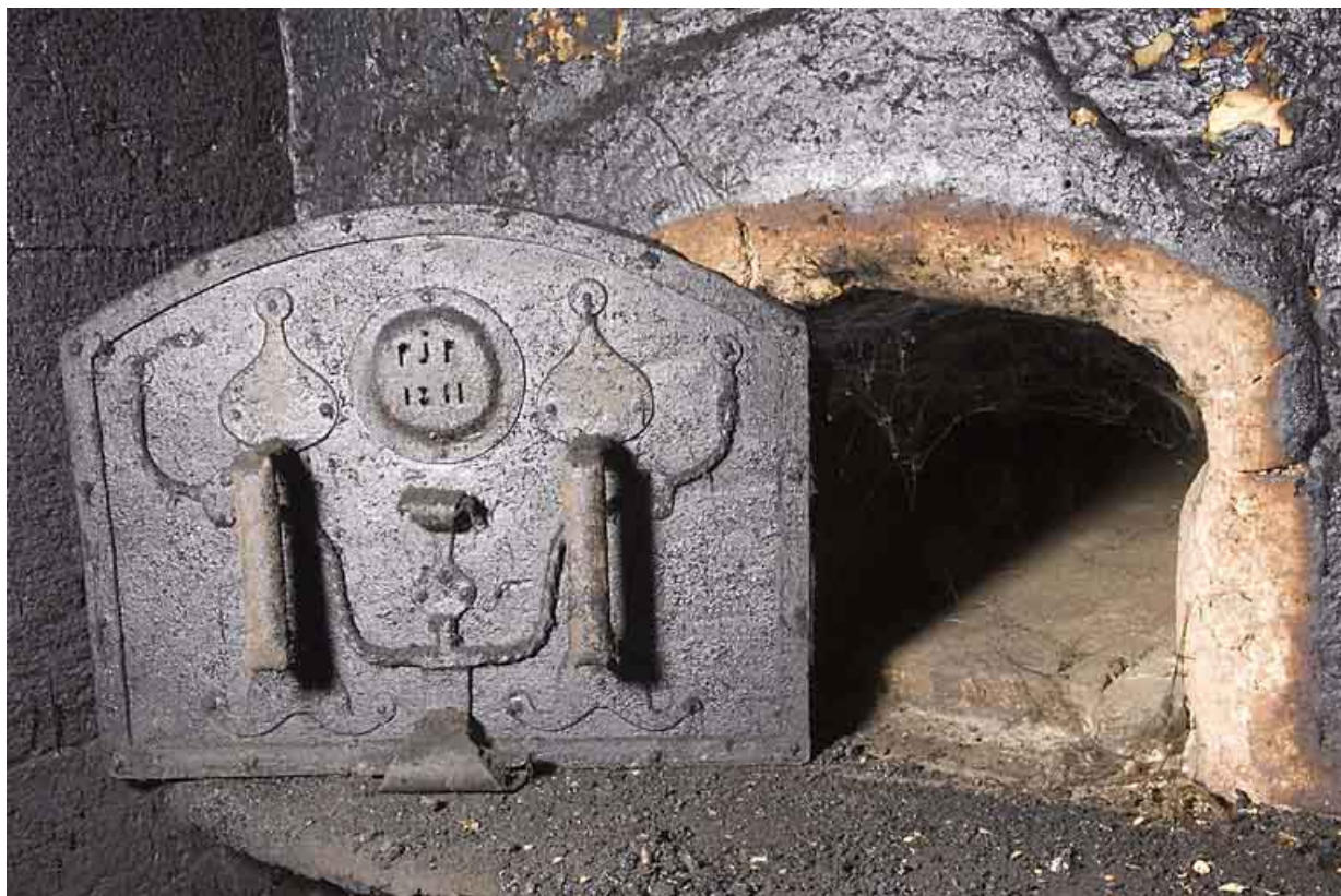
Cuisine du 2nd étage : four à pain, porte ouverte (datée 1811 et avec les initiales PJP). 25, Jougne, 17 rue du Faubourg