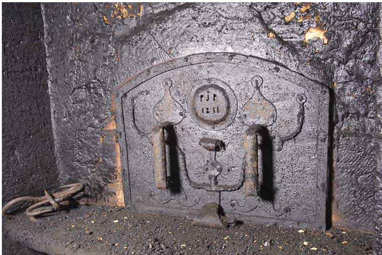
Cuisine du 2nd étage : four à pain, porte fermée (datée 1811 et avec les initiales PJP). 25, Jougne, 17 rue du Faubourg