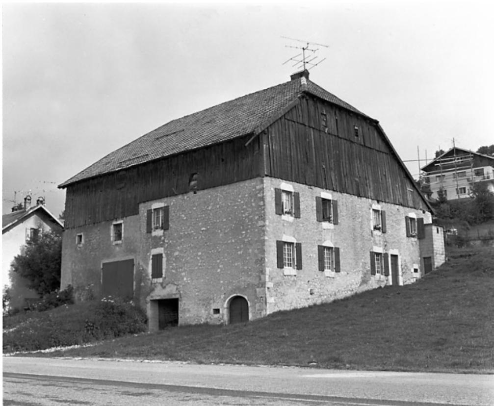
Vue de trois quarts droit.