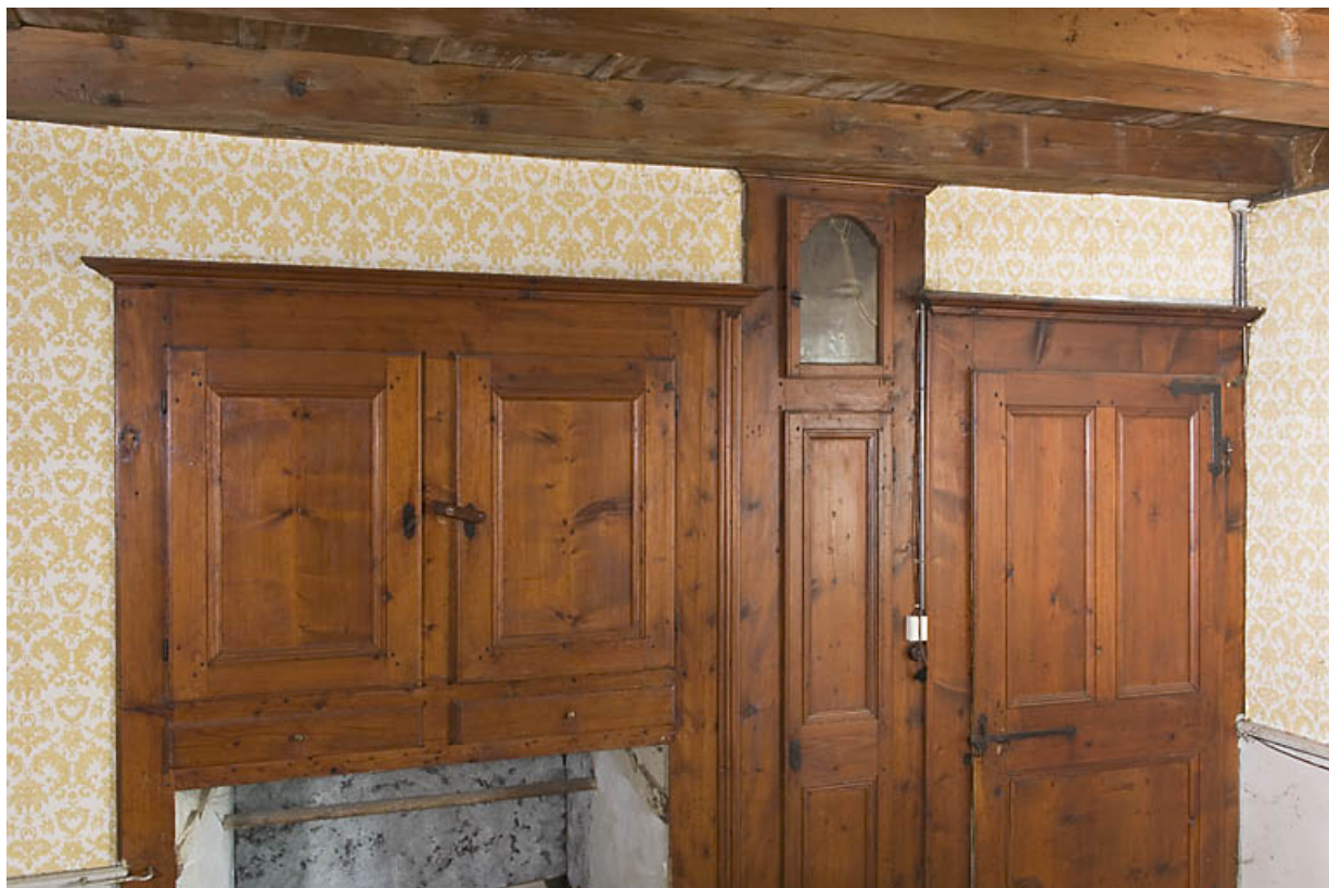
Grande chambre (du 1er étage ?) : placard, emplacement de l'horloge comtoise et porte. 25, Jougne, 17 rue du Faubourg