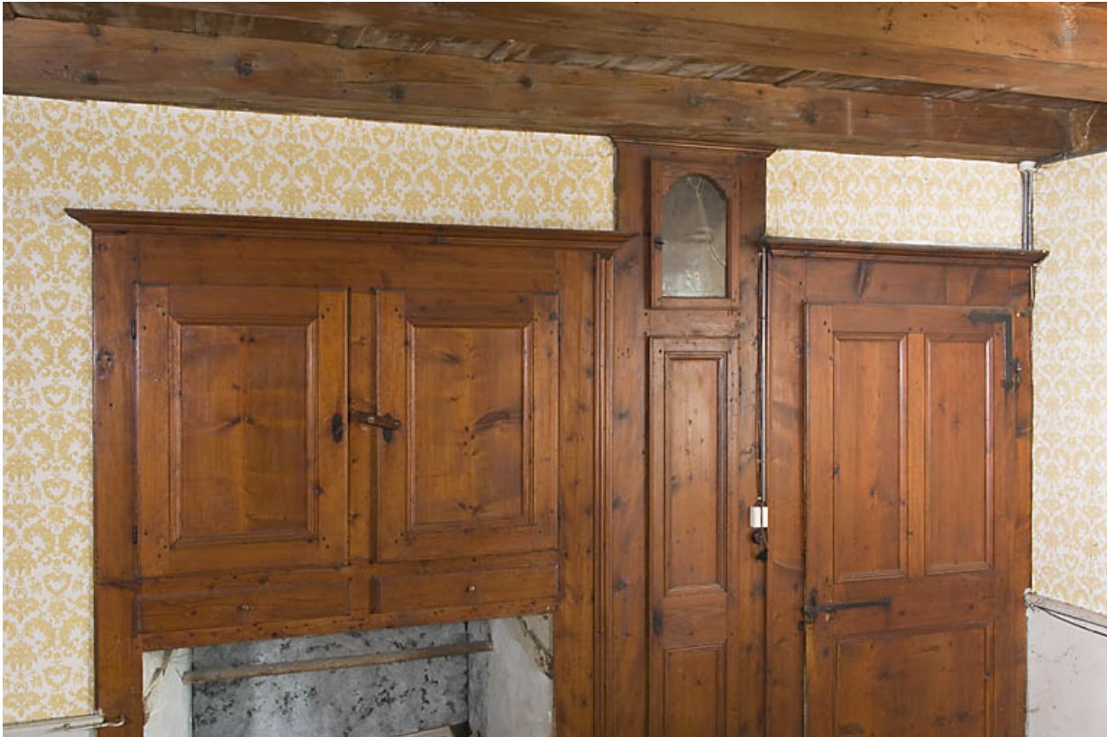
Grande chambre (du 1er étage ?) : placard, emplacement de l'horloge comtoise et porte. 25, Jougue, 17 rue du Faubourg