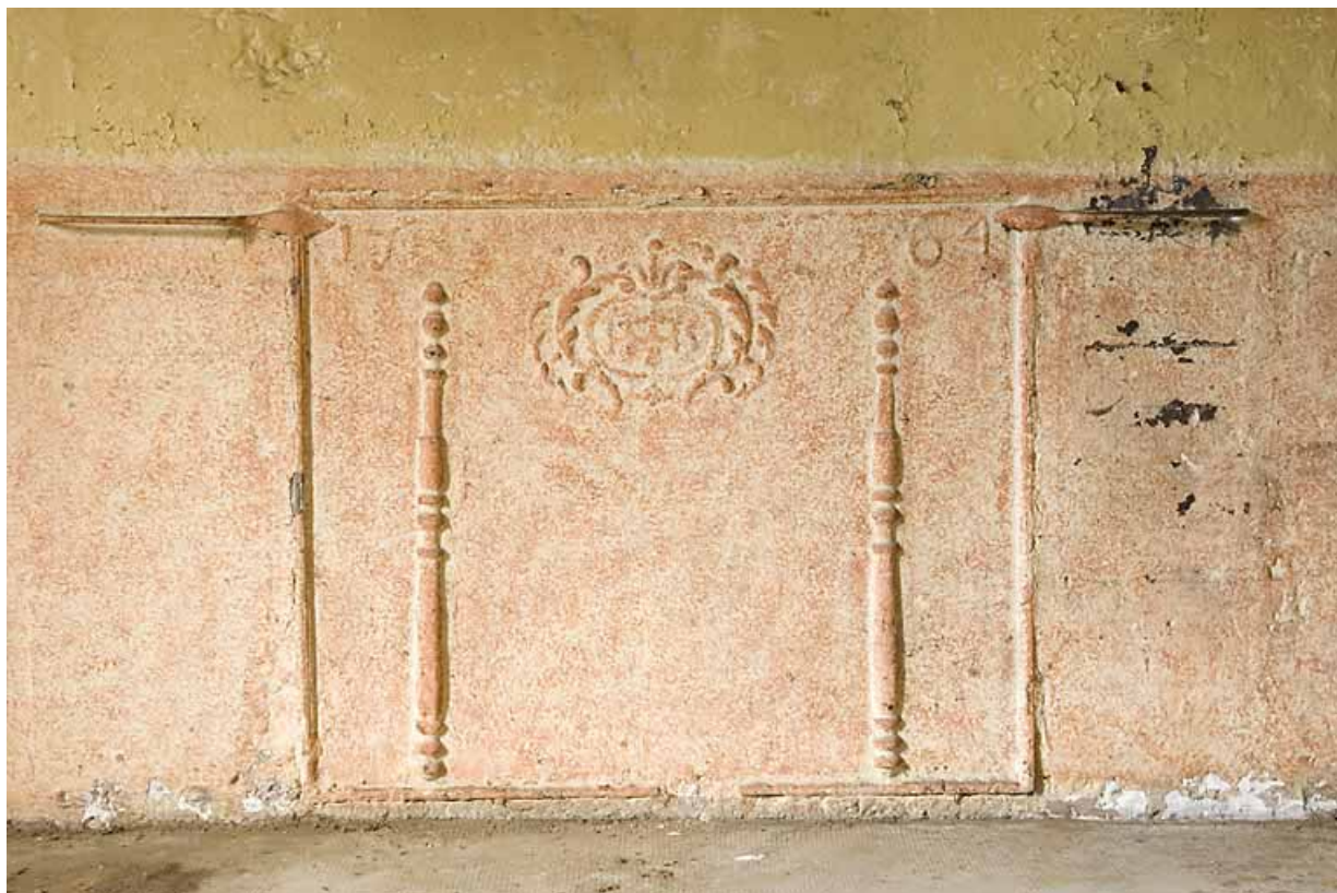
Cuisine du 1er étage : plaque de cheminée datée 1764.