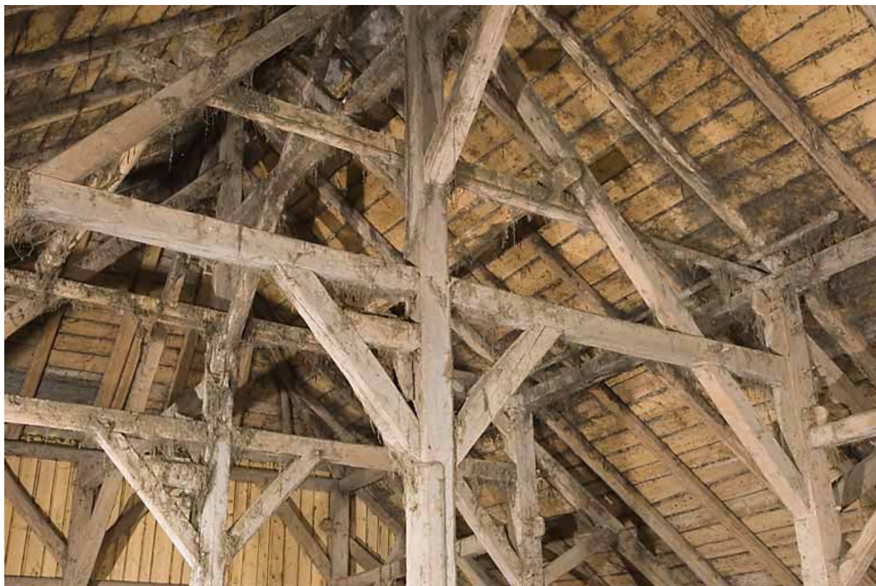
Grange : charpente.