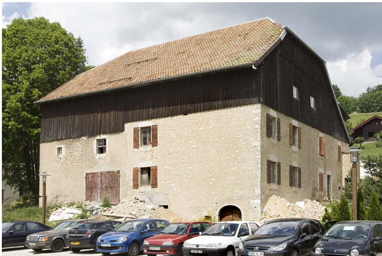
Façades postérieure et latérale gauche.