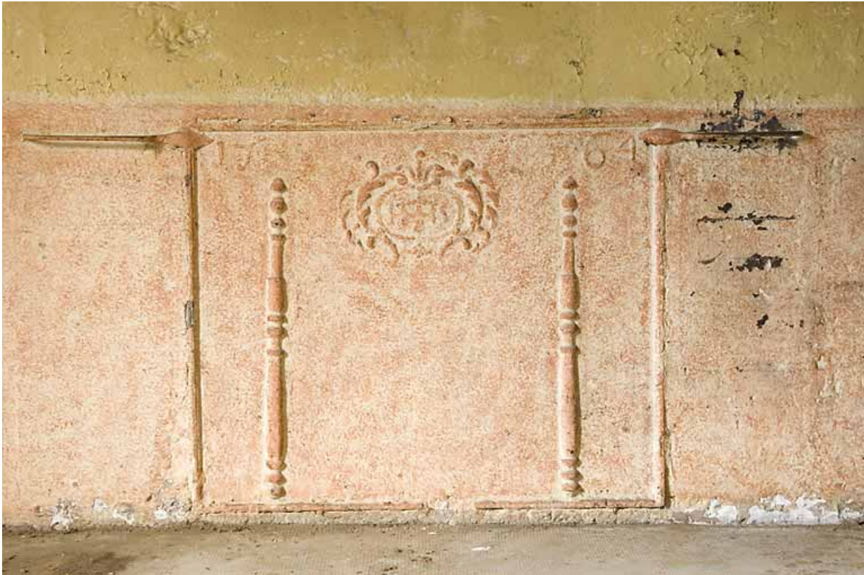
Cuisine du 1er étage : plaque de cheminée datée 1764. 25, Jougne, 17 rue du Faubourg