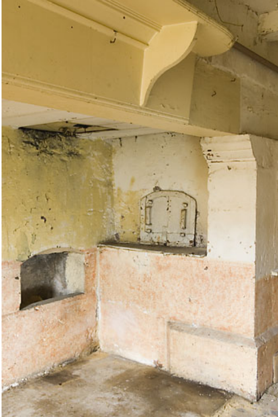
Cuisine du 1er étage : four à pain et cendrier. 25, Jougne, 17 rue du Faubourg