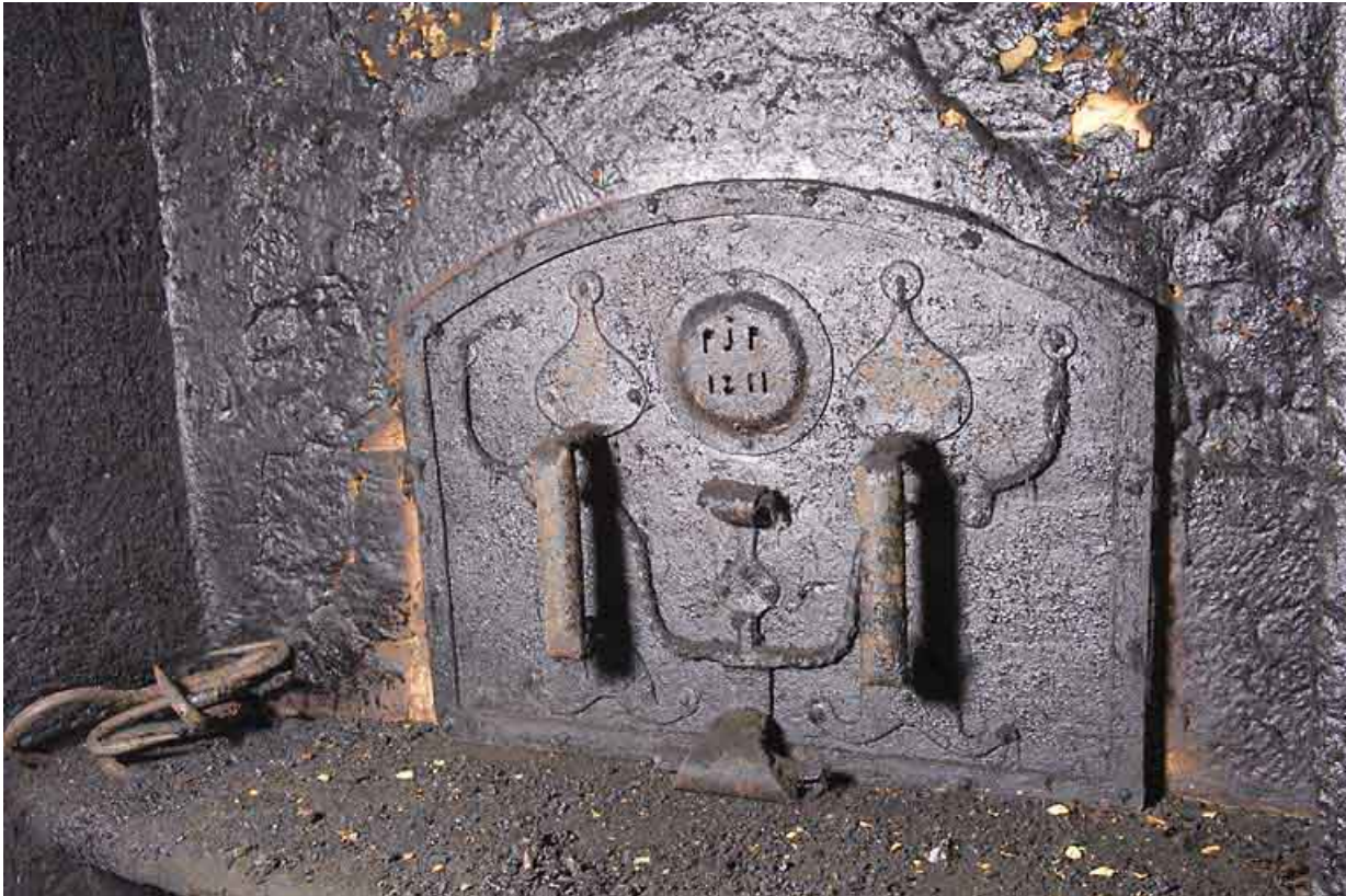
Cuisine du 2nd étage : four à pain, porte fermée (datée 1811 et avec les initiales PJP). 25, Jougne, 17 rue du Faubourg