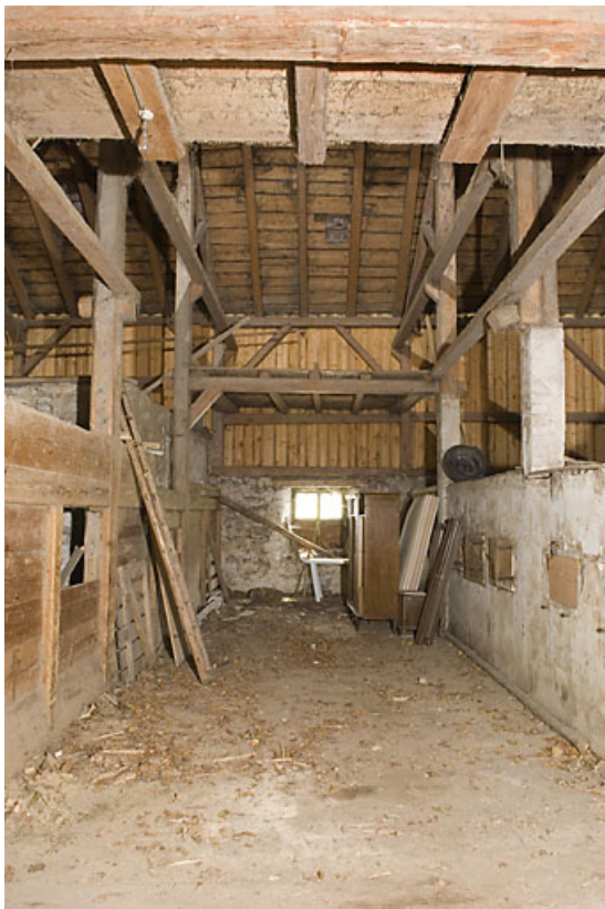
Grange : travée centrale.