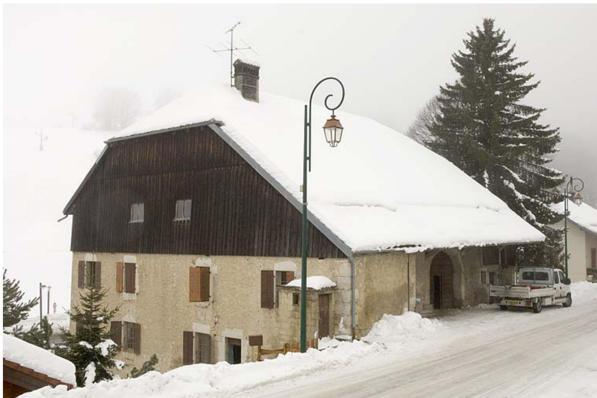
Façades antérieure et latérale gauche, en hiver. 25, Jougne, 17 rue du Faubourg