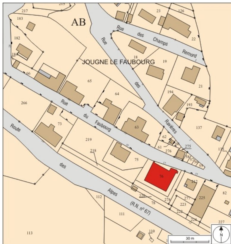
Plan-masse et de situation. Extrait du plan cadastral, 2008, section AB, échelle 1:1 000. 25, Jougne, 17 rue du Faubourg