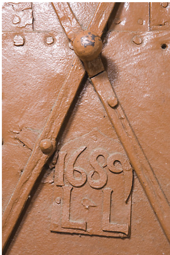
Ferme au 17 rue du Faubourg : date et initiales sur la porte coupe-feu. 25, Jougne