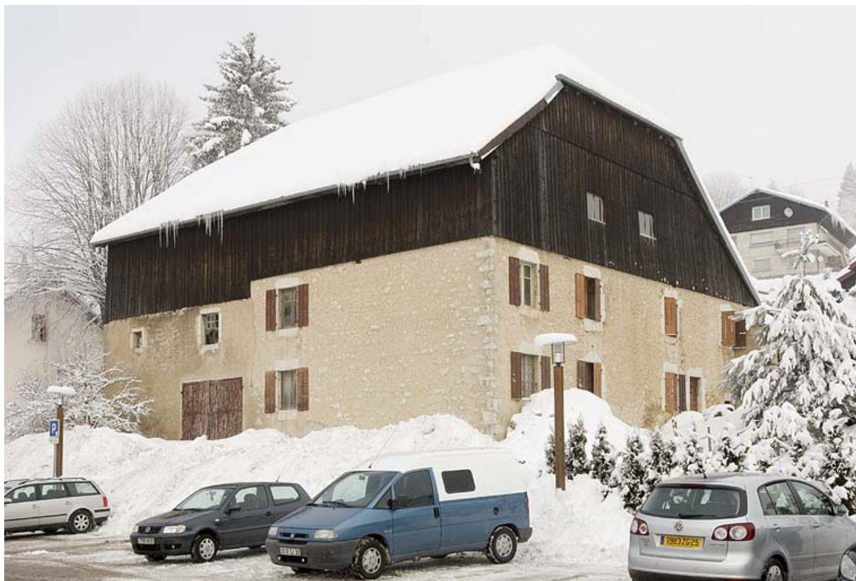
Façades postérieure et latérale gauche, en hiver. 25, Jougne, 17 rue du Faubourg