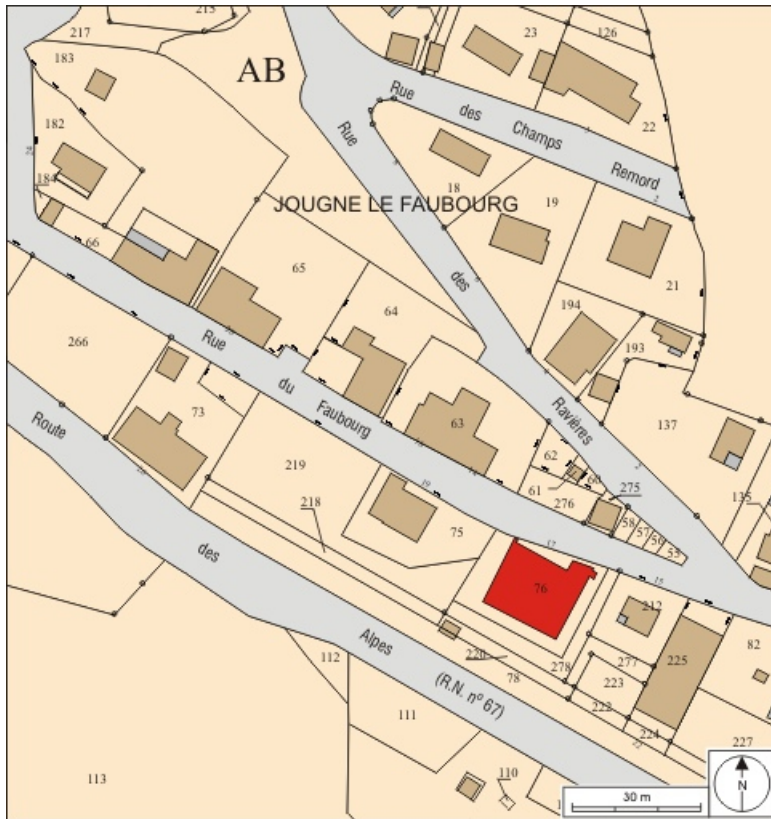
Plan-masse et de situation. Extrait du plan cadastral, 2008, section AB, échelle 1:1 000. 25, Jougne, 17 rue du Faubourg