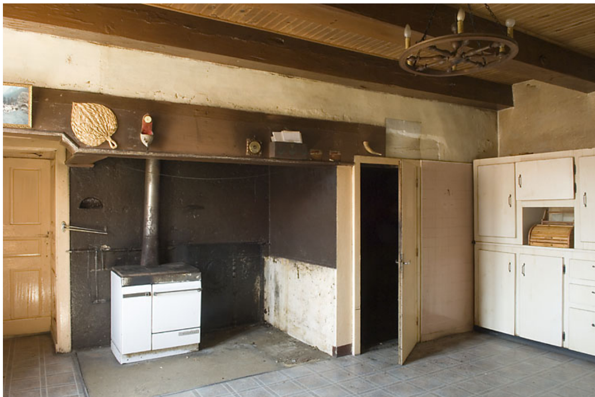
Cuisine du 2nd étage : cheminée et four à pain transformé en fumoir. 25, Jougne, 17 rue du Faubourg