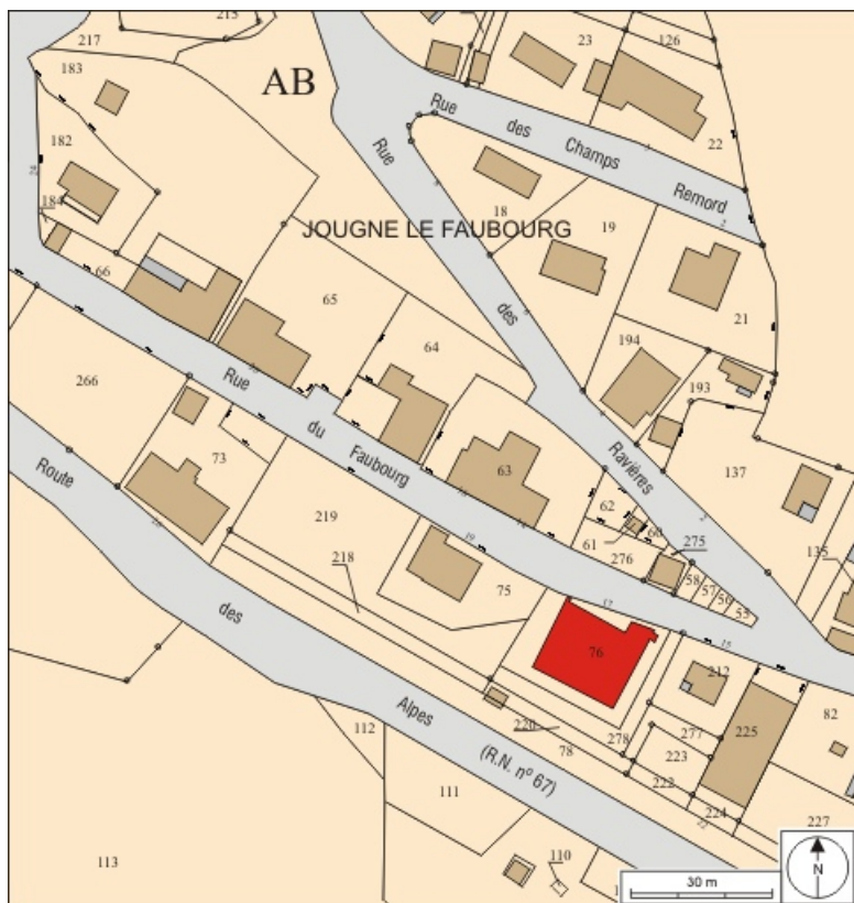
Plan-masse et de situation. Extrait du plan cadastral, 2008, section AB, échelle 1:1 000. 25, Jougne, 17 rue du Faubourg