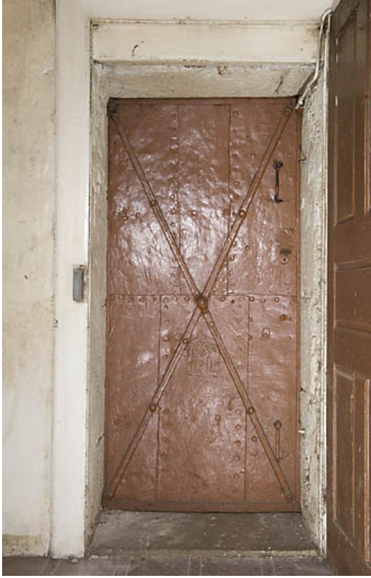
Ferme au 17 rue du Faubourg : porte coupe-feu métallique. 25, Jougne