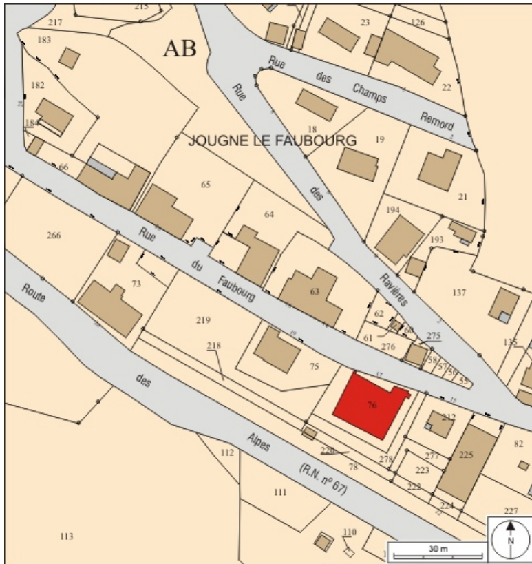
Plan-masse et de situation. Extrait du plan cadastral, 2008, section AB, échelle 1:1 000. 25, Jougne, 17 rue du Faubourg