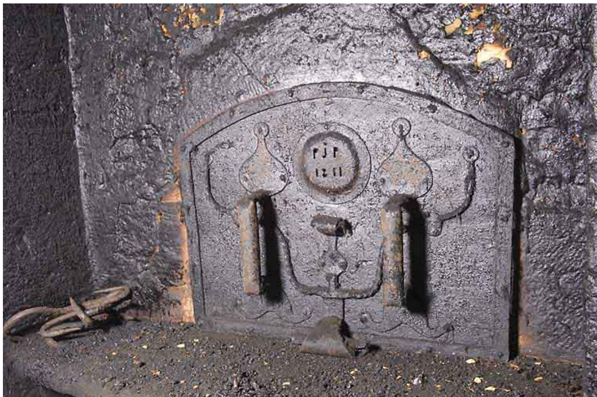
Cuisine du 2nd étage : four à pain, porte fermée (datée 1811 et avec les initiales PJP). 25, Jougne, 17 rue du Faubourg