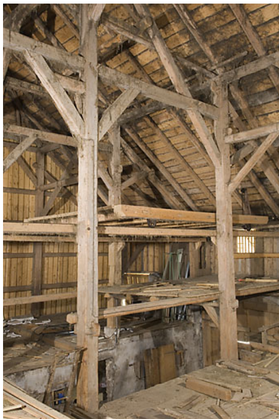
Grange : charpente.