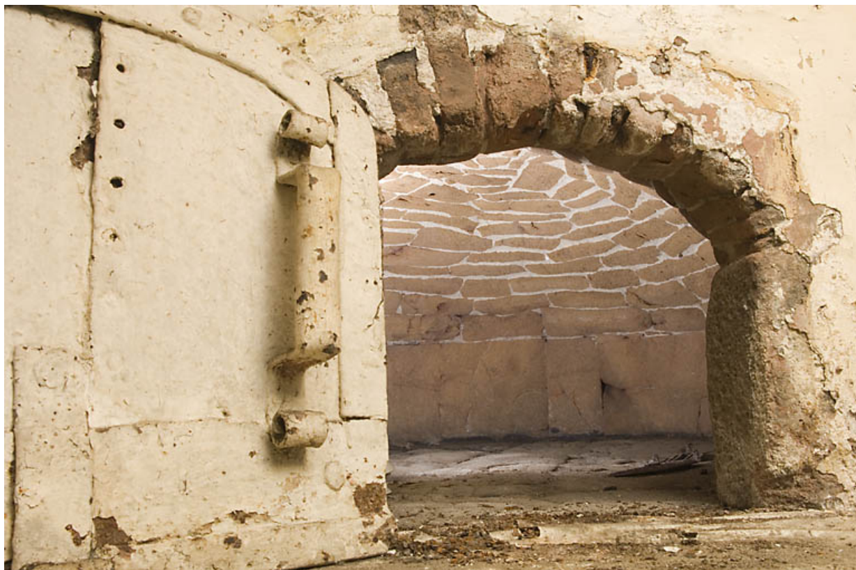
Ferme au 17 rue du Faubourg : intérieur du four à pain. 25, Jougne