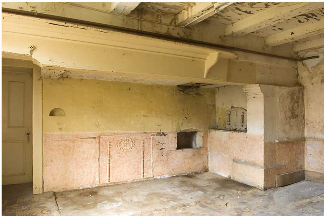
Ferme au 17 rue du Faubourg : cuisine avec cheminée et four à pain. 25, Jougne