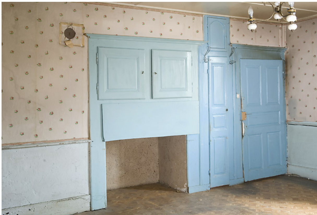
Grande chambre (du 2nd étage ?) : placard, emplacement de l'horloge comtoise et porte. 25, Jougne, 17 rue du Faubourg