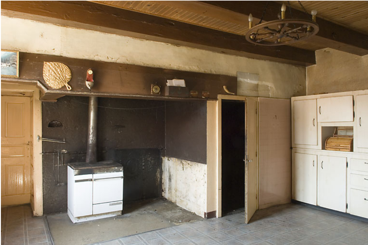
Cuisine du 2nd étage : cheminée et four à pain transformé en fumoir. 25, Jougne, 17 rue du Faubourg