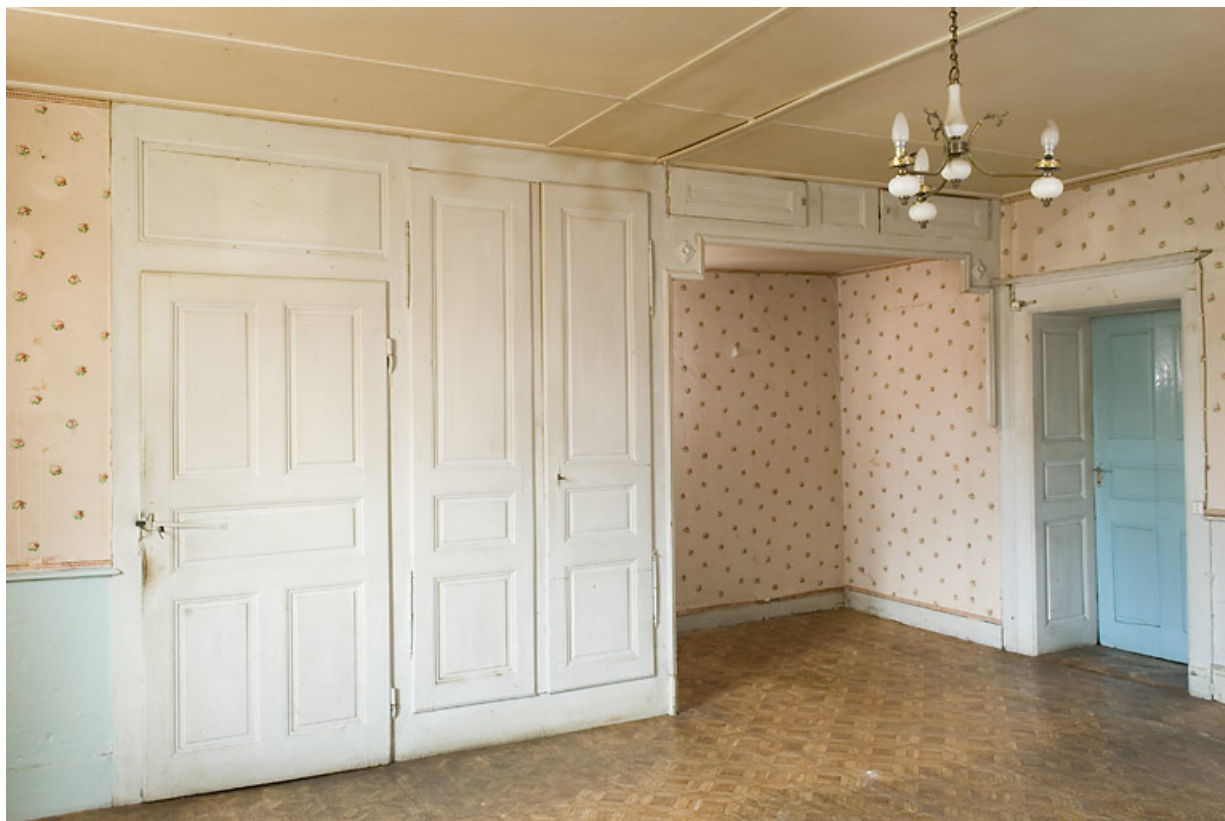
Grande chambre (du 2nd étage ?) : portes, placard et alcôve. 25, Jougne, 17 rue du Faubourg