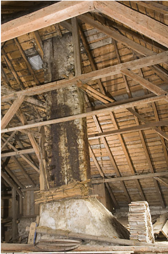
Grange : conduit de cheminée.