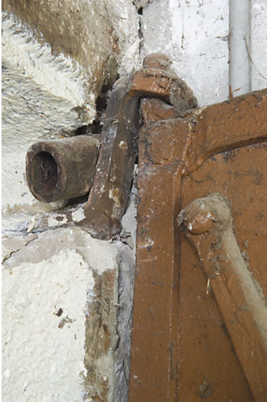
Appartement du 2nd étage : gond de la porte coupe-feu. 25, Jougne, 17 rue du Faubourg