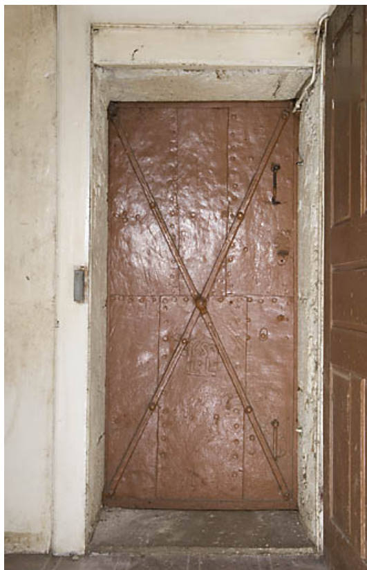
Ferme au 17 rue du Faubourg : porte coupe-feu métallique. 25, Jougne