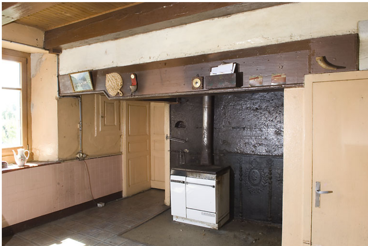
Cuisine du 2nd étage : cheminée.