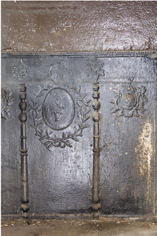
Cuisine du 2nd étage : plaque de la cheminée. 25, Jougne, 17 rue du Faubourg