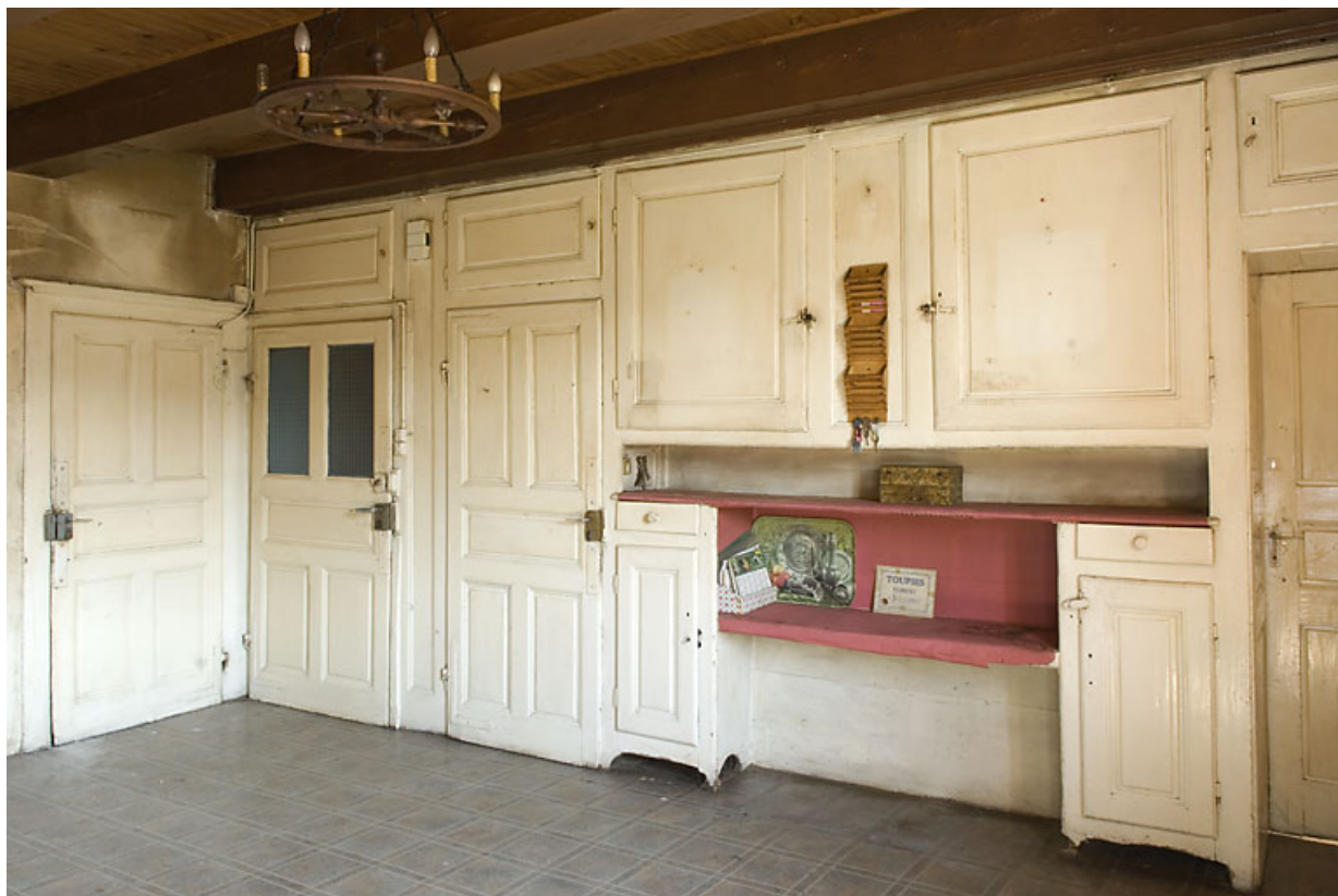
Cuisine du 2nd étage : portes et placards. 25, Jougne, 17 rue du Faubourg