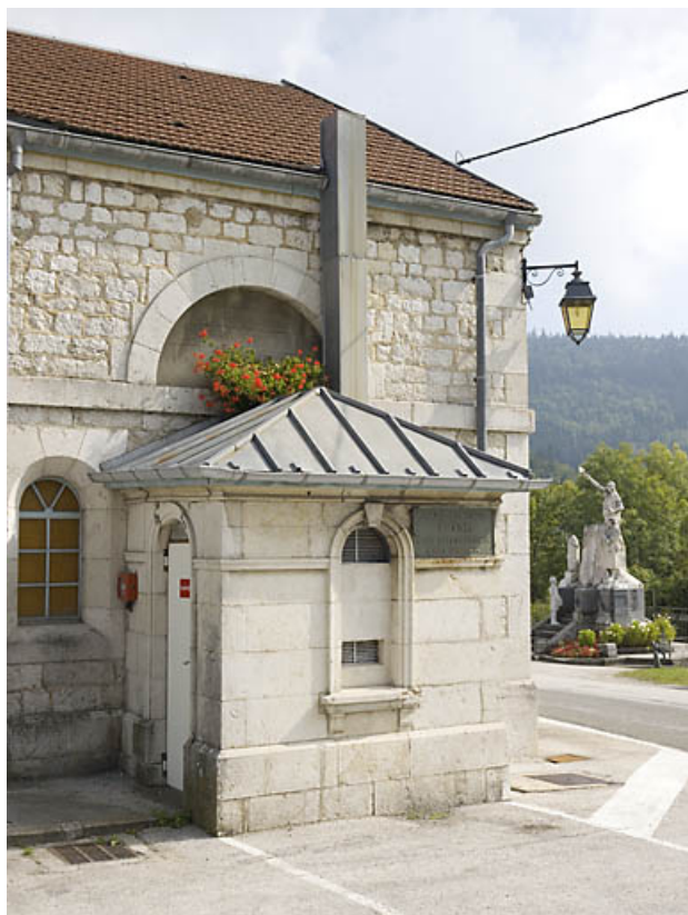
Détail : édicule qui abritait le poids public.