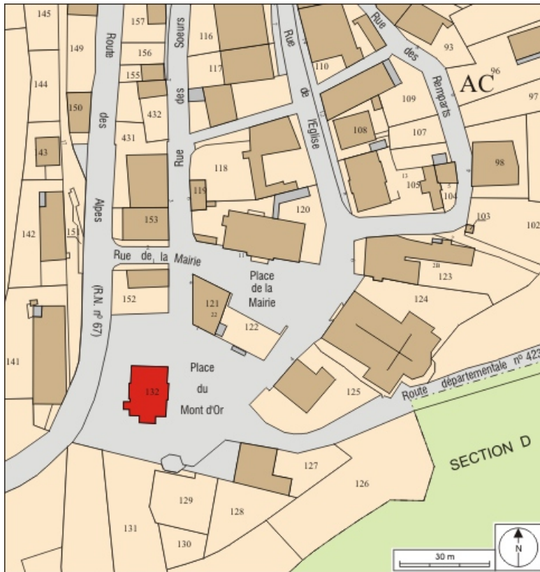
Plan-masse et de situation. Extrait du plan cadastral, 2008, section AC, échelle 1:1 000. 25, Jougne place du Mont d'Or