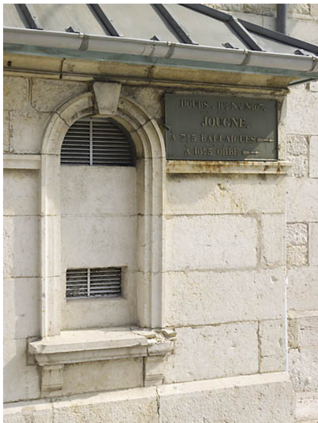
Détail : plaque kilométrique en fonte apposée sur la façade antérieure. 25, Jougne place du Mont d'Or