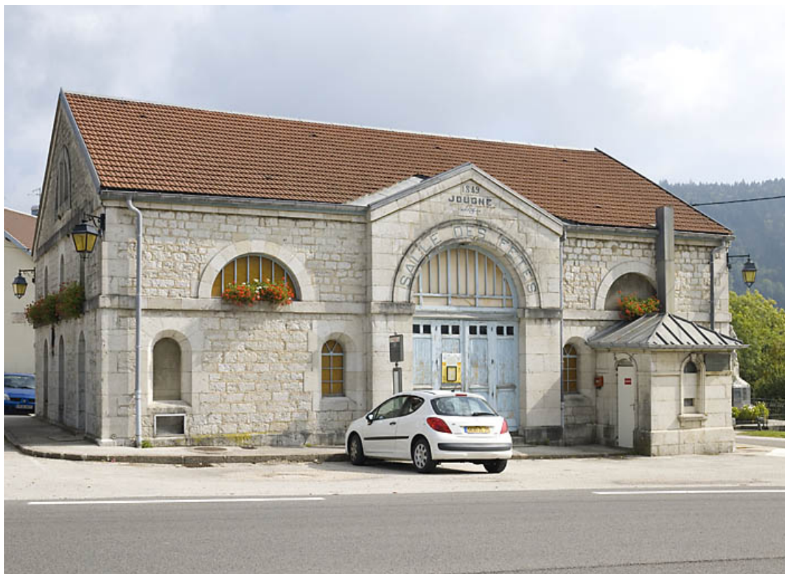
Façade antérieure de trois quarts gauche.