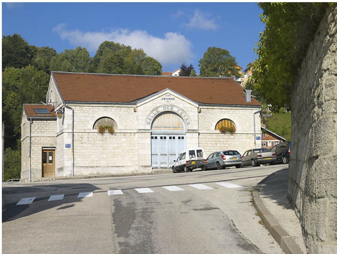
Façade postérieure de trois quarts gauche. 25, Jougne place du Mont d'Or