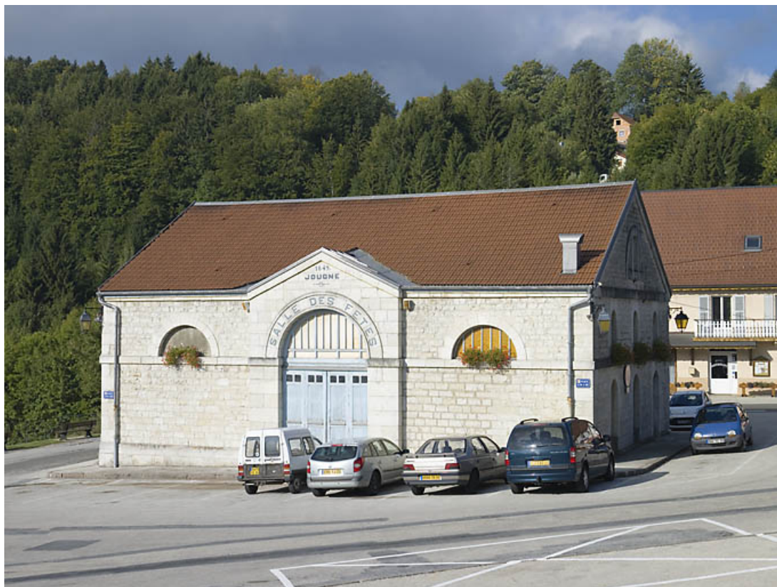
Façade postérieure de trois quarts droit.