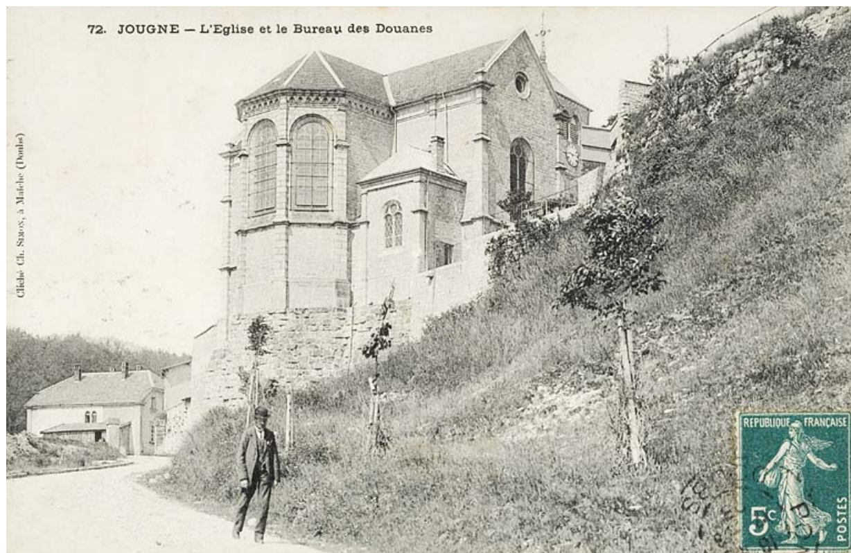
72. Jougne - L'Eglise et le Bureau de Douanes, [1er quart 20e siècle]. 25, Jougne