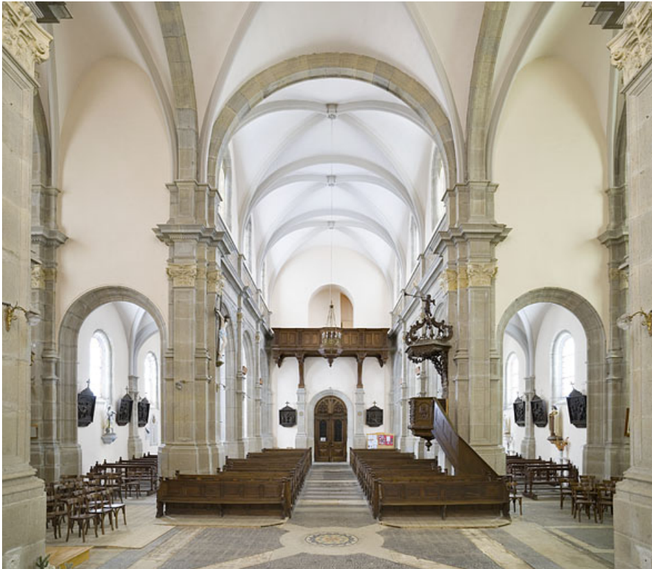
La nef vue du chœur.