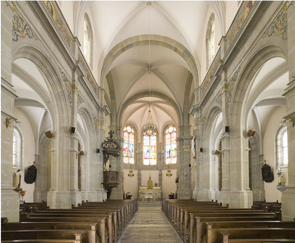
Nef et chœur vus de l'entrée.