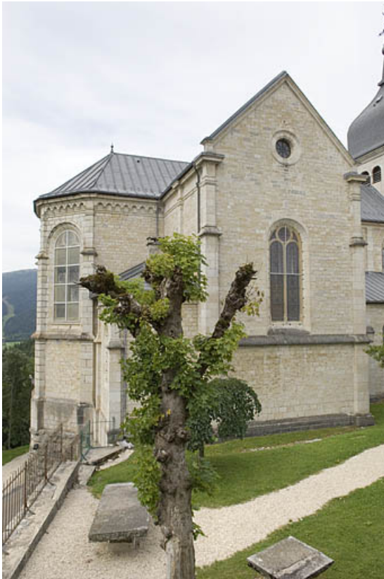
Chevet, depuis l'ouest.