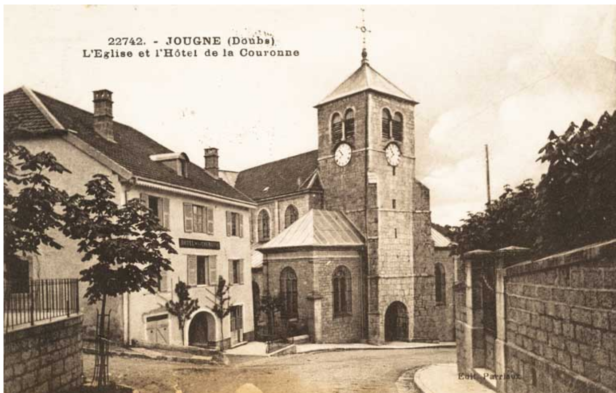
22742. - Jougne (Doubs). L'Eglise et l'Hôtel de la Couronne, [1ère moitié 20e siècle ?].