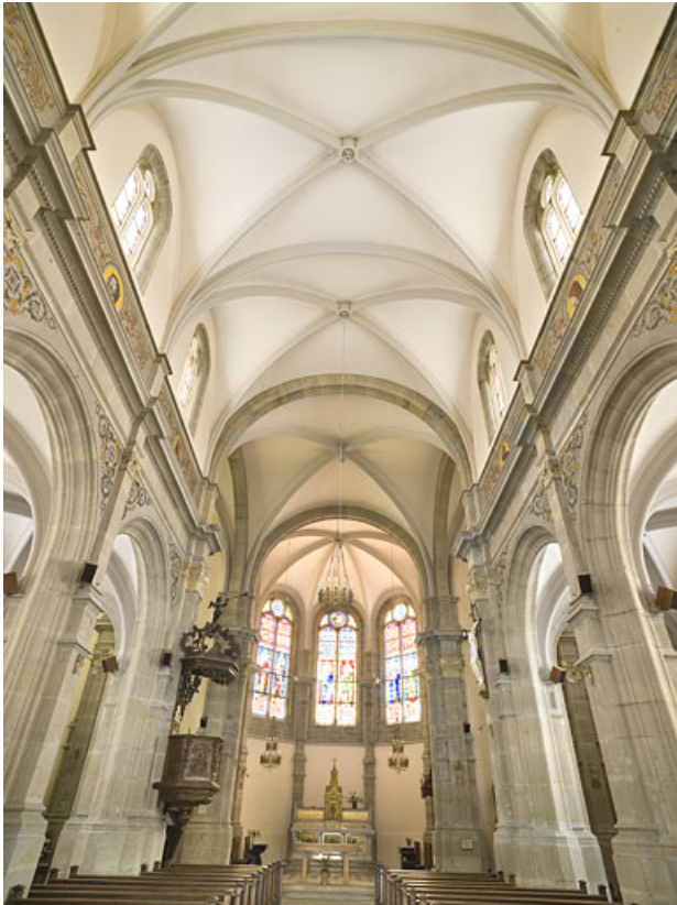
Voûtes de la nef, vues de l'entrée.