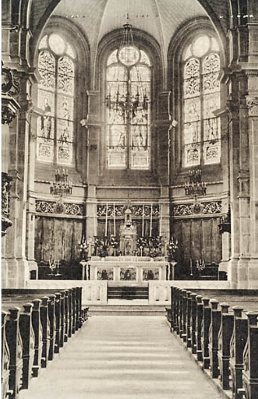
Intérieur : le chœur 25, Jougue