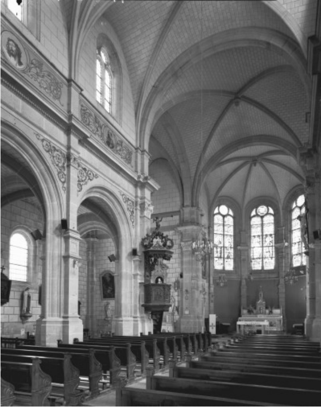
Nef et chœur vus de l'entrée.