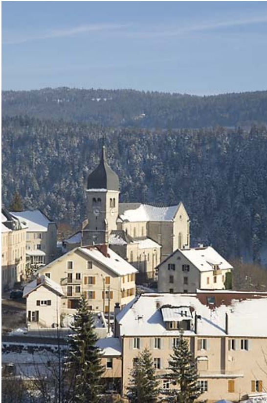
Vue générale depuis le Mont Ramey.