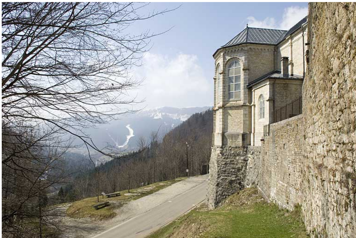
Le chevet. 25, Jougne