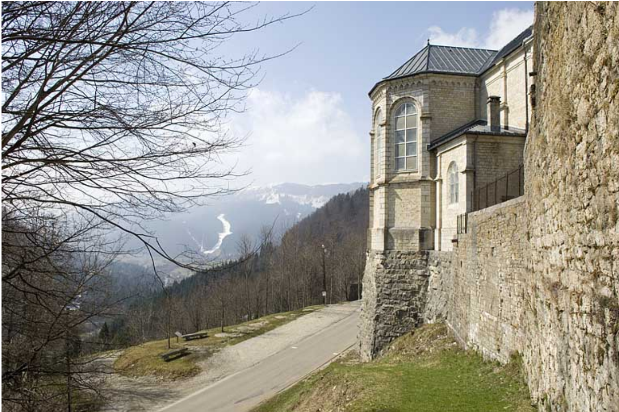
Le chevet. 25, Jougne