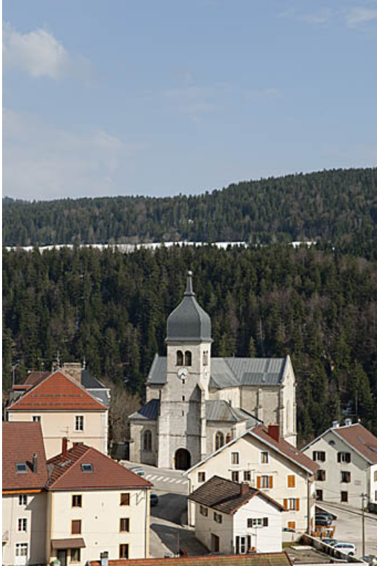
Vue générale depuis le Mont Ramey en 2009. 25, Jougne