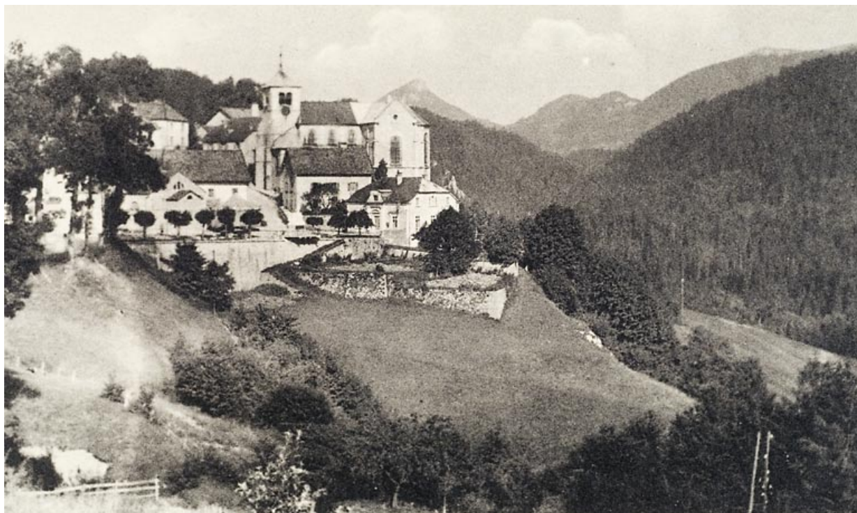
L'église vue de l'ouest, [1ère moitié 20e siècle].