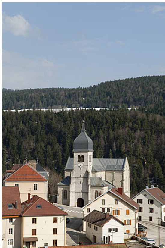
Vue générale depuis le Mont Ramey en 2009. 25, Jougne