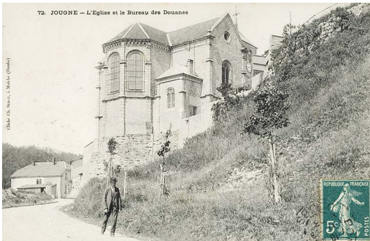
72. Jougue - L'Eglise et le Bureau de Douanes, [1er quart 20e siècle]. 25, Jougue

72. Jougue - L'Eglise et le Bureau de Douanes, carte postale, par Ch. Simon à Maiche, s.d. [1er quart 20e siècle].