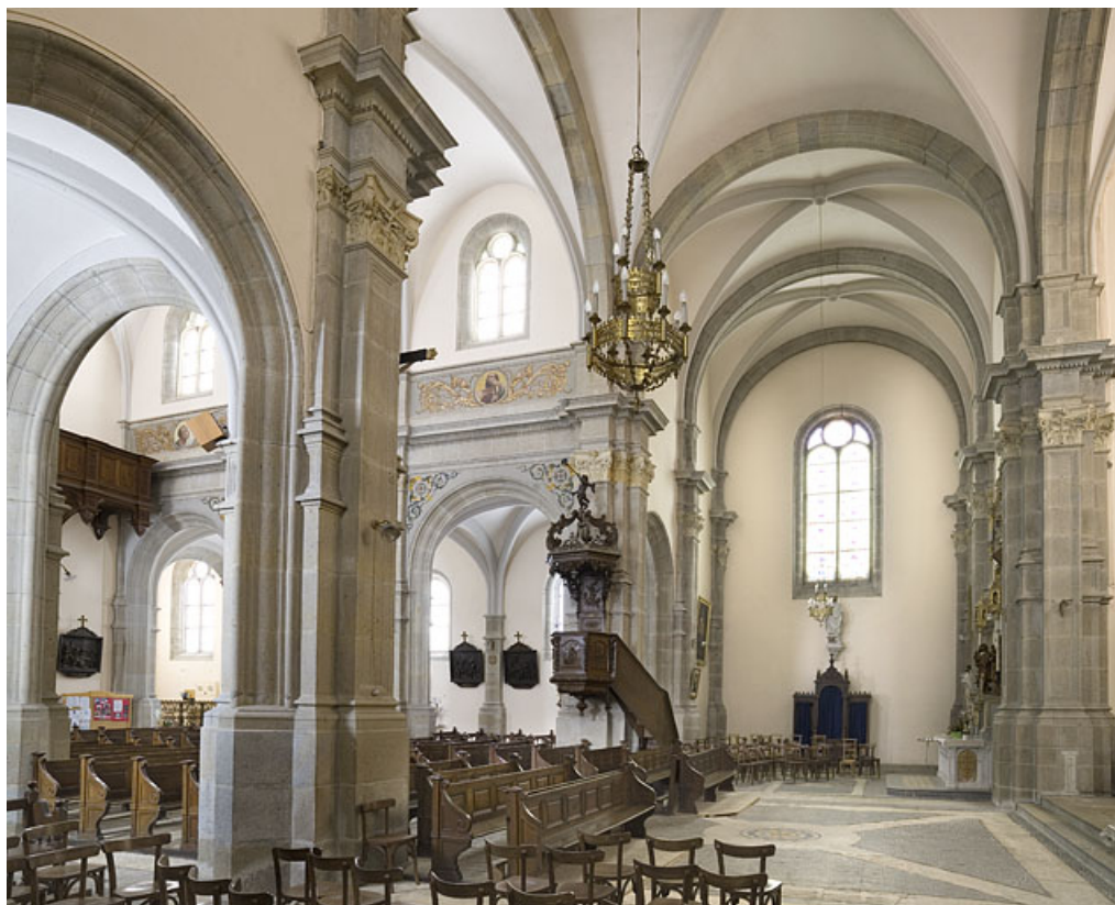
Bas-côté nord. 25, Jougne