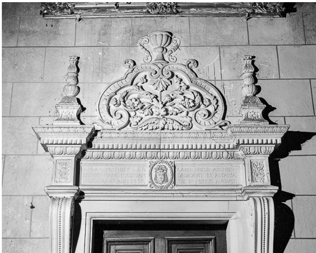
Intérieur : inscription au-dessus de la porte d'entrée de la sacristie. 25, Jougne