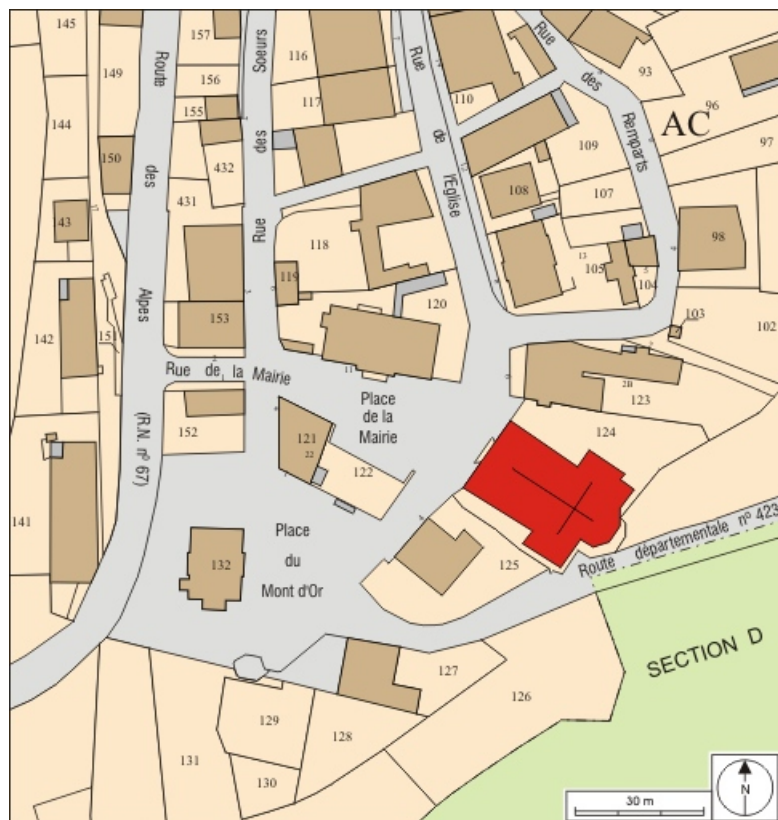
Plan masse et de situation. Extrait du plan cadastral, 2008, section AC, échelle 1:1 000. 25, Jougne