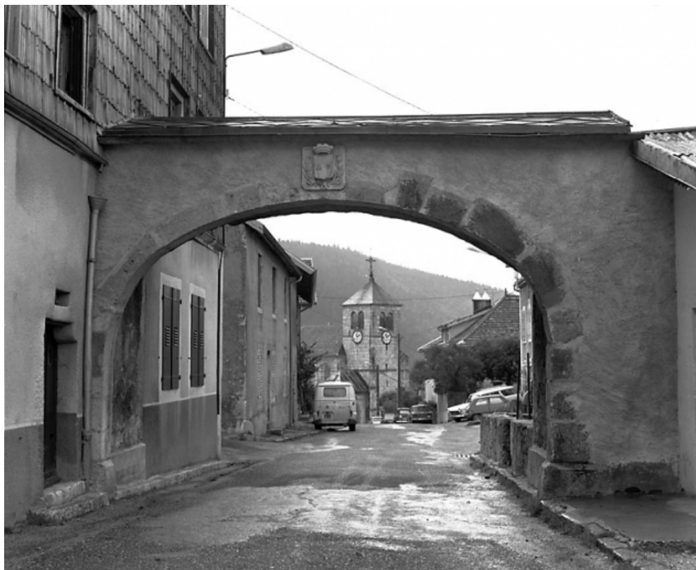
Ancienne porte aux armes de Jougne et rue menant à l'église. 25, Jougne