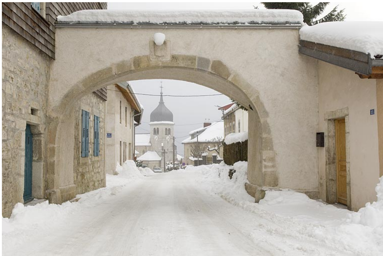
Vue de la porte nord, côté faubourg. 25, Jougue