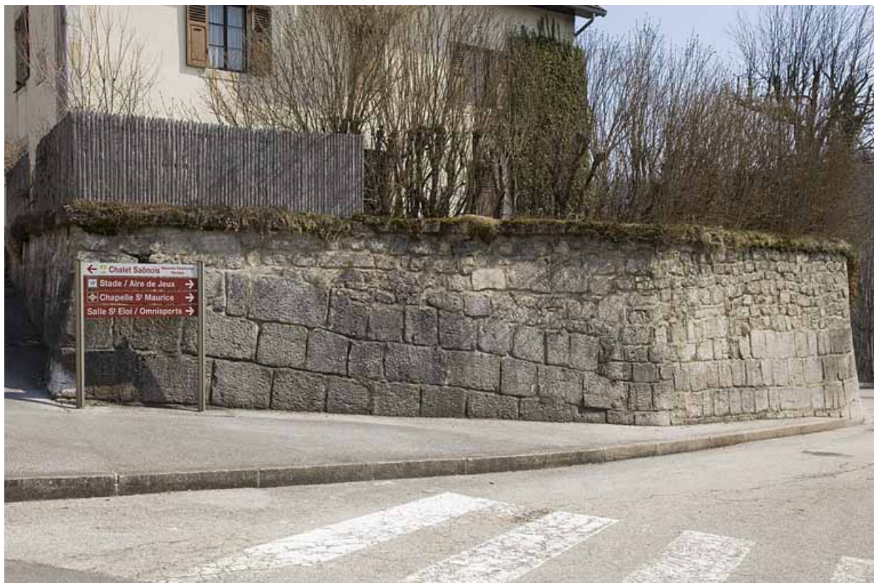
Enceinte au niveau de la maison Billet.