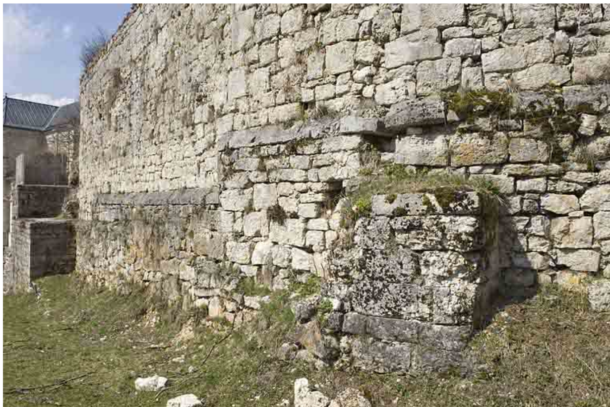
Enceinte médiévale est.