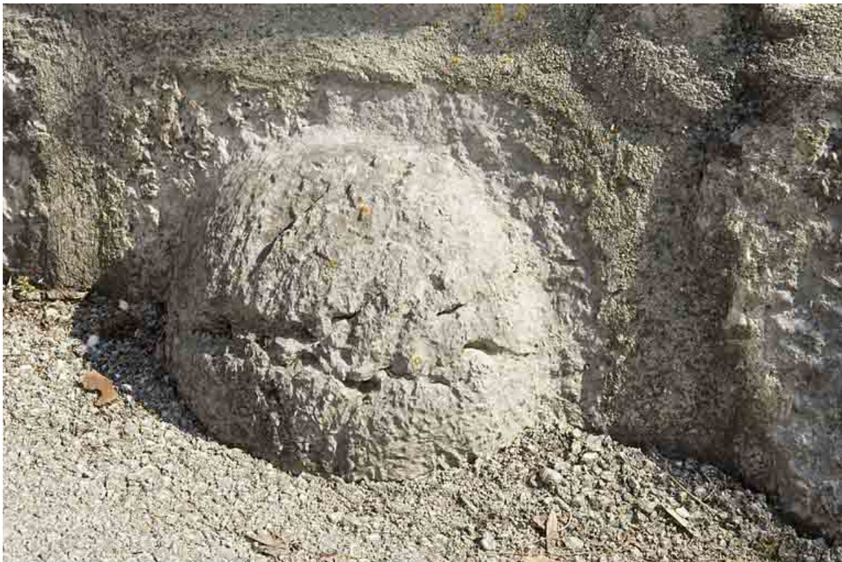
Enceinte au niveau de la maison Billet, détail du bossage. 25, Jougue