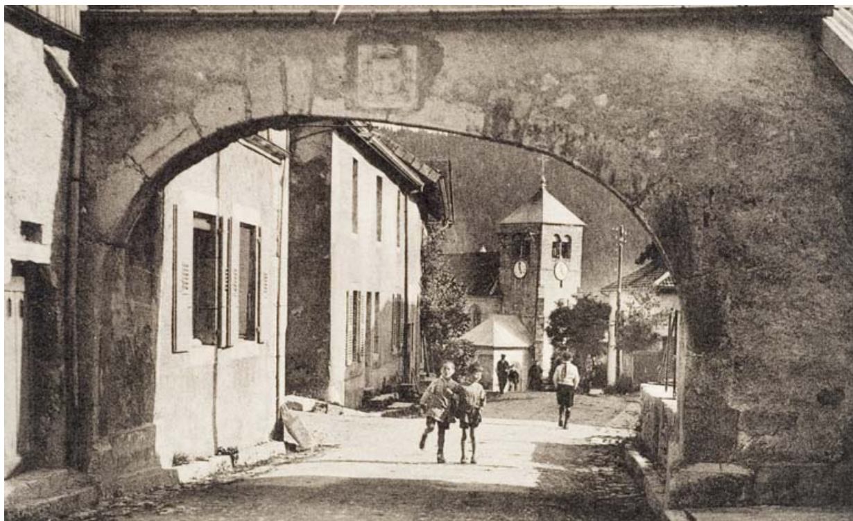
Porte nord, côté du Faubourg.