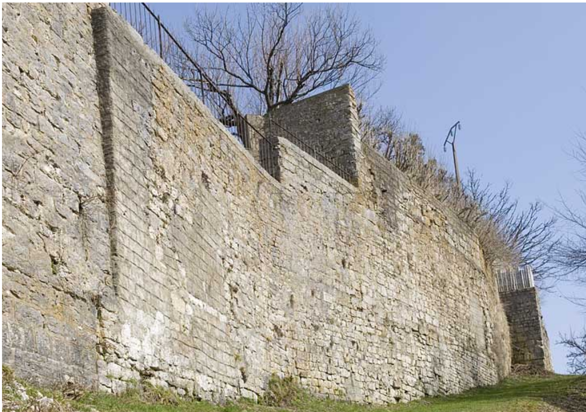
Enceinte est : reprises moderne et contemporaine.