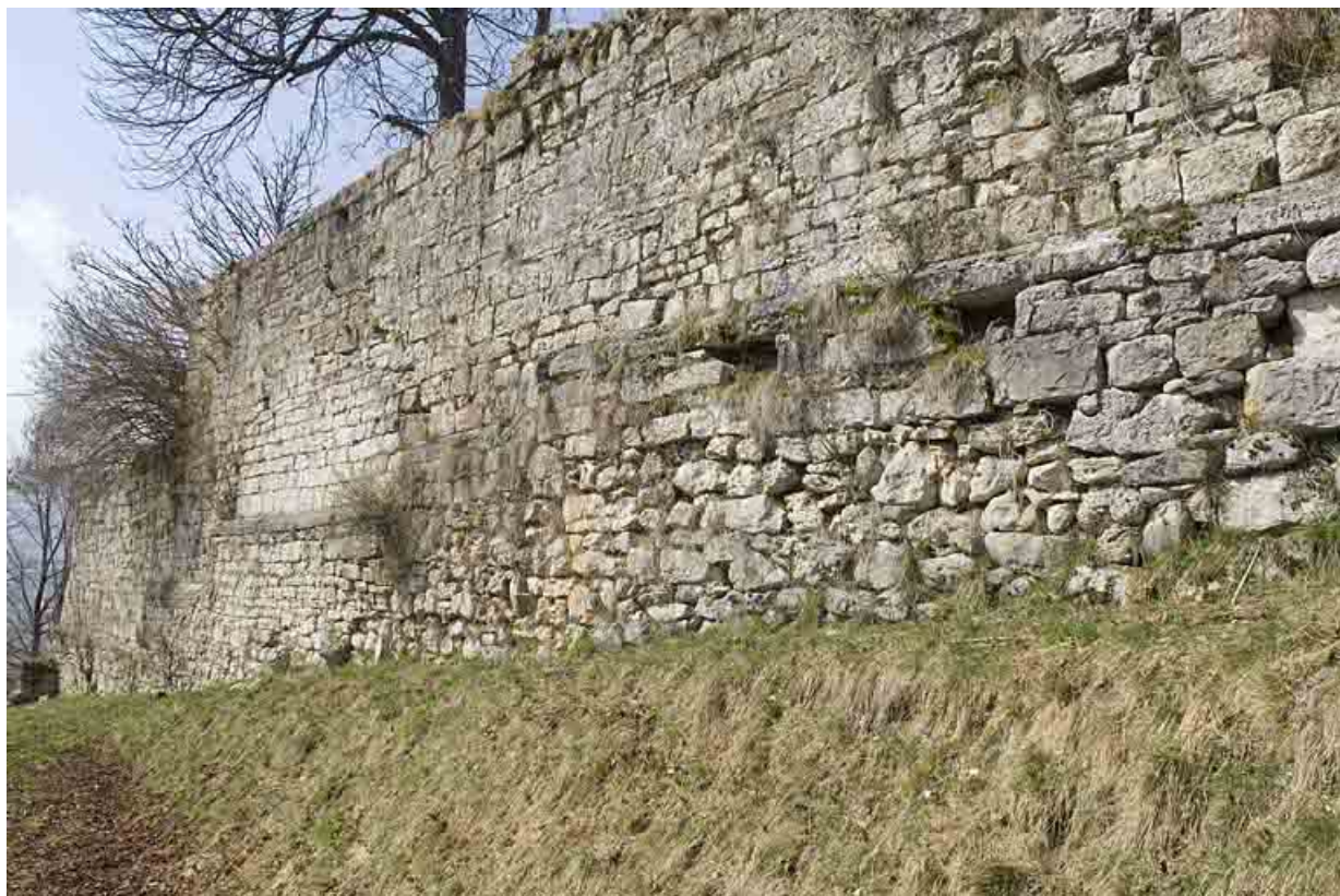
Vue rapprochée de l'enceinte est.