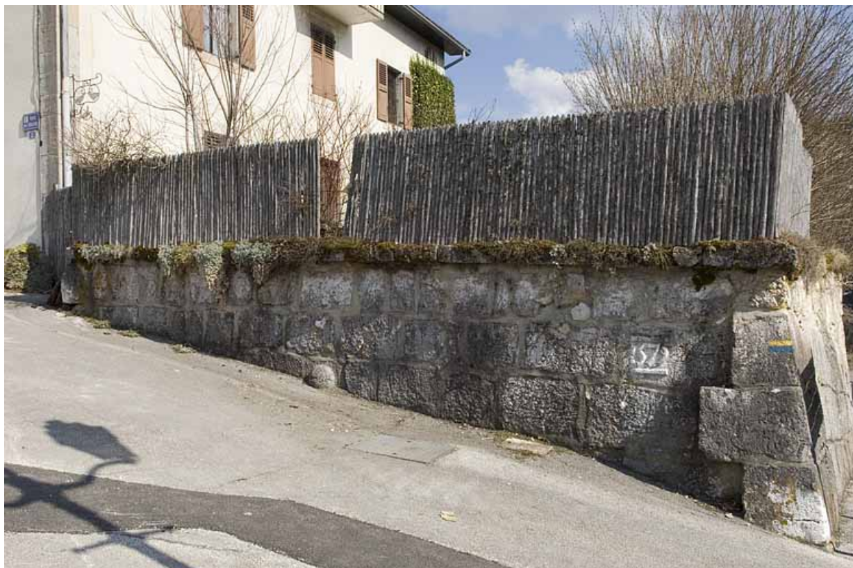
Enceinte au niveau de la maison Billet, rue de l'Eglise. 25, Jougue