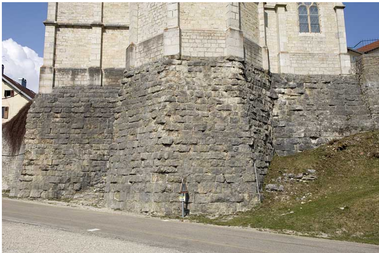
Mur de soutènement du chevet de l'église.