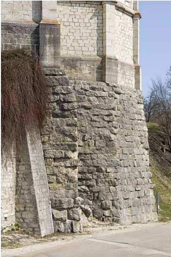
Mur de soutènement crée en 18?? pour asseoir le chevet de l'église paroissiale. 25, Jougue