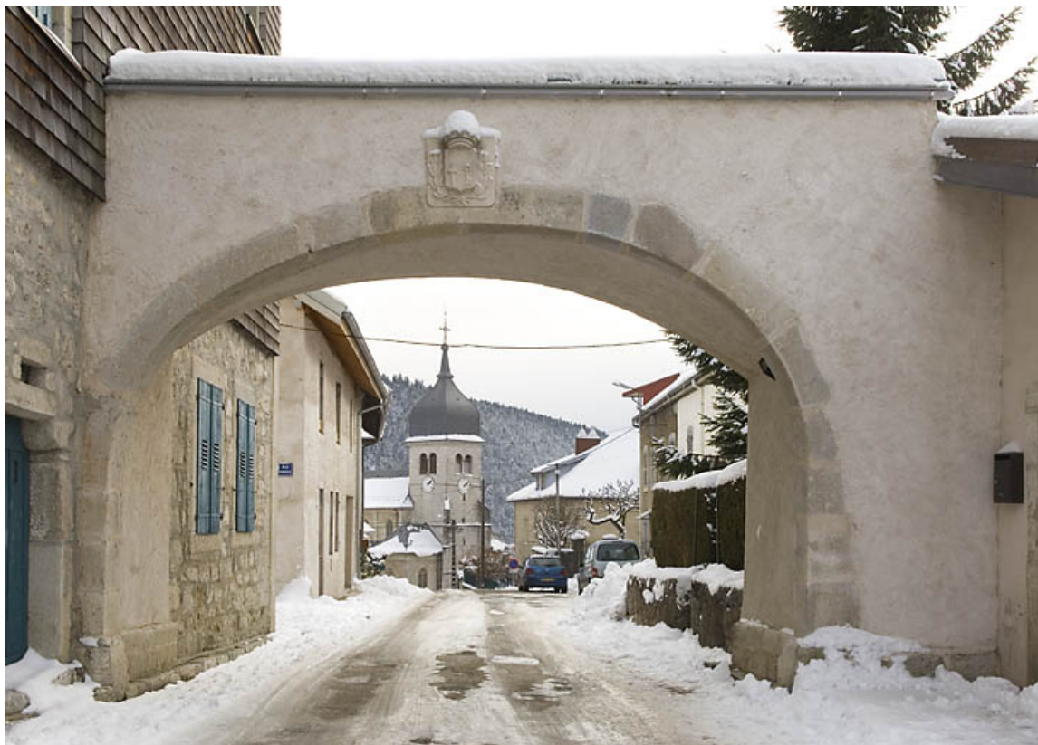
Vue rapprochée de la porte nord, côté faubourg. 25, Jougue