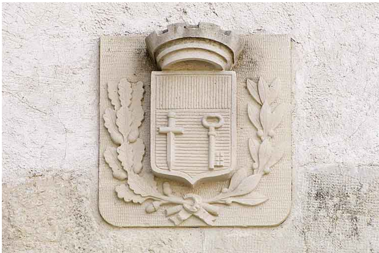
Porte nord, détail : armoiries de la ville.