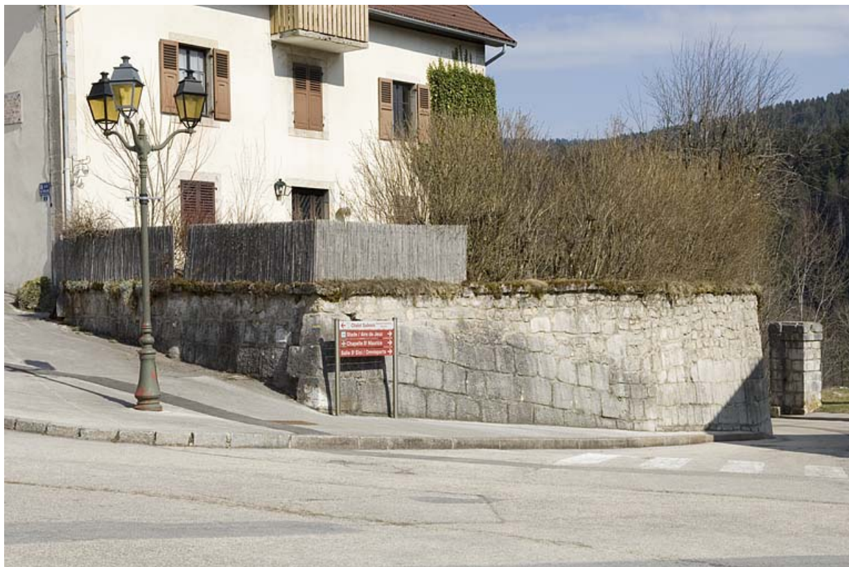
Enceinte à l'angle de la rue de l'Eglise et de la R.D. 423.