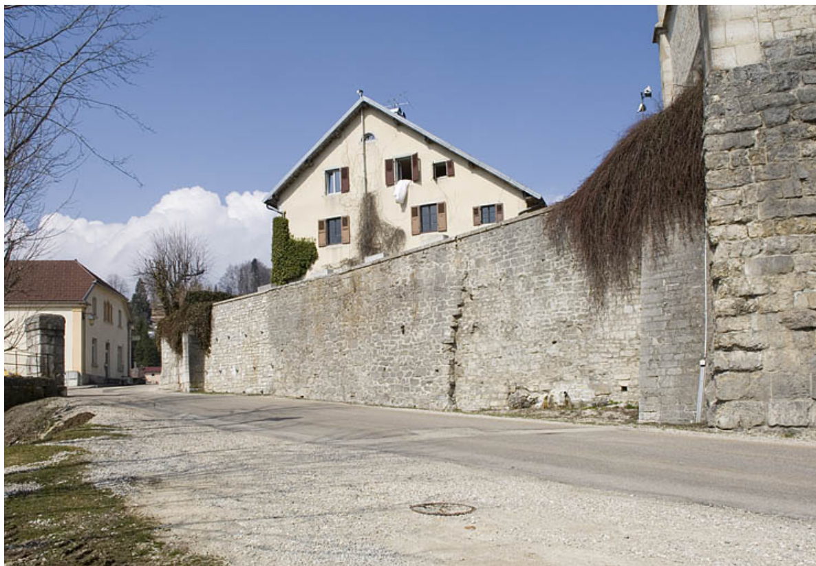
Porte sud et reprise moderne.