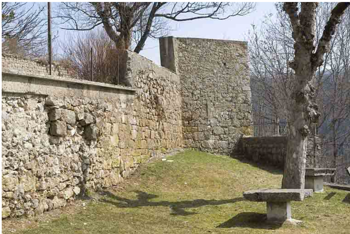
Mur entre l'église paroissiale et l'hôtel de la Couronne.