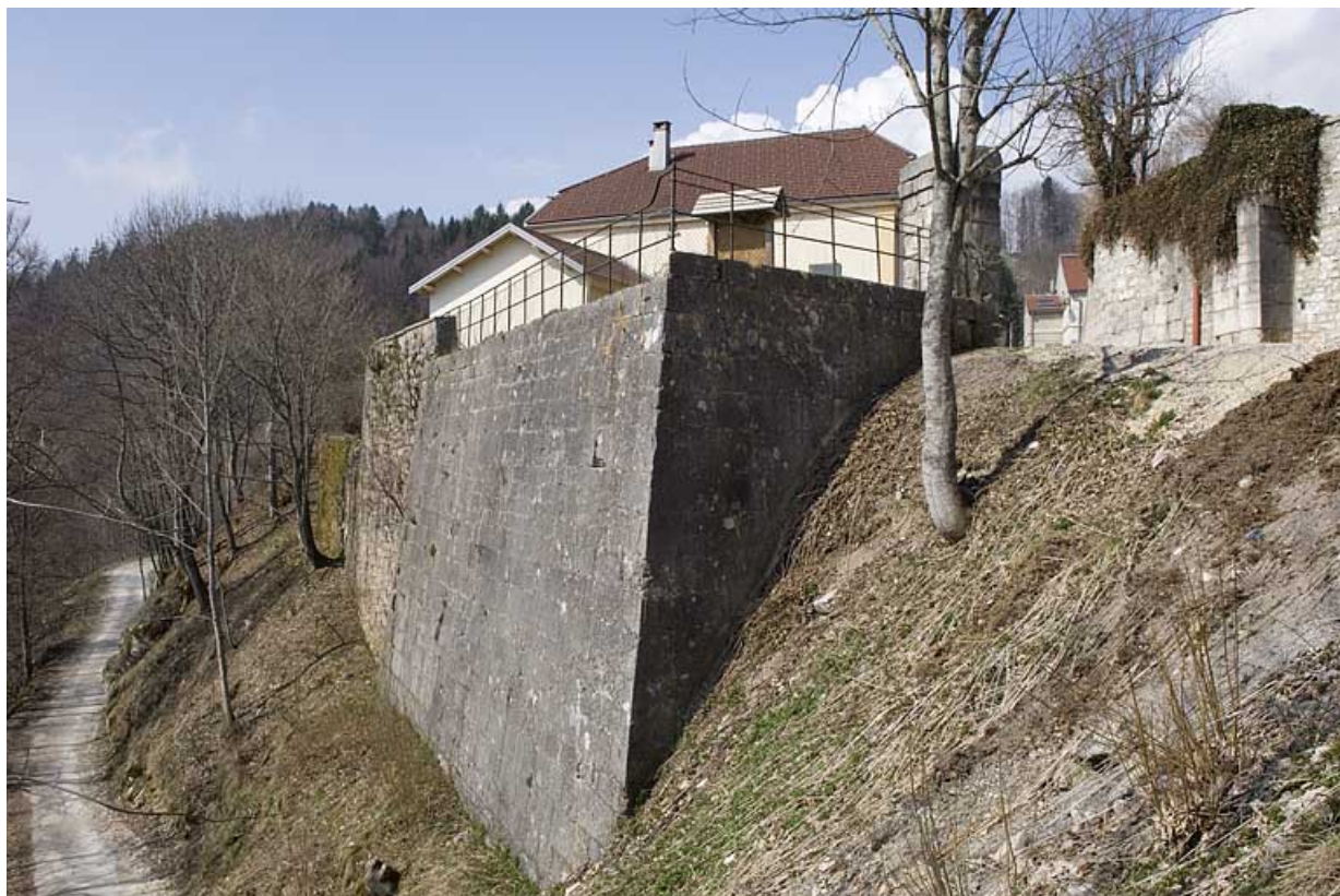
Enceinte sud : section moderne.