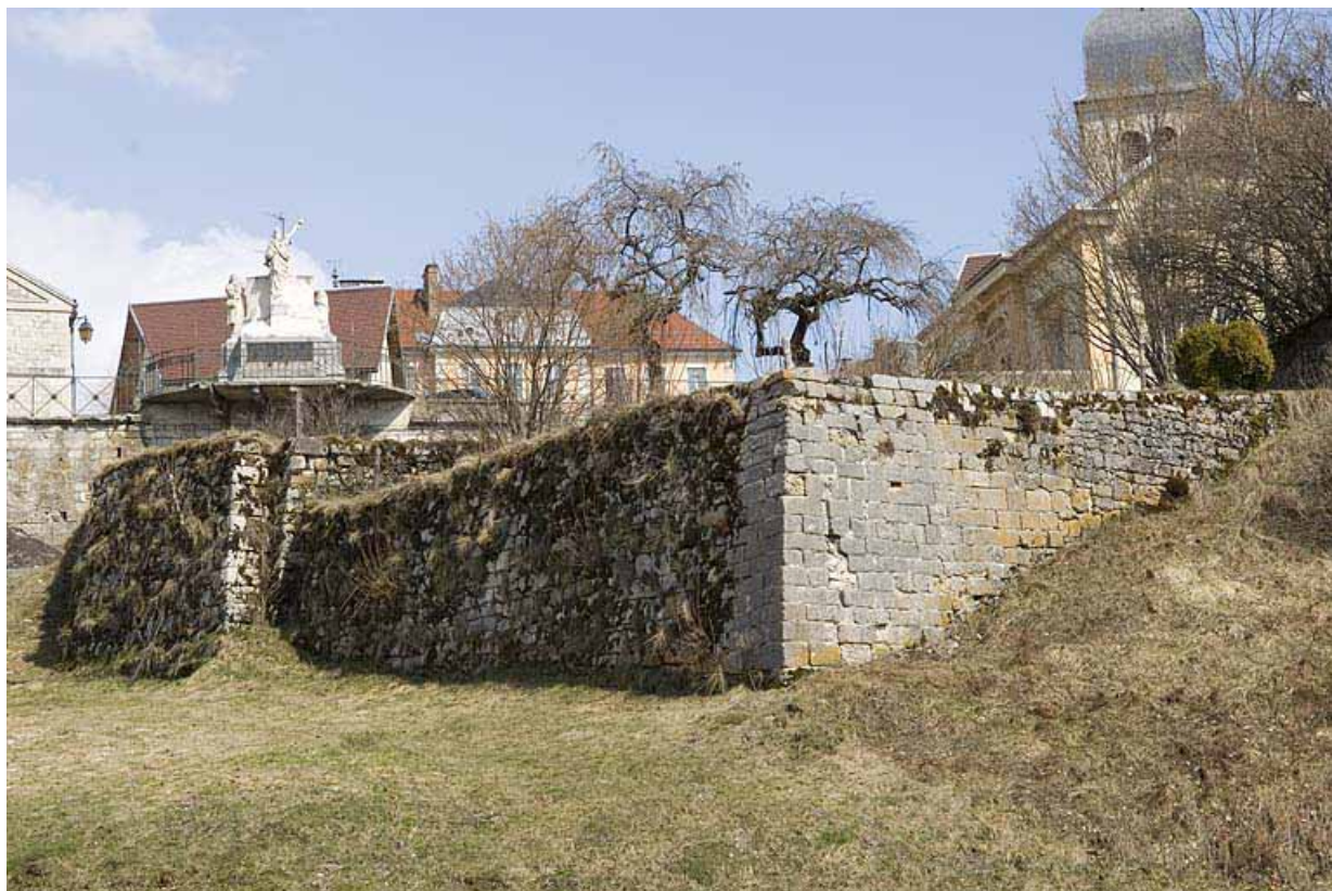
Enceinte sud, vue rapprochée.