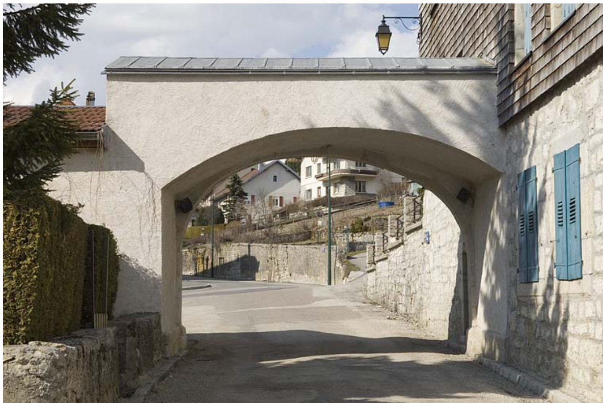
Vue rapprochée de la porte nord, côté village.