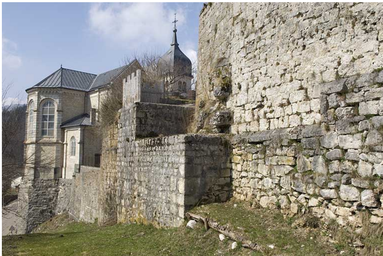
Enceinte est moderne et médiévale.