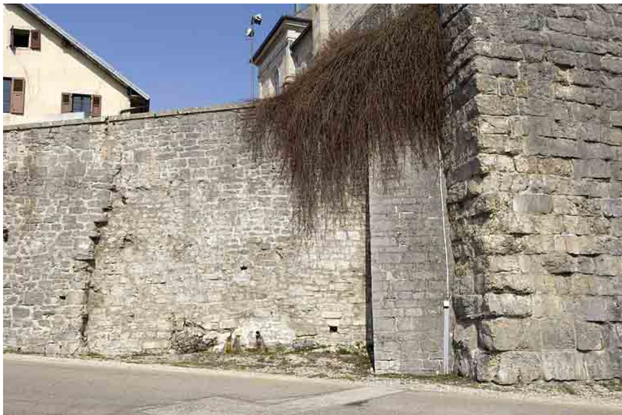
Enceinte est : reprise moderne.