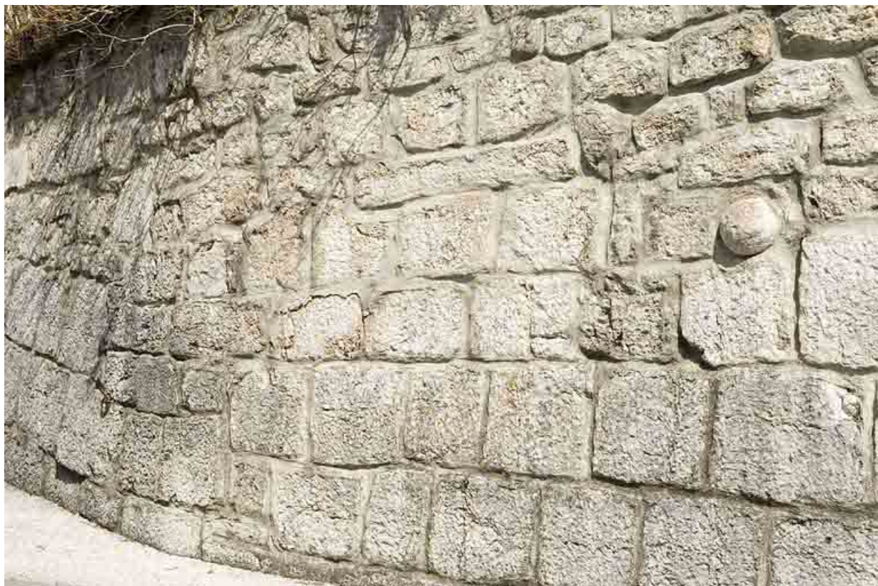
Enceinte : détail du bossage.