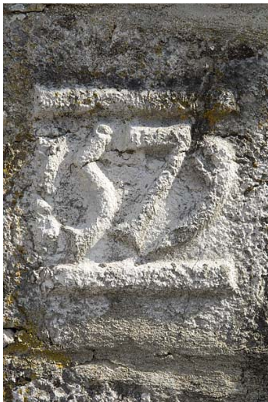
Détail d'un réemploi, portant la date 1579, au niveau de la maison Billet. 25, Jougne