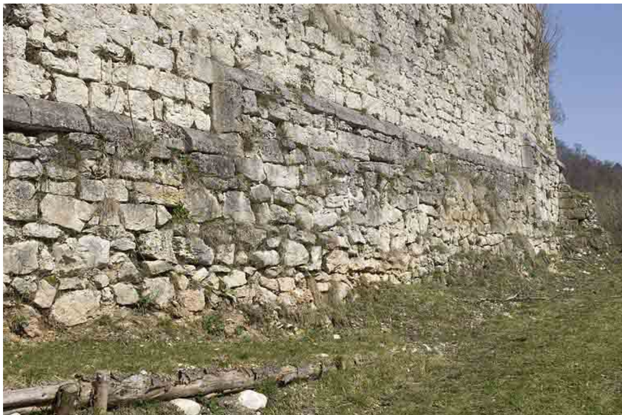
Enceinte médiévale est.