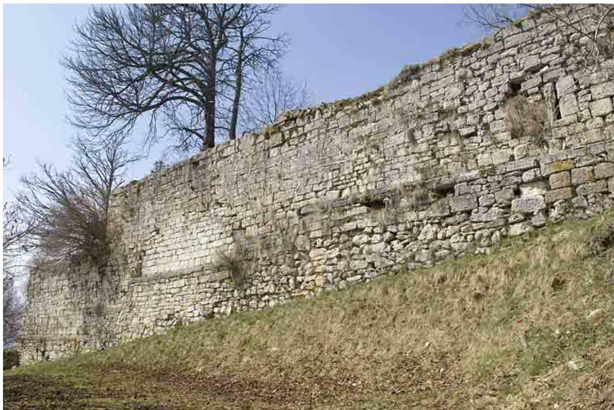
Enceinte médiévale est et meurtrières.