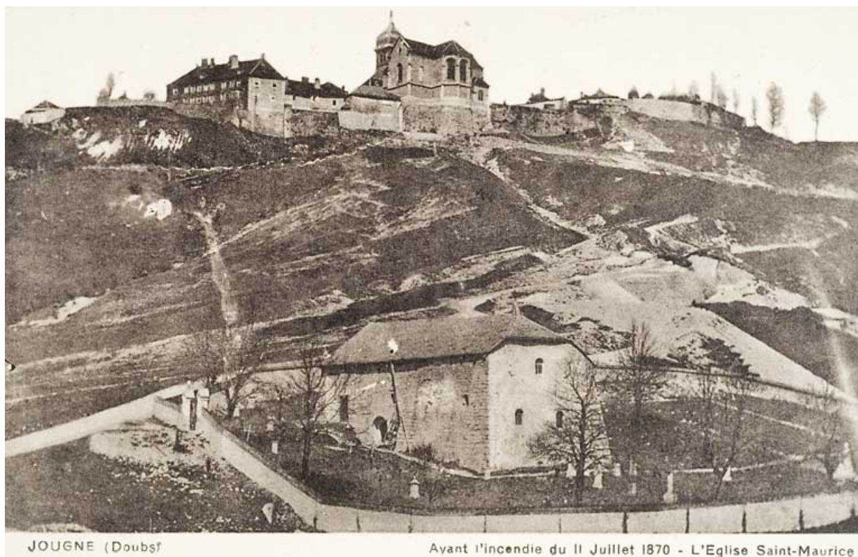
JOUGNE (Doubs). Avant l'incendie du 11 juillet 1870- L'Eglise Saint-Maurice.