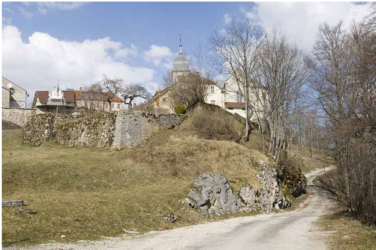
Enceinte sud, vue générale.