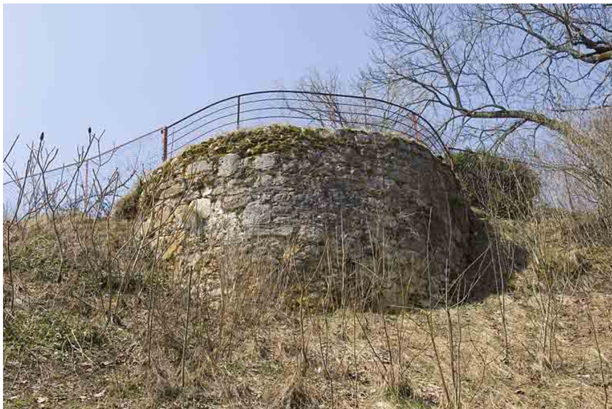
Enceinte médiévale est et tour.