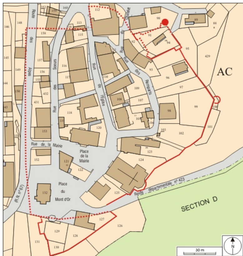
Plan de localisation des fortifications. Extrait du plan cadastral, 2008, section AC, échelle 1:1 000. 25, Jougue