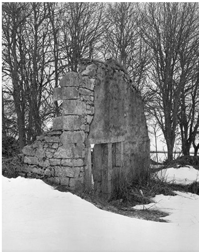
Ruine d'une ferme située au lieudit Les Cerclevaux : la chaîne d'angle. 25, Chaux-Neuve