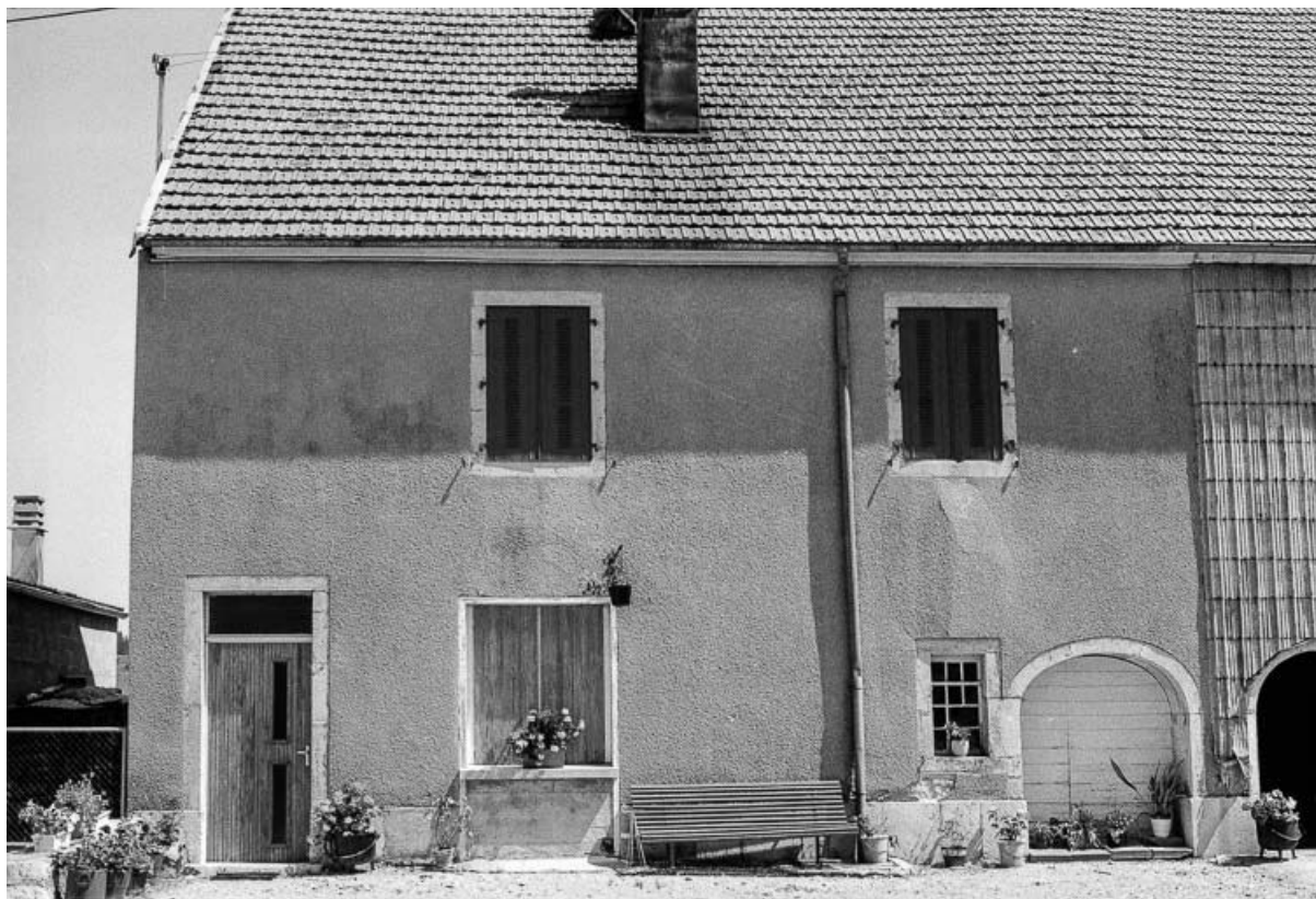
Ferme datée de 1875, située 23 Grande Rue : façade antérieure. 25, Chaux-Neuve