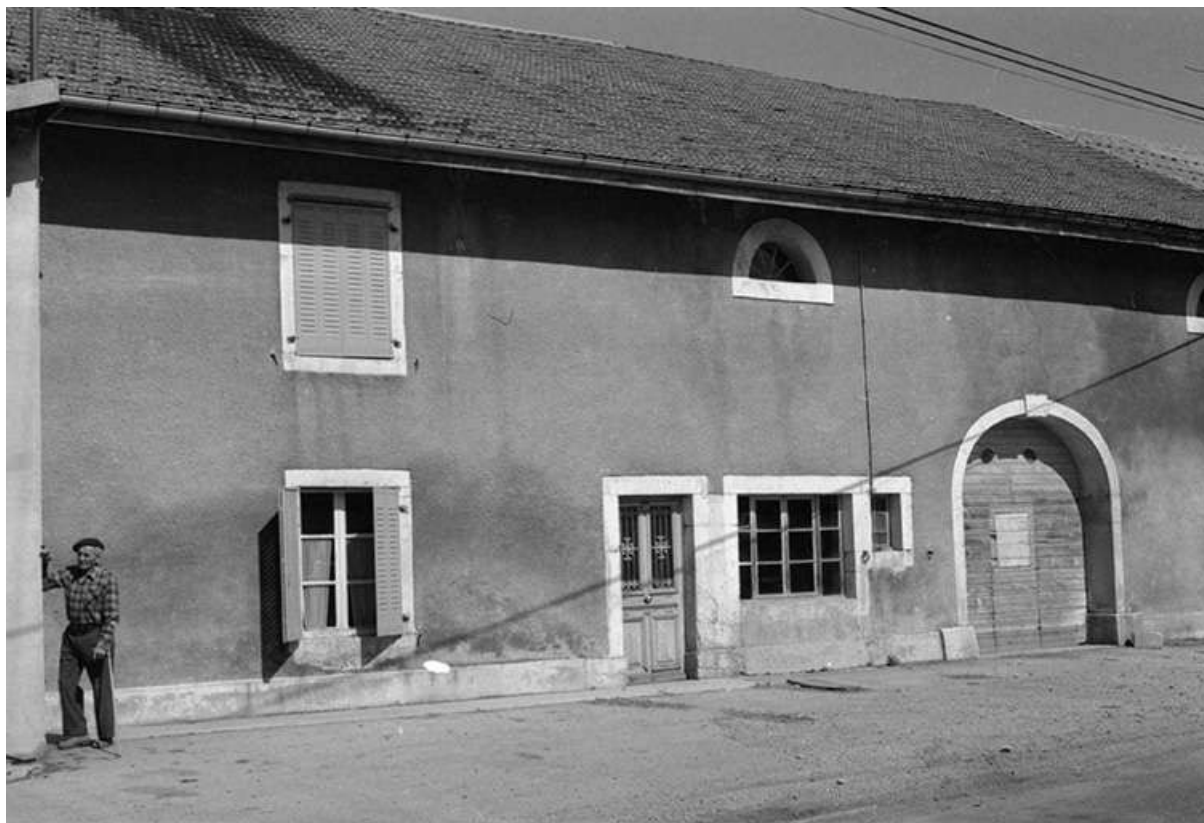
Ferme datée de 1902, située Grande Rue, cadastrée 1967 AB 23 : façade antérieure. 25, Chaux-Neuve