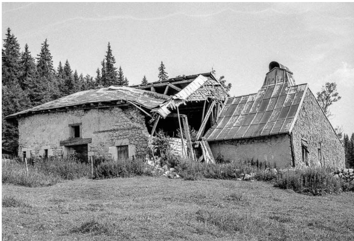
Ferme de 1750, située au lieudit Le Pré Poncet : façade postérieure. 25, Chaux-Neuve