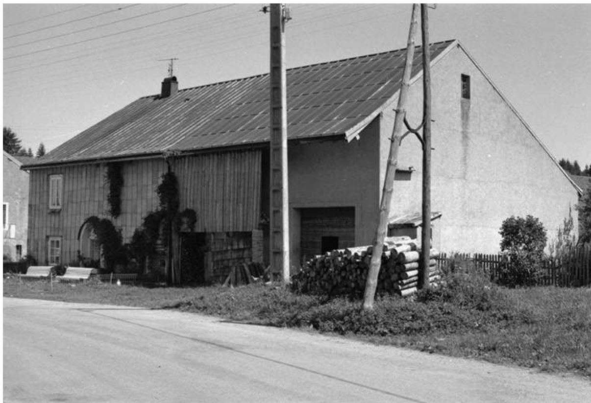
Ferme du 19e siècle, située au lieudit Le Pré Poncet, cadastrée 1967 AB 126 : façade antérieure. 25, Chaux-Neuve