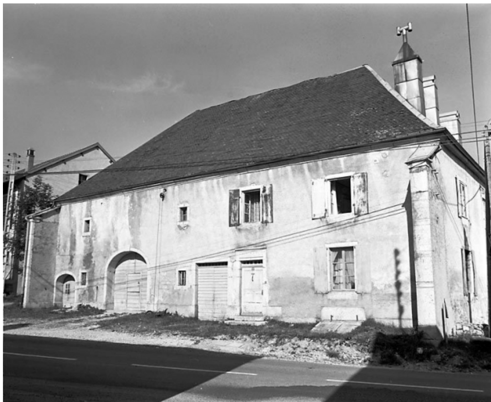
Façade antérieure, de trois quarts droit.

25, Chaux-Neuve, 7 rue de la Grande Fontaine