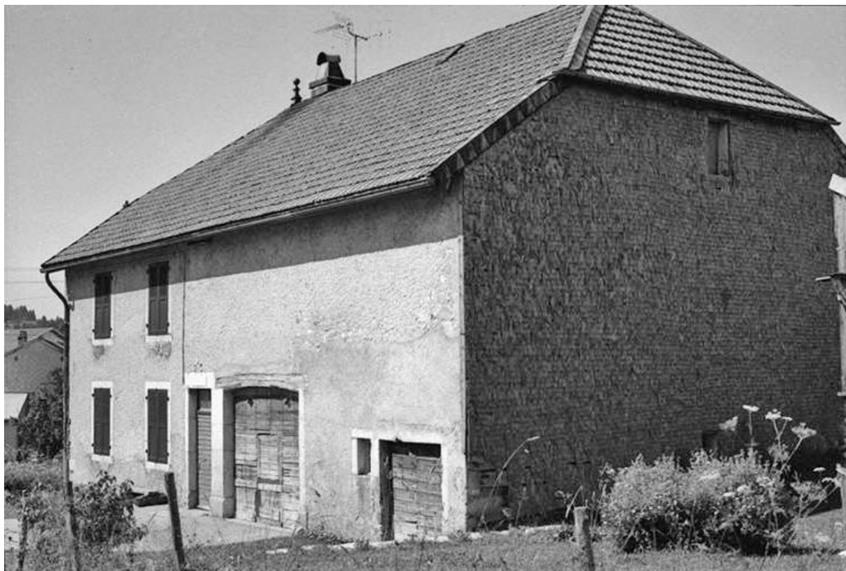
Ferme datée de 1870, située 5 rue de la Grande Fontaine : façade antérieure. 25, Chaux-Neuve