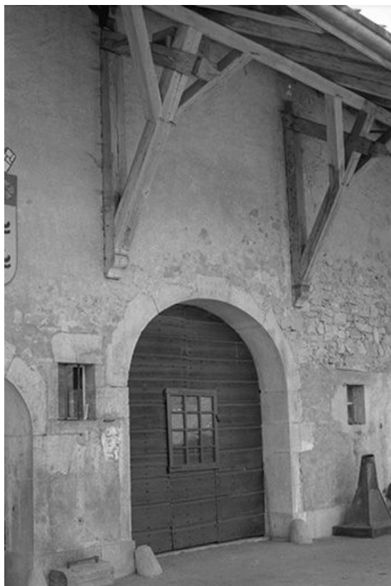
Ferme de 1818, située 11 Grande Rue : porte de grange et débord du toit. 25, Chaux-Neuve