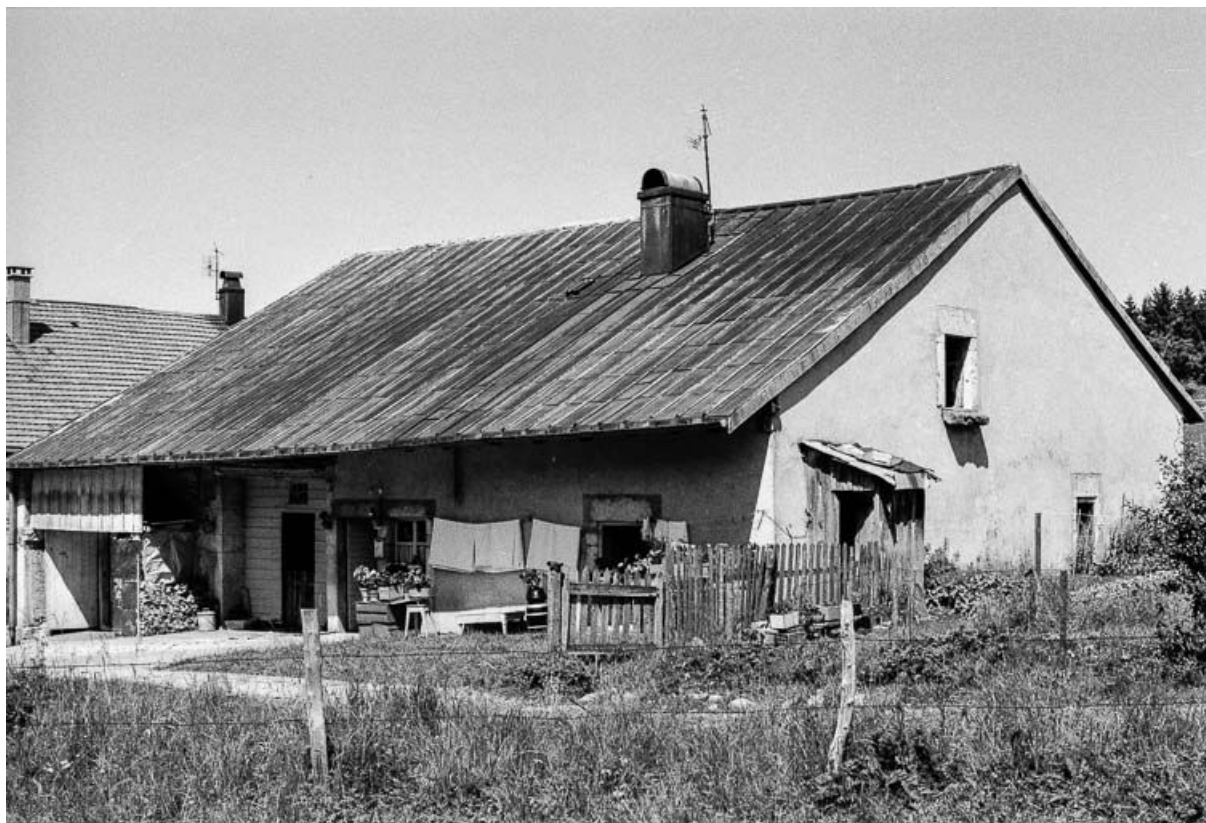
Ferme du 19e siècle, située au lieudit Le Lernier, cadastrée 1967 AB 123 : vue de trois quarts droit. 25, Chaux-Neuve