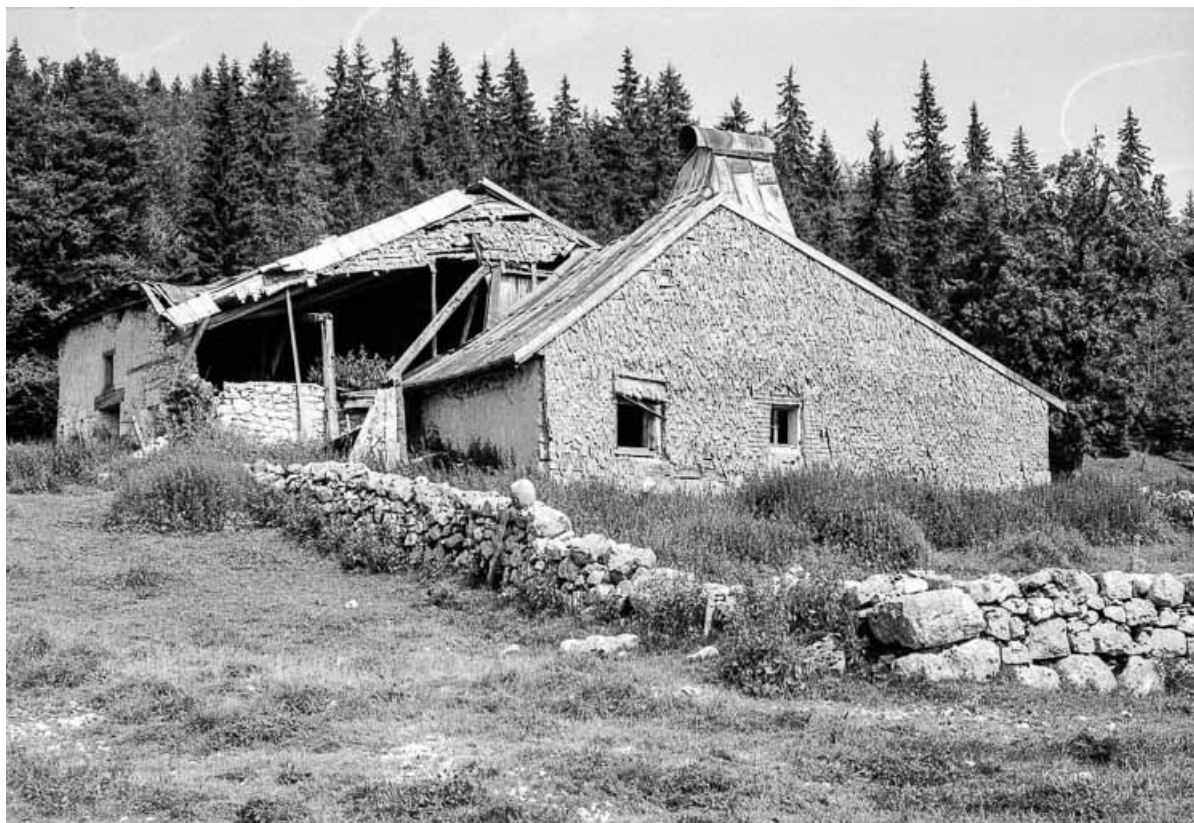
Ferme de 1750, située au lieudit Le Pré Poncet : pignon gauche. 25, Chaux-Neuve