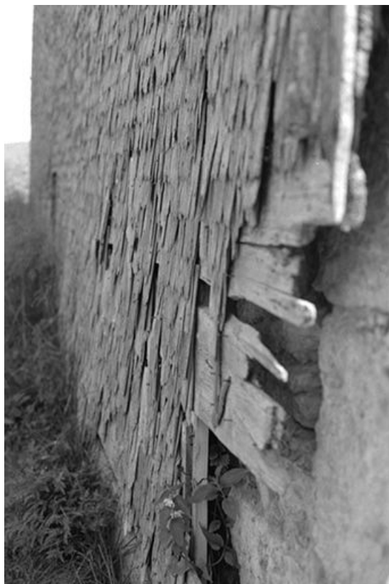
Ferme datée de 1870, située 5 rue de la Grande Fontaine : tavaillons sur le pignon gauche. 25, Chaux-Neuve