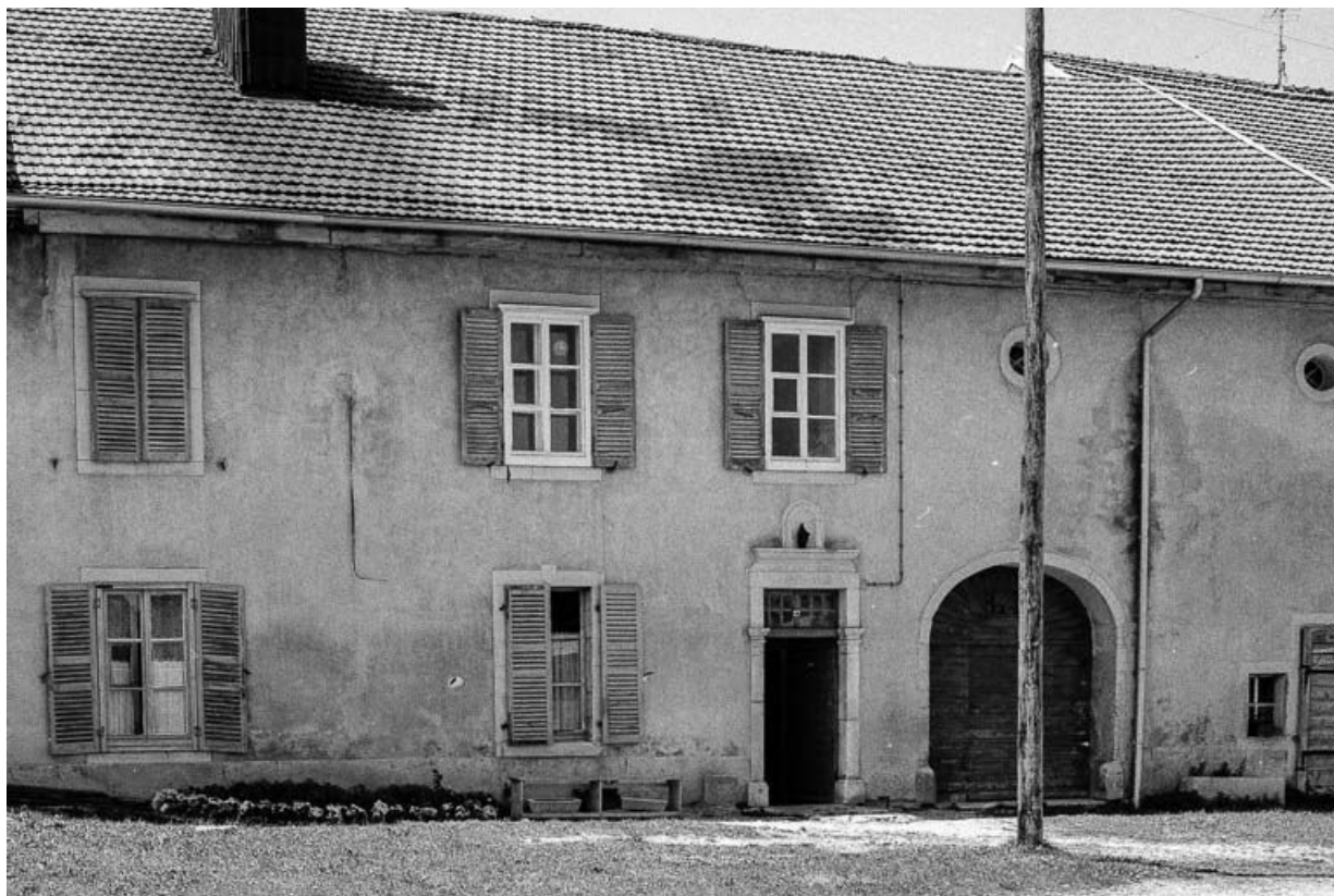
Ferme datée de 1825, située 6 Grande Rue : façade sur rue. 25, Chaux-Neuve