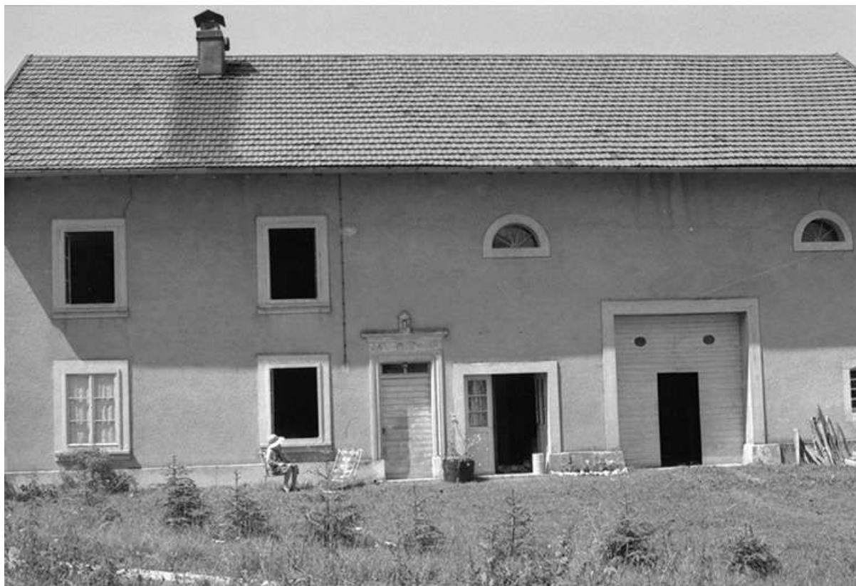
Ferme de 1902, située Grande Rue, cadastrée 1967 AB 132 : façade sur rue. 25, Chaux-Neuve