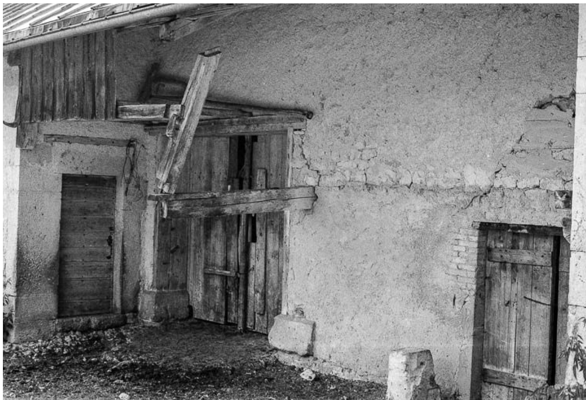
Ferme située au lieudit Le Pré Poncet : le débord du toit. 25, Chaux-Neuve