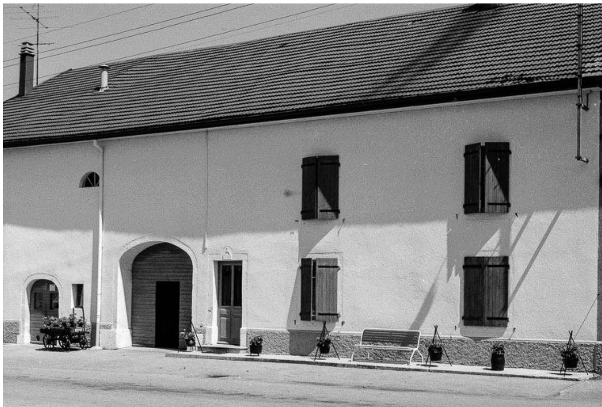
Ferme datée de 1875, située 25 Grande Rue : façade antérieure. 25, Chaux-Neuve