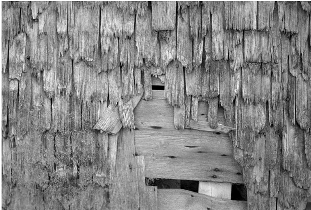
Ferme datée de 1870, située 5 rue de la Grande Fontaine : tavaillons sur le pignon gauche. 25, Chaux-Neuve