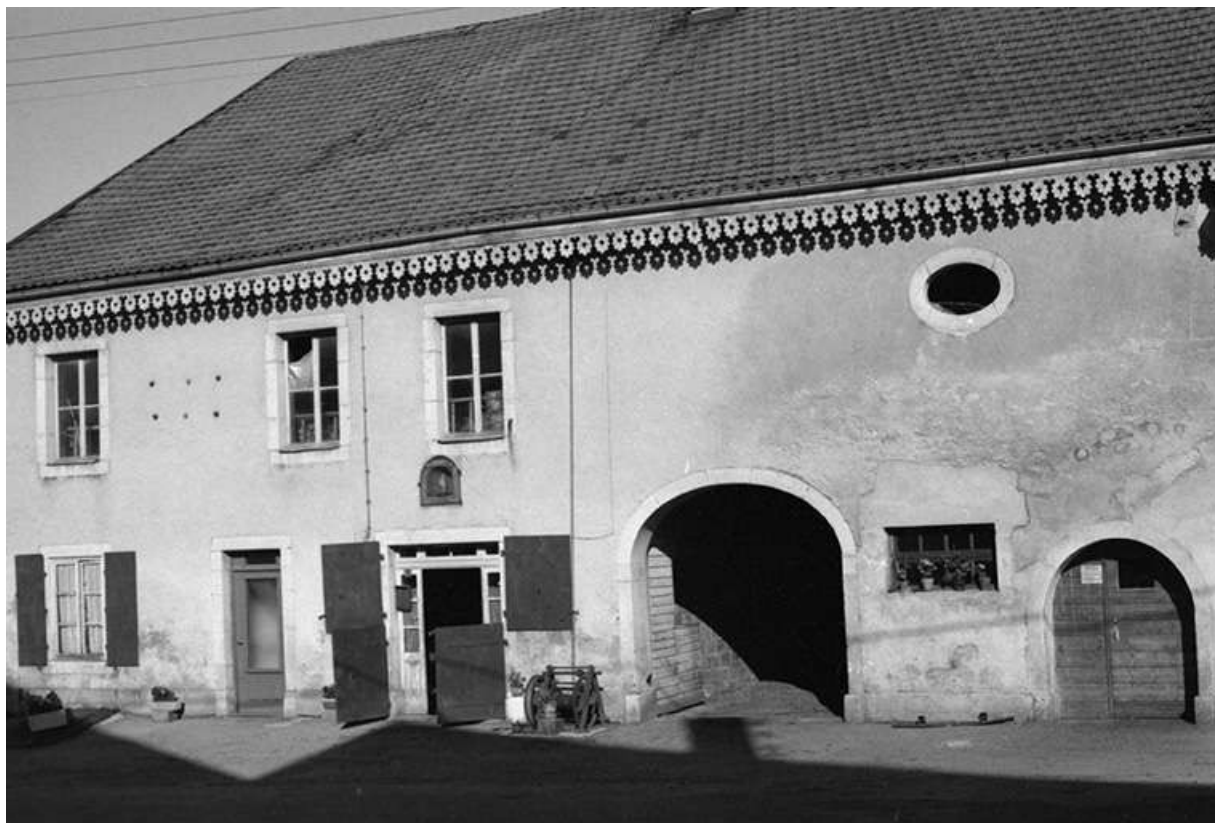
Ferme de 1865, située 12 Grande Rue : façade antérieure. 25, Chaux-Neuve