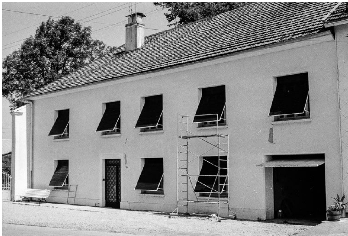
Ferme datée de 1856, située 27 Grande rue : façade antérieure. 25, Chaux-Neuve