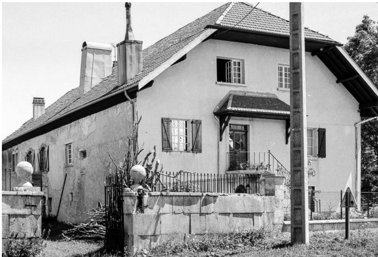
Ferme datée de 182?, située 5 Grande Rue : façade antérieure. 25, Chaux-Neuve