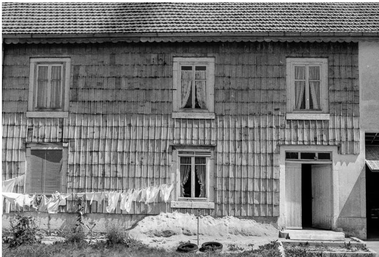
Ferme datée de 1875, située 11 Grande Rue : façade antérieure. 25, Chaux-Neuve