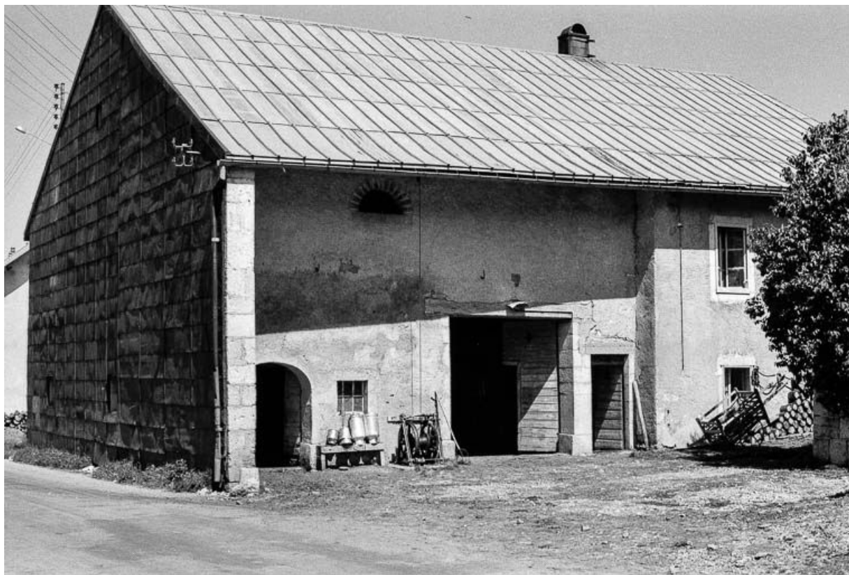
Façade antérieure, grange et écurie. 25, Chaux-Neuve Grande Rue