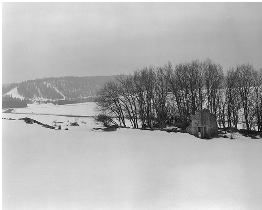
Ruine d'une ferme située au lieudit Les Cerclevaux : vue d'ensemble. 25, Chaux-Neuve