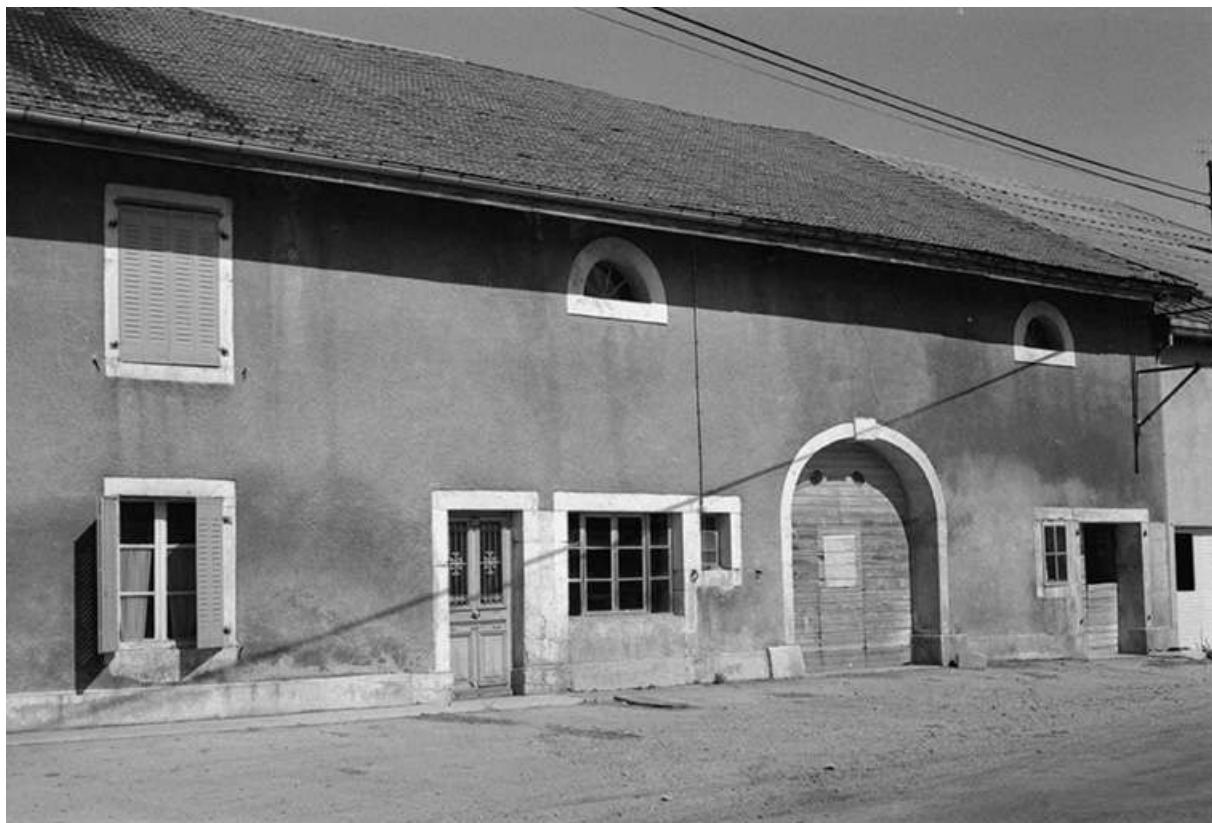
Ferme datée de 1902, située Grande Rue, cadastrée 1967 AB 23 : façade antérieure. 25, Chaux-Neuve