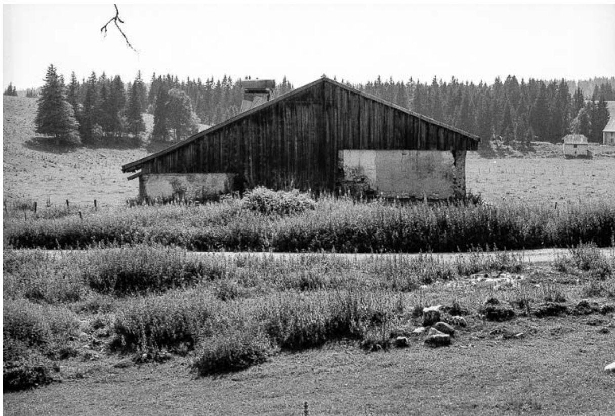
Ferme de 1750, située au lieudit Le Pré Poncet : pignon droit. 25, Chaux-Neuve