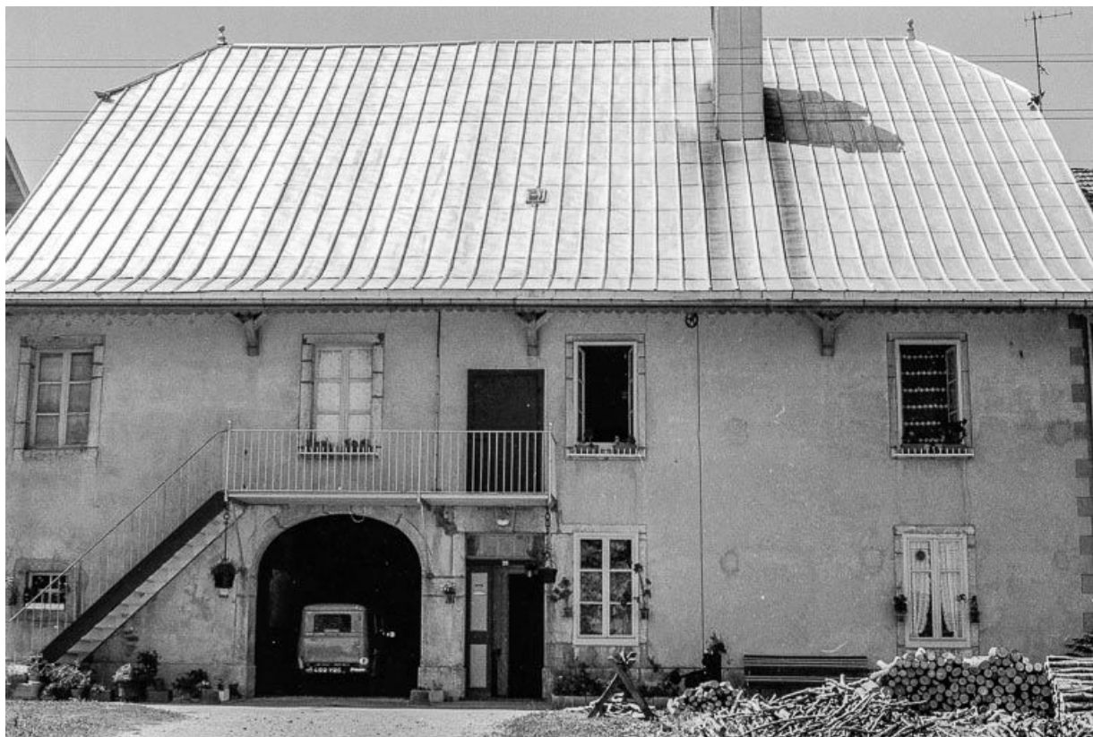
Ferme datée de 1822, située 8 Grande Rue : façade antérieure. 25, Chaux-Neuve