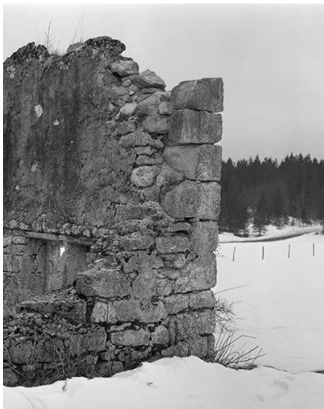
Ruine d'une ferme située au lieudit Les Cerclevaux : la chaîne d'angle et le mur. 25, Chaux-Neuve