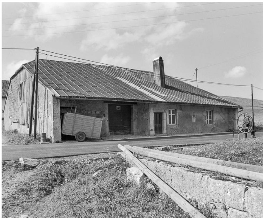
Façades antérieure et latérale gauche. 25, Chaux-Neuve