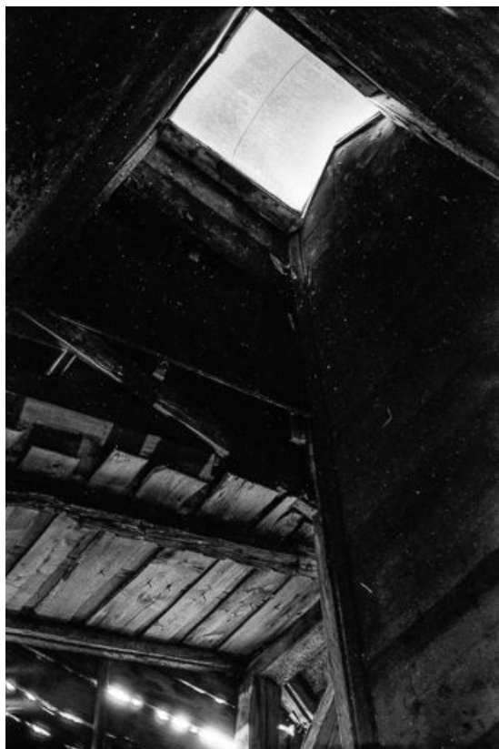
Ferme de 1750, située au lieudit Le Pré Poncez : "tué" vu de l'intérieur. 25, Chaux-Neuve