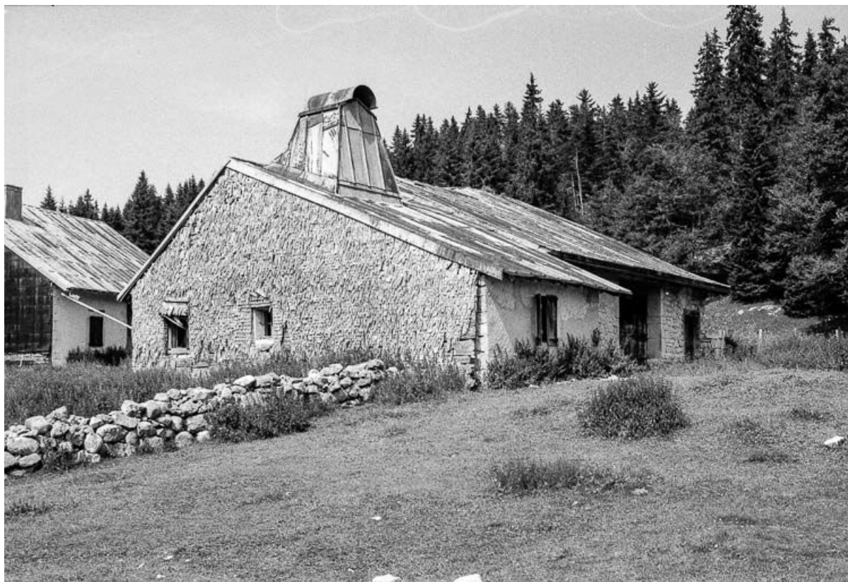
Ferme de 1750, située au lieudit Le Pré Poncet : vue de trois quarts. 25, Chaux-Neuve