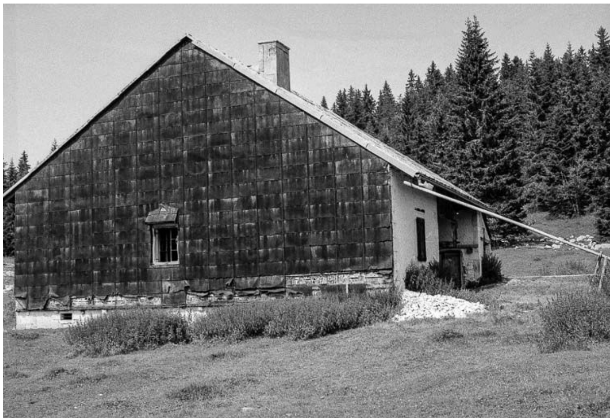
Ferme située au lieudit Le Pré Poncet : vue de trois quarts gauche. 25, Chaux-Neuve