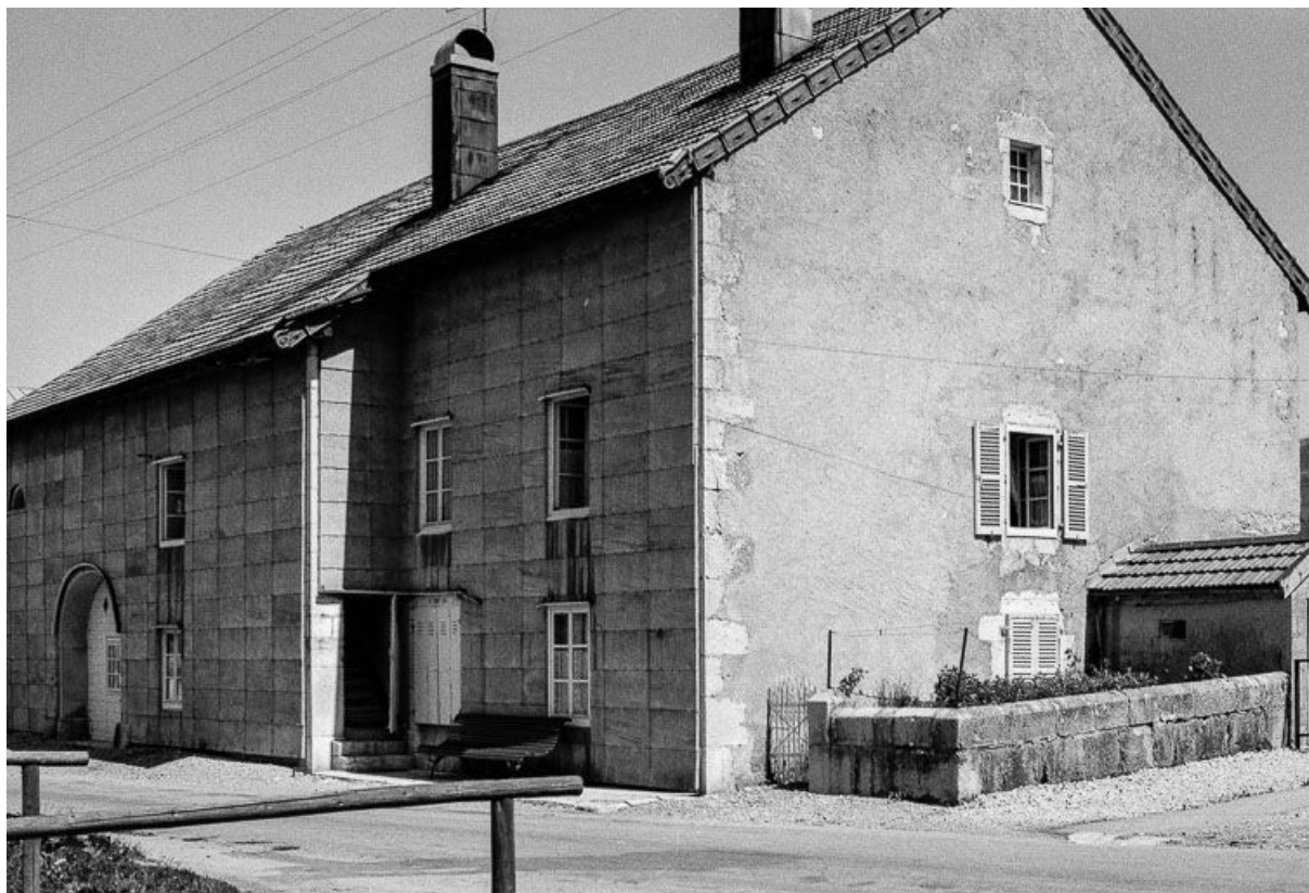
Ferme située 35 Grande Rue : façade antérieure et pignon droit. 25, Chaux-Neuve