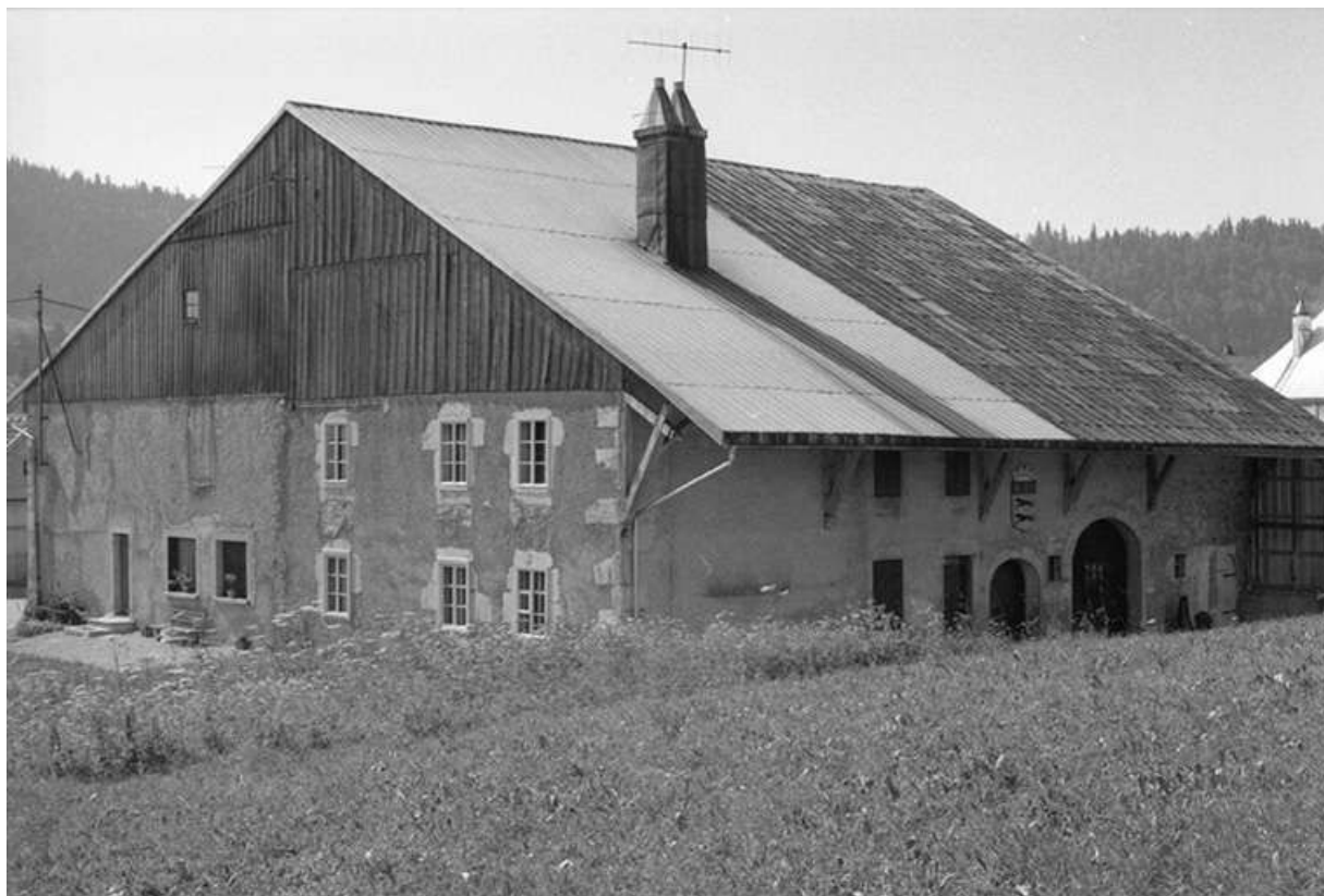
Ferme de 1818, située 11 Grande Rue : façades postérieure et latérale droite. 25, Chaux-Neuve