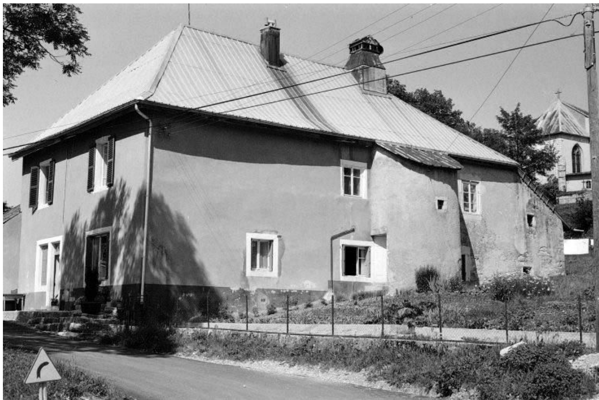
Façades antérieure et latérale droite. 25, Chaux-Neuve rue de l' Eglise