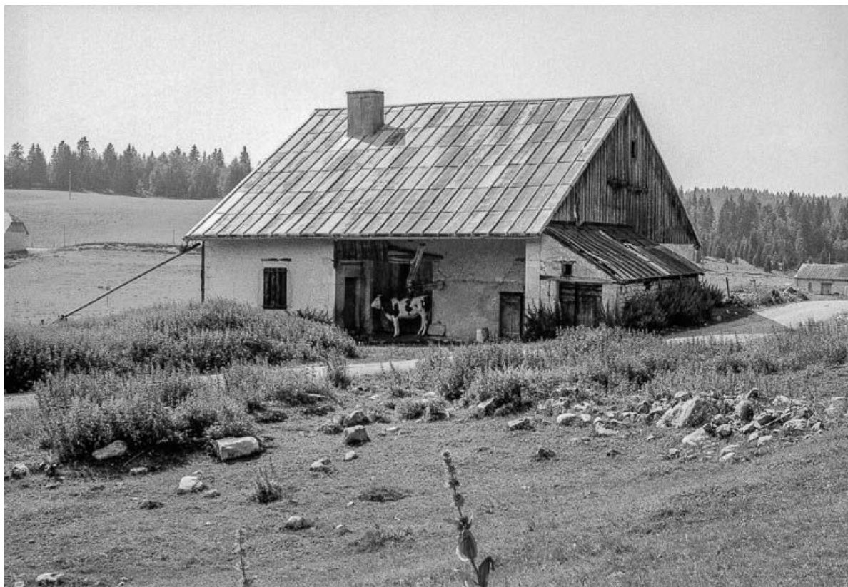
Ferme située au lieudit Le Pré Poncet : Vue d'ensemble dans le site. 25, Chaux-Neuve