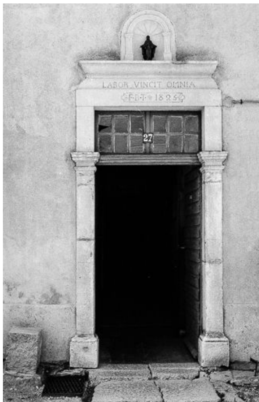
Ferme datée de 1825, située 6 Grande Rue : porte d'entrée à linteau daté 1825. 25, Chaux-Neuve