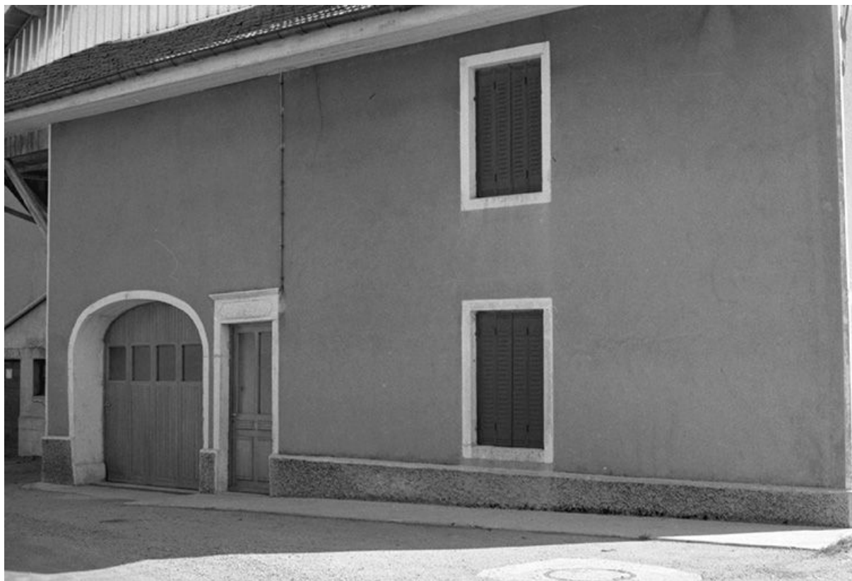
Ferme de 1809, cadastrée 1967 AB 28 : façade antérieure. 25, Chaux-Neuve