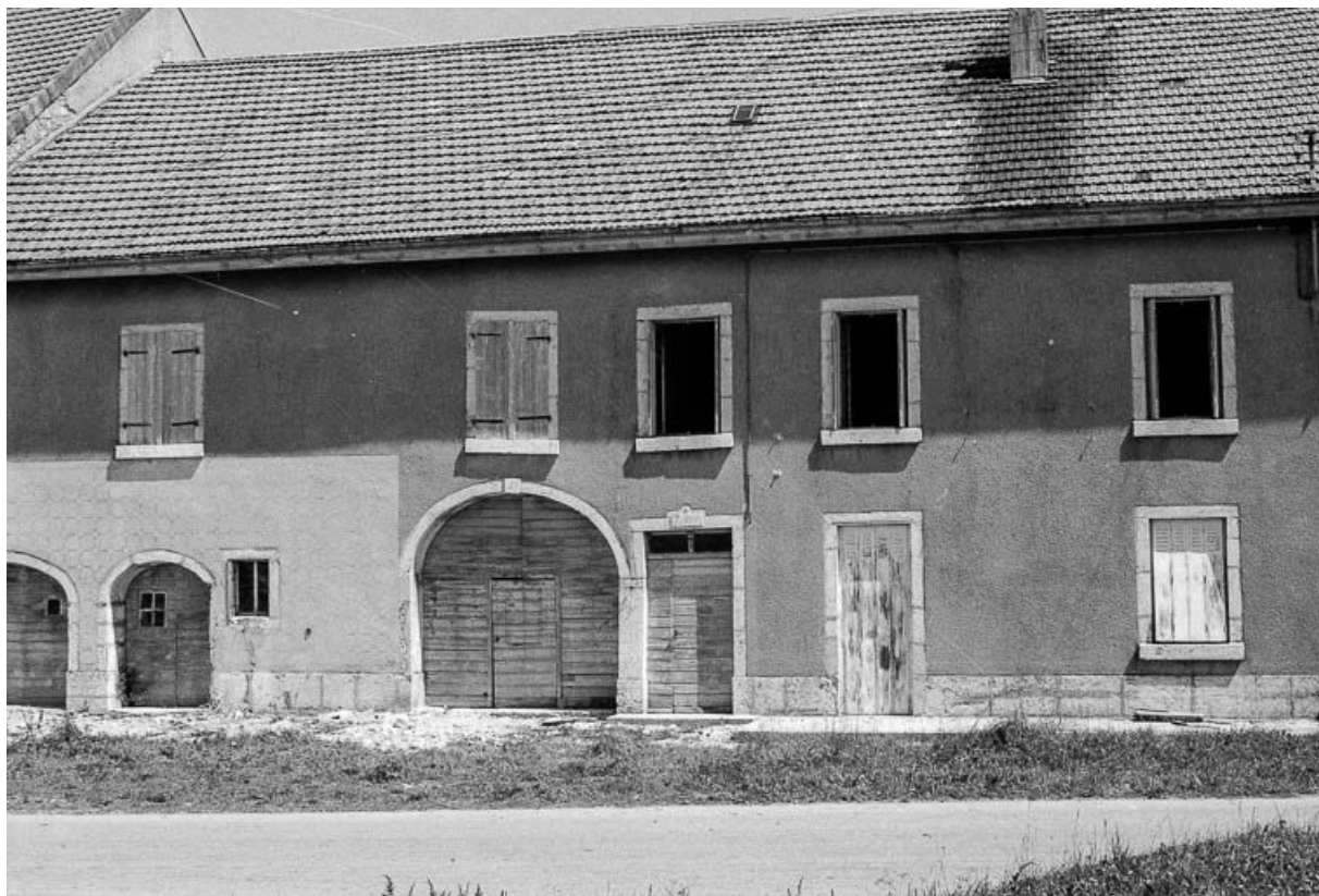
Ferme datée de 1875, située 9 Grande Rue : façade antérieure. 25, Chaux-Neuve