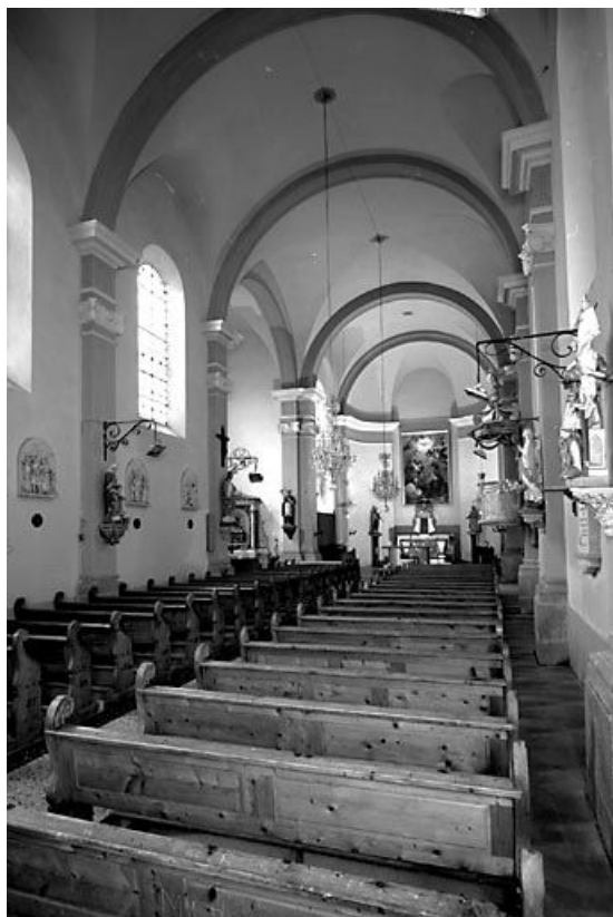
Vue de la nef et du chœur depuis l'entrée. 25, Châtelblanc