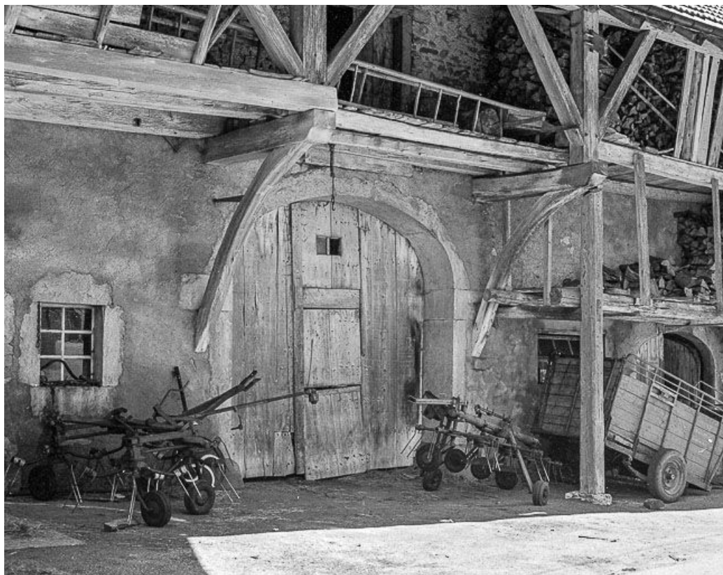
Détail du goutterot sur rue, de trois quarts.