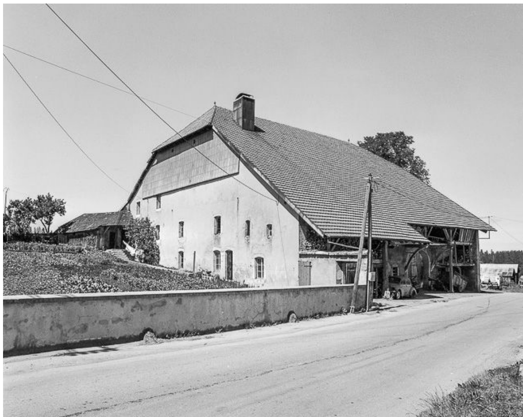
Vue d'ensemble, de trois quarts.