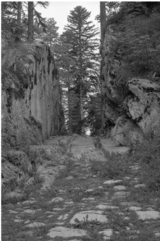
Passage taillé dans la roche pour la voie à ornieres.

25, Villers-sous-Chalamont, lieudit : Chalamont