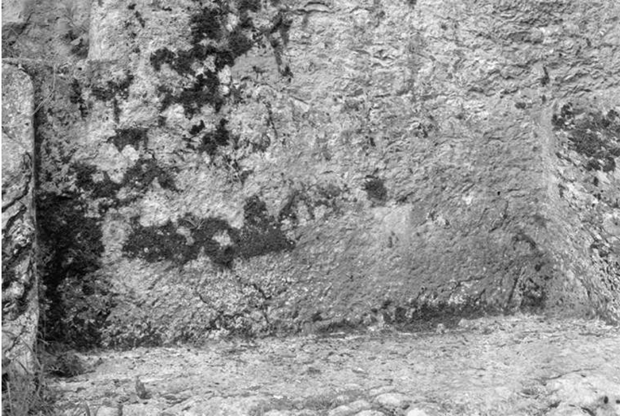
Logement de la porte qui fermait le passage taillé dans la roche.

25, Villers-sous-Chalamont, lieudit : Chalamont