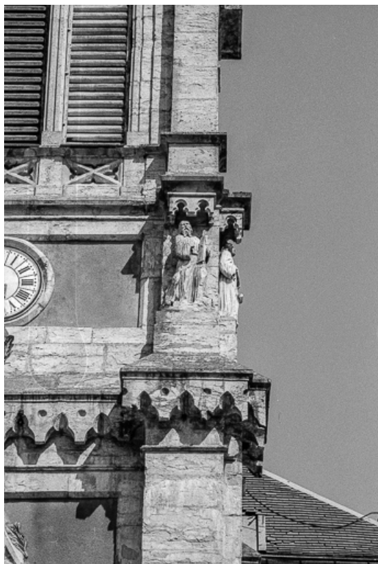
Détail de la tour-clocher : saint Luc.

25, Villers-sous-Chalamont place de l'Église