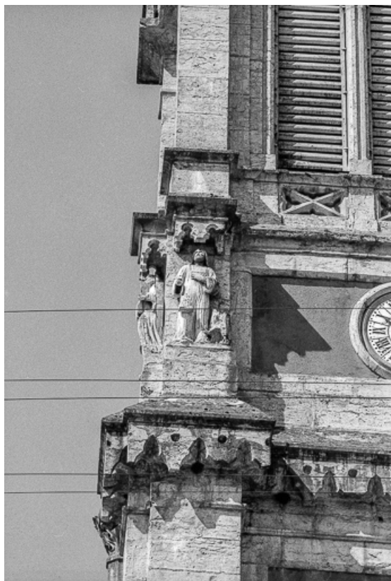
Détail de la tour-clocher : saint Jean.

25, Villers-sous-Chalamont place de l'Église