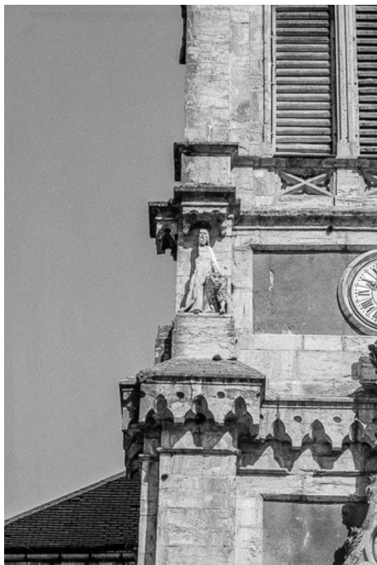
Détail de la tour-clocher : saint Marc.

25, Villers-sous-Chalamont place de l' Église