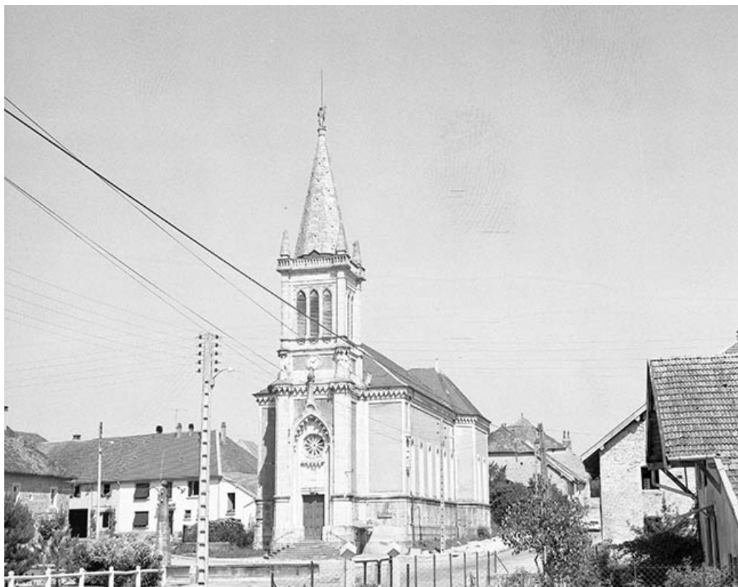
Extérieur : face antérieure.

25, Villers-sous-Chalamont place de l' Église