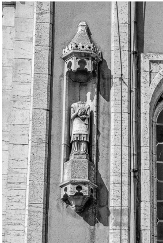
Détail de la tour-clocher : saint Ferréol.

25, Villers-sous-Chalamont place de l' Église