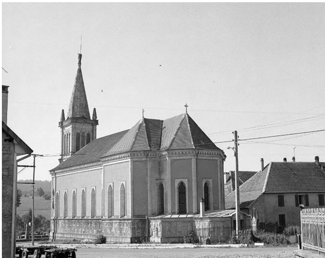
Chevet et face latérale droite.

25, Villers-sous-Chalamont place de l' Église