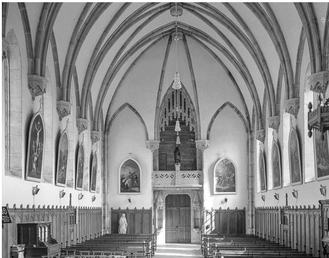
Intérieur : nef vue depuis le chœur.

25, Villers-sous-Chalamont place de l'Église