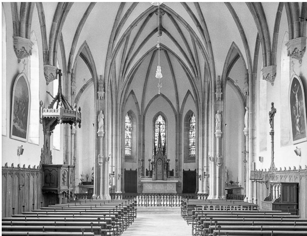
La nef et le choeur vus depuis l'entrée.

25, Villers-sous-Chalamont place de l'Église