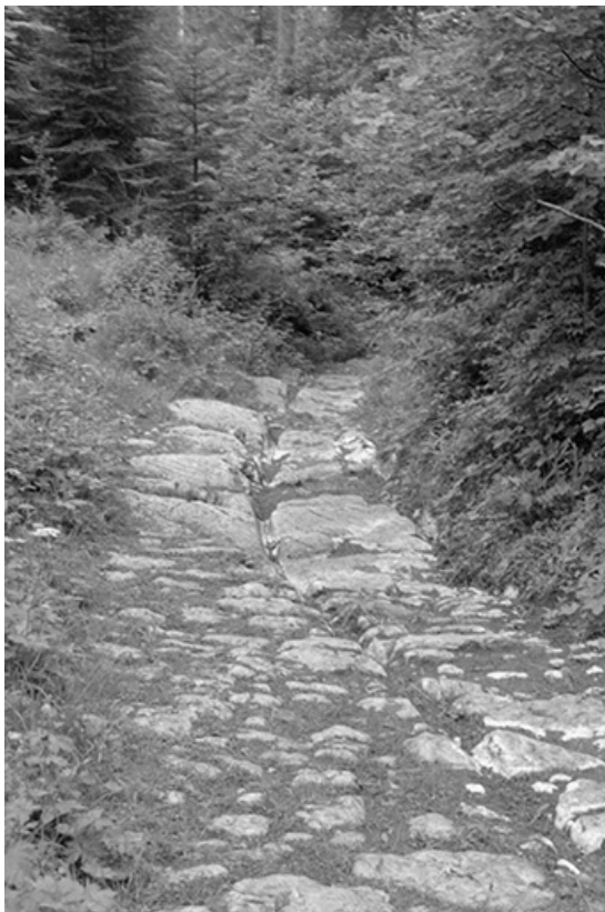
Montée vers le passage : sol stabilisé en pierres rondes.

25, Villers-sous-Chalamont, lieudit : Chalamont